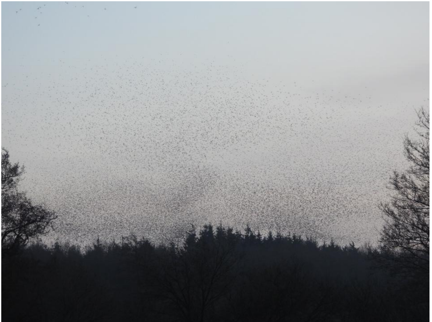
Kvækerfinker, Årtoft Plantage, januar 2020.

De store stimer jeg så de tidligere dage, gik typisk meget lavt og til tider gemte de sig bag træerne, men i dag kom de frit frem og meget højere op på himmelen. Også selve flokken ved den sydlige del blev særdeles synlig i den klare blå-rødlige solnedgangshimmel. De samme uafbrudte stimer kom i kæmpemængder og det gav et storartet syn, hvor himmelen bare var fyldt til randen af fugle. Flokken over selve overnatningsstedet var mega mega enorm. Den var meget bred, høj og dyb og tilmed meget tæt og til tider næsten sort. Især når rovfuglene angreb finkerne. Det skabte forrygende fantastiske formationer. Selv ikke sort sol med stærene kunne slå dette. Indtrækket af fugle sluttede først efter 45 utrolige minutter. En kæmpeoplevelse var det og absolut en oplevelse der skulle opsøges igen. Om det var den vejrtype, der gjorde at det blev så intens en oplevelse, er svært at sige. Det var som om, de var trætte af hele tiden af at flyve lavt. Det var som om, de bare skulle op og rigtigt få luft under vingerne til stor fornøjelse for mig.