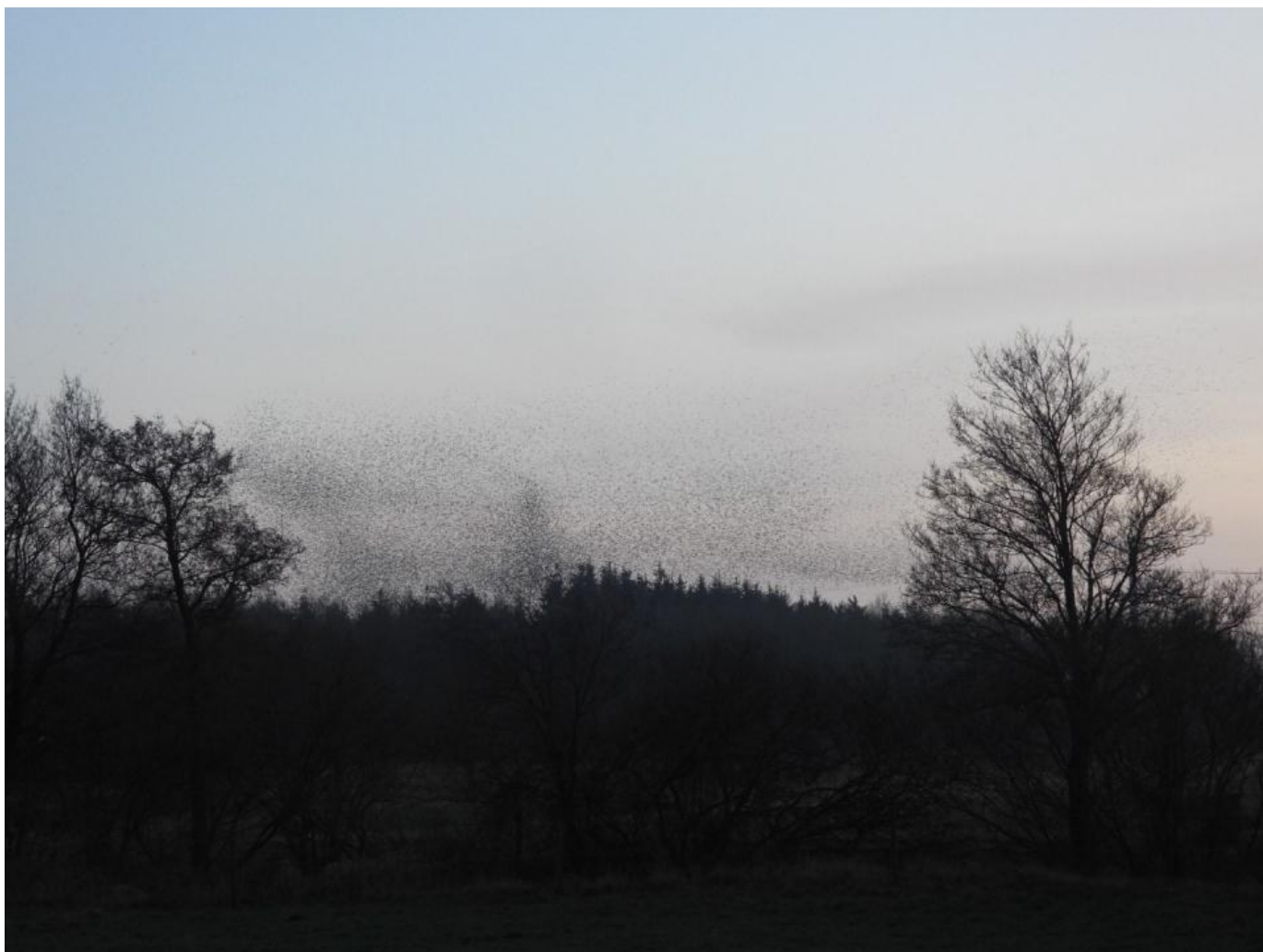
Kvækerfinker, Årtoft Plantage, Sønderjylland, januar 2020.

Der kan gå år imellem så store forekomster af overnattende kvækerfinker i Danmark og fænomenet er endda mere sjældent forekommende i Sønderjylland. Jeg vidste godt, at der var store mængder kvækerfinker i landet eller der havde været sidste år sent på efteråret. Og her sås de største mængder i Nordsjælland og i den sydlige del af Sverige. I Sverige har mange oplevet en kæmpe forekomst med omkring en million fugle eller mere. Jeg havde ikke i min vildeste fantasi forestillet mig at se noget lignende her i Sønderjylland. Derfor skulle vores kvækerfinke overnatning undersøges noget nærmere.