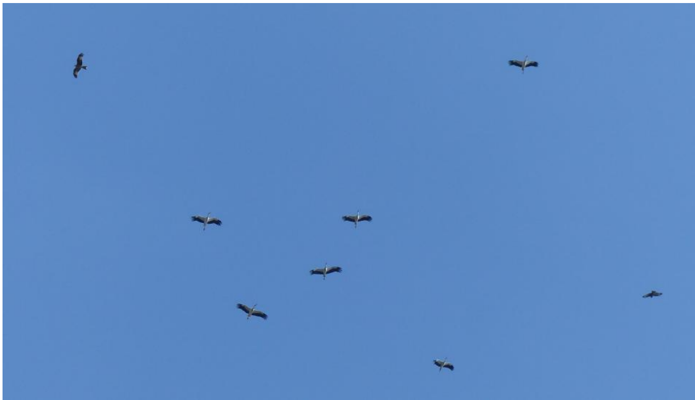
Hvide storke (samt rød glente og musvåge) over Flagbakken den 8. april 2020.