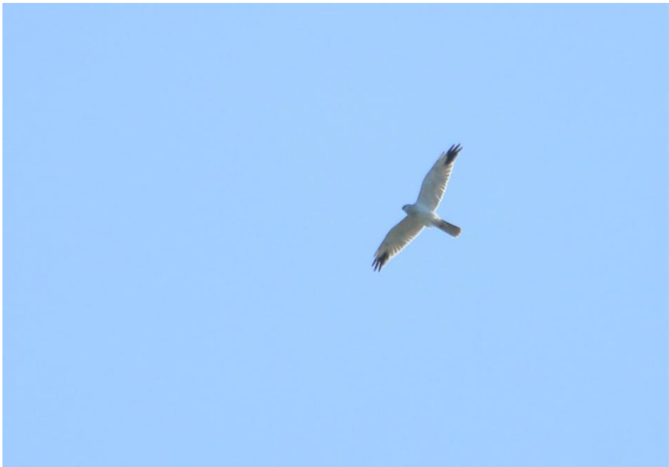
Steppehøg, 3K+ han, Kikhavn den 8. april 2020.

Den 9. april skete der et ganske markant temperaturfald og vinden skiftede til nordvest. Netop vejr på bagsiden af et varmfremstød, hvor temperaturen daler og vinden skifter, kan være mindst lige så spændende som ændringen fra koldt til varmt vejr.