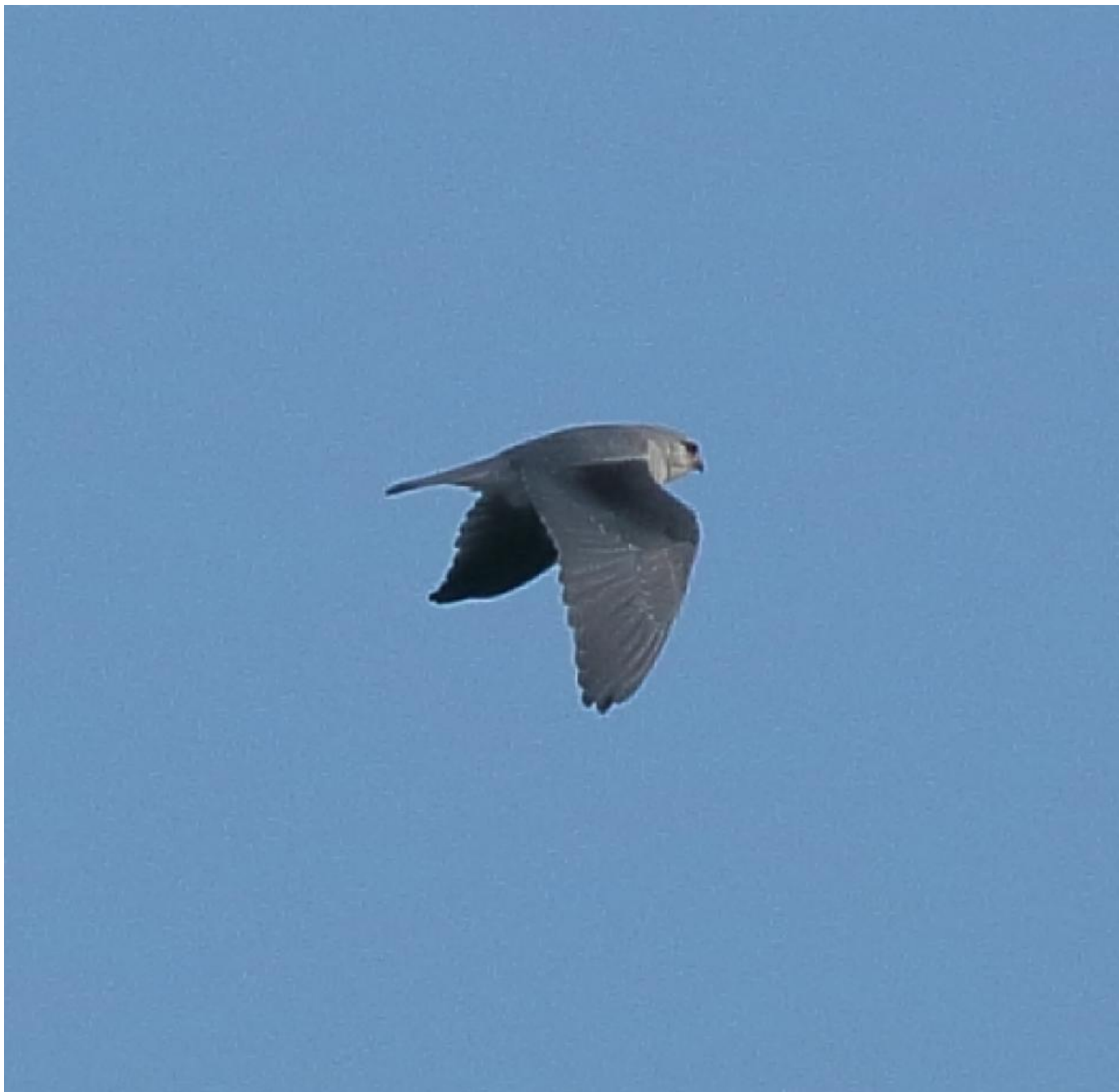
Blå glente, 2K, Busemarke Mose, Møn den 14. april 2020. Bemærk de hvide spidser på de store dækfjer og hånddækfjer der godtgør aldersbestemmelsen til 2K.

Tak til alle fotografer for at lægge billeder på DOFbasen i forbindelse med jeres observationer og som derfor gør det meget let at illustrere artiklerne på Pandion. Også tak til jer andre som velvilligt har bidraget med billeder ved direkte henvendelse.