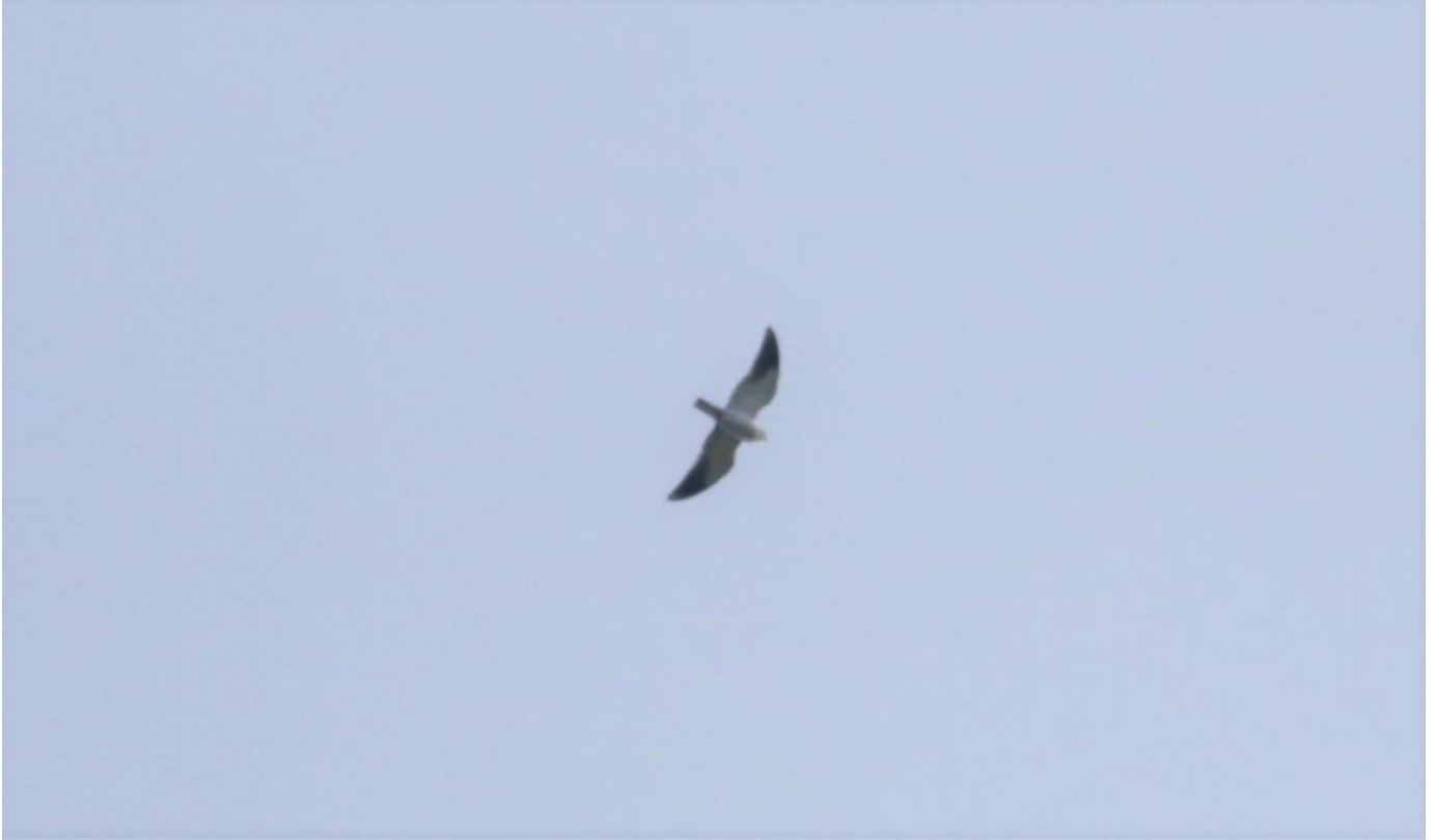
Blå glente, Spodsbjerg, Hundested den 12. april 2020.

Et nyt markant varmfremstød skete den 12. april, og det blev i den grad en legendarisk dag. Vinden var skiftet fra syd dagen inden til sydvest og senere vest. Således virkede det ikke synderligt oplagt at Nordsjælland skule slå til. Det var imidlertid Spodsbjerg ved Hundested, der i den grad slog hårdt da de meldte årets anden blå glente, der i øvrigt kom i kølvandet på en steppehøg! Kort tid efter meldte Hellebæk om dagens anden blå glente (!) og knap et kvarter efter denne kom dagens tredje melding på blå glente fra Jættebrink på Møn!! Fra denne dag var der også meldinger om bl.a. 2 sorte storke, 33 hvide storke, 2 steppehøge og 3 vendehalse.