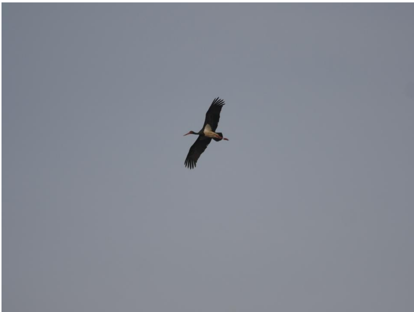
Sort Stork, Skaven ved for Gludsted Plantage den 12. april 2020.