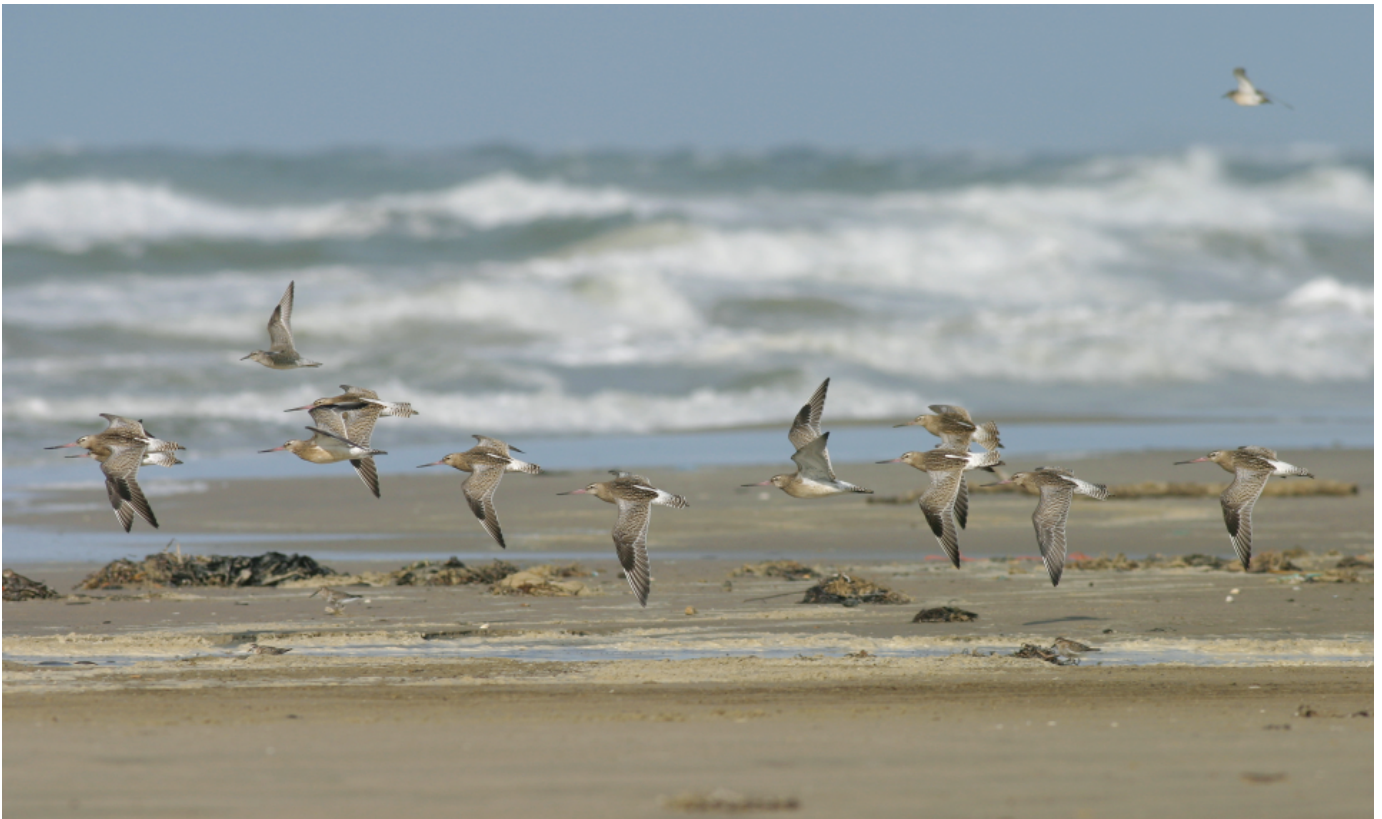
Lille kobbersneppe, 3. september 2006, Rødhus Strand. En dag med godt træk af vadefugle kom denne flok slingrende fra side til side på grund af kraftig vind. Og til sidst kom kobbersnepperne tæt på i perfekt lys.

Men ved aldrig med den strækning. Der er fugletomme perioder, og så er der summende, livlige dage, da alt kan ske. Hvis en tidlig nordvestenhylar har kastet godt med opskyl ind på stranden i form af tang, alger, snegle og alt godt fra havet, hvorpå vinden løjer af, så er det ofte godt. Det er med fuglefotografering på Vestkysten som med rav. Det er vejr, vind og havstrømme, der serverer mulighederne for at få gevinst, siger Søren Kristoffersen, der er en af de danske fuglefotografer, som for alvor har demonstreret, at fotos af vadefugle skal hentes hjem for enden af en kravlende pürch, hvor man er i øjenhøjde med sit motiv.