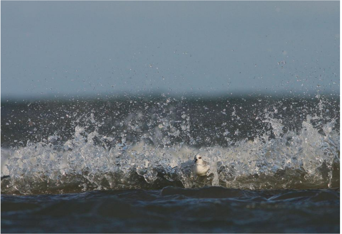
Thorshane, 29. oktober 2008, Skagen. Hvor havene mødes omkring Grenen, blev denne thorshane fanget af fotografen, netop da bølgerne slog sammen. Vel i land begyndte den tillidsfulde vadefugl at jage insekter i strandkanten.