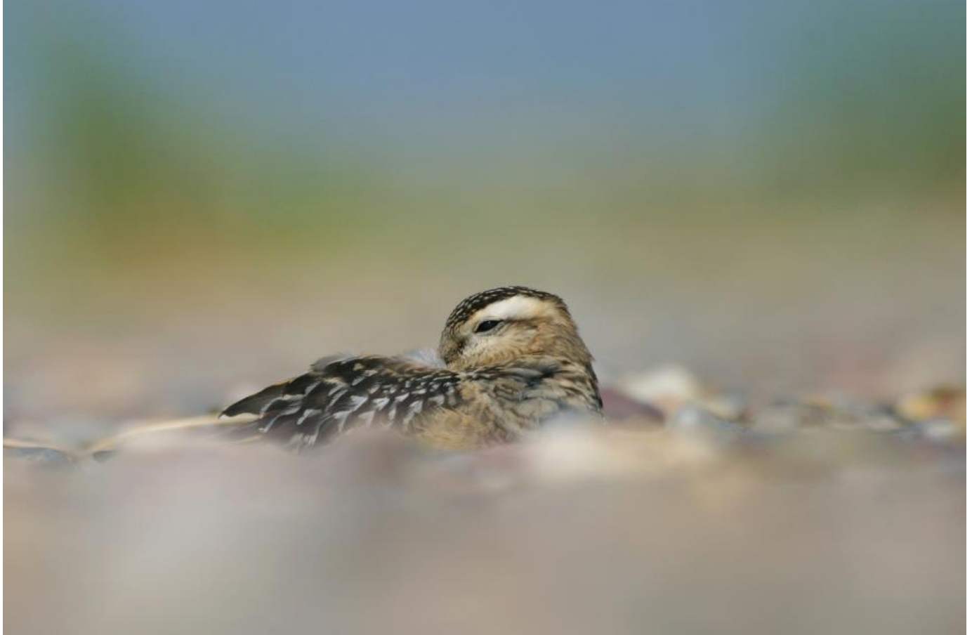
Pomeransfugl, 19. august 2007, Skagen. Efter et langt træk fra de nordskandinaviske ynglepladser rastede denne unge pomeransfugl halvt skjult i en fordybning i sandet på Grenen.

Den 39-årige nordjyske mesterfotograf er født i Brovst, ikke langt fra den klassiske fuglelokalitet Ulvedybet, men han er opvokset i Aalborg, hvor han i det daglige arbejder som lærer på en skole for elever med autisme. Ganske vist er han bybo, men der er kun en times transport fra hans adresse i Nørresundby til nogle af Danmarks absolut bedste terræner for fugle og fotografer, nemlig Vejlerne, Hanstholm, Bulbjerg, Vildmoserne og toppen af det hele, Skagen.