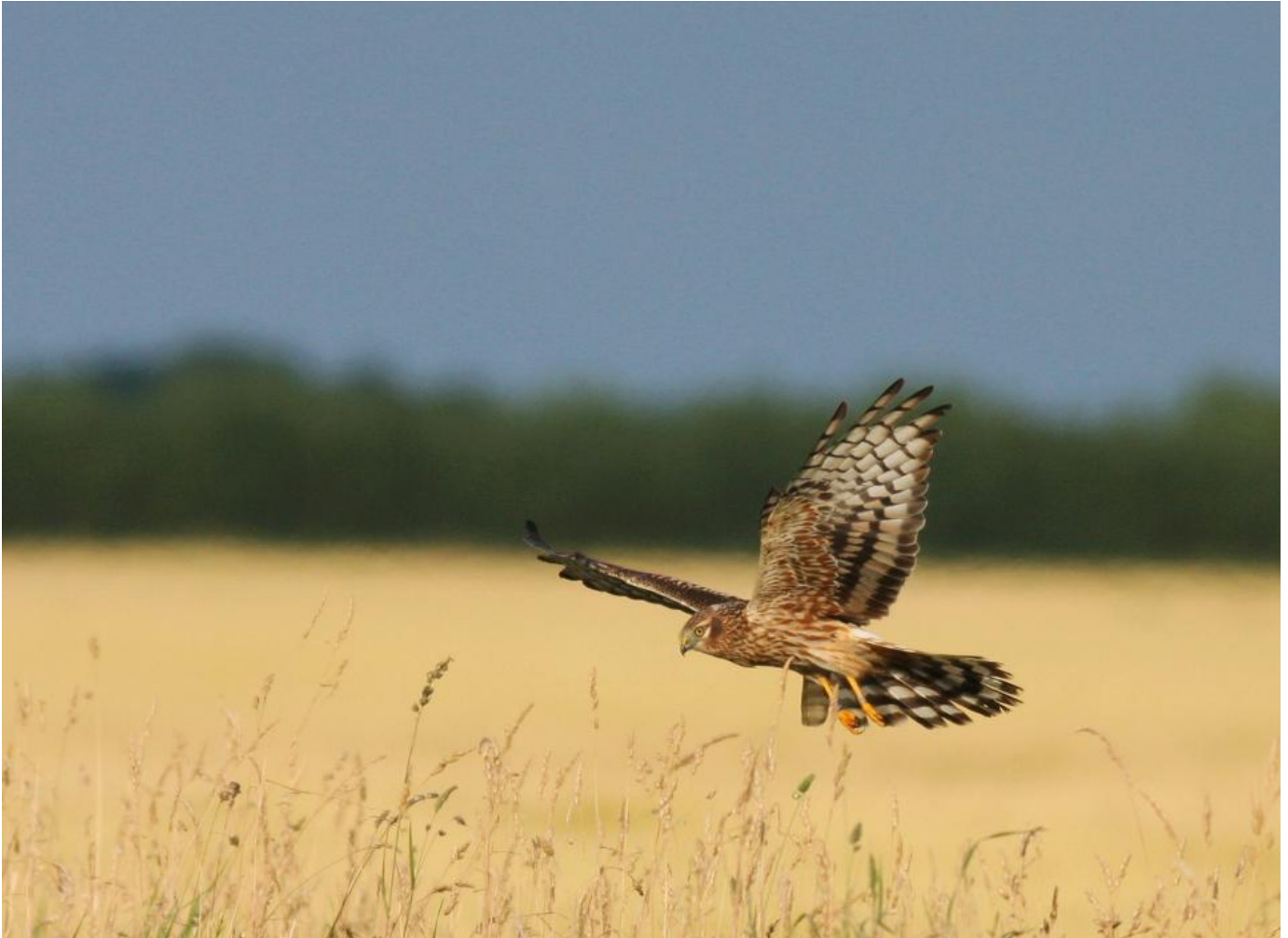
Hedehøg, 18. juli 2008, Øland. Danmarks nordligst ynglende hedehøge havde deres rede nær en landevej. Det benyttede Søren Kristoffersen sig af, da han i flere uger jævnligt fulgte de elegante rovfugle på tæt hold.

I sommeren 2008 brugte jeg mere end 40 timer i selskab med et nordjysk par hedehøge. Her var det afgørende at studere fuglenes vaner og rytme i løbet af dagen. Jeg fik placeret min bil, der blev brugt som fotoskjul, mest hensigtsmæssigt i forhold til fotos af rovfuglenes adfærd, og så var det bare om at vente på de rette øjeblikke. Alle fugle har vaner, og kan man afkode dem, har man som fotograf et pænt forspring, siger Søren Kristoffersen, der har bevægelighed, lethed og listesko blandt sine fotografiske kodeord.