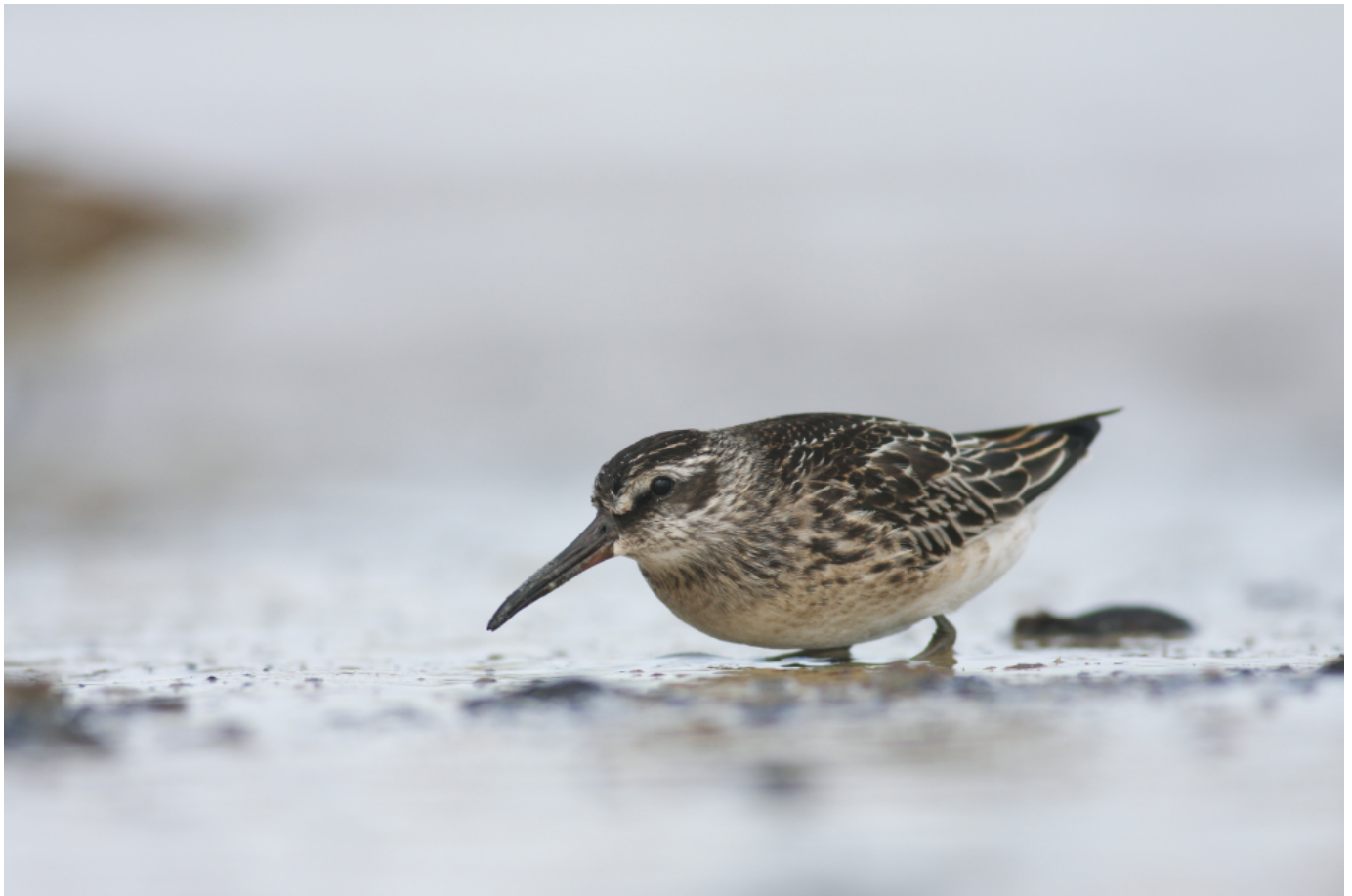
Kærløber, 24. august 2010, Rødhus Strand. Da fotografen lå på maven og lignede en sæl, var vadefuglen helt tryk ved ham. Til sidst var den inde på en halv meters afstand.

Han har også kravlet ud mod Grenen. Det var en forårsdag på morgentræk ved Skagen Nordstrand.