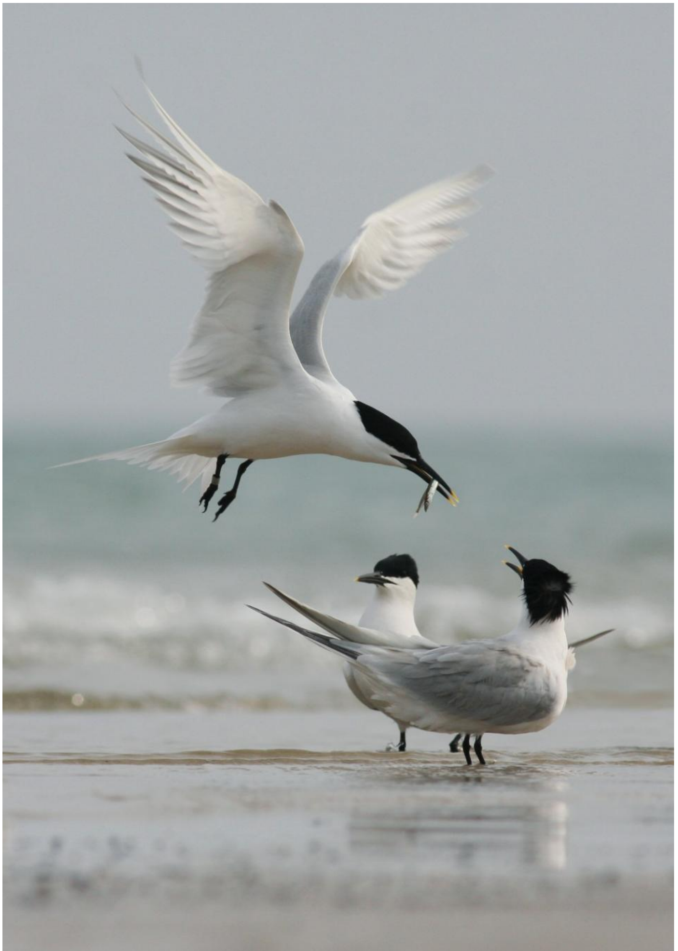
Splitternes, 25. april 2010, Skagen Nordstrand. Tidligt på foråret er splitternerne optaget af at kurtisere. Det kan man som fotograf udnytte ved at kravle tæt på fuglene. Det er sikkert splitternes fra Kattegats største koloni på Hirsholmene, som denne aprildag stod på Nordstranden og lod sig fotografere.