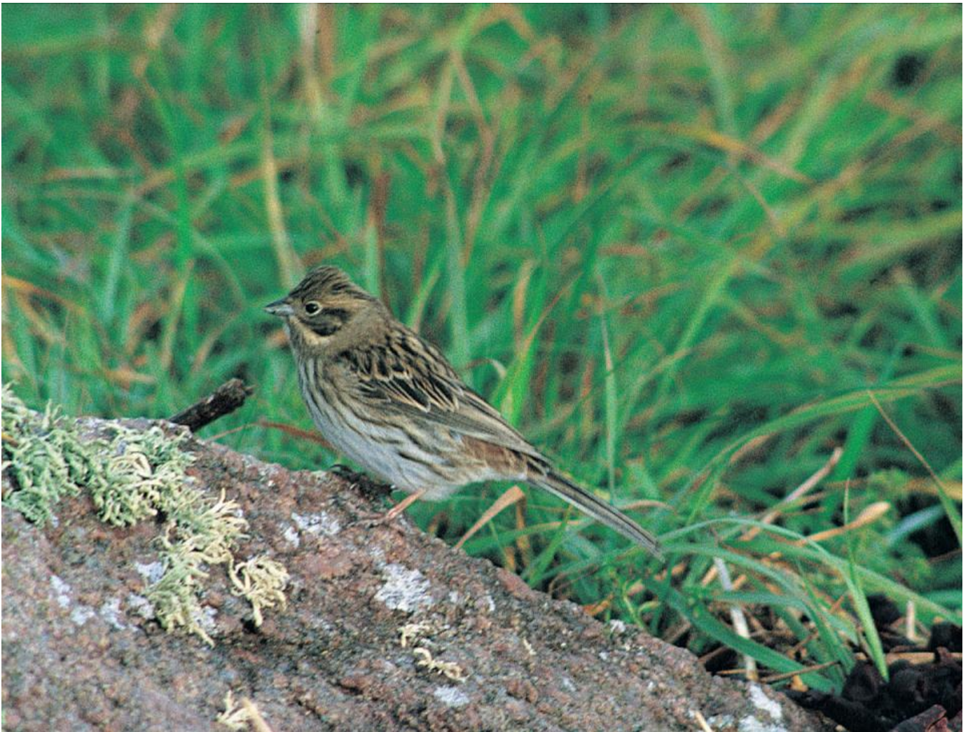
Hvidkindet værling, hun. Bemærk hovedtegninger med tydeligt indrammet kind og en øjenstribe, der når helt frem til øjet. Hvidlig skægstribe i kontrast til mørk malarstribe. Mørke sideissestriber, der går langt ned i nakken. Bredt gråt halsbånd, let stribet. Kraftigt stribet med rødbrune indslag på bryst og flanker på en hvid bund. Hvid bug. Hvide yderste kanter på svingfjer og inderste del af halefjer. Rødbrun overgump. Utklippan, Sverige, den 29. oktober 1992.

Som det fremgår af ovenstående, er det specielt gulspurve, der udgør den store forvekslingsmulighed. Gulspurvehunner, der stort set mangler gult i dragten, er kendt fra nogle dele af gulspurvens udbredelsesområde, og det er specielt unge hunner, der kan mangle gult i dragten. Står man over for en sådan, er det vigtigt, at man meget omhyggeligt noterer sig hoved, nakke og undersidetegninger.