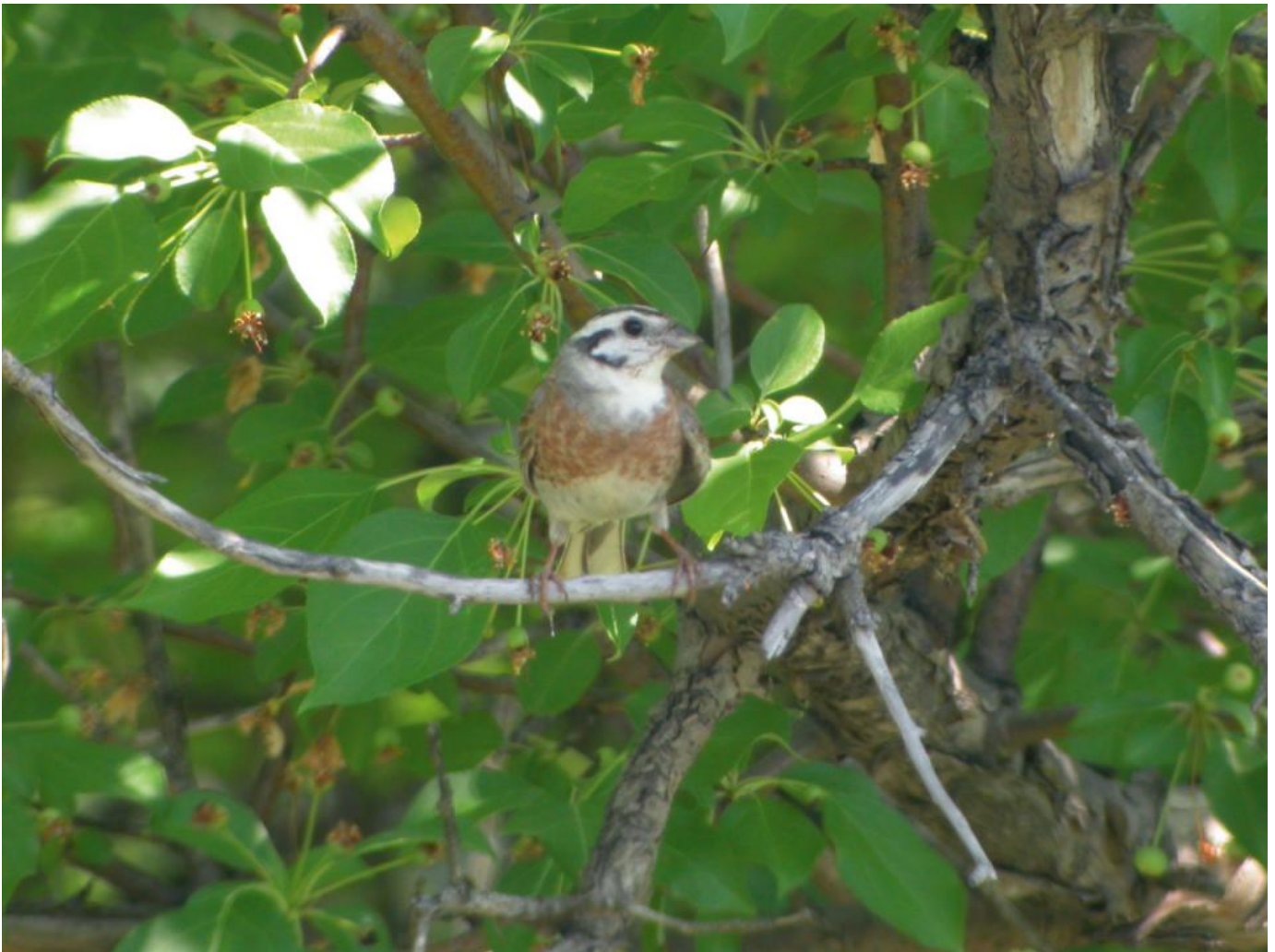
Hvidkindet værling x gulspurv, han. Bemærk de blandede karakterer mellem hvidkindet værling han og gulspurv han. De hvide hovedtegninger har et lysegulligt skær og mangler stort set de rødbrune indslag. Bredt rødbrunt brystbånd. Hvidgullig bug. Næbbet mere ensfarvet gråt som hos gulspurv. Kazakstan, den 8. juni 2006.