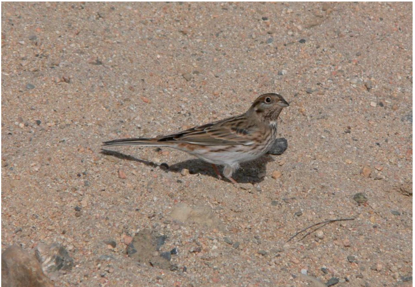
Hvidkindet værling, han. Bemærk begyndende rødbrunt øjenbryn. Rødbrune indslag på strube. Rødbrun sribning på bryst og flanker. Rødbrun overgump med hvidlig skælning ses under vingen. Hvid bug. Hvide yderste kanter på svingfjer og halefjer. Lyst, hornfarvet undernæb. Khovd, Mongoliet, den 21. oktober 2006.

En hvidkindet værling han er om efteråret og først på vinteren lig en bleg udgave af en sommerdragtsfugl. Den hvide krone og den hvide kind er svagt gråtonet. De sorte sideissestriber er mere gråsorte, og de rødbrune hoved-, hals- og strubetegninger er skællede med hvide og enkelte mørke spidser. På de unge hanner er der bredere lyse og mørke spidser, hvilket gør tegningerne mere udviskede end på de gamle hanner.