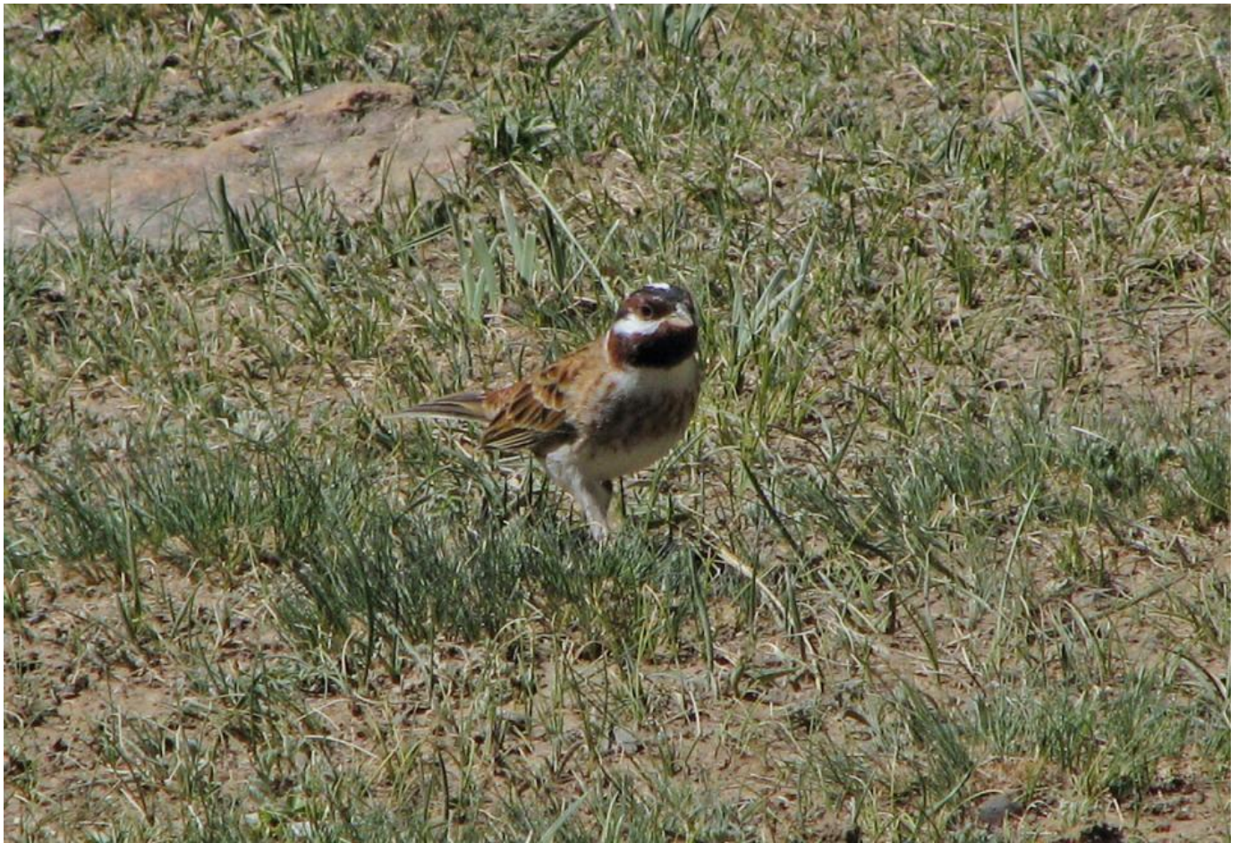
Hvidkindet værling, han af den kinesiske race Emberiza leucocephalos frontor. Bemærk racens karakteristiske brede, sorte indramning af hvid krone. Rødbrun overgump med hvidlig skælning. Kridhvid bug. Bredt, rødbrunt brystbånd. Hvide yderste kanter på svingfjer. Lyst hornfarvet undernæb, mørkegråt overnæb. Kina, maj 2009.

Tidligt på foråret er der en smal hvid stribe, der adskiller den sorte sideissestribe fra den rødbrune øjenbrynstribe, denne slides langsomt bort. Det hvide felt på kinden er på den bagerste del indrammet med sort.