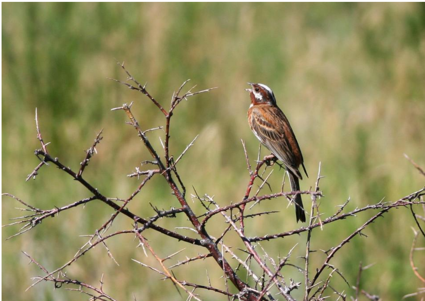
Hvidkindet værling, han i sommerdragt. Bemærk meget rødbrun strube og øjenbrynstribe. Hvid krone og kind, der indrammes af smalle sorte striber. Rødbrun overgump og brystbånd stort set uden hvide indslag er karakteristiske på denne årstid. Hvide yderste kanter på svingfjer og den inderste del af yderhalefjerene. Ret lyst undernæb. Kazakhstan, juli 2007.

Hvidkindet værling er i udgangspunktet en stor, kontrastrig værling med kraftige rødbrune og sorte tegninger på en hvid bundfarve. Specielt skal man hæfte sig ved de kraftige rødbrune, hvide og sorte hovedtegninger og manglen på gule og grønne toner i dragten. Den rødbrune farve er desuden mere "brun" på hvidkindet værling, hvor gulspurvens rødbrune farve er mere over mod en "orange" tone, specielt på overgumpen.