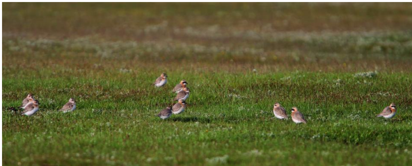
Mongolsk præstekrave, hanner og hunner af racen pamirensis. Bemærk især kropsholdning, sort pande (hos hannerne) og det korte, fintbyggede næb. Son Kul, Kyrgyzstan, juli 2010.

Rødfarvningen er blegere orangetonet hos ørkenpræstekrave i forhold til mongolsk præstekrave, som typisk er dybere rødtonet. Ud på sommeren vil der ske en afblegning af det røde, hvorfor mange mongolske kan nærme sig ørkenpræstekrave i farvetone. Racen pamirensis i Centralasien er meget sart orange i både brystbånd og nakke i hvert fald om sommeren.