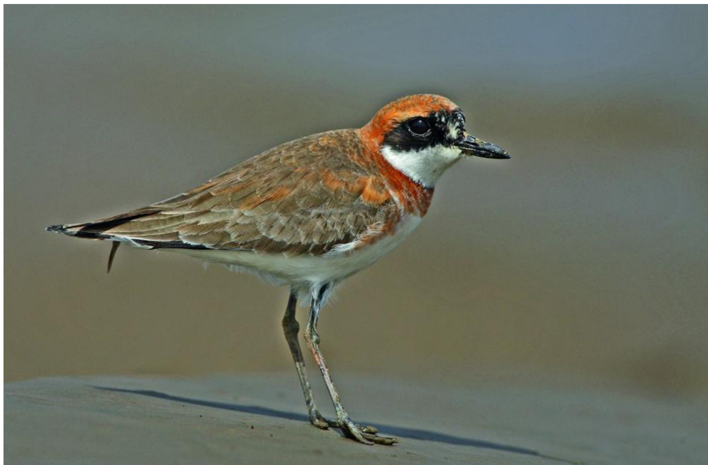
Ørkenpræstekrave, han af racen leschenaultii . Bemærk blandt andet meget kraftig næbbasis og orangerøde indslag i ryggen. Yangkou, Rudong, Kina, april 2010.

Generelt er de to østligste racer meget ens, og de deler de fleste karakterer og jizz, mens den vestlige race har et finere bygget næb, mens rødfarvningen på brystet fortsætter ned ad flankerne, hvilket ikke er tilfældet hos de to østlige racer.