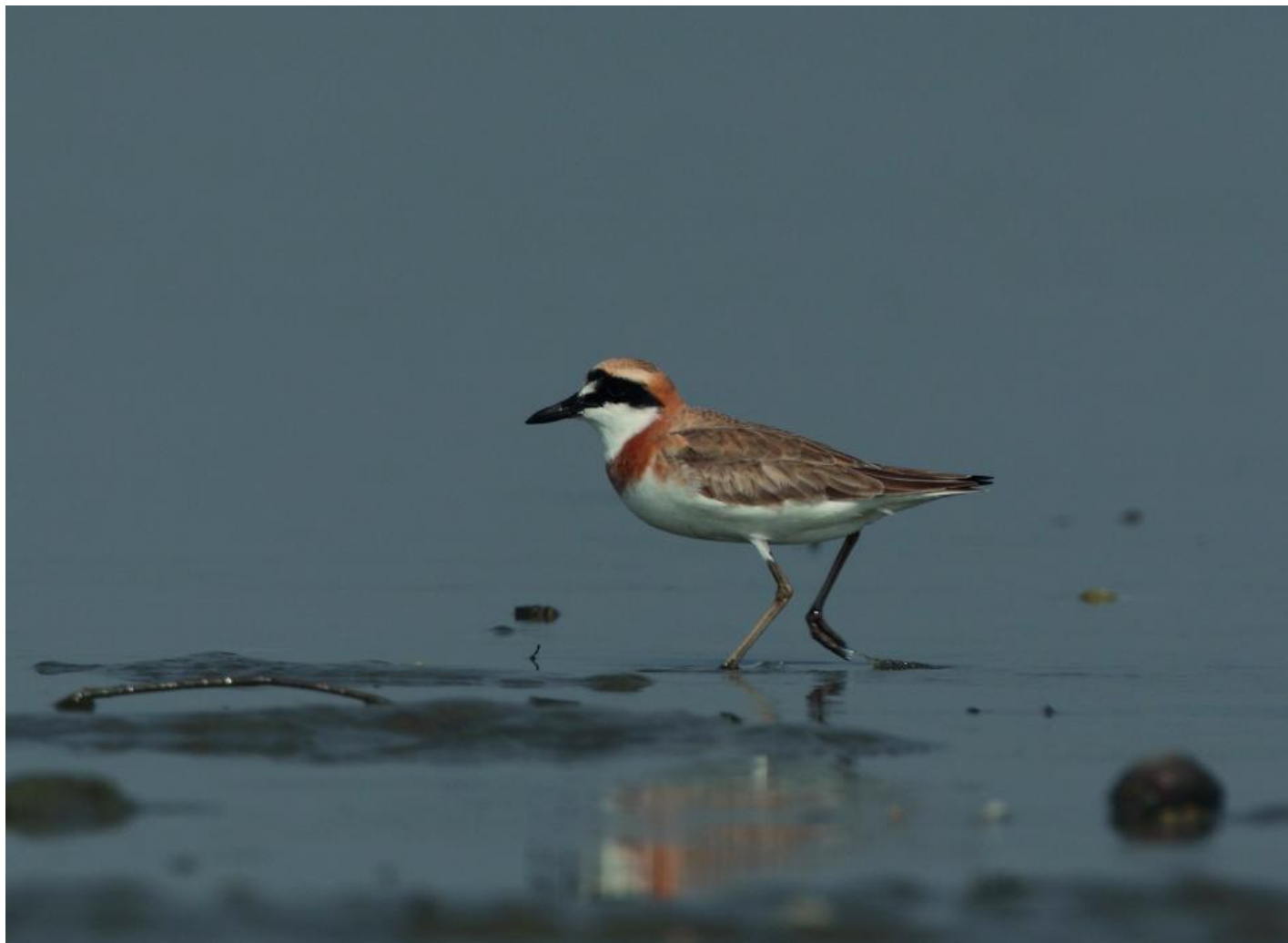
Ørkenpræstekrave, han af racen leschenaultii. Bemærk langt dolkformet næb, kraftig næbbasis, lang næbspids, ret flad isse og hvide pletter i panden. Det orangerøde brystbånd er begrænset til selve brystet. Desuden lange, lyst gullige ben og horisontal kropsholdning. Laem Pak Bia, Thailand, april 2011.

Mongolsk præstekrave har benene længere ude på bagkroppen, hvilket giver en smule mere oprejst profil. Den fouragerer mere aktivt i forhold til ørkenpræstekrave, da den typisk løber mere og bruger flere skridt, inden den bukker sig ned efter føde. Hovedet er afrundet, hvorfor dens fremtoning er mere som en stor præstekrave. Benene er moderat lange, særligt er tarsen lang, mens tibia er mere moderat i længde. Mongolsk præstekrave er større og kraftigere end stor præstekrave, men den virker ikke så meget anderledes i form, hvorfor man får et finere indtryk af mongolsk præstekrave i forhold til ørkenpræstekrave.