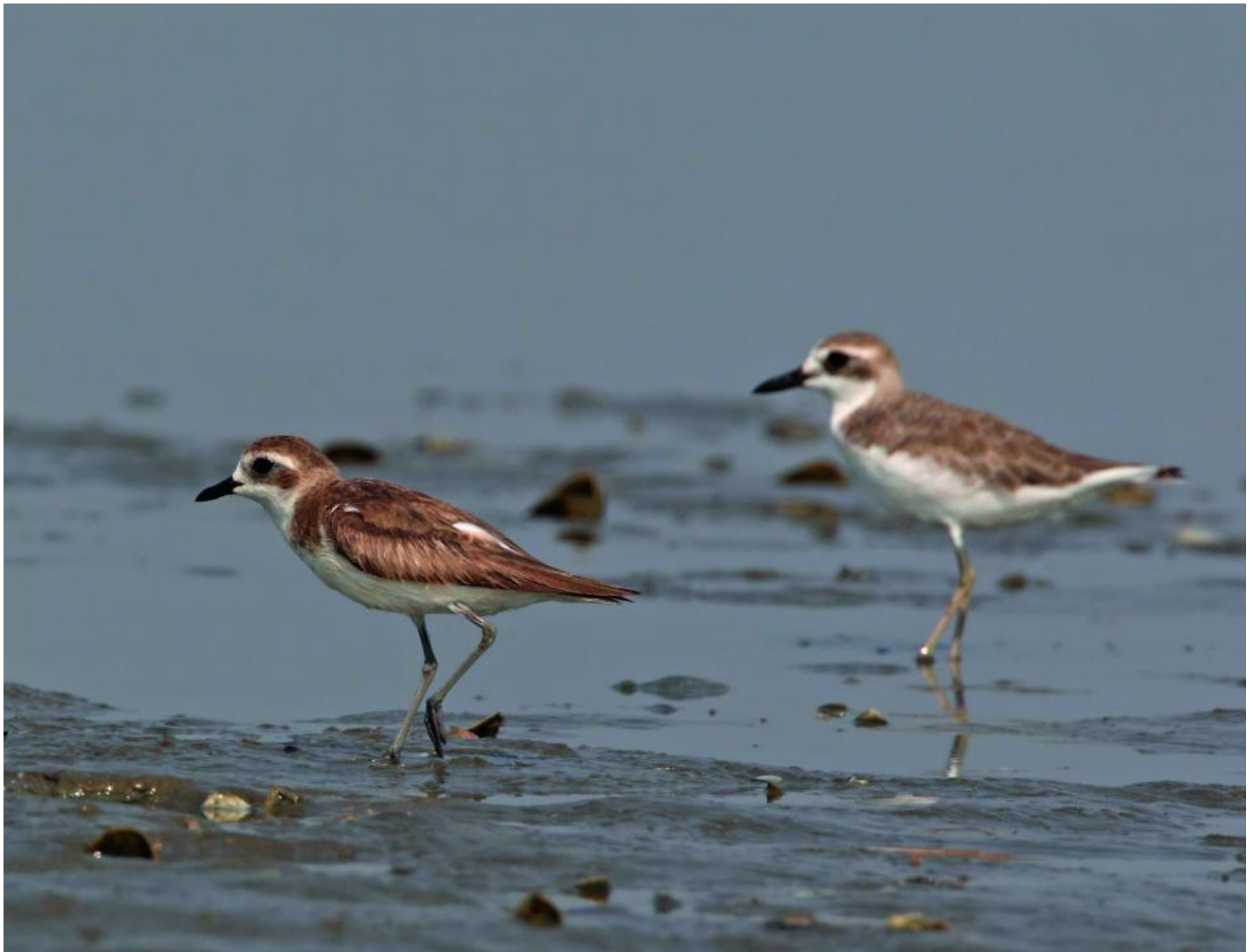
Mongolsk præstekrave, hun af racen schaeferi (t.v.), og ørkenpræstekrave, hun af racen lechenaultii. Bemærk forskellen i benenes placering på bugen. Læg også mærke til ørkenpræstekravens lange, dolkformede næb med kraftig basis i forhold til den mongolske præstekraves kortere næb med tyndere basis, tydelige fortykning på næbspidsen og mere stumpe næbspids. Laem Pak Bia, Thailand, april 2011.

Første fund af ørkenpræstekrave var 4-6. august 1994, da en hun eller 2K blev set på Agger Tange, mens det andet fund var 25-26. juli 2000, da en adult han i sommerdragt blev fundet i Margrethe Kog.