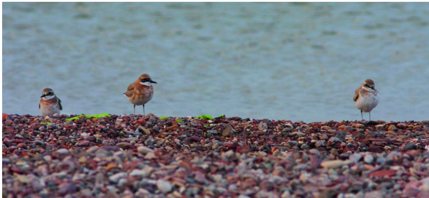
Ørkenpræstekrave, han (i midten) og to hunner af racen columbinus. Bemærk hos hannen rødfarvning langt ned på brystet, men særligt det ret spinkelt byggede næb og næbbasis. Selve næbspidsen er lang til forskel fra mongolsk præstekrave. Eilat, Israel, marts 2008.

smalt brystbånd, som i udbredelse slutter ovenfor vingeknoen. Den mellemøstlige columbinus ørkenpræstekrave har imidlertid et brystbånd, som kan fortsætte ned langs den øverste del af flanken.