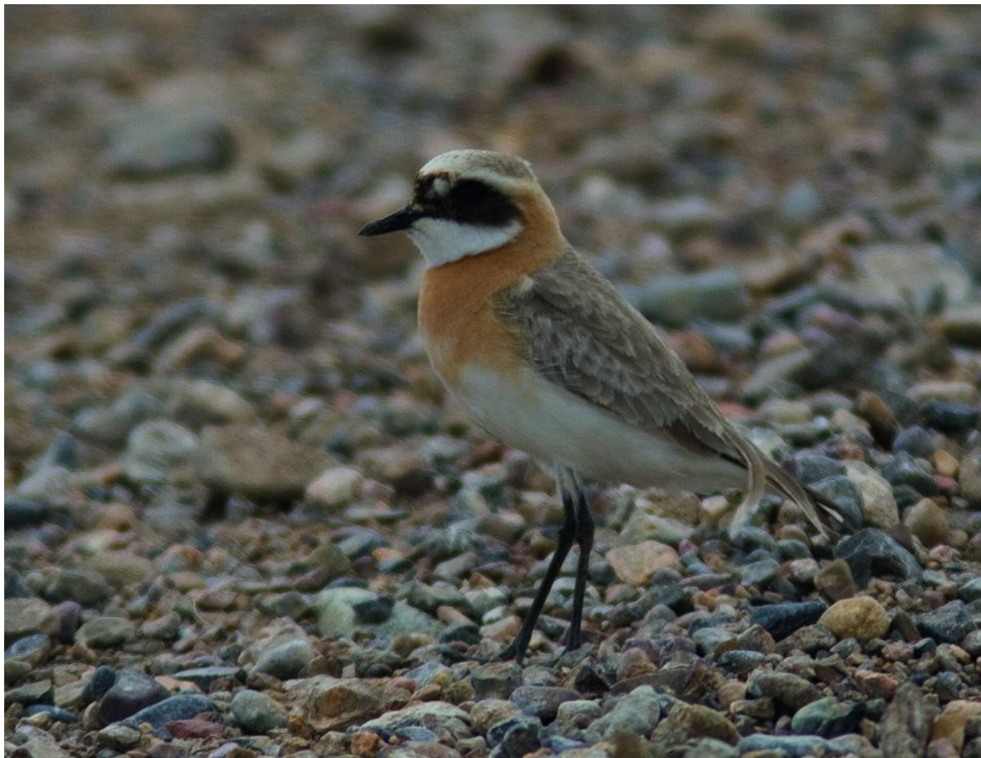
Mongolsk præstekrave, han af racen pamirensis. Bemærk kropsholdning, det korte og fint byggede næb, ret lange sorte ben samt den meget sarte orangefarvning. Son Kul, Kirgystan, juli 2006.

Ørkenpræstekraver af racen columbinus er en sand joker, da den har mere udbredt rødfarvning på brystet i forhold til de fjernøstlige racer. Den har ofte et finere bygget næb, som nærmer sig mongolsk præstekraves næb i længde. Alt i alt er det vigtigt at have denne race i baghovedet, når man står overfor en potentiel mongolsk præstekrave. Mongolsk præstekrave af racen schaeferi er typisk mere langbenet og mere langnæbbet end fuglene i mongolus-gruppen samt fugle af racen pamirensis . Blandt andet ses det meste af fødderne bag halen på denne race, og i vinterdragt er oversidefarven næsten så lys som ørkenpræstekrave, hvorfor det sandsynligvis er denne race, som mest oplagt kan fejlbestemmes til ørkenpræstekrave. Vær opmærksom på ikke at fejllobe hvidbrystet præstekrave hun, som på mange ledder minder om for eksempel 2K fugle, eller visse hunner af både ørkenpræstekrave og mongolsk præstekrave. Tjek straks om fuglen har lyst nakkeband. Hvis ja er det en hvidbrystet, da ingen af de to omtalte røde arter har denne karakter.