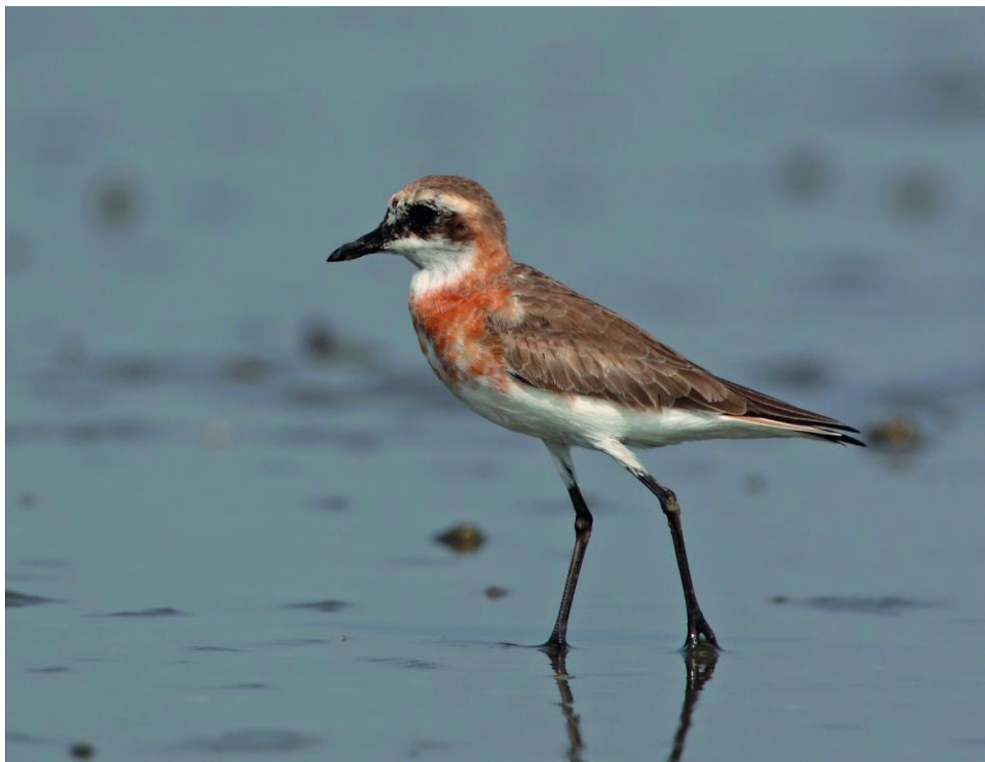
Mongolsk præstekrave, hun af racen schaeferi. Bemærk svagere ansigtstegninger i forhold til hanner, næbproportioner og en mere opret kropsholdning i forhold til ørkenpræstekrave. Hovedformen er med mere afrundet isse i forhold til ørkenpræstekrave. Desuden gråsorte ben. Laem Pak Bia, Thailand, april 2011.

Begge arter viser en sort eller sortbrun masketegning omkring øjet og på kinden. Dette grænser smukt til en hvid strube. Hunnerne viser en svagere farvet masketegning typisk mere brunlig end sort. I panden findes hos alle racer af ørkenpræstekrave samt hos mongolske præstekraver i mongolus-gruppen et par hvide ovale pletter adskilt af en sort lodret samt en smal sort streg i panden. De mongolske præstekraver i atrifrons-gruppen har derimod ofte helt sort pande. Nogle individer har lidt hvidt smuds i panden i varierende grad, men aldrig som veldefinerede ovale pletter. Ser man en rød præstekrave med helt sort pande er der altså med sikkerhed tale om en mongolsk præstekrave.