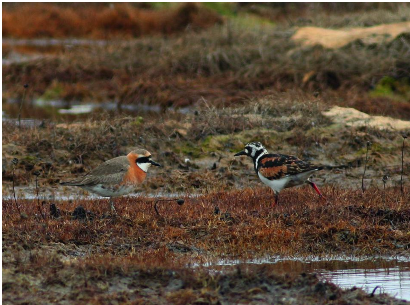
Mongolsk præstekrave, han af racen mongolus/stegmanni. Bemærk kort og kraftigt næb, runde proportioner samt den sorte kant langs overkanten af det røde brystbånd. Bemærk desuden størrelsen i forhold til stenvenderen. Chetverty, Anadyr, Chukotka, Rusland, juni 2010.

Mongolsk præstekraves næb er hos fugle i atrifrons-gruppen bygget som hos ørkenpræstekrave, blot i en kortere udgave og med en mere spinkel basis, men ofte med en tydelig udbulning på spidsen af overnæbbet. Selve næbspidsen virker kort i forhold til ørkenpræstekrave. Hos de centralasiatiske pamirensis virker næbbet kort og fint bygget, mens der hos racen schaeferi er tale om et relativt langt næb, som kan forvirre i forhold til især columbinus ørkenpræstekrave.