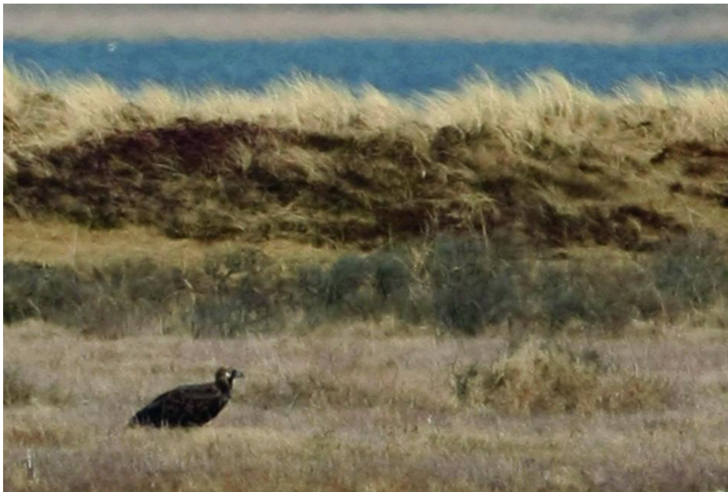
Munkegrib ved Agger Tange den 3. april 2010.

Vi kørte på grusvejen parallelt med hovedvejen vest for lagunerne og alle undtagen chaufføren havde netop poppet en blå cola – det var trods alt ferie - da jeg klokken 12.52 fra passagersædet kiggede ud af sideruden og blev opmærksom på en masse måger på vingerne over lagunen. “Nå, nu kommer der snart en havørn,” tænkte jeg. Jeg kiggede over skulderen og skråt bagud, og med kurs mod Cheminova ser jeg med det blotte øje en sort prik, som ligner en havørn. Vi stoppede bilen og satte kikkerter på prikken. Noget passede ikke helt med havørn og MKH udbrød: “Det er GODT NOK en stor havørn.” Vi fik skoper på dyret, der i mellemtiden var nået længere nordpå, så vi så den skråt bagfra. Jeg tænkte, at det kunne være munkegribben, som cirka to uger tidligere var set i Holland. Heldigvis gav den sig til at kredse, og da hovedet blev synligt var sagen klar: MUNKEGRIB.