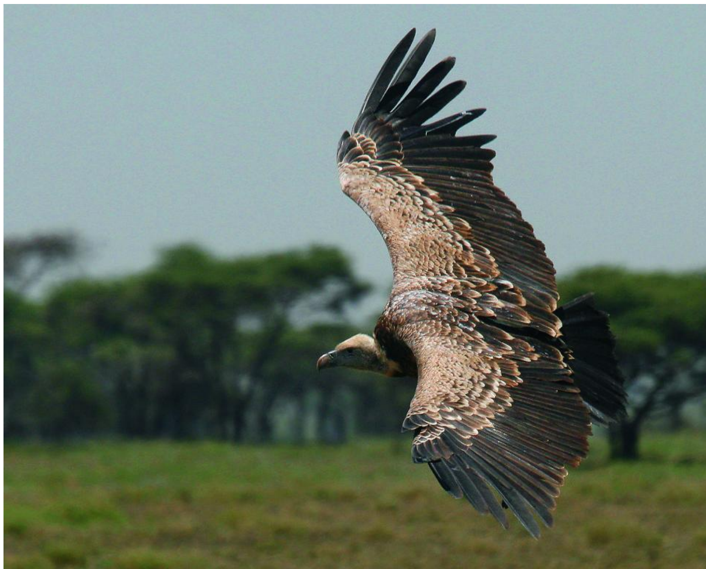
En Rüppells grib på Serengetis savanne i Østafrika. Arten har højderekorden blandt fuglene. I 1973 fløj et fly i 11.300 meters højde ind i en Rüppells grib i luftrummet over Elfenbenskysten.

Rolf Christensen om Rüppells grib i Skagen, januar 2004: