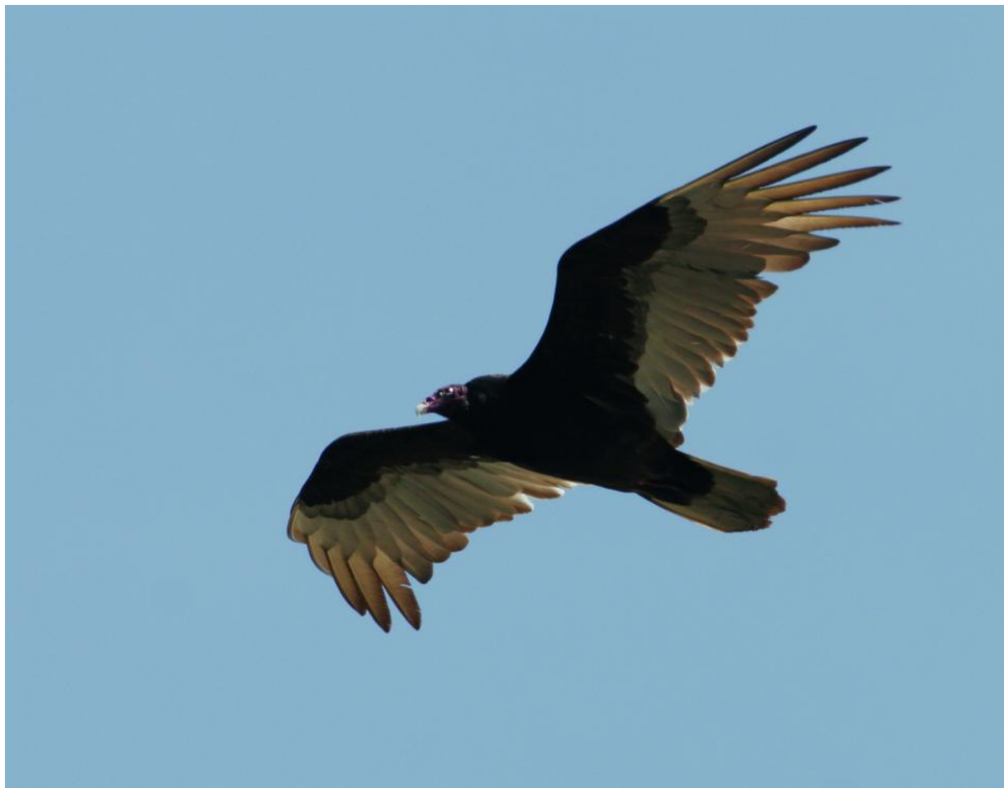
Kalkungrib fotograferet i april 2006 i Cape May, New Jersey, USA.

Kalkungribben lever i Nord-, Mellem- og Sydamerika, og fund i Europa drejer sig med stor sandsynlighed om fugle, som er undsluppet fra fangenskab.