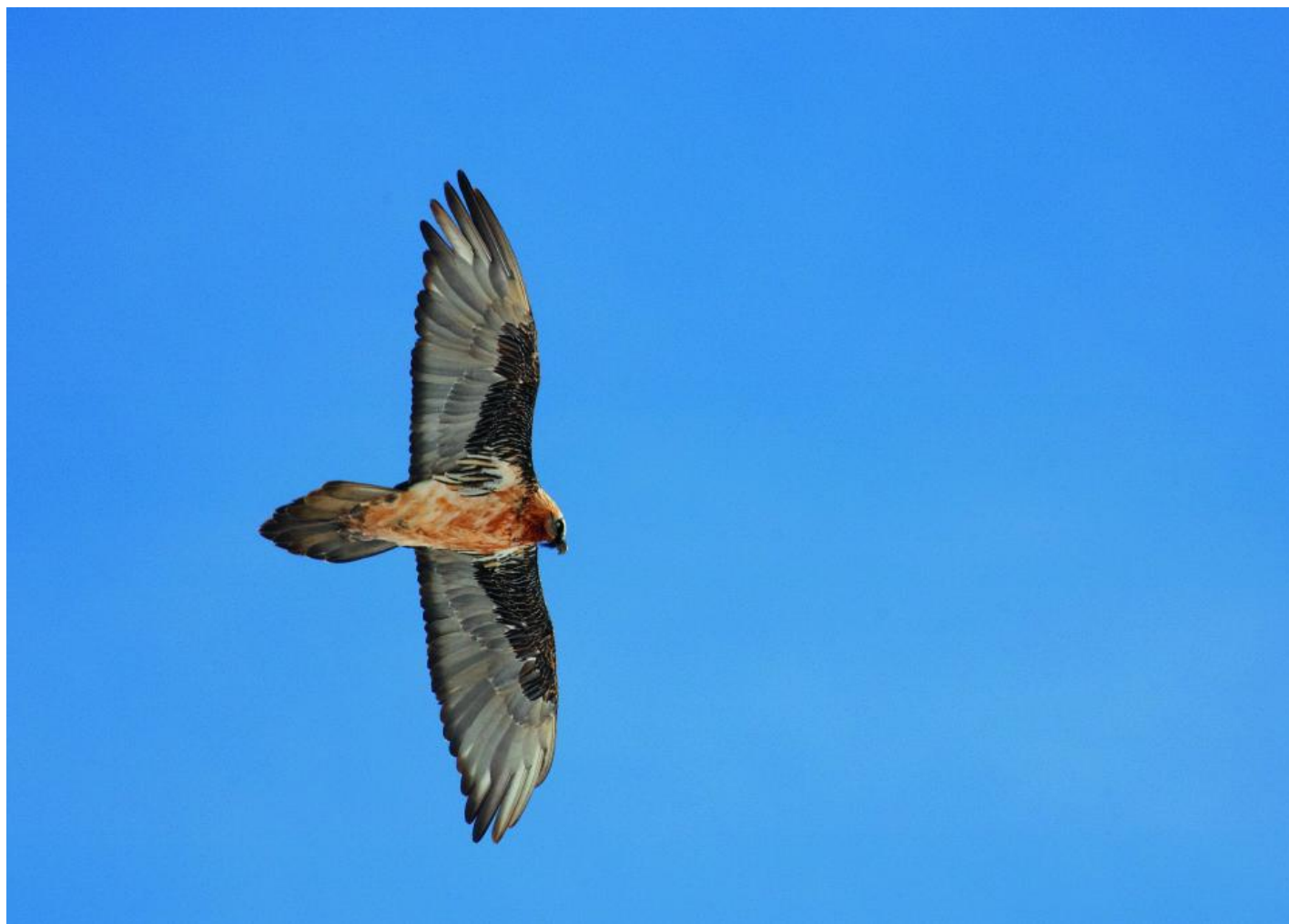
Et dansk drømmesyn over dem alle - en udfarvet lammegrib. Denne er fotograferet i Passo D'Eira, Livigno, Italien, februar 2007.

Blot tre uger senere fik Danmark besøg af en ny lammegrib. 16. juni ved 11-tiden opdagede Thomas Vikstrøm fra det sydlige fugletårn ved Bøtø Nor på Falster en yngre lammegrib, der kom flyvende fra syd. Fuglen landede på en mark og sås i området frem til 22. juni. På sidstedagen blev fuglen fotograferet, da den sad på en brændestabel i Bøtø Plantage ved Gedser. Fuglen havde blegede svingfjer, og var derfor en anden fugl, end den, der sås tidligere på året i Jylland. Desuden var fuglen ringmærket med en lille ring. Ringen viste, at fuglen, der hed Frantz, var født i Prags Zoologiske Have 26. februar 2002. Senere i 2002 blev fuglen udsat i Østrig i forbindelse med et udsætningsprojekt i Alperne.