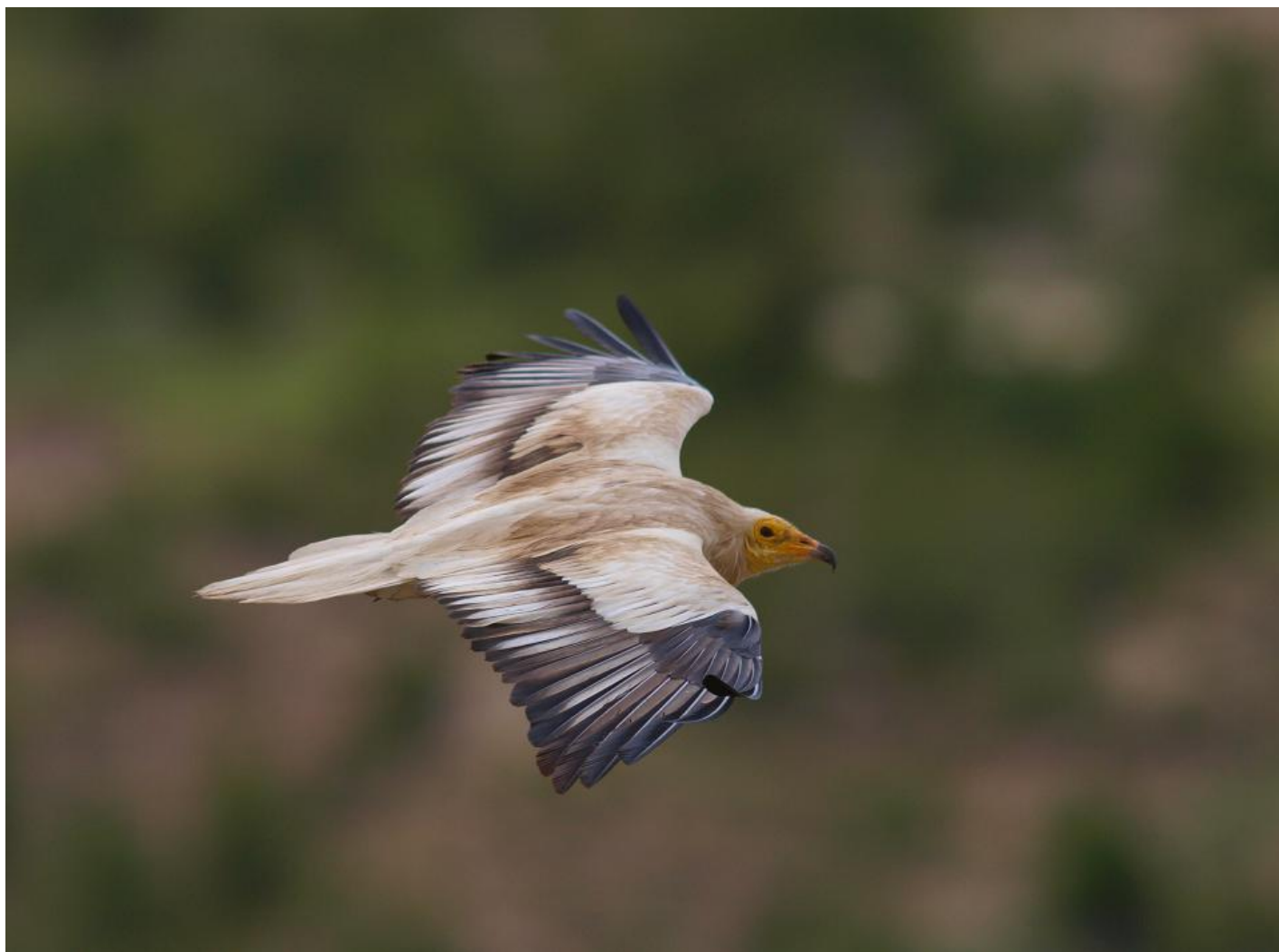
Ådselgrib på hjemmebane. Beypazari rubbish dump, Tyrkiet, maj 2011.

I 2000 har der med største sandsynlighed været ådselgrib i dansk luftrum. Men fuglen undgik at blive opdaget. 20. maj sås en trækkende ådselgrib ved Lomma i Skåne 35 kilometer øst for Rådhuspladsen. Hvad der formentlig er samme fugl genfindes på en losseplads i Hälsingland i Mellemsverige 13. og 14. juni, hvor den fotograferes. 8. og 9. juli ses gribben på Öland, og 24. juli er fuglen nået til Falsterbo. Nu bliver det for alvor interessant for danske fuglekiggere, da mange rovfugle, der trækker ud fra Falsterbo, ses på Stevns. Men fuglen returnerer, gør endnu et trækforsøg over Falsterbo 26. juli, før den vender tilbage til Öland, hvor den ses mellem 1. og 9. august. 13. august er den igen i Falsterbo, og denne dag trækker den ud. Der er folk på plads på Stevns. En stor fiskeørn-lignende rovfugl ses på stor afstand fra Mandehoved østpå ude over vandet, men fuglen trækker så langt fra land, at den ikke kan bestemmes. Gribben ses aldrig igen.