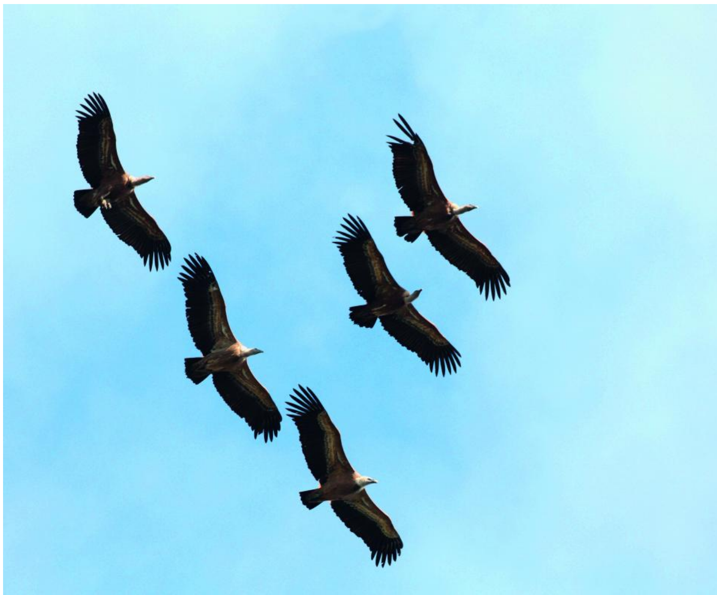
Et dansk drømmesyn af gåsegribbe i flok. Her fra Perque Nacional de Monfrague, Extremadura, Spanien, Marts 2010.