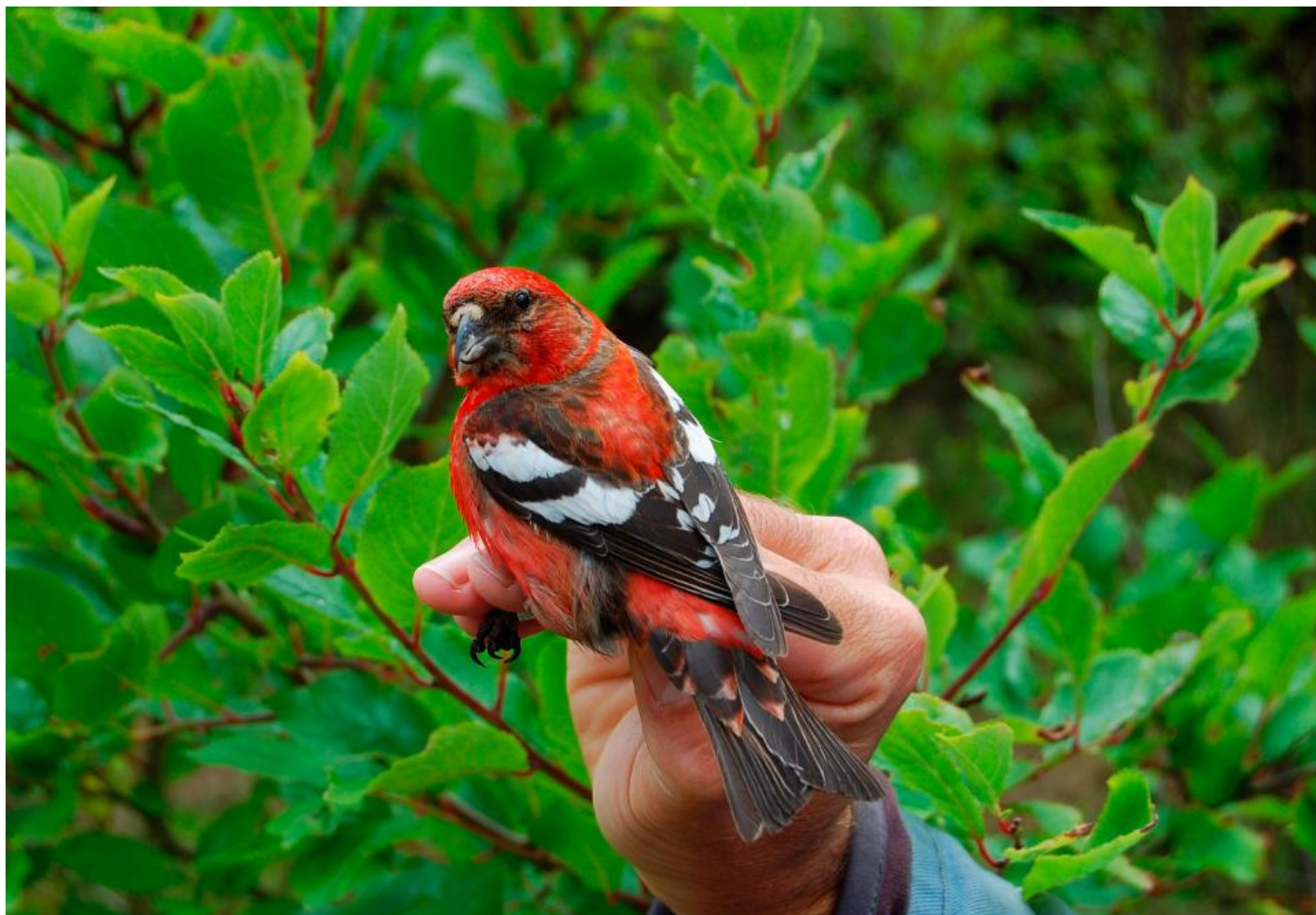
Der er ringmærket i alt 18 eksemplarer af hvidvinget korsnæb i Danmark. Blåvand, juli 2011.

Der er ingen sikre ynglefund i Danmark, men i Tyskland er der registreret ynglende fugle efter invasionsår. I Sverige, Norge og Finland yngler arten i svingende antal, specielt efter invasionsår.