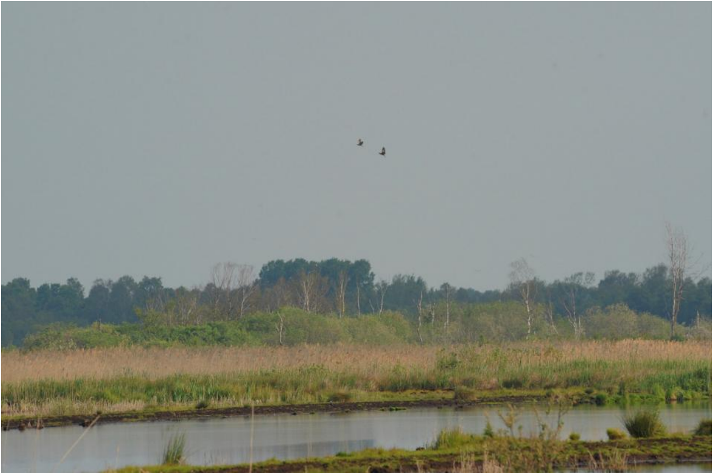
To rørdrummer jager hinanden i luften højt over rørskoven.

Men i de senere årtier har rørdrummen været i svag fremgang i Danmark. Arten rykker trofast ind og etablerer sig i naturgenoprettede områder, hvor nye våde arealer med rørskove og sumpe træder frem i terrænet. I mange andre lande går arten tilbage på grund af dræninger og ødelæggelse af dens biotoper.