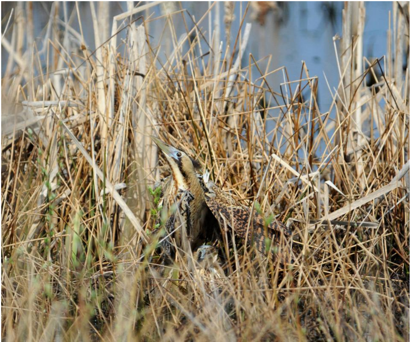
Et yderst sjældent syn: To rørdrummer parrer sig i den tørre vegetation. Maj 2011.

Så nåede rørdrummerne et tørt område med gamle lysesiv. Her besteg hannen den krybende hun, der sagde hvæsende lyde, som jeg, hvis jeg ikke havde vidst og set bedre, ville have troet stammede fra et større pattedyr. Som altid hos fugle var forspillet væsentligt længere end selve akten, der ikke varede mange sekunder. Så var dét bal forbi, og magerne spankulerede hver til sit.