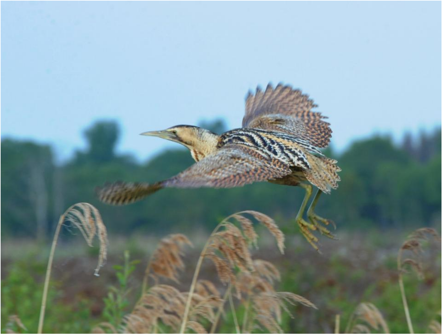
Her er rørdrummen netop fløjet op fra dens skjul i rørskoven.

Vejlernes våde vildmark er ubestridt rørdrummens danske nationalscene, for rundt regnet 100 ynglepar lever og brøler i Hannæs i landet mellem Limfjorden og Vesterhavet. Den danske bestand skønnes i disse år at tælle 200-300 ynglepar. Et par lange, hårde vintre har formentlig kostet nogle rørdrummer livet.