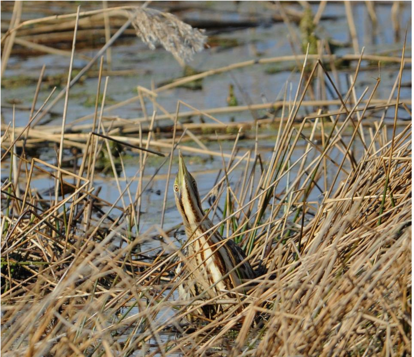
En rørdrum kan se helt skeløjet ud, når den ses i denne vinkel.