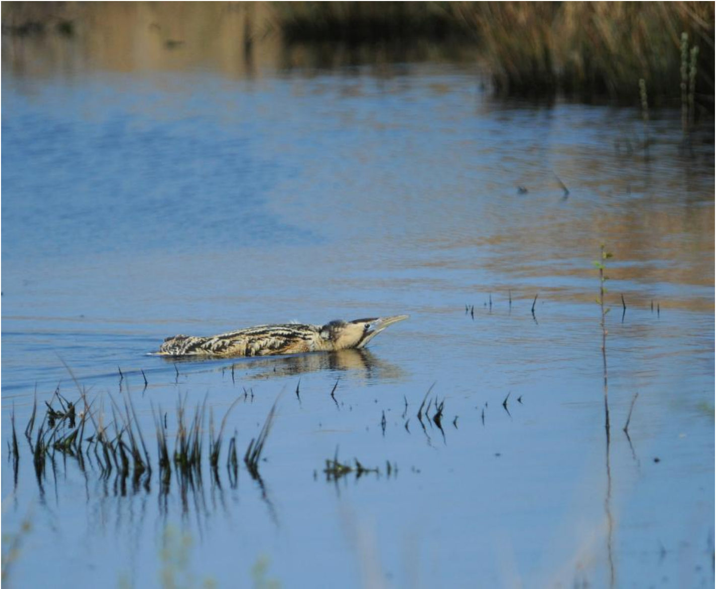
Rørdrumhannen svømmer væk efter parringen.

Det er ganske vist, at rørdrummen er en af de mest spøjse fugle i den danske natur. Den er lavet at det stof, som myter og magi i det fri er gjort af. Fantasien har alle dage været rørdrummens følgesvend, når man i de mørke timer fra dybe, uvejsomme rørskove hører dens besynderlige, hule brøl.