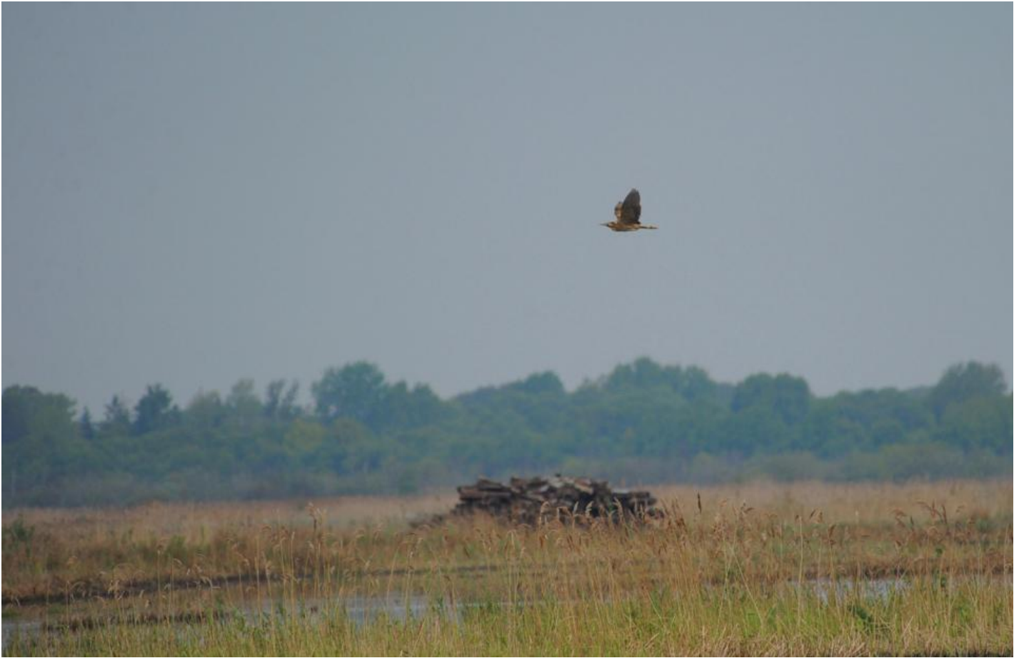
Flyvende rørdrum.

De vestjyske fjorde, Skjern Ådalen, Tøndermarsken med Vidåen, Lille Vildmose, Sydlangeland, Maribosøerne og en række moser og søer med tagrør på Sjælland huser rørdrummer. Ja, bare et brøl fra centrum af København kan man opleve spøgelse i rørskoven ved Hejresøen på Vestamager og undertiden i Utterslev Mose. Da kan det hælde, at rørdrummen må kæmpe med storbyen om en plads i nattens lydbillede.