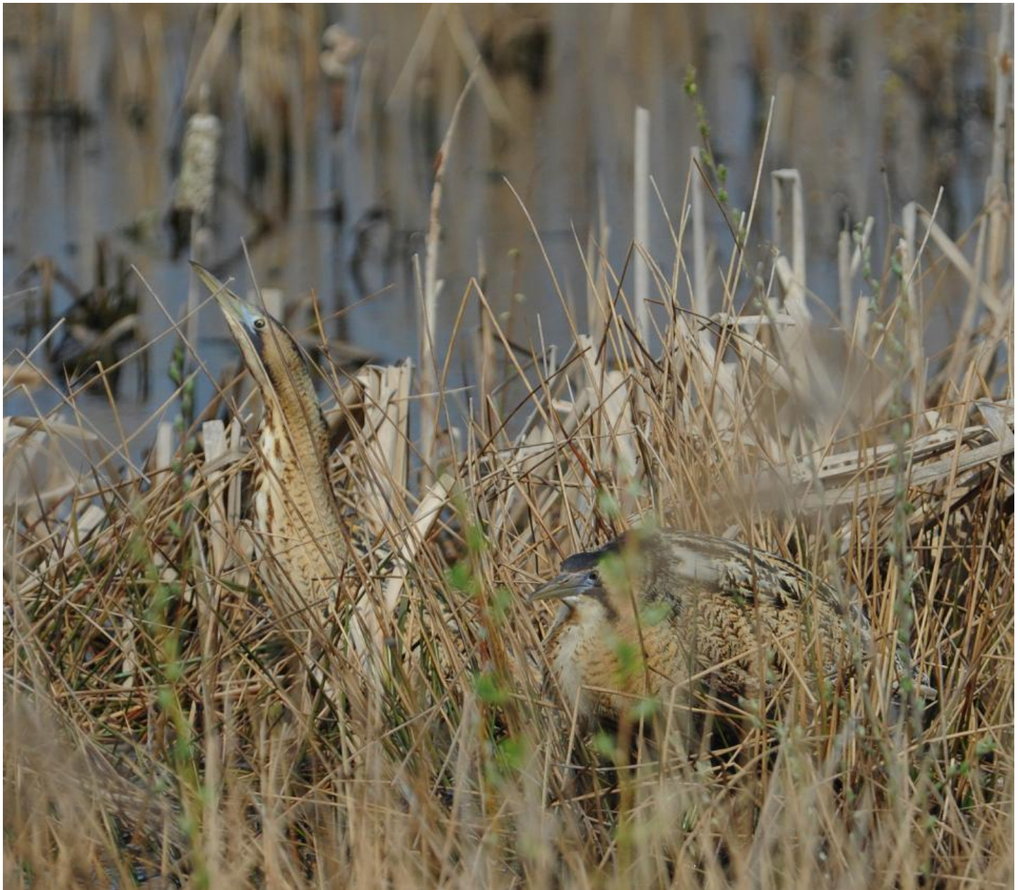
Her er rørdrumparret fotograferet efter parringen. Kort efter skiltes de to fugle, og hannen forlod stedet.

Hannen sneg sig væk i ly af dunhammere, og han svømmede over adskillige meter åbent vand. Foråret og forsommeren igennem fulgte jeg jævnligt rørdrummerne, der ganske givet fostrede unger et sted i det skjulte. Drummerne fløj dagligt frem og tilbage mellem flere fourageringsområder og et ganske bestemt sted i rørskoven. Og naturligvis brølede hannen særligt morgen og aften, så man kunne høre ham på kilometers afstand.