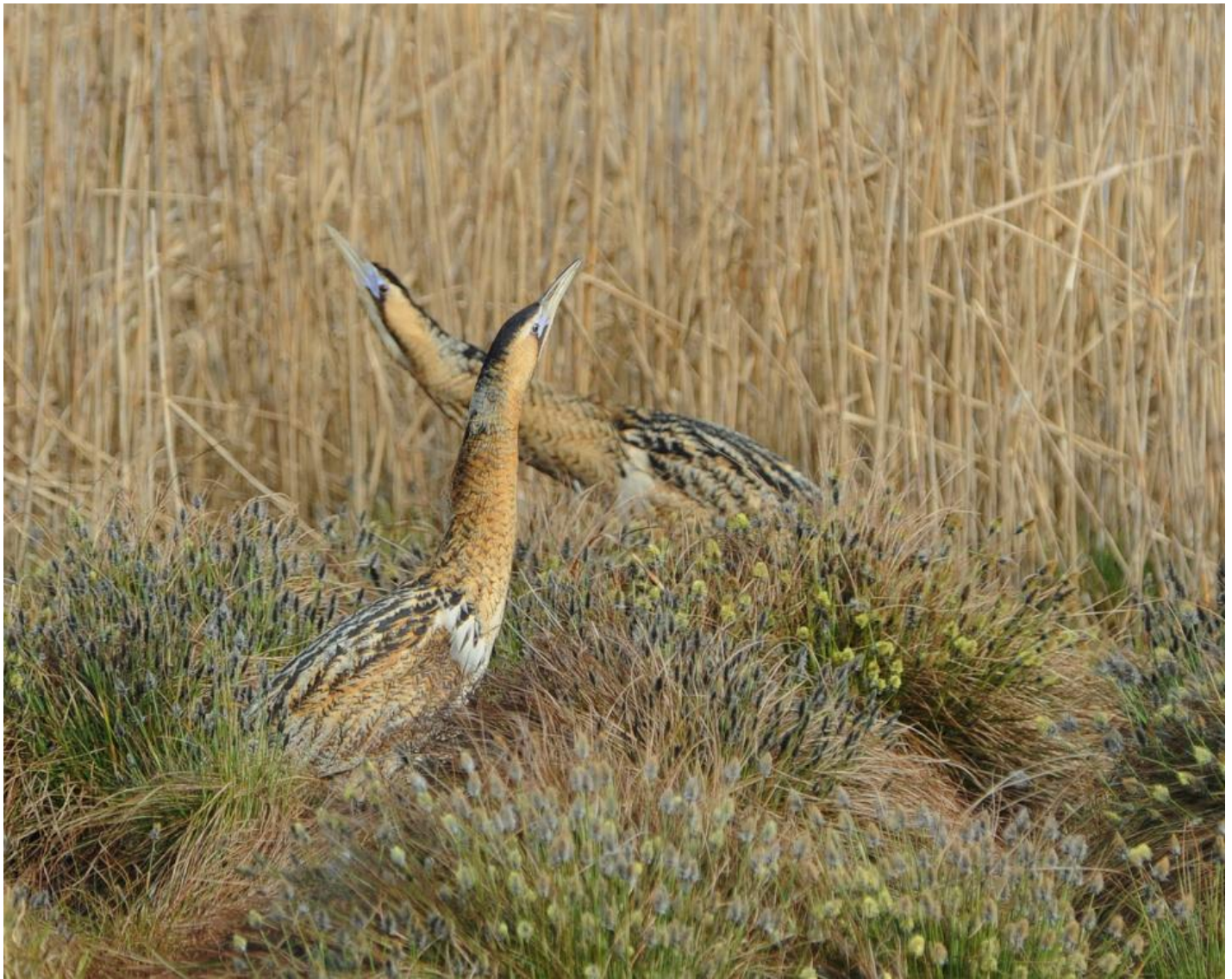
Her er rørdrumparret kommet ganske tæt på hinanden, og der lægges op til parring, maj 2011.

Hannen forsøgte at imponere ved at gøre sig stor i struben, og jeg bildte mig ind, at den fysisk mindre og svagere farvede hun så både betaget og betuttet ud. Hun bøjede sig ned og gik i knæ af benovelse over at have mødt rørskovens Don Juan. Med et begyndte en løjerlig spadseretur med strakte halse i kanten af sumpen mellem tuer af kæruld og lysesiv. I små etaper nærmest krøb hunnen af sted. Hendes bevægelsesmønster var slange og fugl i et.