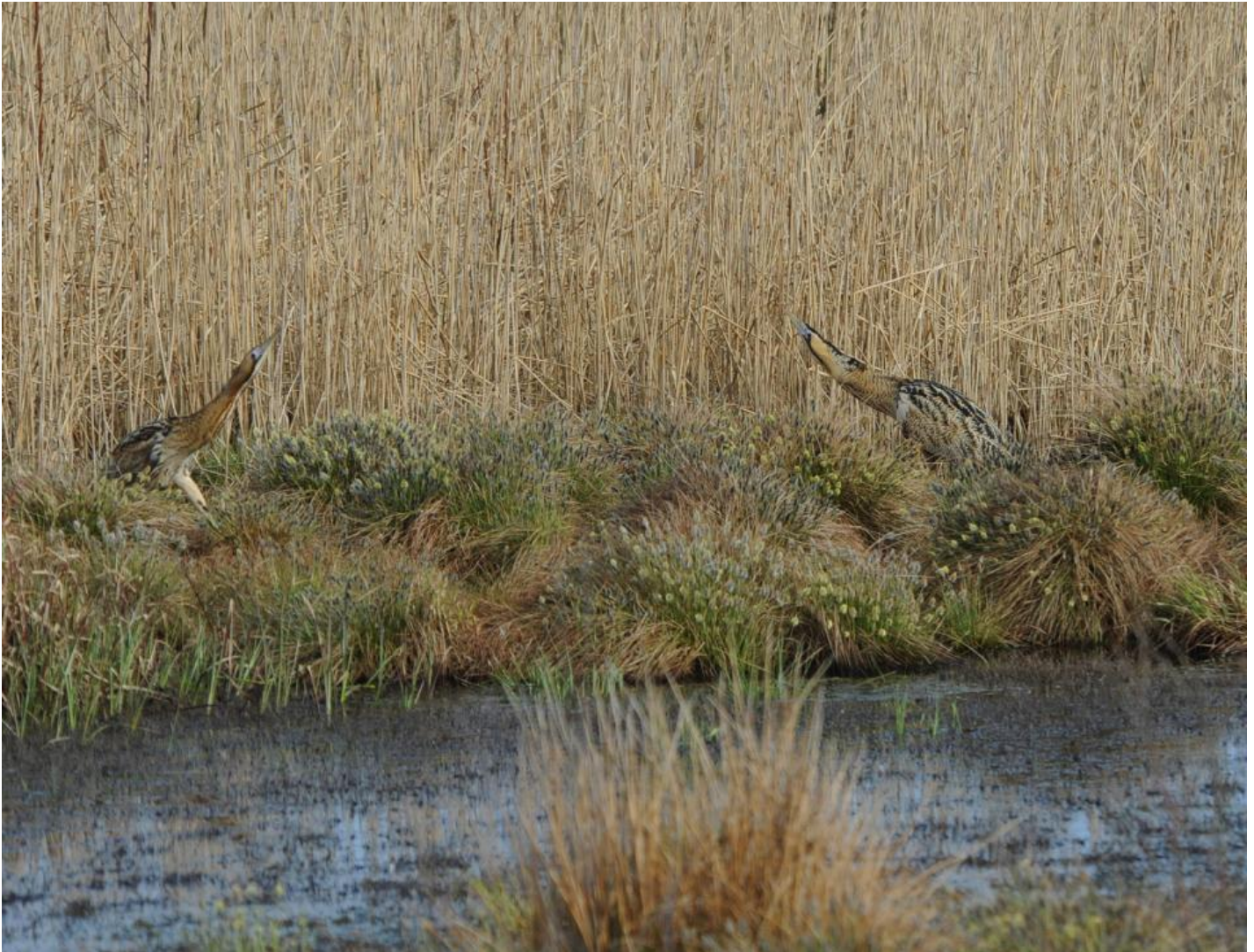
Han og hun mødes i udkanten af rørskoven.

I flere dage i træk var mønsteret det samme; næsten på klokkeslæt kom rørdrummerne frit frem, og jeg var klar. En eftermiddag havde drummerne andet i hovedet end padder, hundestejler og vandkalve. Ud over guldsmede var der erotik i luften.