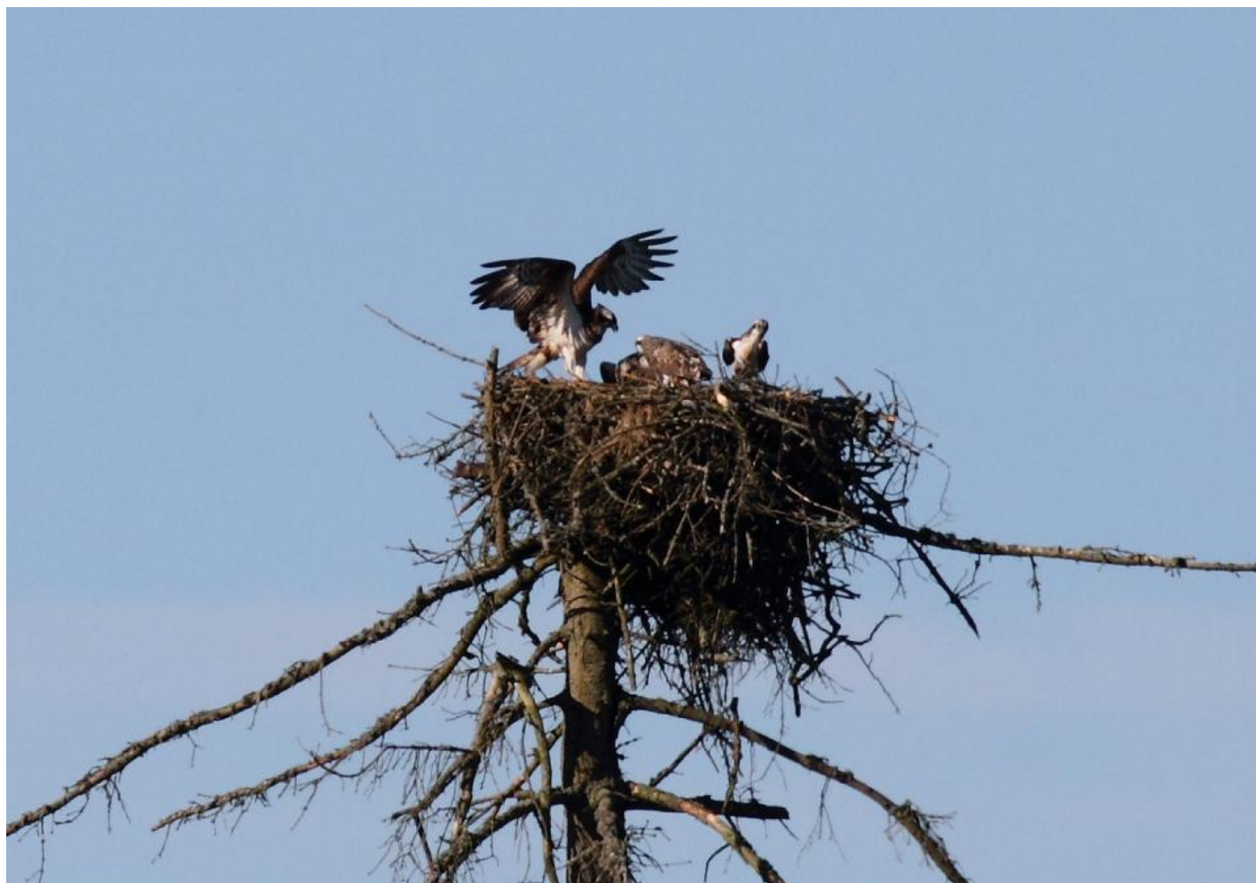
Fiskeørnereden i Gribskov husede i 2012 en familie på fire, som her ses sammen i reden. De to unger var på deres første flyvetur over området først i august. Dette billede er taget fra observationsstedet i forsvarlig afstand fra reden.

Caretakergruppen i Gribskovområdet fortæller på sin hjemmeside, at en af de nærgående fotografer har været direkte provokerende og ubehøvlet. Han har for eksempel sagt til en af caretakerne, at han nok selv skal bestemme, hvor han vil gå i skoven.