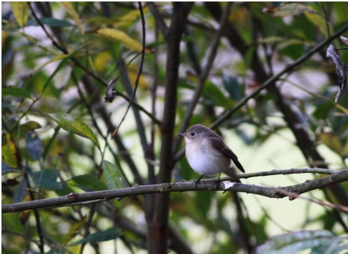
Lille fluesnapper på Mandø.

Ved Filsø blev der, ud over fem havørne, set en rødhalset gås mellem bramgæssene, og ved Blåvand trak en thorshane forbi.