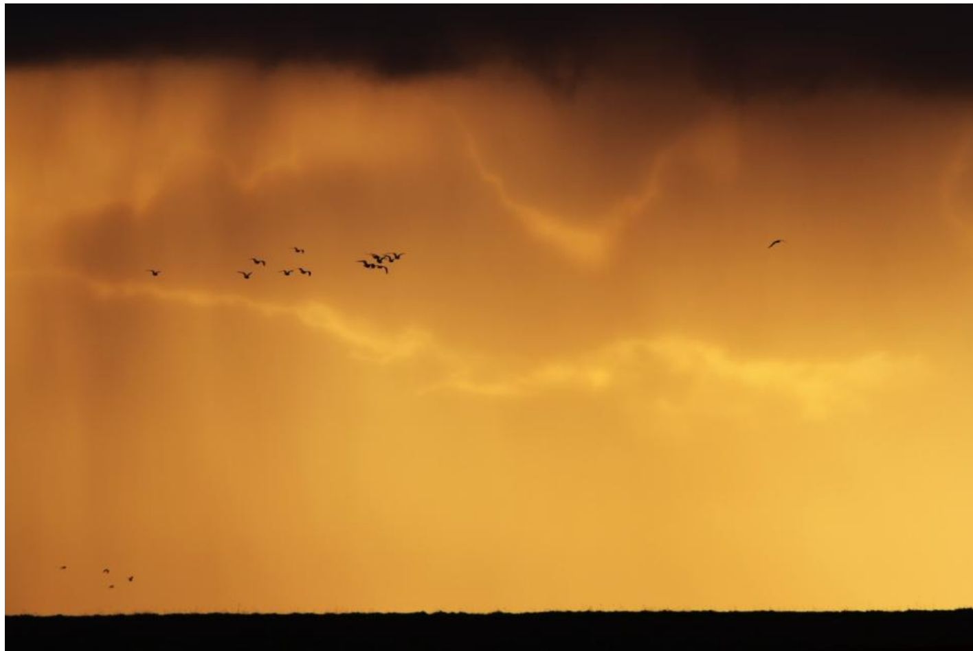
En smuk aften ved Ballumdiget.

Første dag på FT12 bød på hvidbrynet løvsanger ved TDC i Blåvand og en genganger på Mandø. Den sibiriske hjejle (fundet af TWA og TA), som havde spøgt i dagene op til træffet, blev ligeledes meldt fra Ballum, hvilket stod på gennem hele ugen. Rømdæmningen bød på hele otte sølvhejrer, som relativt let kunne ses fra dæmningen.