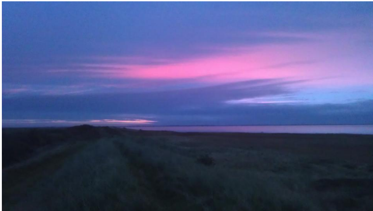
Landsende, Rømø.

Dagen gav en storpiber på Mandø, og Rømø bød på hvidbrynet løvsanger og sibirisk gransanger (igen) ved Juvre, samt en spændende observation af hele to meget sene høgesangere, som sammen kunne ses ved Klitdiget. Desuden var der tre havørne ved Ballum Sluse, hvor også en sen, gammel han af hedehøg kom drivende.