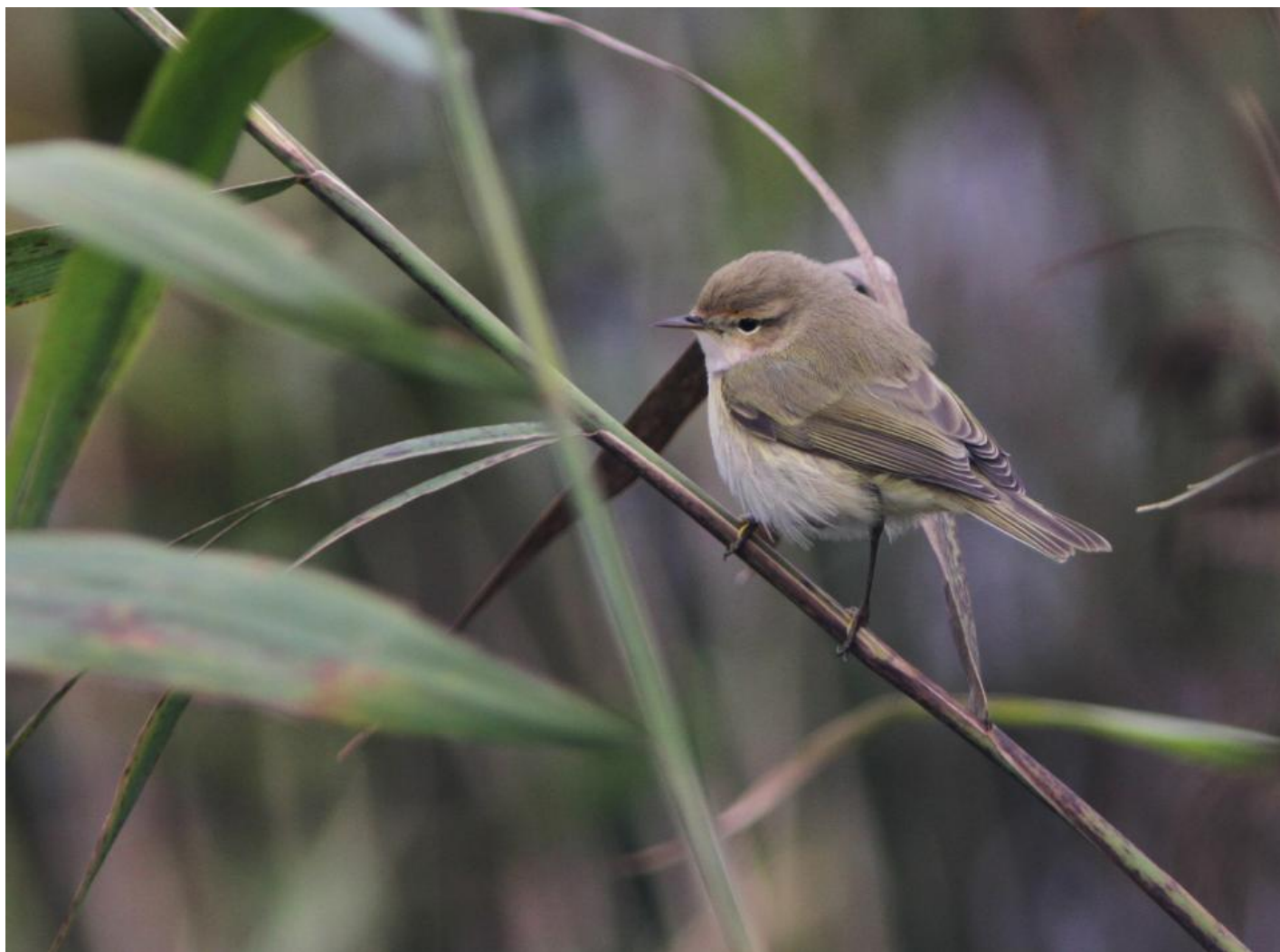
Sibirisk gransanger (fulvescens) ved Juvre, Rømø.

Eftermiddagen stod på fælleslusk på det yderste af Sønderstrand. En lang tur, som ti mand kastede sig ud i. Det blev til lapværlinger og en lille opskræmt værling, formentligt dværgværling, som dog forblev ubestemt.