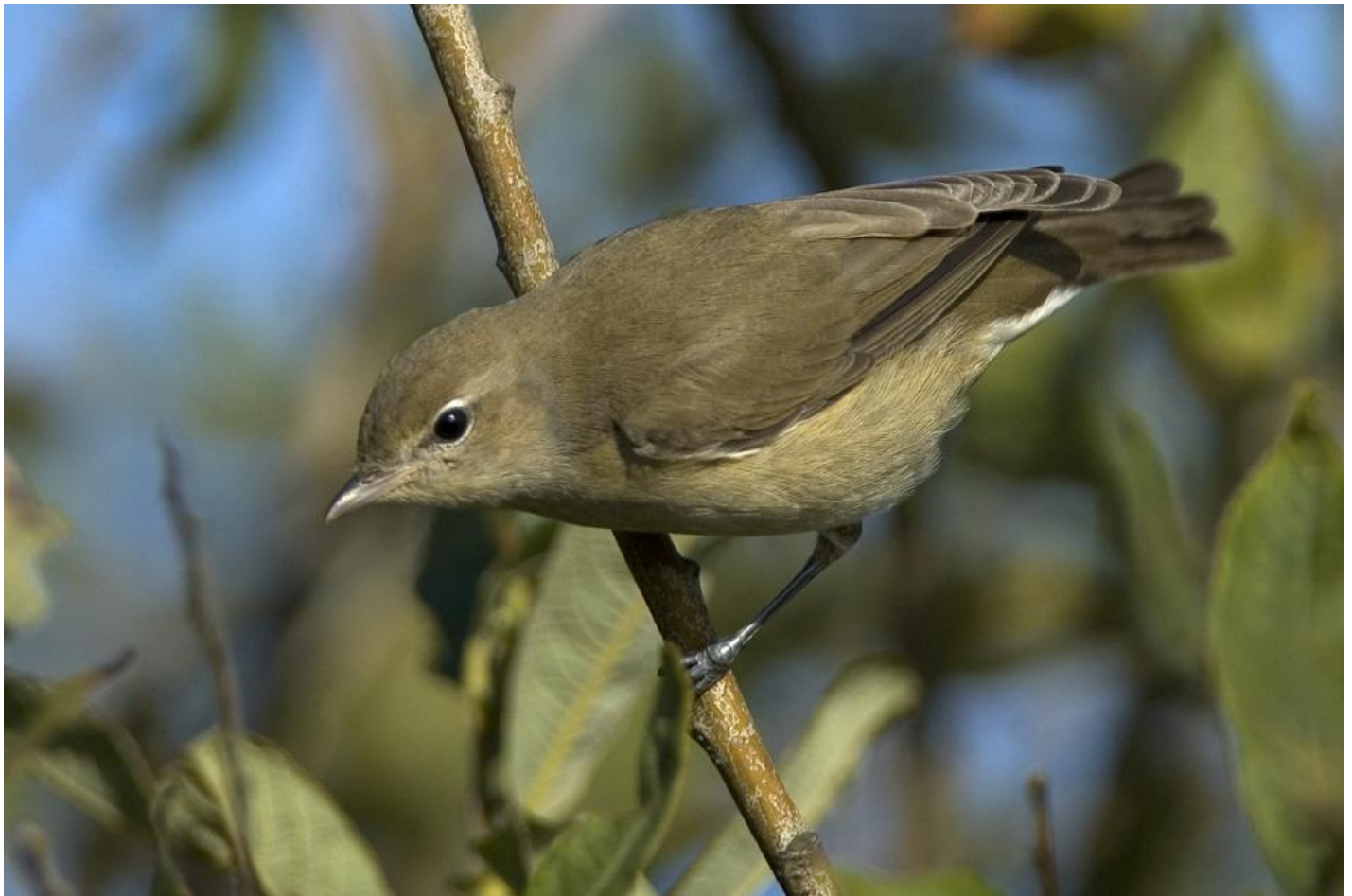
Havesanger. Plump, gråbrun sanger, der giver et anonymt indtryk. Kraftige mørke ben og næb, brunt anstrøg over brystet og grålige halsider er bedste kendetegn.

Havesangeren opdages som regel på sangen, der er en monoton pludren, uden egentlig udvikling i motiverne.