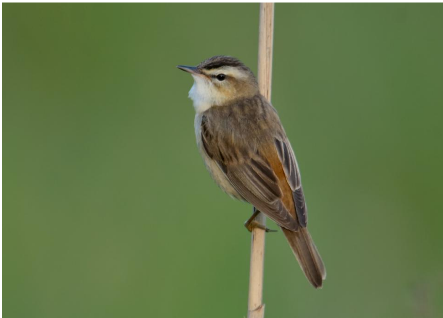
Sivsanger. Set godt er sivsangeren en meget smuk fugl med markerede ryg- og vingefjer, tydeligt øjenbryn og mørk kalot.

Sivsanger er en noget pænere fugl. Den har en markant ansigtstegning, med en sort stribe gennem øjet, lys øjenstribe og mørk kalot. Ryg og vinger er tegnet i brunt og sort, og således er sivsangerens dragt alt i alt meget mere kontrastrig end rørsangerens.