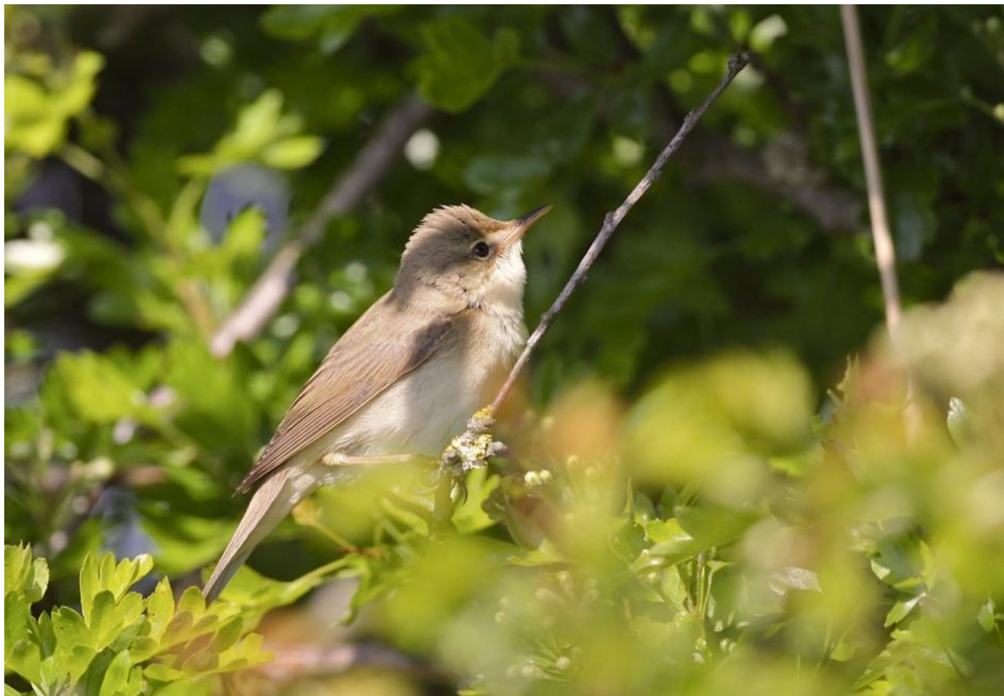
Kærsanger. Om foråret ser den ofte ud som en koldt farvet rørsanger. Rudbøl den 29. maj 2010.

Kærsangeren er den af vore sommergæster, der ankommer senest. Først fra midt i maj hører man kærsangerens fantastiske efterligninger fra buskadser og høj urtebevoksning i moser og kær.