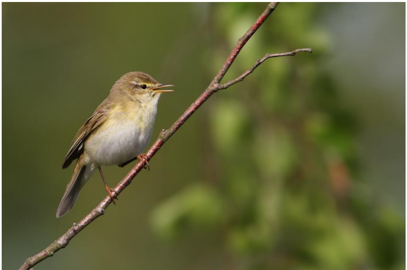
Løvsanger. Bemærk hvidlig bug og lyse ben. Gul øjenstribе er ret tydelig. Bastemose den 19. maj 2011.

Løvsangeren er den rigtige forårsbebuder indenfor sangerne. Hvor gransangeren ofte ankommer under vinterlige forhold i marts, er løvsangerens ankomst forbundet med perioden, hvor piletræerne sætter gæslinger og anemonerne blomstrer midt i april. Det hænger sammen med, at løvsanger er afrikatrækker, mens gransangeren overvintrer i Syd- og Vesteuropa, og til tider også herhjemme.