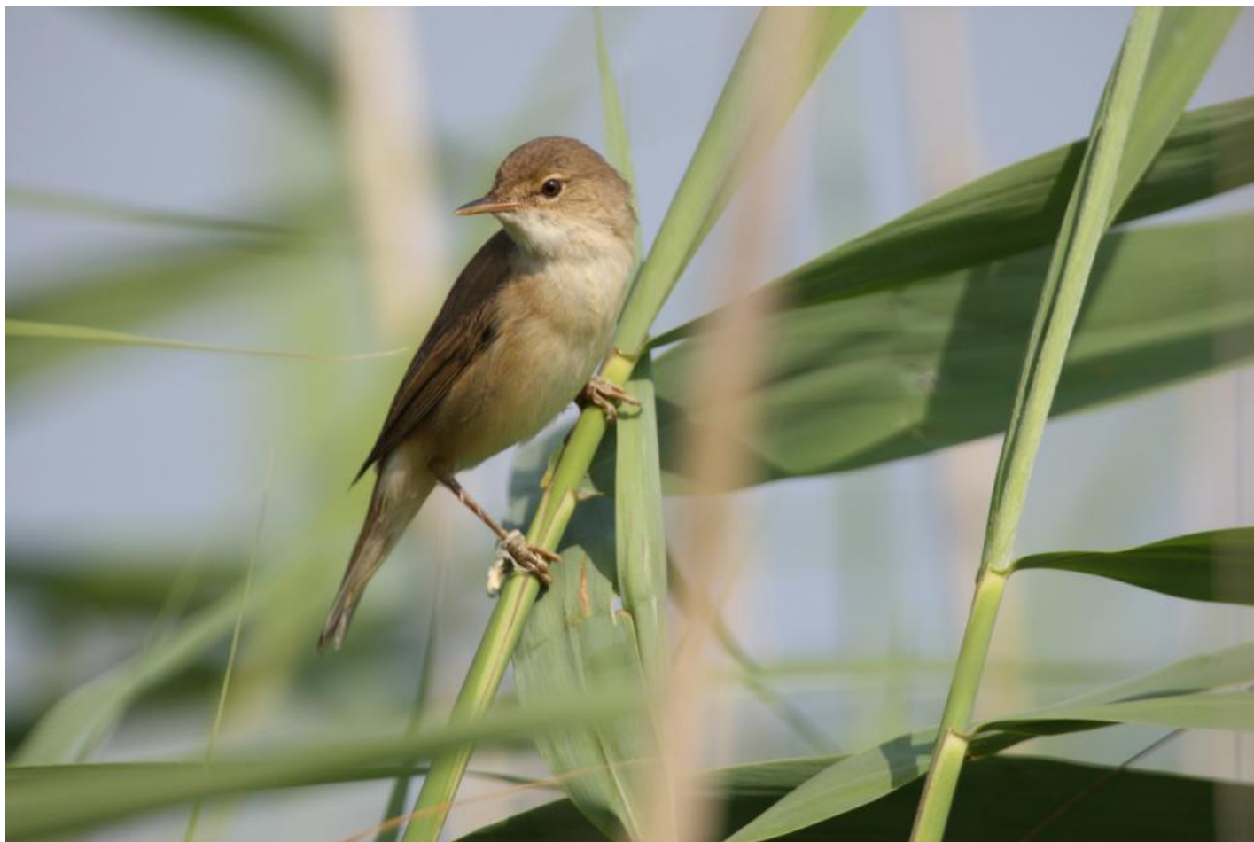
Rørsanger i sin typiske biotop. En mindre, langstrakt, rødbrun sanger uden tegninger. Hvidlig strube fremtræder som det lyseste på fuglen.

En bogstavering af rørsangerens sang kunne se sådan ud: ”trr-trr-trr-ti-ti-ti-ti-piu-piu-trrr-trrrr” og så videre i et utal af forskellige variationer.