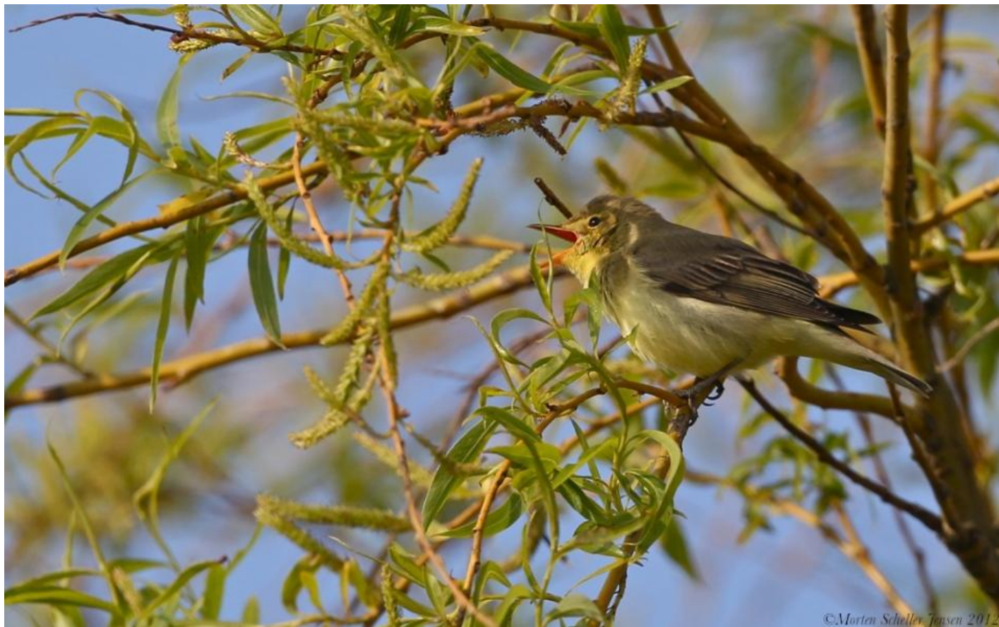
Gulbug. Grønbrun overside, gullig underside - det gule er dog ofte begrænset til struben, og bugen kan være mere hvidlig. Bemærk det lyse felt i vingen. Gedesby Strand d. 19. maj 2011.

Gulbugen er en langdistancetrækker med overvintringsområde i tropisk Afrika, og den ankommer sent til Danmark. Den optræder som regel i kystnært terræn, hvor den findes i såvel skov som krat.