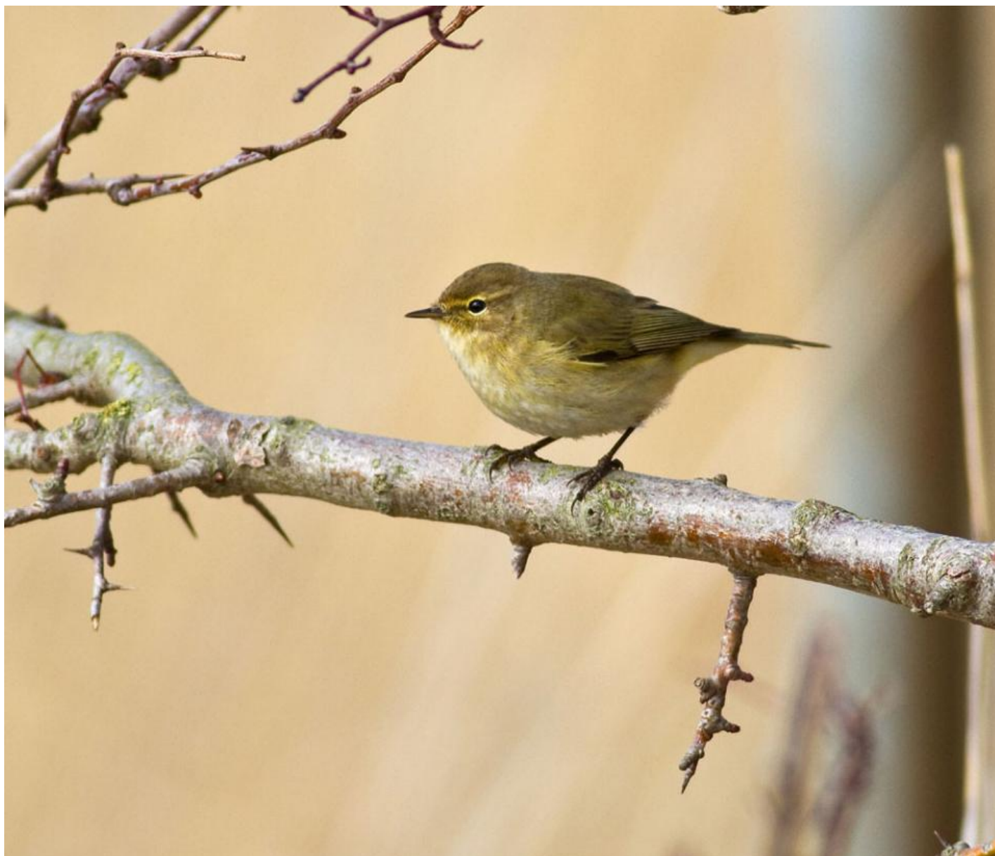
Gransanger. Bugen er mere gultonet end løvsangers og giver arten et mere "nikotingult" indtryk end den lysere løvsanger. Dette gælder dog kun om foråret. Benene er som regel sorte som på dette individ. Hyllekrog den 22. marts 2010.

Frem til den 10. april er løvsanger fænologiart på DOFbasen, og tidligere fugle bør både ses og høres i felten. I lune forår ankommer de første fugle til Sønderjylland en uge inde i april, og en løvsanger i marts er en teoretisk mulighed i forbindelse med et solidt varmfremstød sidst på måneden. Det er bare ikke set endnu.