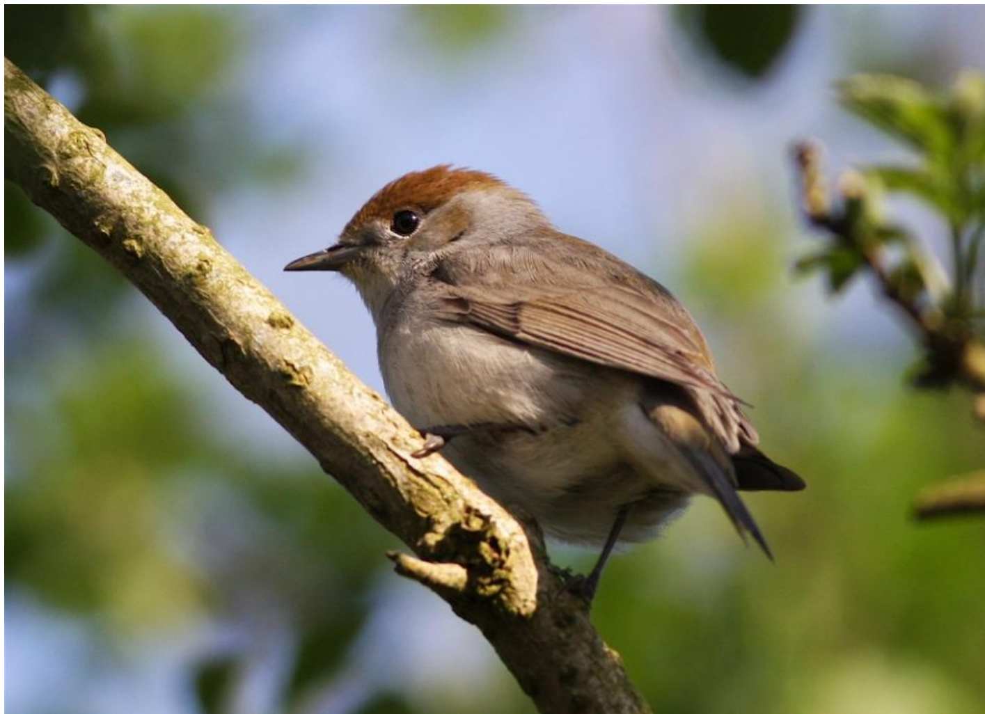
Munk hun. Brunligt anstrøg på undersiden og grålige halssider kan give mindelser om havesanger. Den kastanjarvede kalot kan være svær at erkende, hvis fuglen ses nedefra. Gedesby Strand den 3. maj 2008.

Havesangeren er en stor, lysebrun sanger uden munkens sorte hat. Hunner af munk, der også er lysebrune, men har en kastanjarvet kalot, kan – set dårligt – godt ligne en havesanger. Så det er vigtigt at være sikker på, at fuglen er set godt nok til at kunne udelukke en sådan.