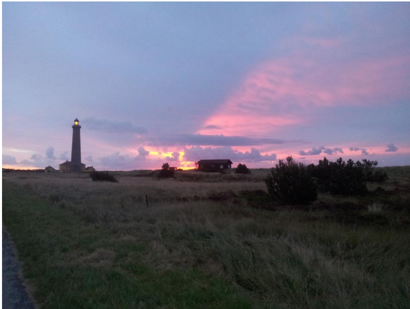
Det Grå Fyr blev brugt som base under Skagen Fuglefestival 2013.

Lokalafdelingen havde naturligvis været med fra starten, ligesom de fysiske rammer også fra starten havde været Det Hvide Fyr, som ligger til højre, når man kommer ud af byen mod Grenen. En romantisk lille historisk bygning, som dog var svær at sætte sammen med en festival af de dimensioner og på det ambitionsniveau, som gruppen ønskede.