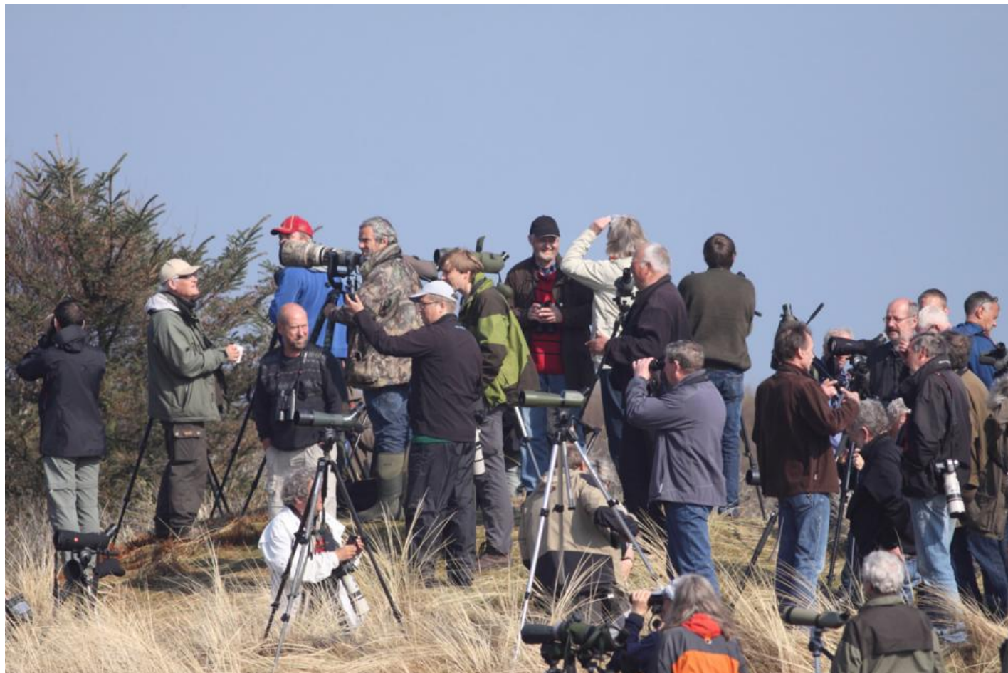
Der var trængsel på Sæftevandsbakken under Skagen Fuglefestival 2013, da en lille skrigeørn gik til rast - og senere overnatning - i Reservatet.

Størst opmærksomhed fik en lille skrigeørn, som var så venlig at ankomme sent om eftermiddagen og overnatte i Reservatet, således at stort set alle, som ville dét, kunne se den på fint hold.