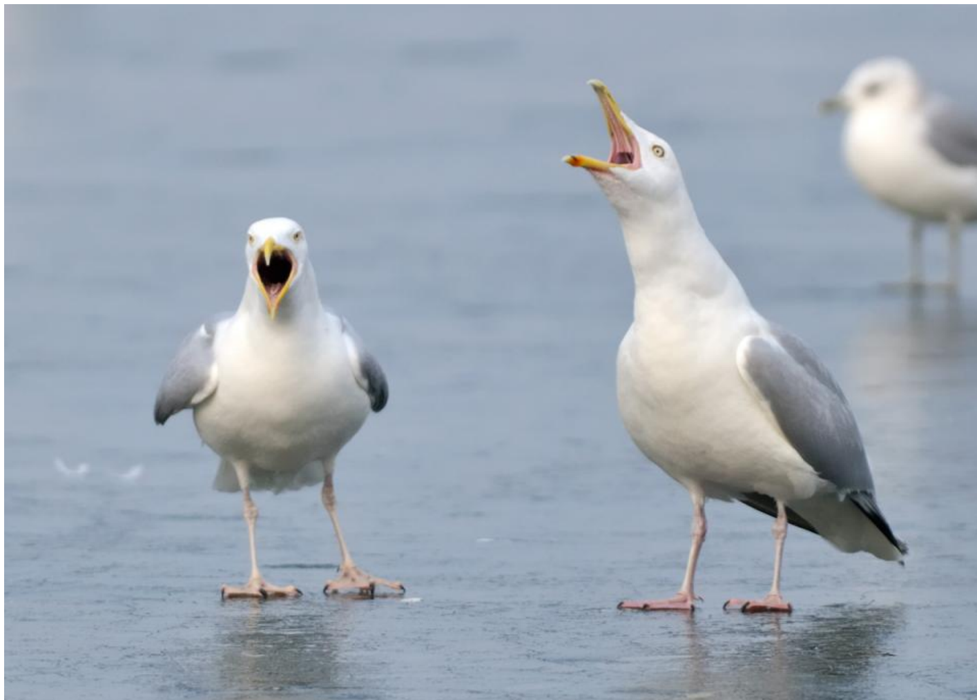
Det er primært mågernes skrig, der generer de danske byboer.

mågebestanden på grund af støjgener vidner i høj grad om, hvordan vi opfatter os selv i forhold til naturen, og om en fremmedgjorthed over for naturen hos moderne bymennesker.