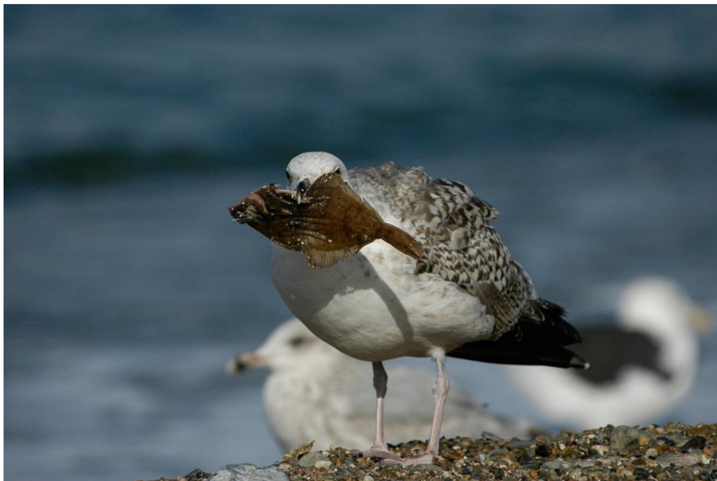
Måger er langt fra kræsne, men det er dog de færreste af dem, der lever af pizza. Her ses en ung svartbag ved Klitmøller med en fladfisk.

Hvis man skal se på mågeproblematikken med dette natursyn, betyder det, at der ikke er nogen grænse, som adskiller byen og kulturen fra naturen. Ligeledes er enhver ændring i arternes forekomst, som for eksempel mågernes indvandring i bymiljøer, naturlig og skal ikke per automatik reguleres.