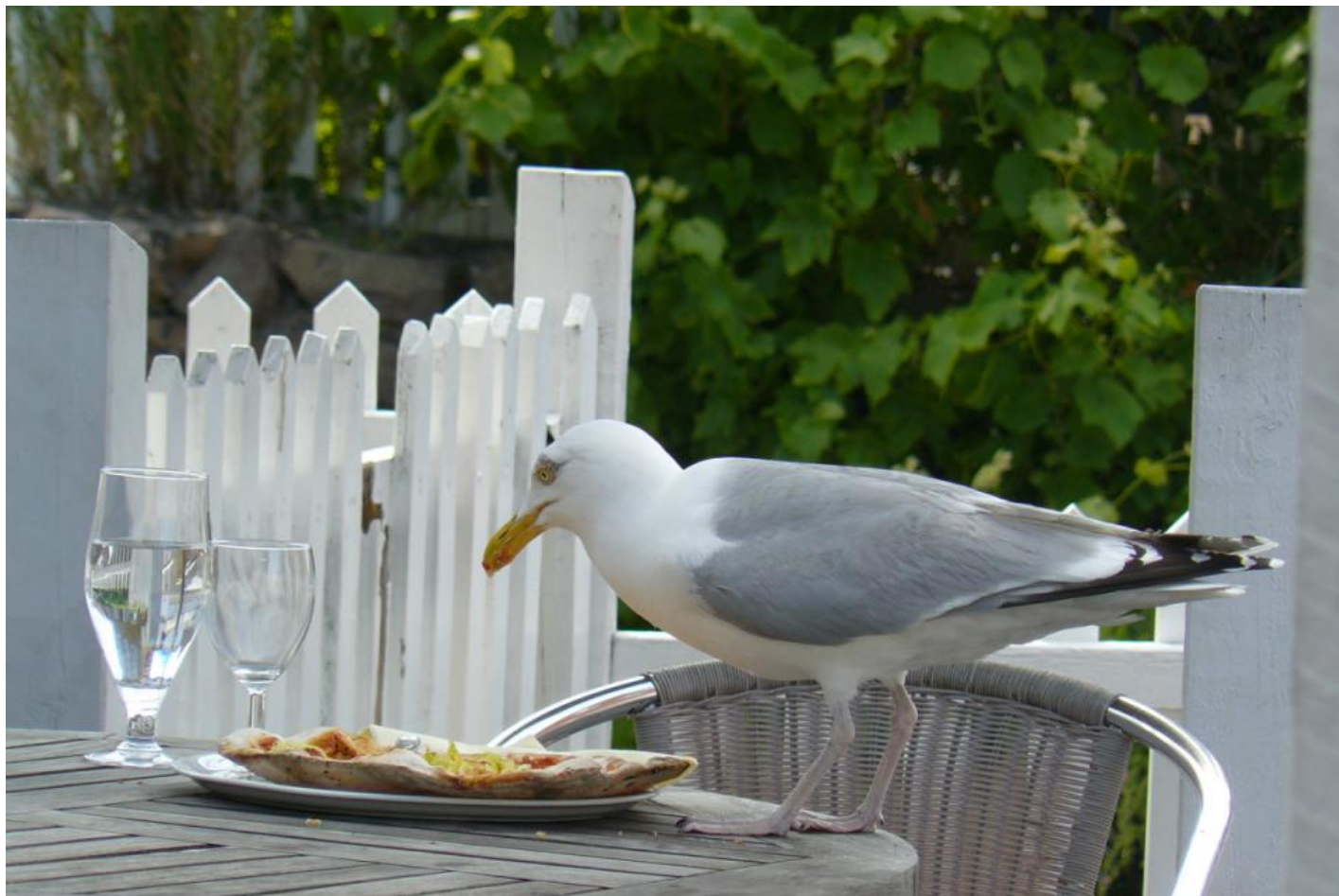
Sølvmåger er dygtige til at tilpasse sig, og de udforsker gerne nye spisesteder.

Naturen regulerer sig selv, og de steder den får lov til det, ser man ikke den samme ustabilitet, som præger de områder, som er manipulerede af menneskelig indblanding. Naturen har trods alt klaret sig selv uden vores hjælp i millioner af år.