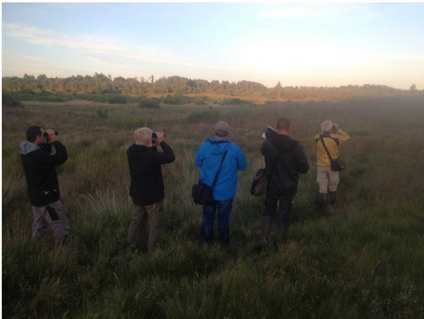
Her ses en flok deltagere i fuld gang med at føje observationer til de tomme kvadrater, som blev dækket under atlaslejren i juni 2014.

Atlaslejrens formål var at dække de almindeligt udbredte ynglefugle i kvadrater, der ikke forventes besøgt på almindelig vis, og som er uden kvadratansvarlige.