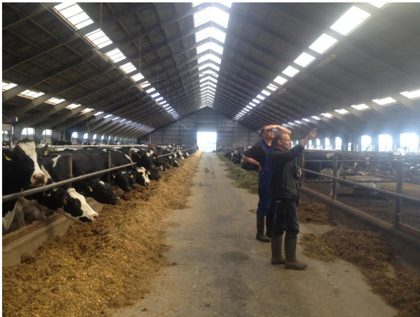
Denne landmand (bagest) fremviste staldens ynglefugle.

Under aftenmaden blev der livligt fortalt om dagens mest interessante ynglefund, mens maden fra den nærtliggende kro blev nydt med velbehag efter mange solfyldte timer i felten.