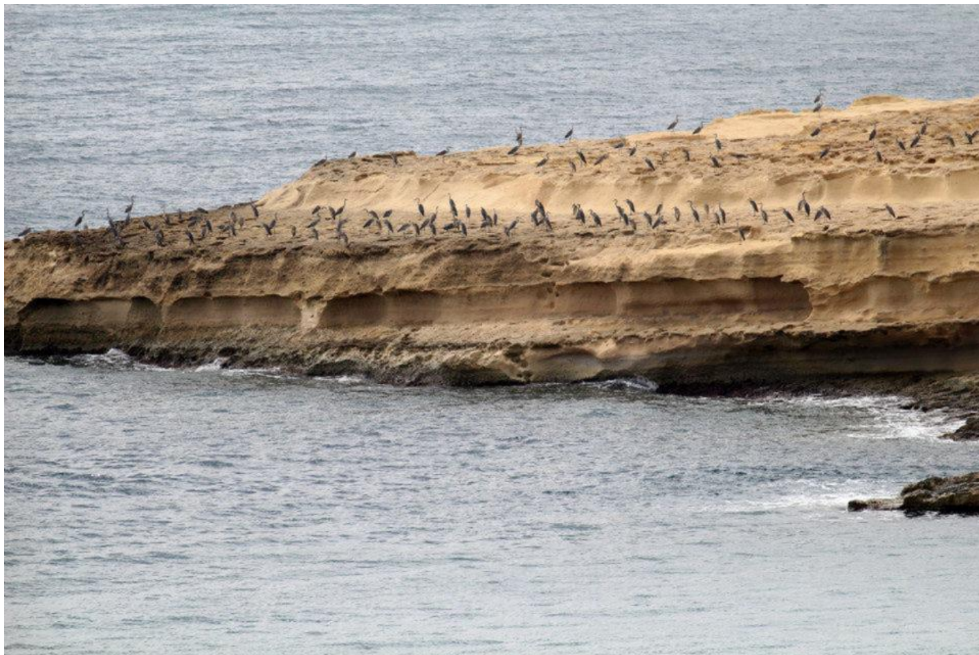
Her ses et udsnit af de mange fiskehejrer, som stoppede på Malta.

Vores team blev i området og holdt øje med dem middagen over i tilfælde af, at der skulle ske dem noget på trods af jagtforbudet. Vi blev der således, indtil et andet hold kom og overtog.