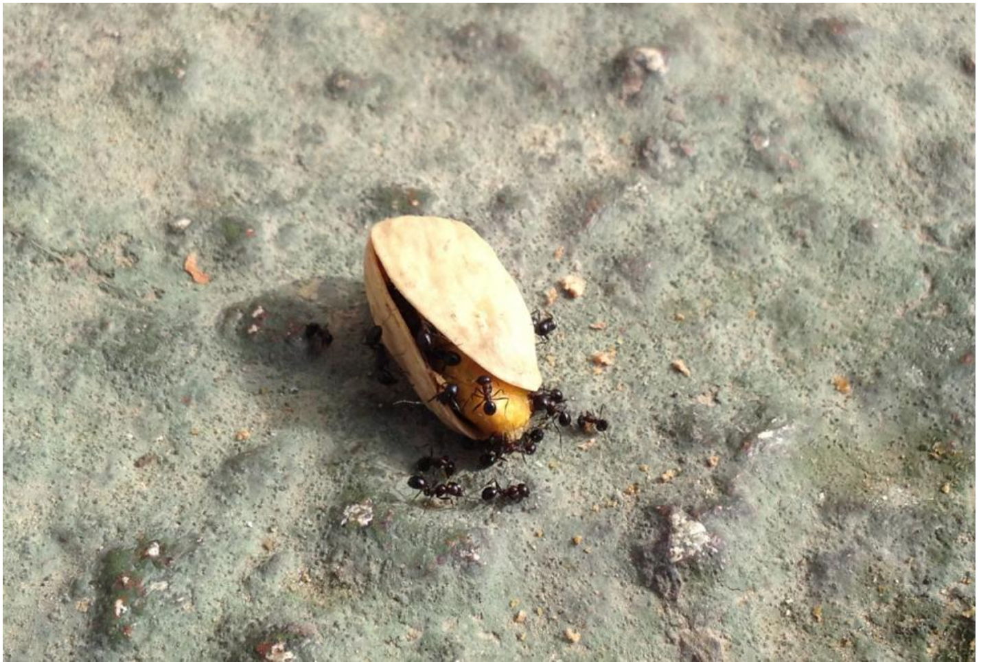
Man kan få tiden til at gå med mange ting på Malta - for eksempel med at observere de lokale myrer. Her er en optimistisk flok fotograferet ved Gharghur.

Så man bort fra den enorme mængde skrald, der fandtes over alt i det maltetiske landskab, var der mange interessante planter, insekter og krybdyr. Jeg fornøjede mig meget en morgen, hvor der var meget få (læs: ingen) fugle i området, med at følge en flok myrer i færd med den umulige opgave at transportere en stor pistacienød til deres bo.