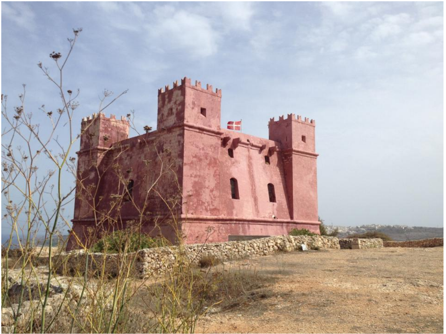
Her ses det røde tårn, Red Tower (som faktisk hedder St. Agatha's Tower).

Her var vi så heldige at se to fiskeørne ( Pandion haliaetus ) svæve i vindene forholdsvis tæt på os, og vi nød at følge dem i den tid, de var der.