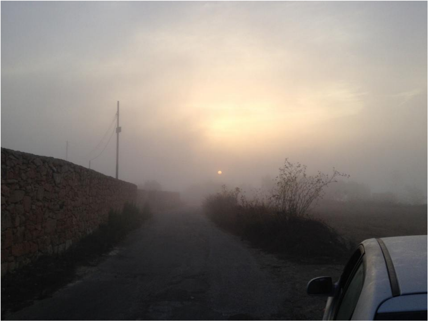
Billedet her er taget en tåget morgen ved Victoria Lines under en tidlig vagt.

Efter knap fem minutter i området havde vi den fantastiske oplevelse at se en purpurhejre ( Ardea purpurea ) lette på vores venstre side, hvorefter den fløj lige hen over hovederne på os.