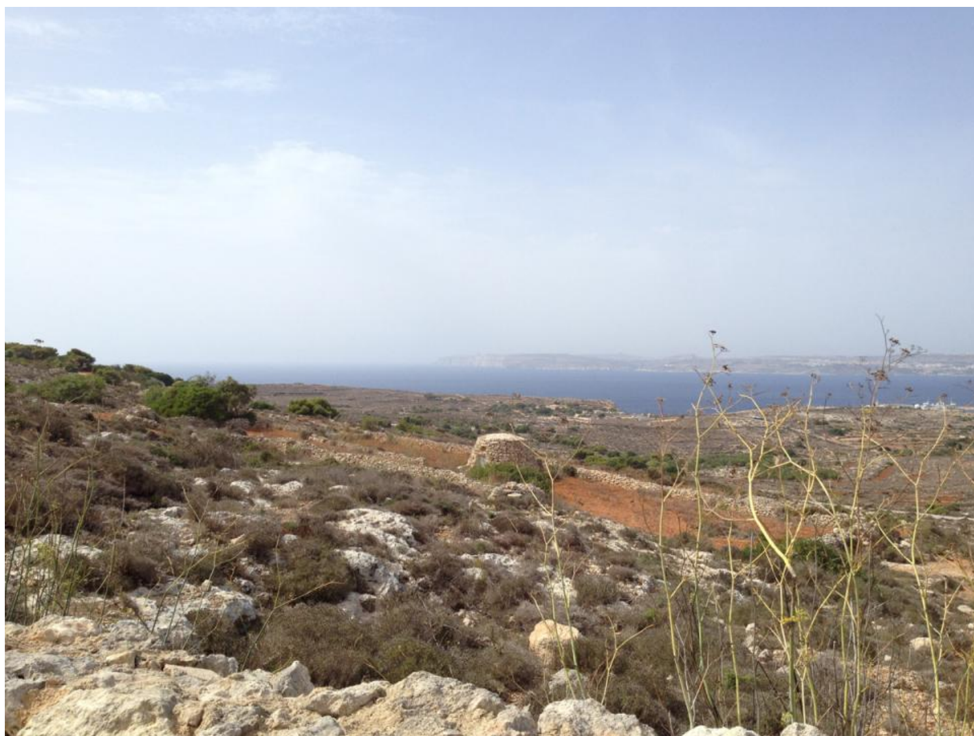
Her ses et jægerskjul på skråningen lige ved Red Tower.

Da BirdLife Malta i 2007 gik i gang med at organisere forårs- og efterårslejre mod krybskytteriet, kom der næsten udelukkende internationale deltagere, fordi malteserne ikke turde møde op af frygt for repressalier i deres lokalsamfund.