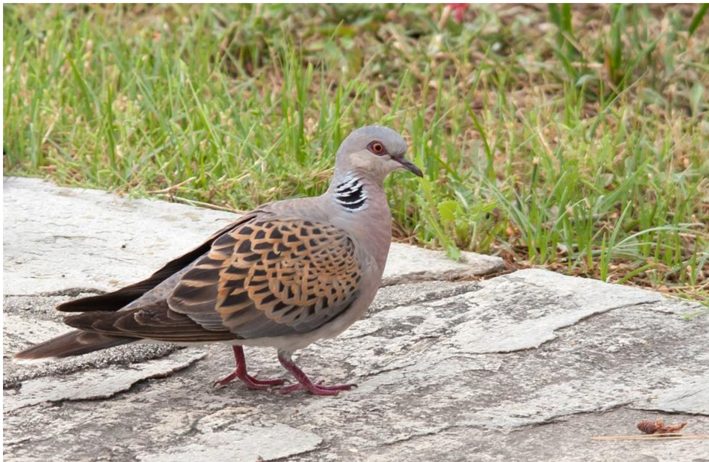
Turtelduen er i tilbagegang i store dele af Europa, men den må altså fortsat skydes på Malta om foråret.

Selv om resultatet ikke indebærer nogen ændring i jagten på Malta, som den er foregået længe, er resultatet selvfølgelig en stor skuffelse for de 14 grønne organisationer, som sidste år fik indsamlet over 40.000 underskrifter og dermed tvang regeringen til at udskrive folkeafstemningen i et håb om at få Malta bragt i overensstemmelse med fuglebeskyttelsesdirektivet.