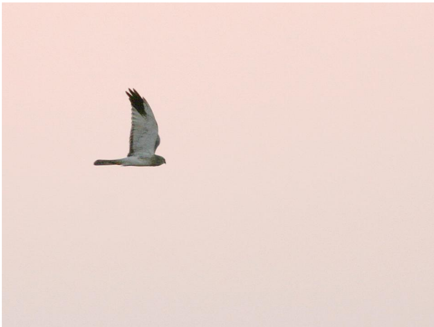
Steppehøg 3K han. Med så mørkt hoved og så tydelig mørk bagkant på armen, kan man benævne sådanne som 3K. Velavadar, Gujarat, Indien, feb. 2013.