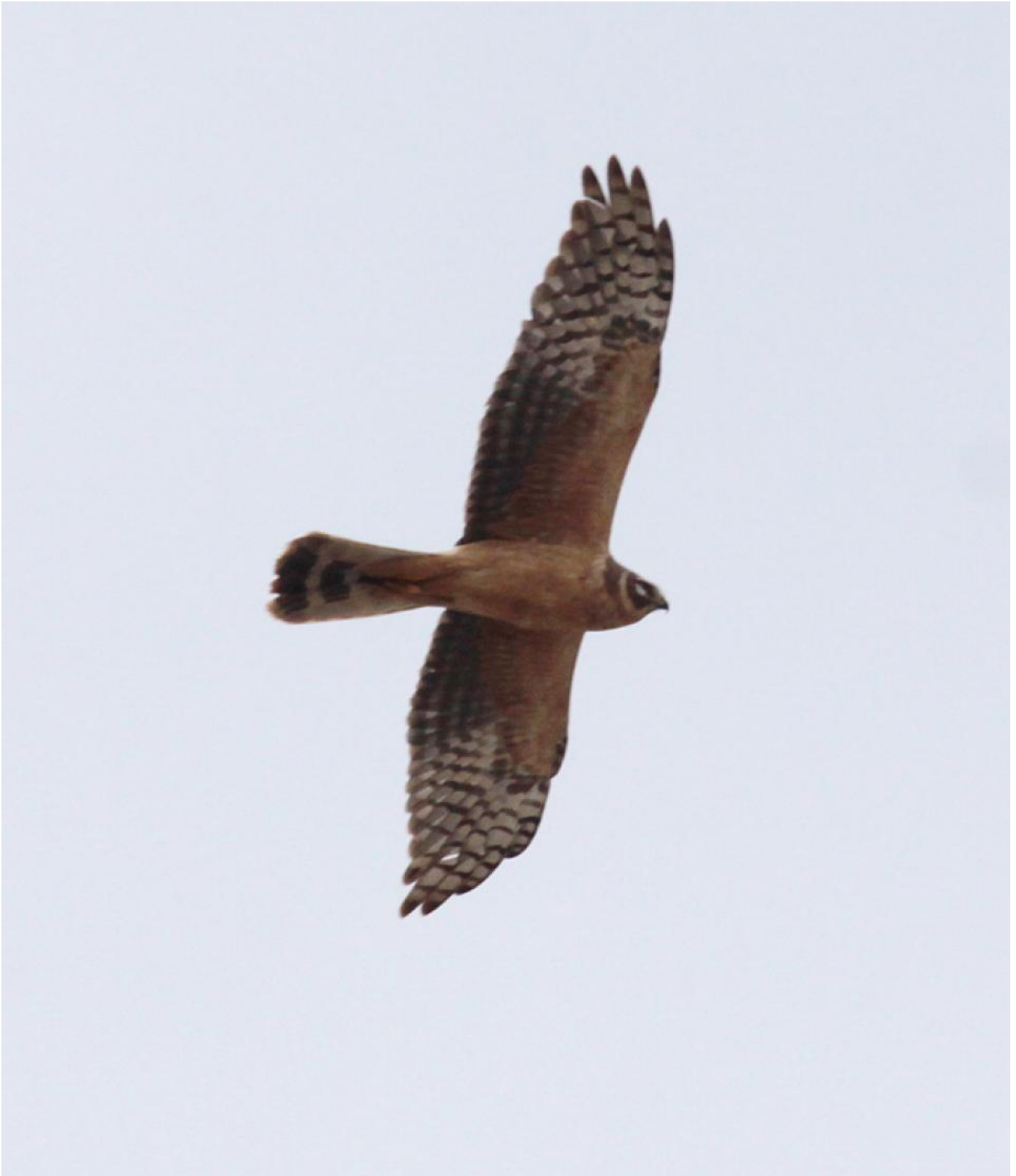
Steppehøg juv. (2K) hun. En del hunner har fyldigere inderhånd end hannen, og får derfor en form, der minder om hedehøgens. Vingerne - især hånden - er dog fortsat kortere. Ungfuglens typiske hovedtegninger ses, ligesom den grå bagkant på hånden. Hele dragten er fortsat juvenil, og er hos især hunnerne bevaret ganske fint vinteren igennem; denne fugl er mere rusttonet end de fleste, ala hedehøg. Skagen, Danmark, maj, 2013.