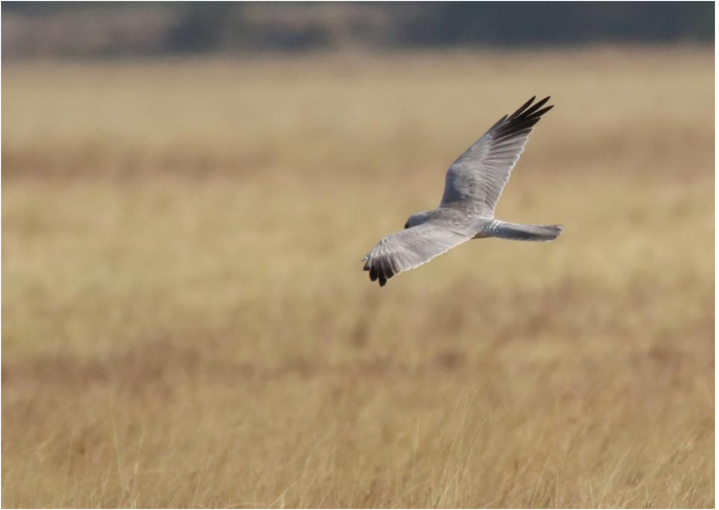
Steppehøg adult han. Spids hånd imod bred arm giver en falkeagtig fremtoning. Oversiden er mere ensartet og lysere end blå kærhøgs, kun med antydet gråtonet kile i hånden samt tværbåndet overgump. Velavadar, Gujarat, Indien, dec. 2013.