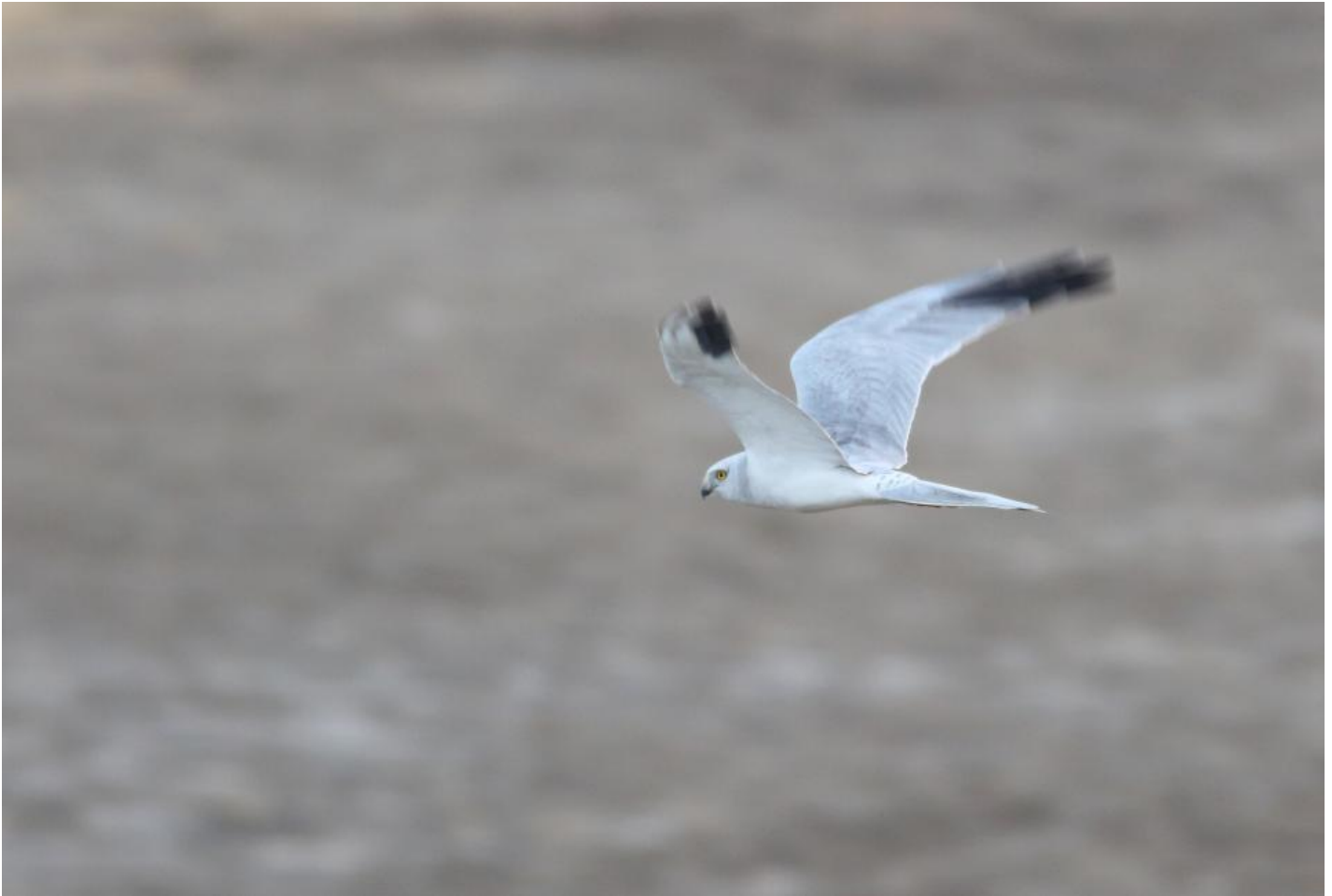
Steppehøg adult han. Her er en af de rigtigt hvide, "klassiske" hanner, men de udgør tilsyneladende et mindretal. Velavadar, Gujarat, Indien, dec. 2013.

Denne artikel behandler felt- og aldersbestemmelse af steppehøgen. Et vist kendskab til kærhøge er ønskeligt, da en komplet redegørelse for kendetegn fra blå kærhøg og hedehøg er tids- og pladskrævende. Der henvises især til "Rovfugle i Felten", til plancherne i "Fugle i Europa, Nordafrika og Mellemøsten" og til den sorte version af "Fugle i Felten". Andre anvendelige kilder er Gensbøls rovfuglebog, Flight Identification og Forsmans rovfuglebøger.