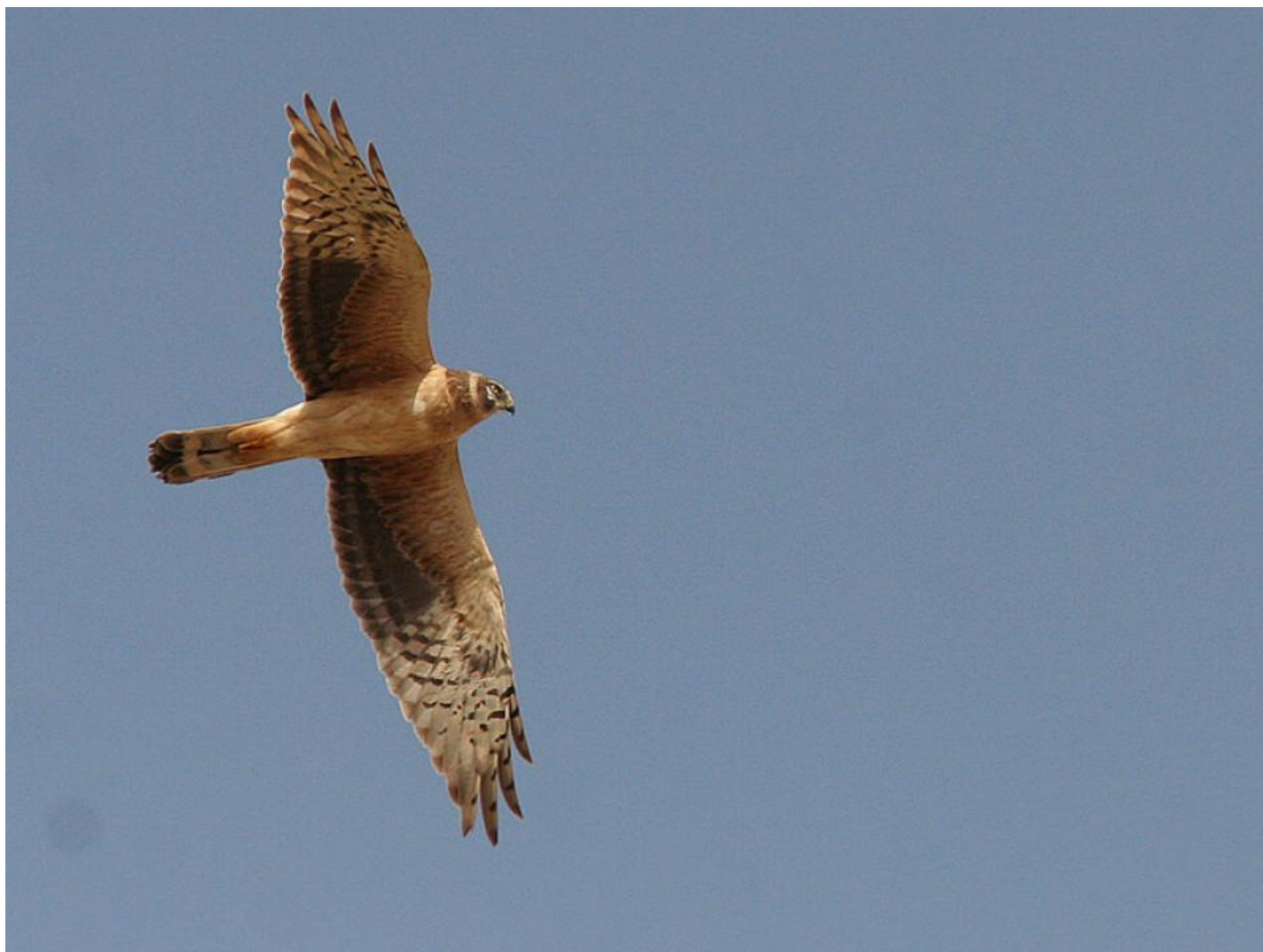
Steppehøg 2K han. Undersiden er om foråret afbleget til beigetonet, især hos hannerne, og hovedtegnningernes sorte partier falmet til brunlige, hvilket dog ikke gør kontrasten mindre. Bemærk spids hånd med grå fjerspidser. Yotvata, Israel, marts 2007.

Steppehøgen bevarer sin juvenile dragt bedre end hedehøg, der allerede i december kan være stærkt afbleget, og som i løbet af vinteren fælder langt mere omfattende. De fleste hedehøge ses om foråret i en "mellemdragt", hvor f.eks. hoved, dele af underkroppen (især fortil) og en del dækfjer samt armhuler kan være skiftet. Dette gælder også oversiden, der rummer nedslidte partier vekslende med nye friske fjerpartier på ryg og overvingedækfjer. Desuden er mellemste halefjer udskiftet hos 9 ud af 10, men svingfjerene og resten af halen er bevares fra juvenildragten.