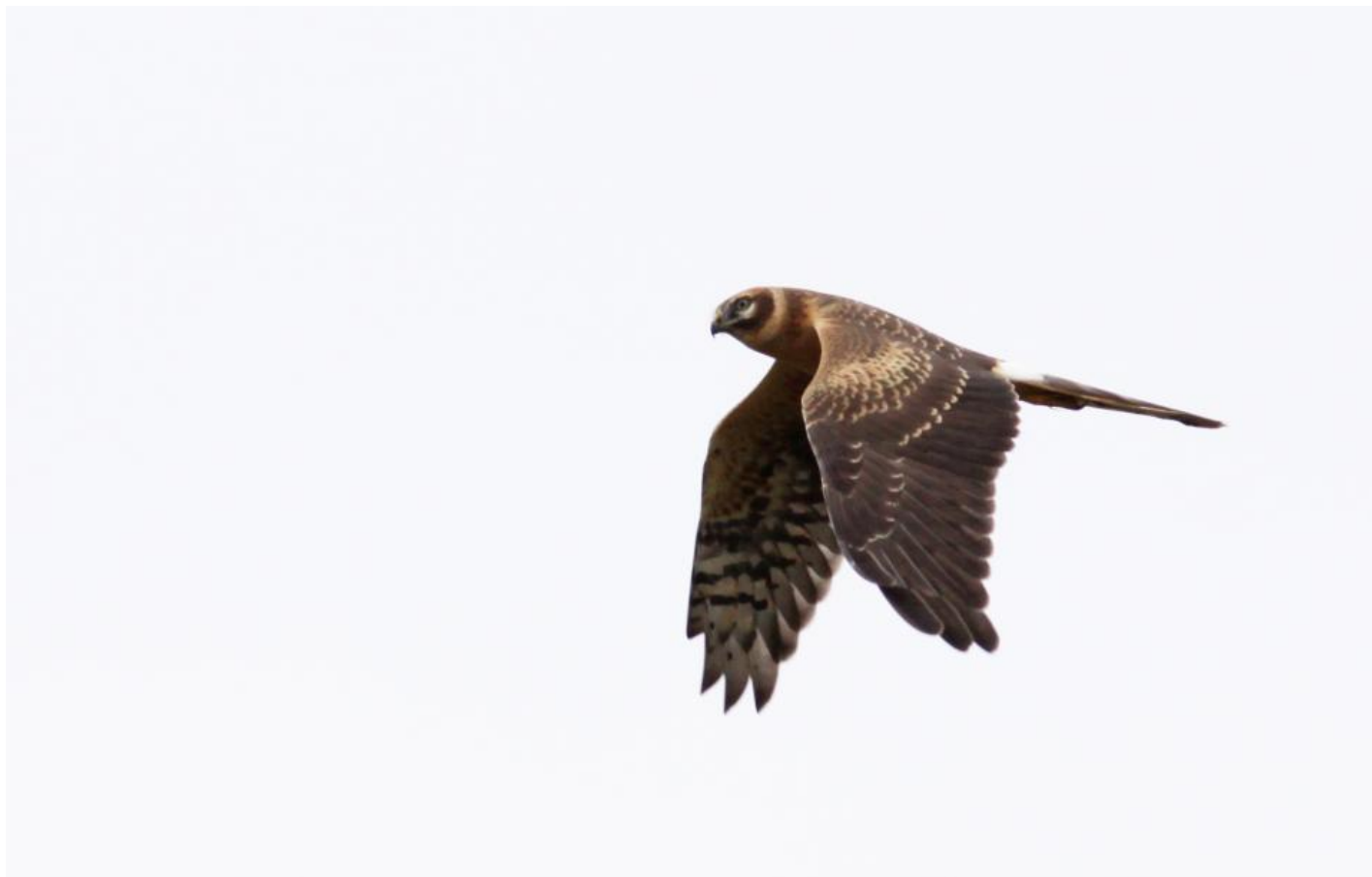
Steppehøg juv. han (1K). Gult øje på en 1K kærhøg = han. Her ses de meget tydelige gullige felter på overvingen - oval på armen og spidser af store dækfjer, der generelt er kraftigere og tydeligere end hos andre kærhøge. Falsterbo, Skåne, Sverige, sept. 2011.

Foruden form og proportioner afviger hedehøg ved en mere ræverød underkrop – orange med en brun, ikke gul undertone. Hyppigere ses lette striber på forkroppen samt antydning af tværbånd i armhulen. Hovedet afviger normalt med at have brede hvide felter omkring og bag øjet, som en hvid hummerklo eller snebriller, og det giver den unge hedehøg et årvågent og nysgerrigt ansigtsudtryk. Lyst dominerer, og mørk tegning på kinden er smallere, når næsten ikke mundvigen og danner en brun bue bag de hvide tegninger. Nogle har mørkere halssider – halstørklæde – men det er normalt brunere og kortere end steppehøgens. I nogle tilfælde kan det være bredere og derved kan der opstå en bred, lidt diffus ”falsk” halskrave”, der er af farve som underkroppen, men kan være ganske bred. Den er dog normalt kraftigst på halssiderne og går sjældent hele vejen rundt – man får snarere fornemmelsen af, at der ikke ville have været den mindste antydning til halskrave, hvis ikke der havde været mørkt halstørklæde.