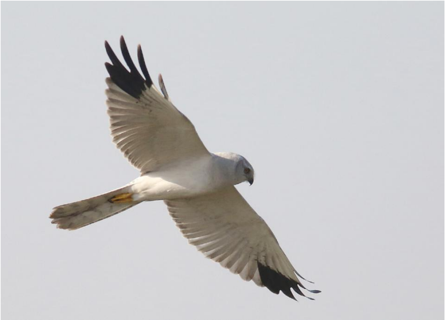
Steppehøg adult han. På afstand hvid med sort kile og let bestemt; på dette nærfoto ses en af de hyppige små afvigelser fra normen; yderste håndsvingfjer har fine tværbånd. en enkelt "afvigende" alderskarakter er ret normalt indenfor i øvrigt rent adult tegnede fugle. Velavadar, Gujarat, Indien, dec. 2013.

Hedehøg han er så afvigende, at den ikke behandles her. Blå kærhøg har bred sort vingspids og vingebackant på de bredere vinger, og altid bred hvid "sukkerknald" på overgumpen. En han kærhøg med meget lys overside, sort kile i hånden omgivet af hvidt og uden mørk bagkant på hånden er en steppehøg.