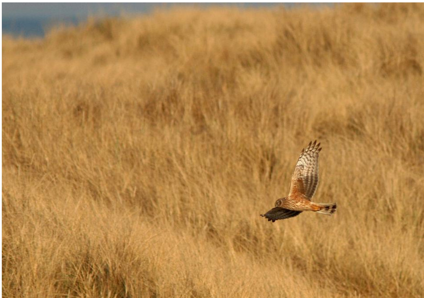
Blå kærhøg 2K han. Fuglen med lidt varmere tonet underside samt tydelig lys boomerang omkring knoen må da være steppehøg? - NIX: fuglen har sribet underkrop, for lyse tegninger gennem armsvingfjerene samt sorte fingerspidser. Fuglen er en han, da den havde skiftet de mellemste halefjer til rent grå. Skagen, Danmark, maj 2006.