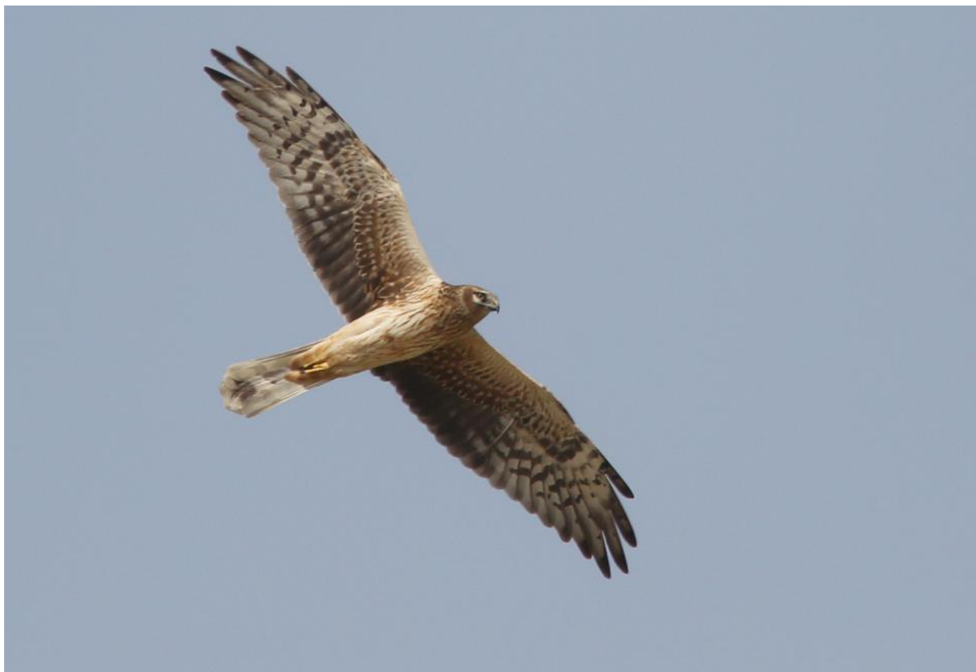
Steppehøg adult hun. Bemærk den lysere og mere distinkt tegnet underkrop, lysegule øjne (hos 4K+) samt håndens typiske tegning med manglende mørk bagkant inderst, diffuse grå fingerspidser og mørkt "børringevågekomma" om knoen. Armsvingfjerenes lyse tegning forsvinder gradvis ind mod kroppen. Eilat, Israel, april 2014.

Hovedtegningerne varierer, men er svagere end de juveniles, og den lyse halskrave tit svag og mørkpletet. Den kan til og med mangle, og den vigtigste karakter bliver da mørkt ansigt, blot med smal hvidt øjenbryn og hvid plet på kindens bageste del. Oversiden er mørkebrun med lys oval over armen, men mørk og næsten utegnet håndflade. Overgumpen er hvid, men mange har artstypiske mørke tværbånd, der dæmper overgumpens hvide felt. De adulte hunner har lysegule øjne.