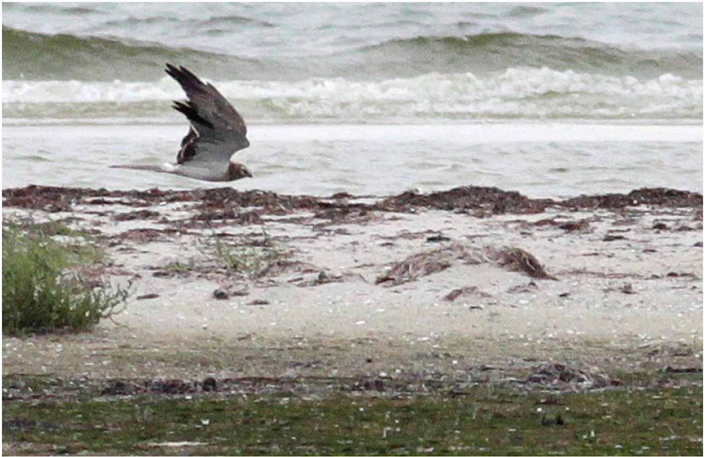
Steppehøg 2K han. Tydelige mørke hovedtegninger og indslag af mørke armsvingfjer samt mørkegrå overside og hvid midterdel af overgumpen er alle karakterer på 2K han efterår. Falsterbo, Sverige, aug. 2013.