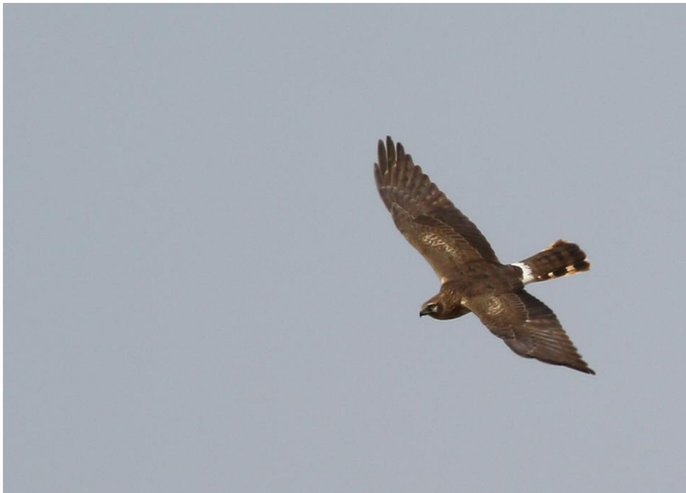
Steppehøg adult hun. Overvingen er mørkere med mørkere, mere ensartet hånd end hedehøgens, og hovedtegningerne mørkere med vredt øjenbryn og isoleret hvid plet bagerst på den mørke kind. Yotvata, Israel, marts 2014.

Blå kærhøg ligner steppehøg hun i tegningerne, og bestemmes bedst på flugt og proportioner. Dragtforskellene er ret små. Underkroppen har normalt bredere mørke striber, ofte bredest midt på, der når undergumpen. På undervingen har armsvingfjerene gennemgående lysere bånd, og de fem synlige fingre skarpt afsatte sorte spidser. Og det er netop hånden, med dens brede spurvehøgeform, der er den allervigtigste karakter. En kærhøg med hånd som spurvehøg er altid en blå kærhøg. Og en kærhøg med "falkespids" hånd mod bred arm er en steppehøg. På oversiden er blå kærhøg ret lig steppehøg, men med tydeligere mørke tværbånd på lysere hånd, svagere lys oval over armen (kan mangle hos begge) og bredere hvid overgump, som sukkerknald.