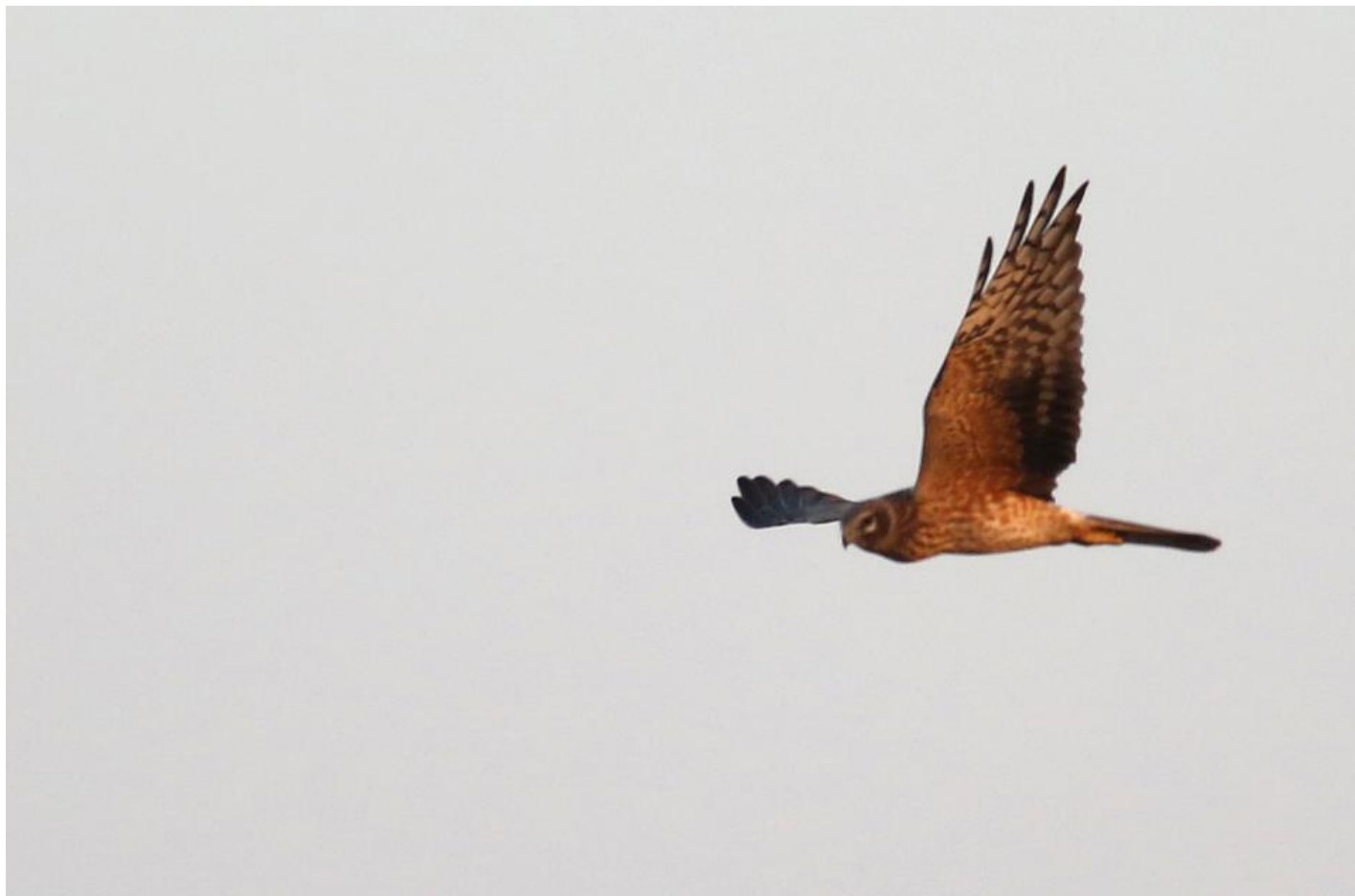
Steppehøg 2K hun. I dragten som adult hun, men varmere farvet, og her med tydeligere hovedtegninger. Velavadar, Gujarat, Indien, dec. 2013.

For kendetegn fra andre arter, se under adult hun. Bemærk, at blå kærhøg om efteråret (især 2K) kan være ret lig i dragten. På efterårstrækket kan de have ufældende eller manglende (grundet fældning) yderste håndsvingfjer, og derved en mere tilspidset vingeform end den klassiske. De bestemmes da på bredere inderhånd, bredere hoved og krop, bredere hale og lysere gennemgående bånd gennem armsvingfjerene. Oventil har blå kærhøg bredere hvid overgump, men svagere lyse ovaler over armen end steppehøg.