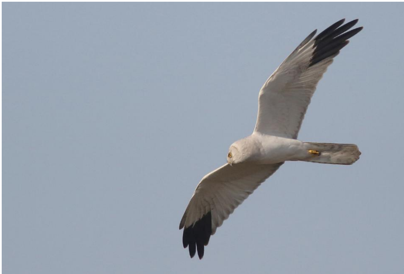
Steppehøg adult han. Rent tegnet adult, kun med svage antydninger af hovedtegninger. Sort kile er isoleret på alle sider af hvidt. Velavadar, Gujarat, Indien, dec. 2013.