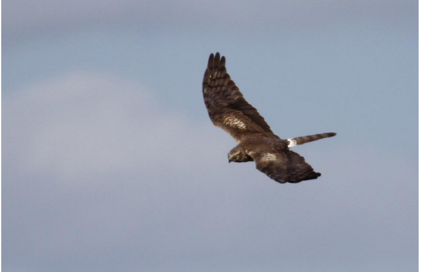
Hedehøg adult hun. Lyse ovaler på overvingen og kun smal hvid overgump kendetegner steppe- og hedehøg. Håndfladen har tydeligere mørke tværbånd, og fremstår som lysere end steppehøgens. Schleswig-Holsten, Tyskland, maj 2010.

oventil et mørkere panel mod brun vinge. Den hvide overgump er ofte smal, og reduceres tit af mørke pletter eller baser/spidser.