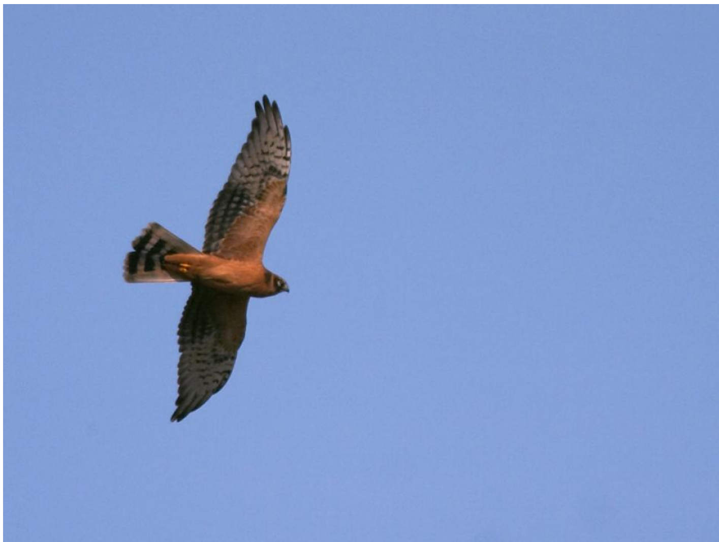
Steppehøg. Bemærk den tydelige S-formede vingebagkant med udbuget arm og indsuget hånd - en form, der er unik indenfor kærhøgene. Forkanten af vingen er helt lige og hånden ganske smal og spids. Velavadar, Gujarat, Indien, feb. 2006.

Prøv i øvrigt at studere høgen når den kommer mod én, hvor den er en let kærhøg, til den har passeret og forsvinder. Set bagfra bliver hånden spidsere og reelt falkeagtigt; noget lignende kan faktisk ses hos blå kærhøg, hvis hånd på forbiflyvende fugle kan synes tilspidset. Den passive glideflugt på løftede vinger over land kendetegner begge de lette kærhøge, steppe- og hedehøg. Overgår fuglen til at trække over havet bliver flugten dog ganske anderledes og arbejdsom med lange slagserier, der mere ligner blå kærhøgs. De små hanner jager tit småfugle, og det foregår ved en lav overraskelsesflugt med hurtige, tårnfalkeagtige vingeslag og elegante manøvrer. Ofte søger høgen da langs et levende hegn eller en træække for at snige sig ind på småfugle, ala spurvehøg. Denne jagt foregår ofte af en fast rute.