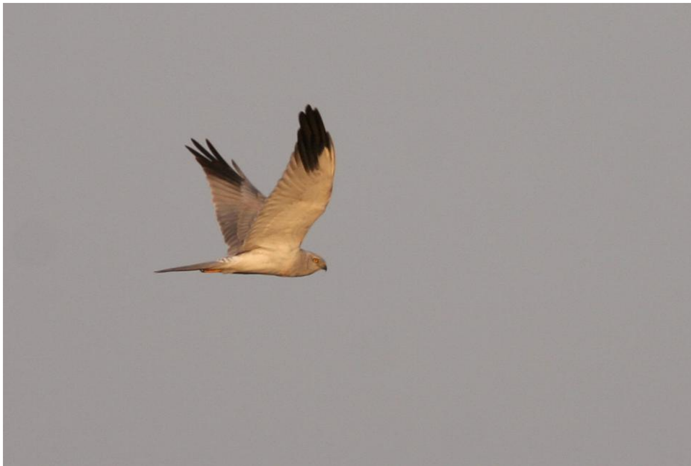
Steppehøg adult han. Trods det lidt mørkere hoved er der ikke andre immature kendetegn. Bemærk den jævnt tværbåndede overgump og vingekilen, der er sort undertil og gråtonet oventil. Little Rann of Kutch, Gujarat, Indien, feb. 2006.