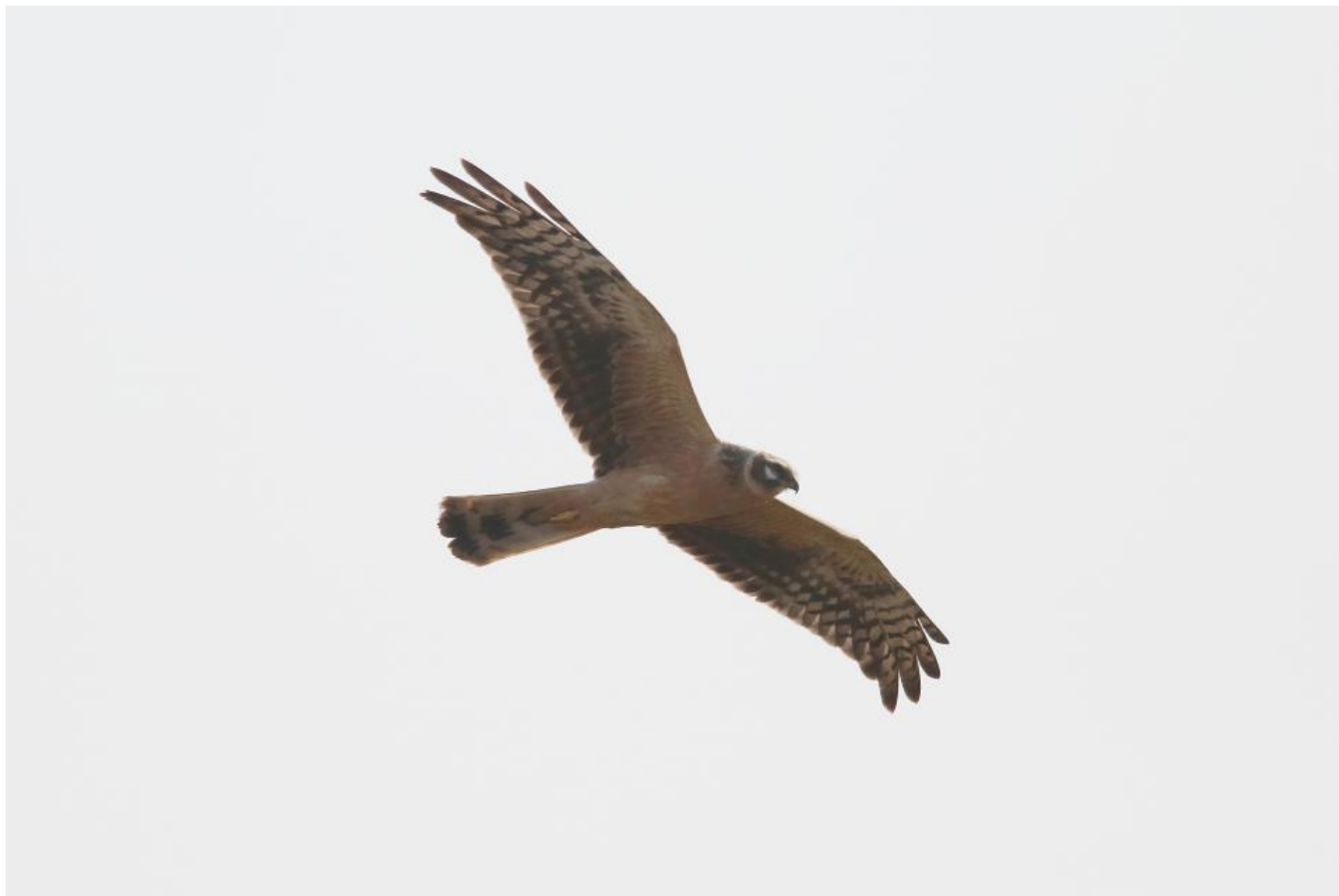
Steppehøg juv. (1K). Typisk individ med de kraftige sort/hvide hovedtegninger, som denne art kan fremvise. Gujarat, Indien, dec. 2013.