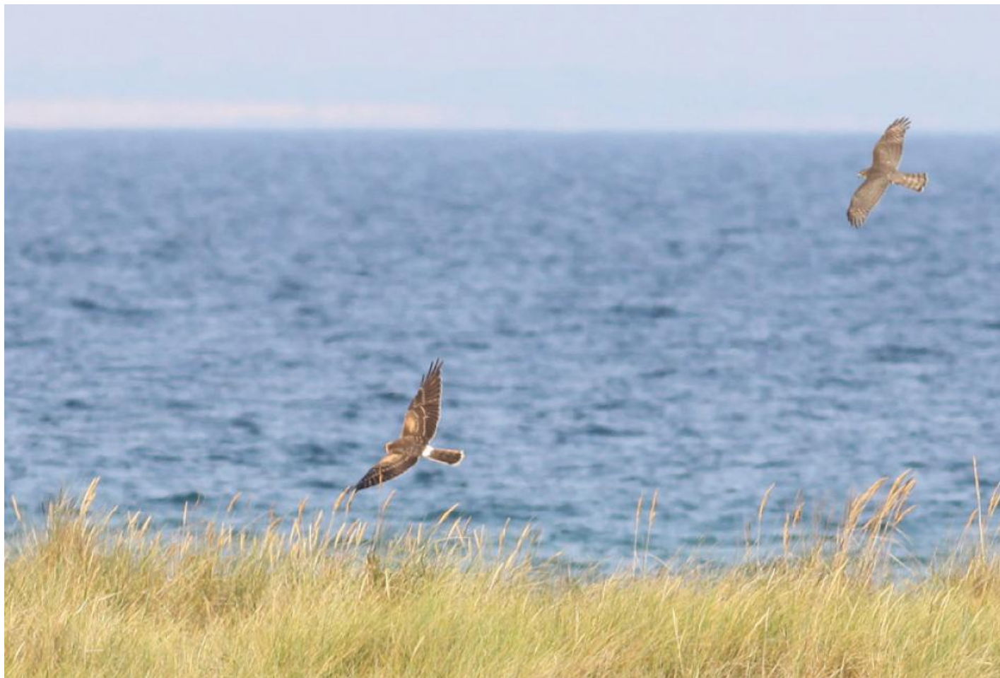
Steppehøg juv. han. Bemærk oversidens tegninger samt den lille størrelse - nogle hanner er næsten så små som store spurvehøge! Falsterbo, Sverige, sept. 2007.