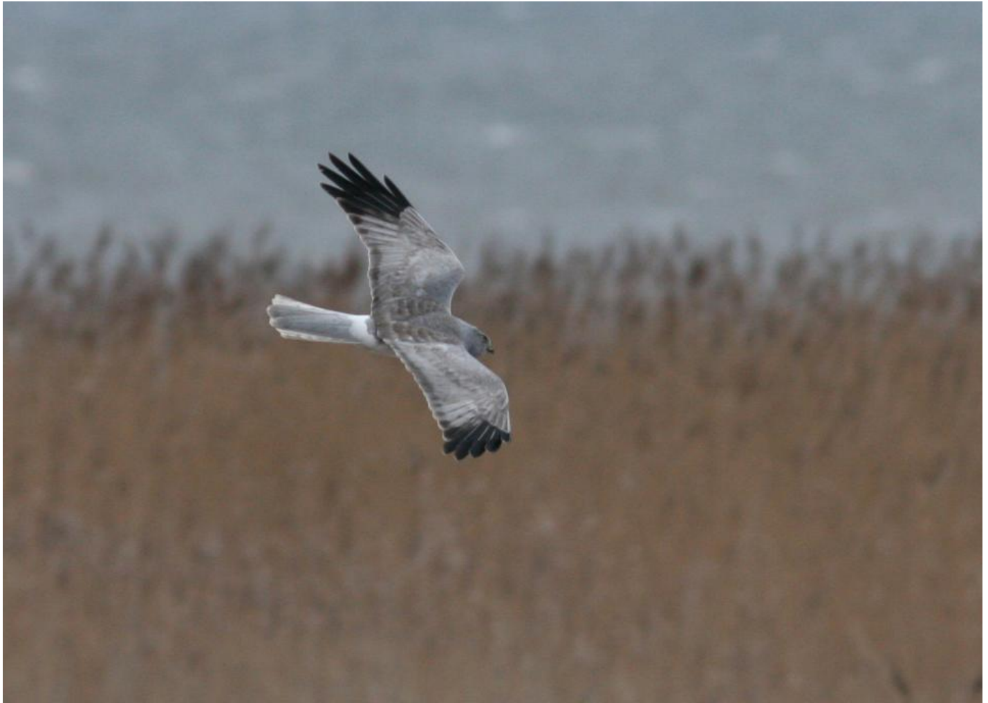
Blå kærhøg adult han. Bemærk bred rund spurvehøgeagtig hånd med fem fingre, bred sort vingspids, der overgår i mørk vingebackant samt bred, hvid overgump. Enø, Sjælland, Danmark, jan. 2007.