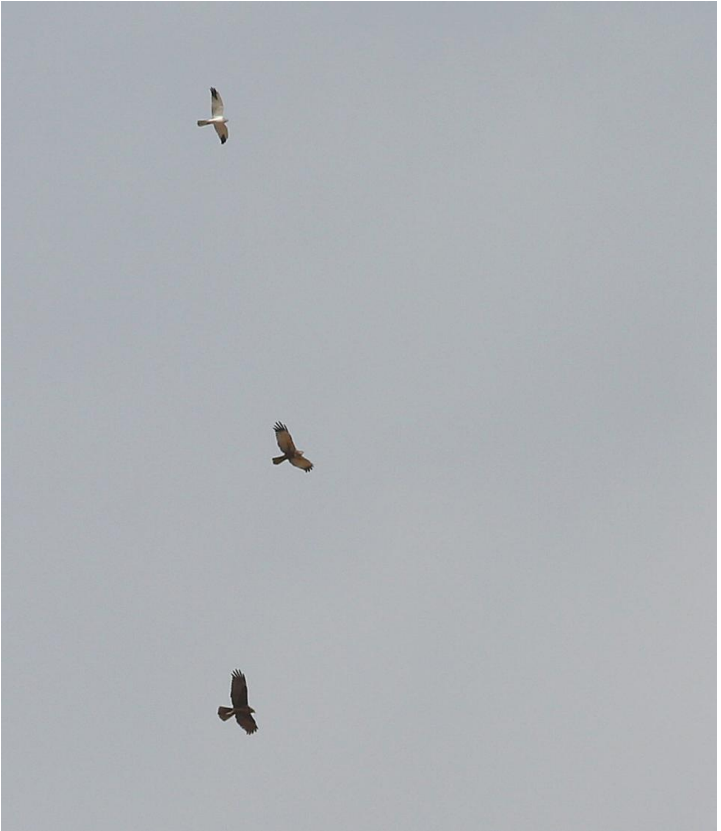
Steppehøg adult han med to rørhøge. Det falkeagtige klejne indtryk fremgår - den største og mindste kærhøg fanget på ét og samme foto. Eilat, Israel, marts 2015.