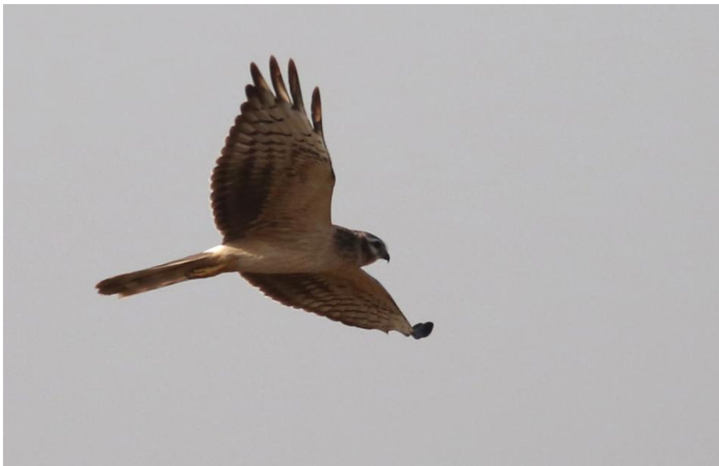
Hedehøg juv. (1K). Mange er allerede i december stærkt afblegede, og fra januar er de i kraftig fældning mod en "mellemdragt", der omfatter hoved, krop, armhuler og dele af dækfjerene. Steppehøg fælder langt mindre i vinterkvarteret, og er om foråret i stort set juvenil dragt. Velavadar, Gujarat, Indien, dec. 2013.

Blå kærhøg kan have antydning af steppehøgens hovedtegninger, men svagere, og afsløres altid på anderledes form. Nogle – især unge hunner – har en varmere farvet underside, der kan nærme sig orange- eller rustbrunt, men den virker ”ulden”, da den dækkes af brede mørke striber over bryst og flanker. Sjældent er striberne så svage, at de kan synes at mangle, men så er der heldigvis fuglens fremtoning med bred spurvehøgehånd. Man skal i øvrigt bemærke, at tegningen på vingeundersiden kan minde om steppehøgens, dog med lysere bånd gennem armsvingfjerene, da der tit kan være lys ”boomerang”. De fem synlige fingre har dog distinkte sorte spidser, som dypper i blæk, men håndens bagkant kan være ret lig steppehøgens, kun med svagt mørkere bagkant. Overvingen er mere ensartet med bredere hvid overgump, men svagere lyse ovaler. En syret association er, at blå kærhøgs overside kan minde om lille stormsvales i tegning (bred hvid overgump, ret ensartet overvinge), steppe- og hedehøg om stor stormsvales med smallere hvid overgump, men tydelige lyse ovaler over armen.