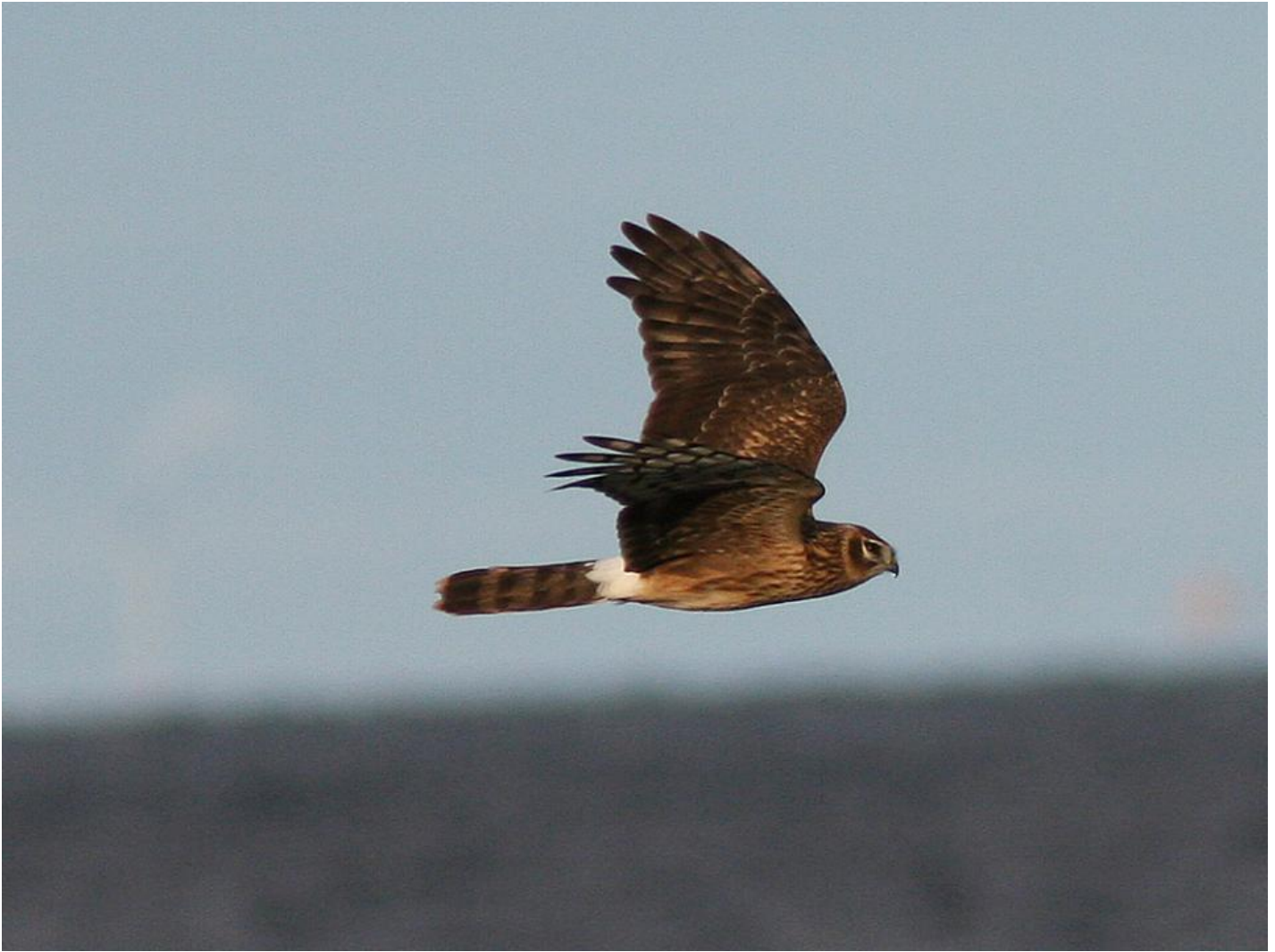
Blå kærhøg juv. (1K). Mange blå kærhøges hovedtegninger er helt som adulte hunner af steppehøg, men hånden er bred som hos spurvehøg og armen har gennemgående lyst tværbånd. Unge blå kærhøge har desuden svagere lyse ovaler på overvingen, men bredere hvid overgump og bredere hale end steppehøg. Stubben, København, Danmark. nov. 2005.