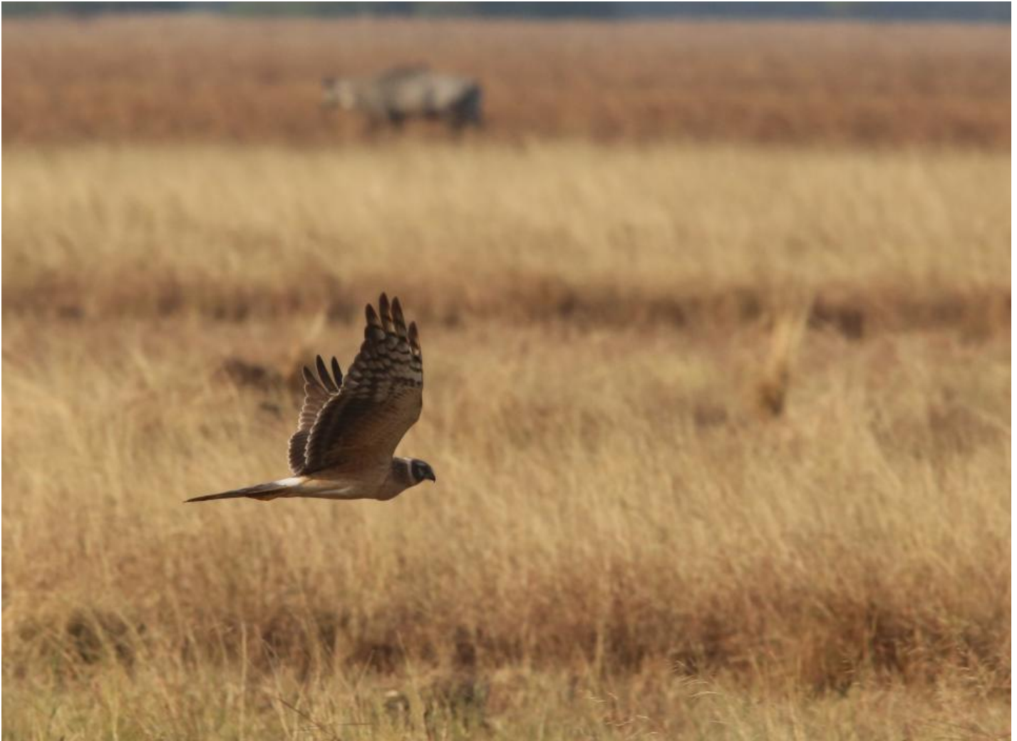
Steppehøg juv. (1K). I løbet af vinteren blegner undersiden let fra det intenst orangegule om efteråret til mattere beige-gult. Bemærk de tydelige hovedtegninger og den indsugede hånd imod bred arm. Velavadar, Gujarat, Indien, dec. 2013.