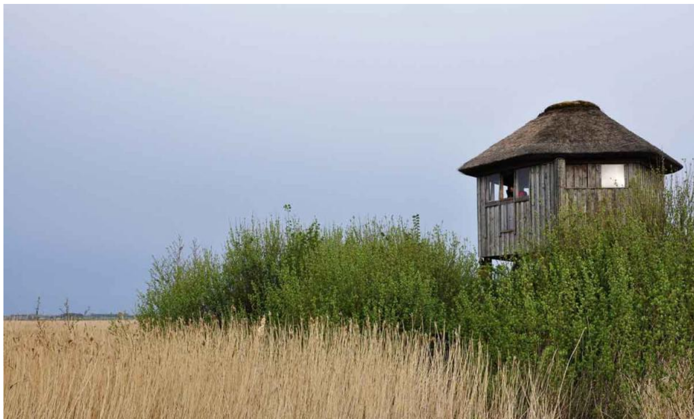
Her et view udover Vejlerne fra Kraptårnet, henholdsvis inde og udefra. Tårnet blev nr. 2 i den danske konkurrence med 85 forskellige fuglearter.