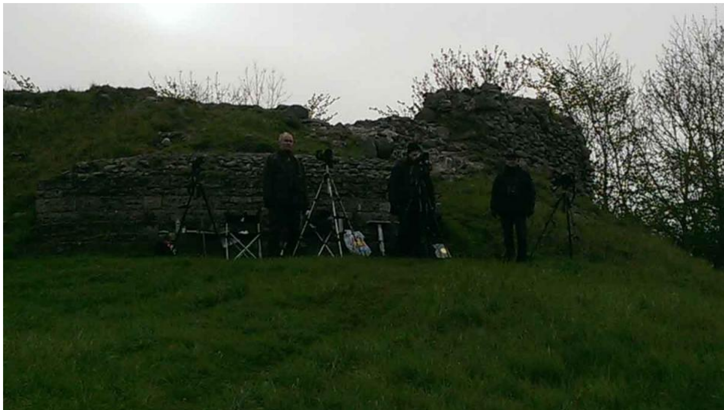
Allerød fuglegruppe var debutanter i forhold til "Tårnenes dag", men mon ikke "deres" tårn var det ældste af de små 420 tårne, som deltog idet tårnet er fra 1100-tallet.