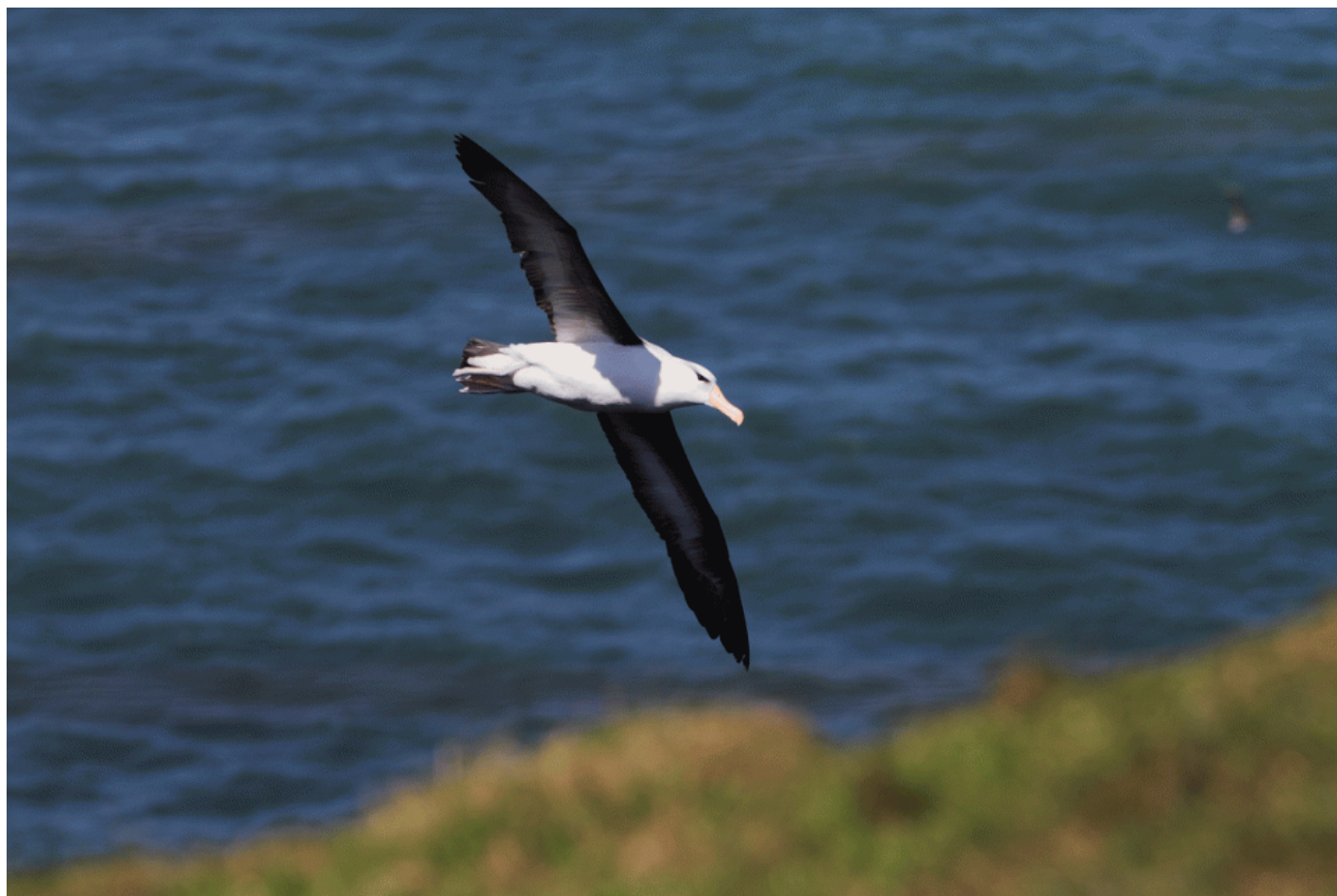
Albatrossen flyvende ind over øen og ud igen langs kanten af fuglefjeldet, tydeligt på udkig efter et sted at lande.

En albatros kan blive mindst 70 år gammel. Rygtet taler sandt, havluft er sundt for både krop og sjæl.