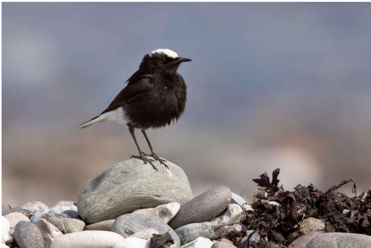
Hvidkronet stenpikker, Vrøj 30. juni 2010.

Fredningsnævnet gav i 2011 DN medhold i ønsket om offentlig adgang, men Overfredningsnævnet omstødte to år senere fredningsnævnets kendelse. Hvis forløbet havde været anderledes, kan man godt forestille sig, at man kunne være blevet enige om at etablere et par fugleskjul ved Alleshavebugten. Om det sker i fremtiden, vil tiden vise.