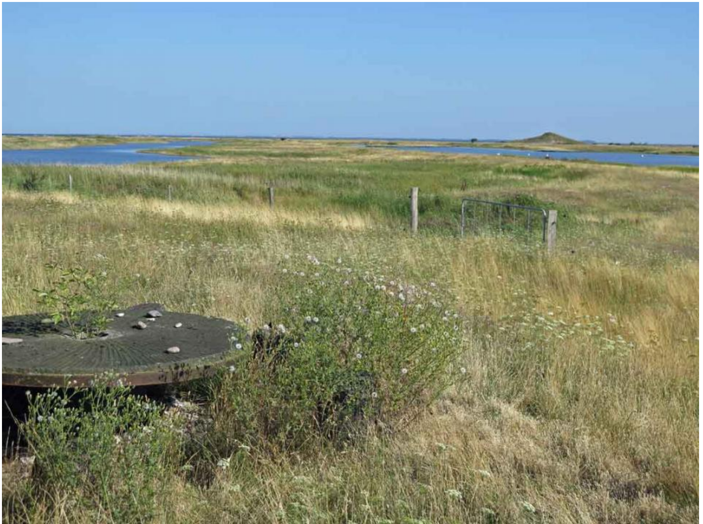
Store Vrøj

Ønsker du at besøge området, skal du holde øje med arrangementer annonceret af DOF Vestsjælland og andre lokale turarrangører som fx naturvejlederen i Kalundborg Kommune.