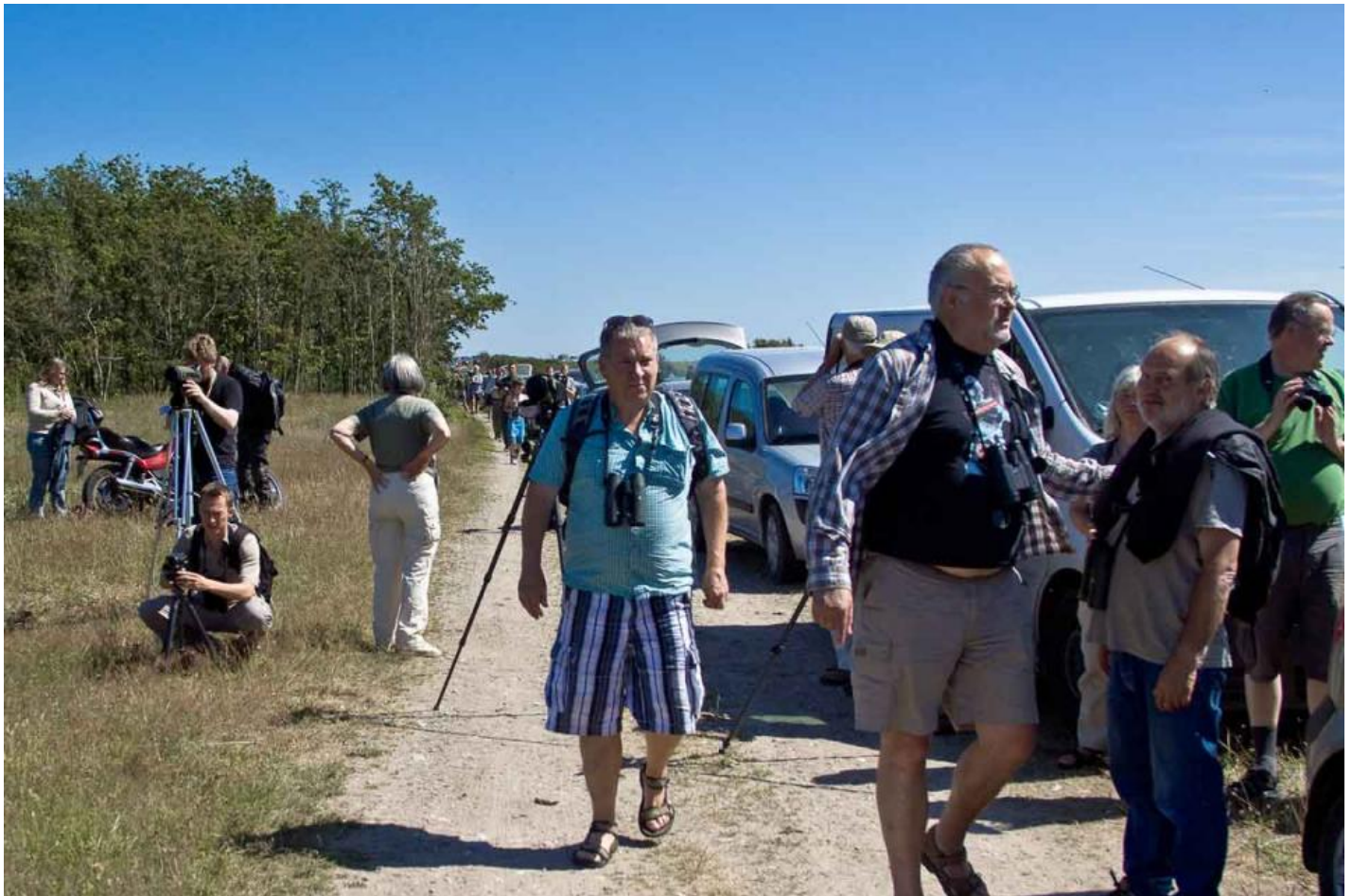
Fuglefolk observerer hvidkronet stenpikker på Store Vrøj.