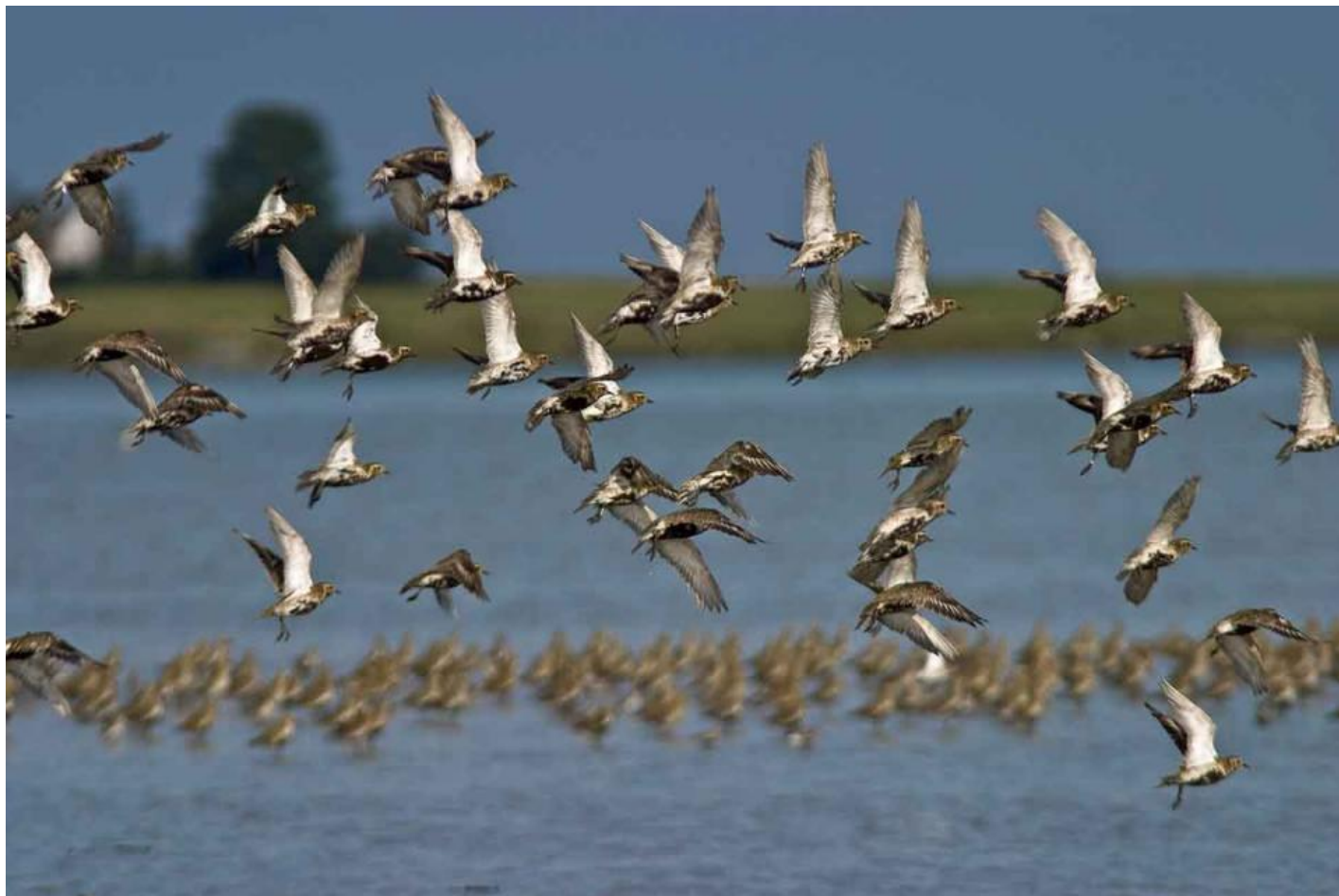
Hjejler ved Store Vrøj