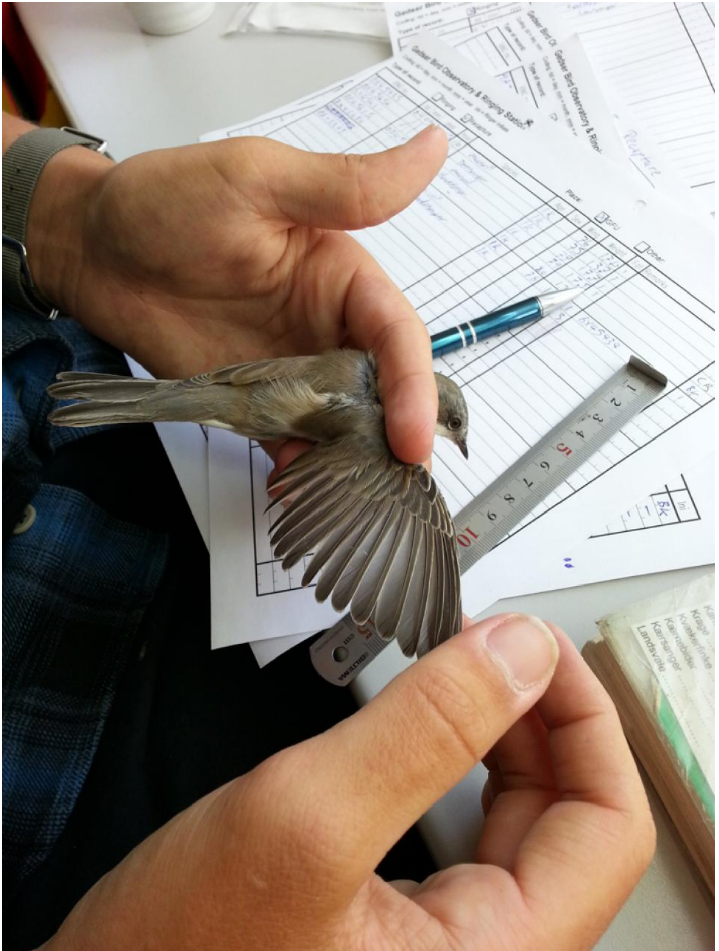
Gærdesanger aldersbestemmes.