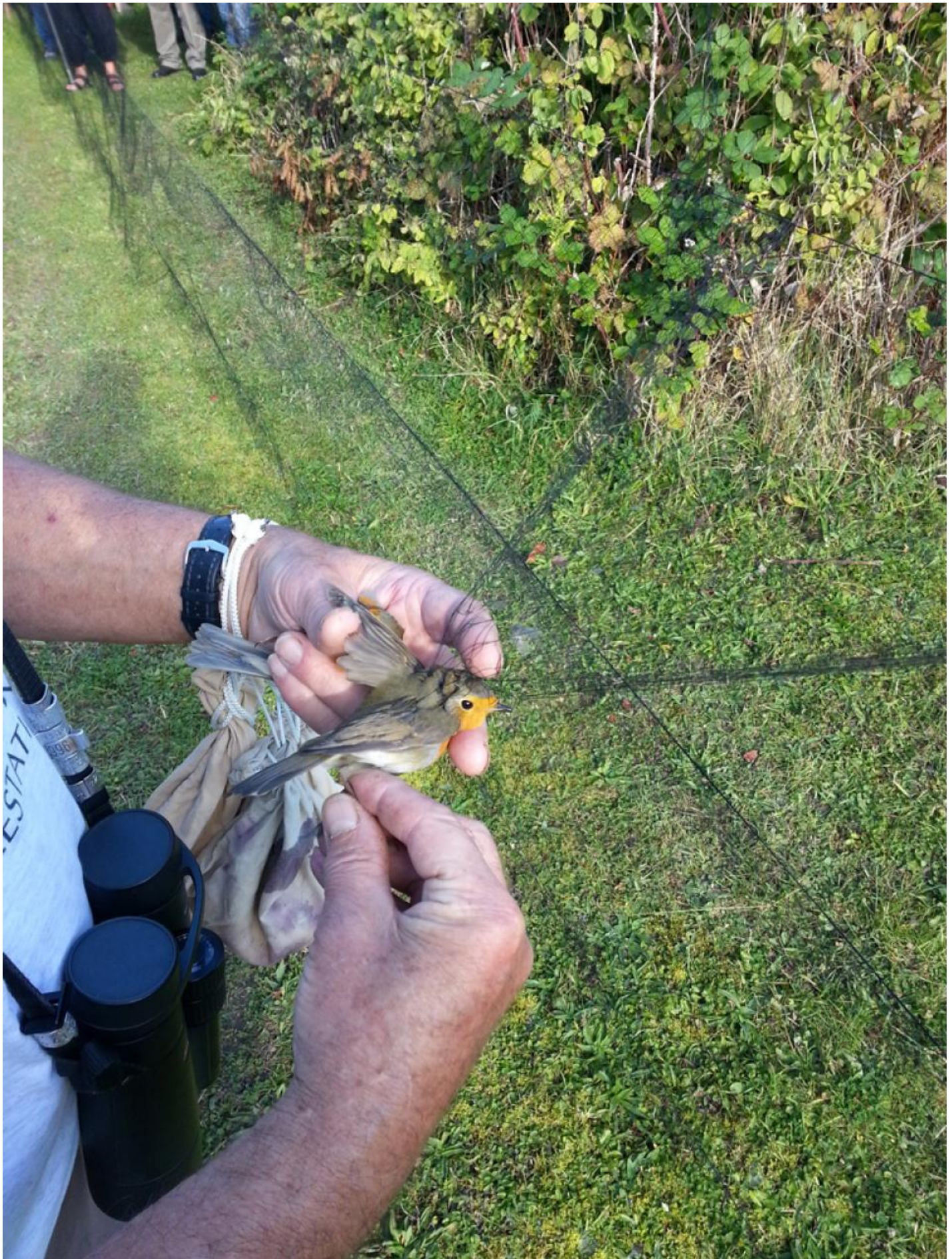
Rødhals tages ud af nettet.