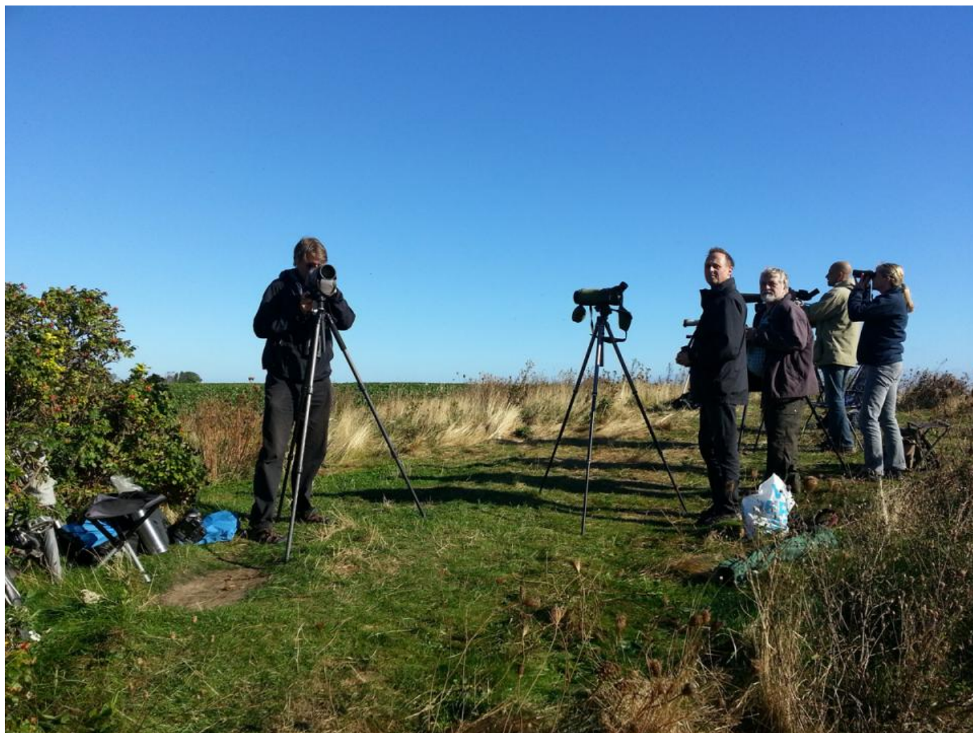
Fugletællere tæller trækfugle ved Gedser Odde.

Efter en lang, sej kamp blev Gedser Fuglestation endelig indviet i 2001. Fra starten har fuglestationen haft tre fokusområder: Ringmærkning, trækfugletælling og formidling. Og nu begynder vi for alvor at kunne se, hvordan data indsamlet gennem det store frivillige arbejde ikke bare kan bruges til noget, men rent faktisk bliver brugt af fugleforskere.