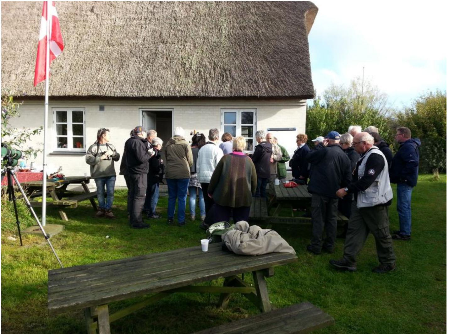
Publikum hører om og får vist ringmærkede fugle på Gedser Fuglestation.

Bo Kayser er med i styregruppen for Gedser Fuglestation, hvor han også hjælper med ved formidling, vedligeholdelse og ringmærkning