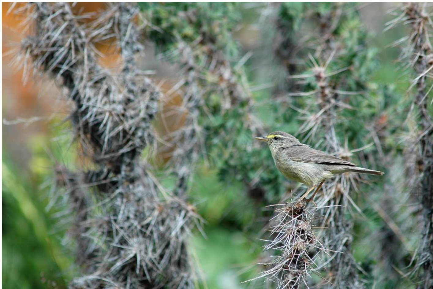
Sinkiangløvsanger, Kirgisistan, juli 2009. Bemærk det langnæbbede indtryk, den påfaldende gule øjenbrynsstriben og de kraftige lyse ben.

Fundet er i det første fra Vestpalæarktisk. Normalt er arten udbredt i Centralasien (Kirgisistan, Uzbekistan, Afghanistan og dele af Pakistan) og dele af Kina og overvintret i Indien.