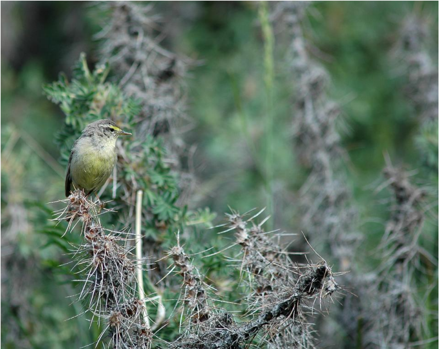
Sinkiangløvsanger, Kirgisistan, juli 2009. Bemærk den svovlgule underside, den gule øjenbrynsstribe og det langnæbbede indtryk.