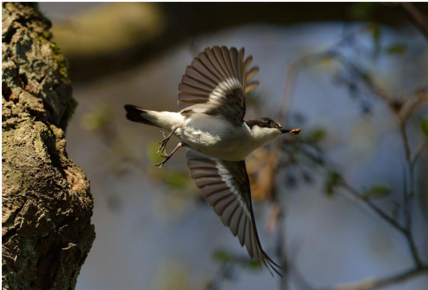
Broget fluesnapper yngler spredt og fåtalligt i Danmark, men den lysåbne og insektrige skov ved Stubbe Sø huser Danmarks måske tætteste bestand af arten.

Et år ynglede også 32 par musvitter i redekasserne. Det var formentlig Østjyllands tætteste bestand af mejser. Det er også sket, at flagermus er flyttet ind og har taget logi i en af kasserne.