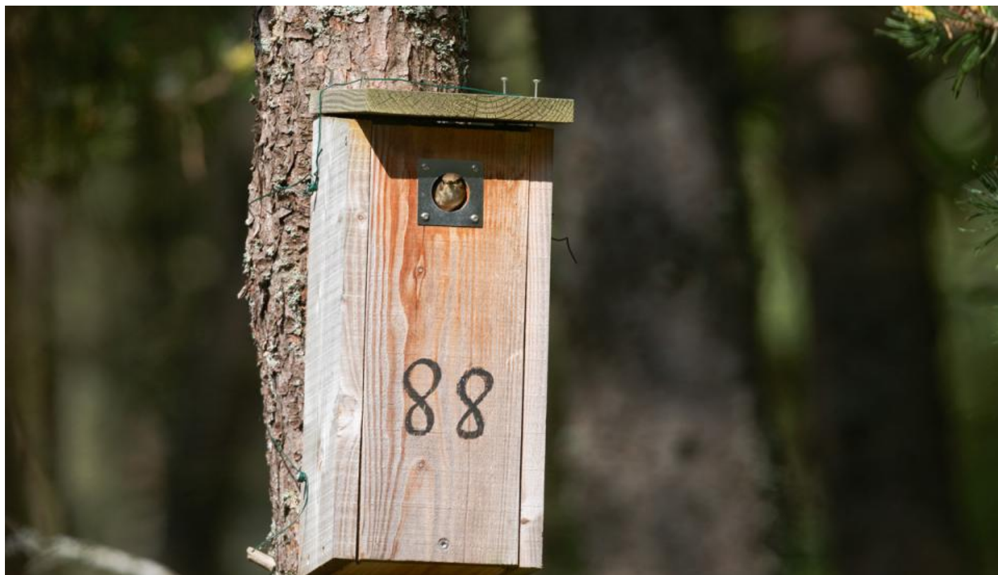
I bolig nummer 88 bor en rødstjert kvit og frit med Fugleværnsfonden som vært. Arten kvitterer med et kuld unger.

Reservatet er ikke kun hjemsted for oaser af kokasser, der serverer en menu fra den danske insektfauna. Også redekasser sætter deres præg på terrænet ved søen. Helt præcist hænger der 129 fuglekasser i Fugleværnsfondens område. Næsten halvdelen af kasserne er beboet hvert år. Og flere end 100 af dem har på et eller andet tidspunkt været optaget af småfugles familieliv.