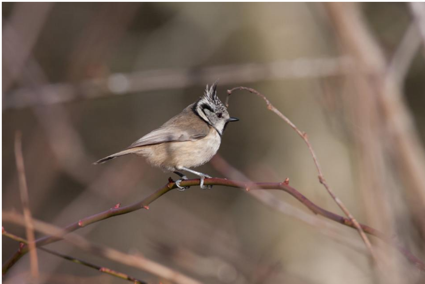
Topmejsen kan ses ved Stubbe Sø. Topmejsen er den mest selvhjulpne af de hulrugende mejser. Den kan selv hakke et hul ud, hvis det skal være.

Hvor overdrevet møder engen, jager den rødryggede tornskade græshopper med hurtige styrtdyk i den åbne vegetation, mens den hvæser, hvis den bliver forstyrret. Tornskader er ikke just tenorer.