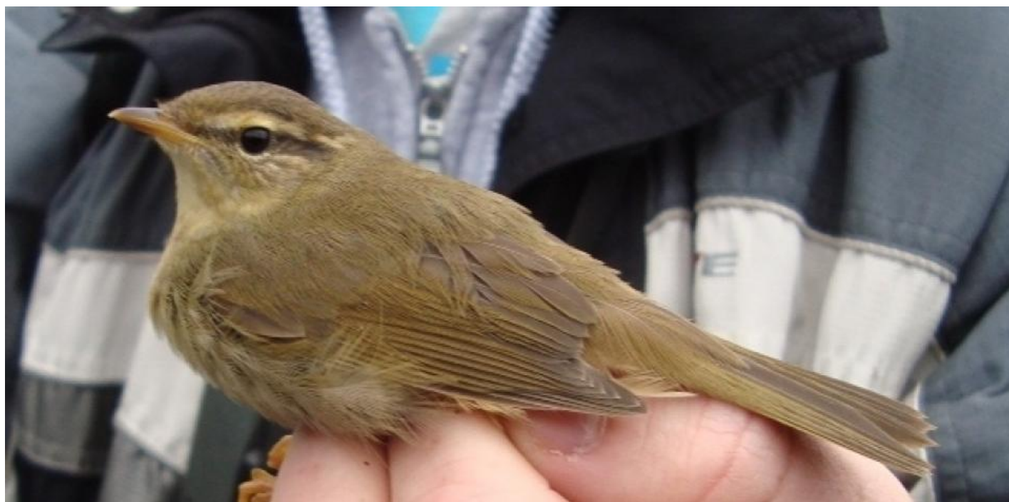
Schwarz løvsanger, Blåvand den 11. oktober 2012. Bemærk især det kraftige næb, den meget kraftige mørke øjenstrib, øjenbrynsriben der er lysest over- og bag øjet (og let buff foran øjet) samt den mørke streg over øjenbrynsriben.

Karaktermæssigt har de begge brune oversider, mens undersiden er gyldenbrunlig på schwarz (formentlig fordi alle der er set herhjemme om efteråret, er ungfugle) med en afstikkende varmere orangegullig undergump. Ansigtet er også gyldenbrunligt tonet ligesom øjenbrynsriben, og kinden virker lettere plettet med små gyldne aflange smalle pletter. Brun løvsangers underside virker kun sjældent gyldenbrun. Som regel er der tale om en støvet gråbrun underside med de lyseste områder på den centrale bug. Undersiden oplever man som glidende gråbrunlige overgange. Indimellem ses fugle med afstikkende varmt brunlige undergumpe, og ansigtet kan også have en gyldenbrunlig tone. Til gengæld virker øjenbrynsriben aldrig gylden, men kan variere i intensitet. Nogle med skarpt afsatte øjenbrynsstriber andre med meget gråbrun farve indblandet, hvor de ikke virker så skarpt skårne.