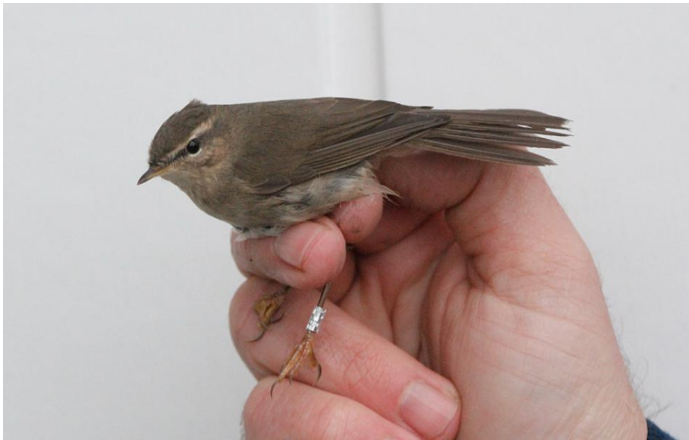
Brun løvsanger, Blåvand den 13. oktober 2012. Bemærk den brune overside, ansigtets "tilspidsede" udseende der skyldes en kombination af øjenbrynsstriben og øjenstriben der leder ud i det spidse næb. Bemærk desuden at der ikke er en mørk streg over øjenbrynsstriben (som man oplever hos schwarz løvsanger), at øjenbrynsstriben er klarest foran og over øjet, den mørke øjenstriben, det tynde næb og de tynde ben.

Lige nu banker en kølig nordøstenvind bare derudad, og tager lidt af gnisten. Det er blevet svært at luske. Der er ikke meget i krattene længere, og samtidig får vi bank af vores nabolande, der hygger sig med megaer som gulddrosler, sibirisk drossel, flere sibiriske jernspurve og østlig kronsanger.