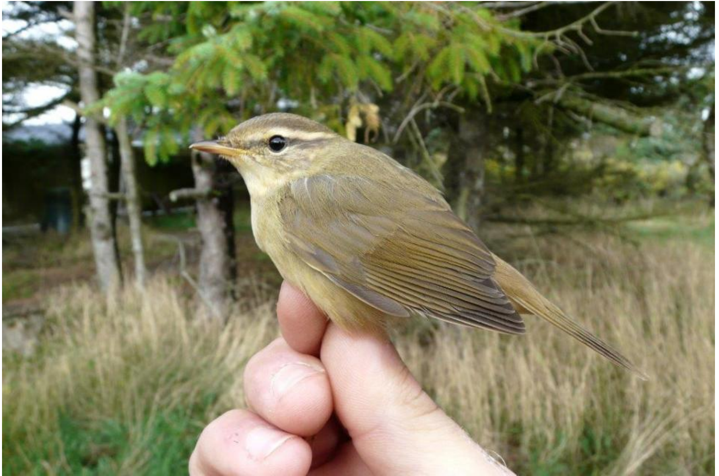
Schwarz løvsanger, Blåvand den 20. oktober 2013. Sammenlign med den brune løvsanger nedenfor og bemærk det kraftige næb, øjenbrynsstriben der er klarest bag øjet, den kraftige mørke øjenstrib, den mørke streg over øjenbrynsstriben og den gyldne underside.