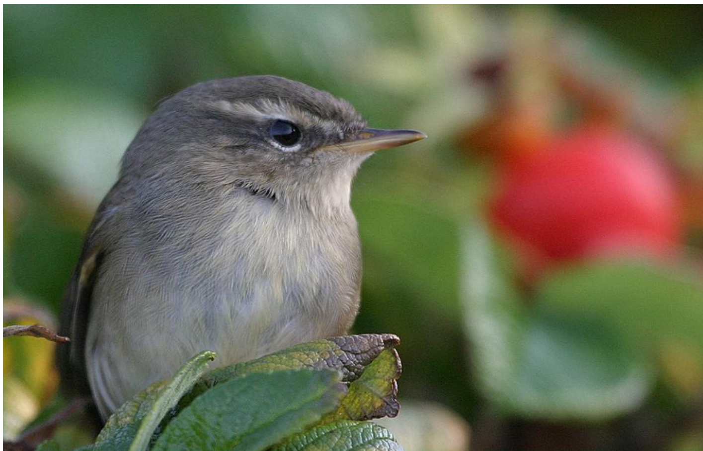
Brun løvsanger, Blåvand den 30. oktober 2008. Bemærk det ret lille næb, den mørke øjenstriben samt at der ikke er en mørk streg over øjenbrynsstriben. Øjenbrynsstriben er klarest foran og over øjet, men mere fadet i aftegningen bag øjet. Øjenstriben, øjenbrynsstriben og dt smalle næb i kombination giver et "tilspidset" udseende.

Over den bagerste to-tredjedel af øjenbrynsstriben ses en mørk skyggetegning hos schwarz løvsanger som er med til at gøre øjenbrynsstriben endnu mere distinkt og give ansigtet karakter. Den mørke skygge over øjenbrynsstriben oplever man ikke hos brun løvsanger.