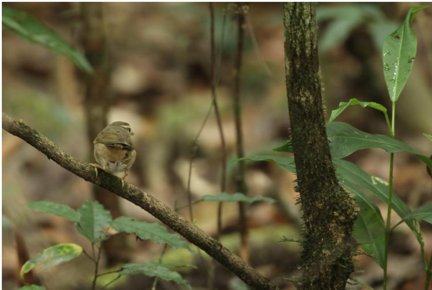
Schwarz løvsanger, Thailand, marts 2012. Bemærk den afstikkende varmt farvede undergump - en karakter man forbinder med schwarz løvsanger - og som også er mest typisk hos denne art. Desværre har det vist sig at brun løvsanger kan fremvise noget lignende. Bemærk dog også de kraftige - og lyse - ben og fødder der udelukker brun løvsanger.

Her er indtrykket anderledes hos brun løvsanger, der har tynde ben og "normale" fødder, der ikke er påfaldende store eller kraftige. Benfarven er typisk brunlig med gullige fødder. Brun løvsanger opholder sig også typisk lavt i krattene, men kan bevæge sig op i toppen også. Bevægelserne er som sagt hurtigere, og man opnår ofte kun korte glimt af fuglen. Indtrykket af brun løvsangers hoved er at det er "typisk phylloscopus", altså forholdsvis lille og rundet uden den markante tyrenakke som man får indtryk af hos schwarz løvsanger.