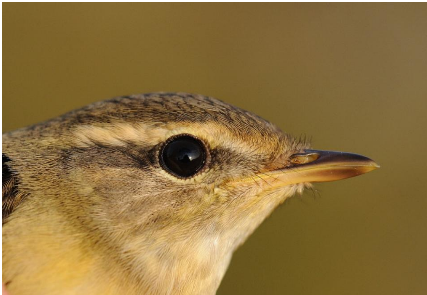
Schwarz løvsanger, Christiansø den 10. oktober 2010. Bemærk det kraftige næb, den mørke øjenstribе og den mørke streg over øjenbrynsriben. Øjenbrynsriben er let buff foran øjet og klarest og lysest bag øjet.

I felten oplever man schwarz løvsanger som storhovedet. Nakken er fremtrædende, og kan bedst beskrives som en tyrenakke. Det indtryk får man ikke hos brun løvsanger. I det hele taget er schwarz bare tungere og kraftigere i indtrykket, hvilket understreges af de lidt langsommere og tøvende bevægelser altid lavt i krattene. Schwarz løvsangers kraftige ben og fødder understreger blot, at der er tale om en phylloscopus, der ofte bevæger sig på jorden. Dens ben og fødder er desuden påfaldende lyst gulorange, hvilket man ofte noterer sig i felten.