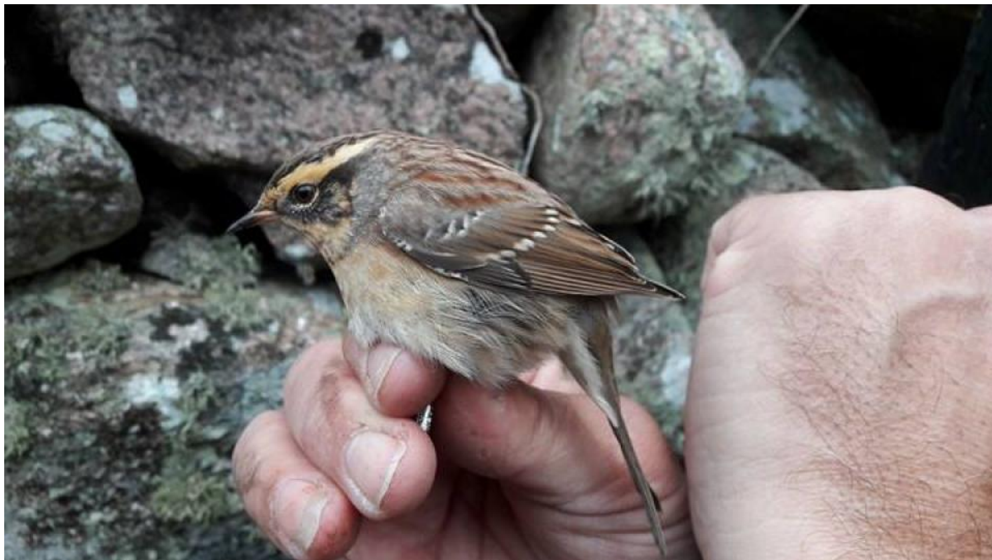
Sibirisk jernspurv, Christiansø den 13. oktober 2016.

værbling fundet på Fanø. Det betød et dilemma for nogle. De fleste valgte at få set den hvidkindede værbling først, inden turen gik videre til Christiansø. Andre satsede benhårdt på den sibiriske jernspurv på Christiansø.