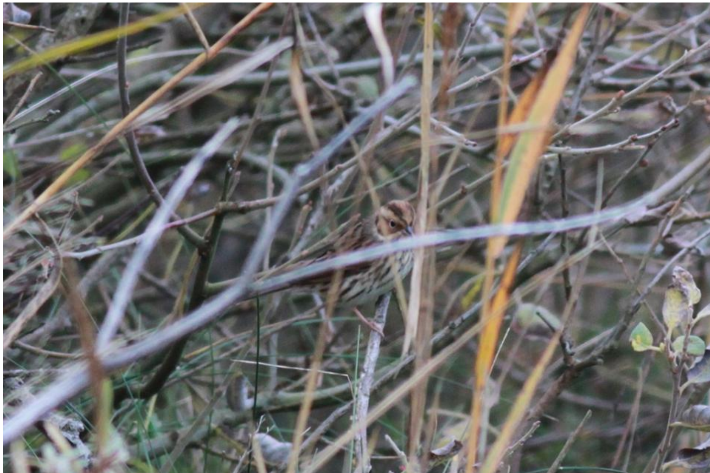
Dvärgværling, Thorsminde den 21. oktober 2016.

Altimens er der fundet rødhalsset gås og fuglekongesanger på Amager, dværgværlinger i Skagen, Hanstholm og ved Thorsminde samt trækkende korttået lærke på Skallingen.