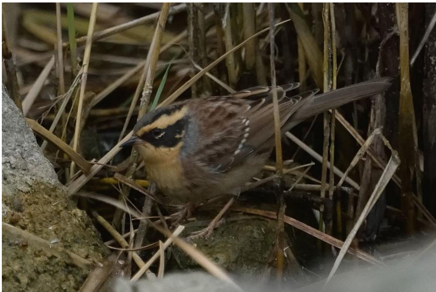
Sibirisk jernspurv, Stubben, København den 15. oktober 2016.

Os andre der ikke kunne nå at rykke, trøstede os selv med, at der nok ville blive fundet en sibirisk jernspurv på felttræffet. Meldingerne fra Østersølandene fortsatte nemlig med at tikke ind med nye fugle.