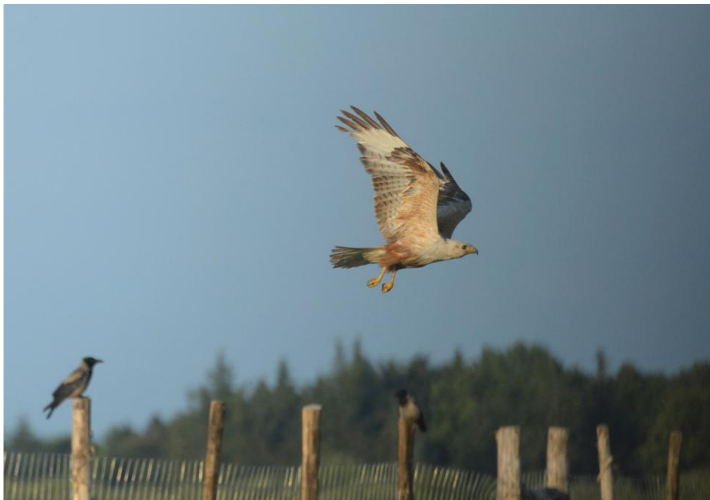
Ørnevåge, 2K, Lille Vildmose den 22. juni 2016. Bemærk diffus vingebagkant udover rødbrunt bugskjold, stort næb og lange nøgne ben. Det mørke øje forvirrede, og gav tanker i retning af, at det kunne være en ældre fugl, men netop øjenfarven er stærkt variabel hos våger og derfor vanskelig at bruge isoleret som alderskendetegn.

Hvis man søger på Netfugl, vil man hurtigt kunne finde selv 1k fugle af både Mus- og Fjeldvåge med ligeså mørk iris.