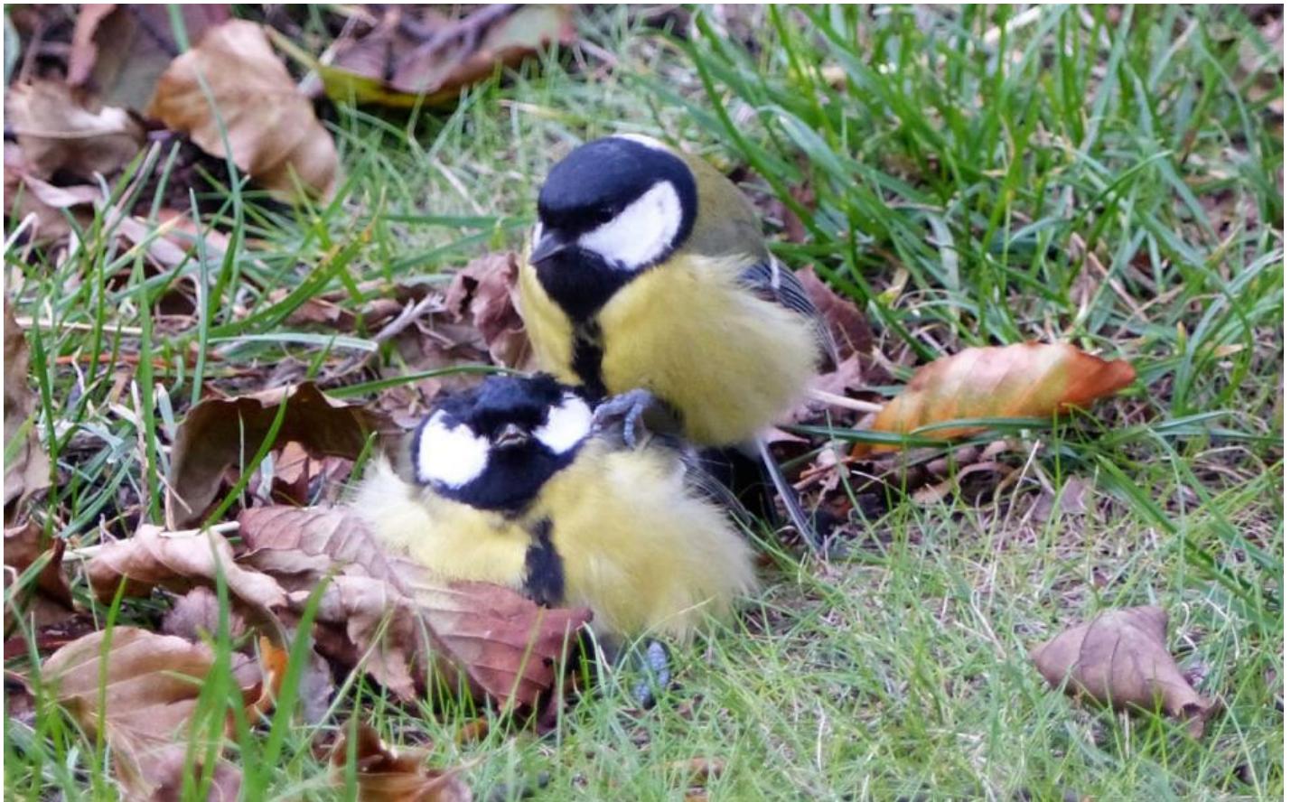
En musvit i gang med at hakke i en anden på Christiansø.