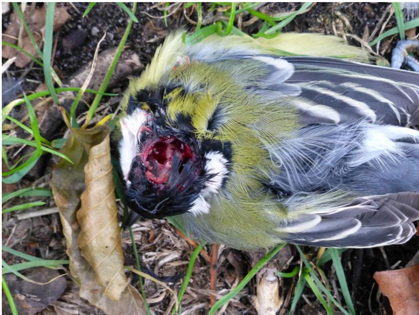
En af flere ofre for sultne musvitter på Christiansø, efterår 2016.