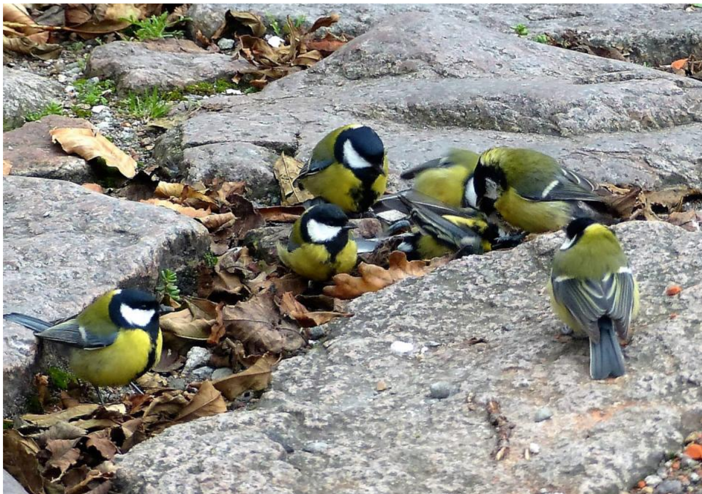
Christiansø havde besøg af mange hundrede musvitter i oktober 2016, hvor af flere kastede sig over fugle for at så stillet sulten.