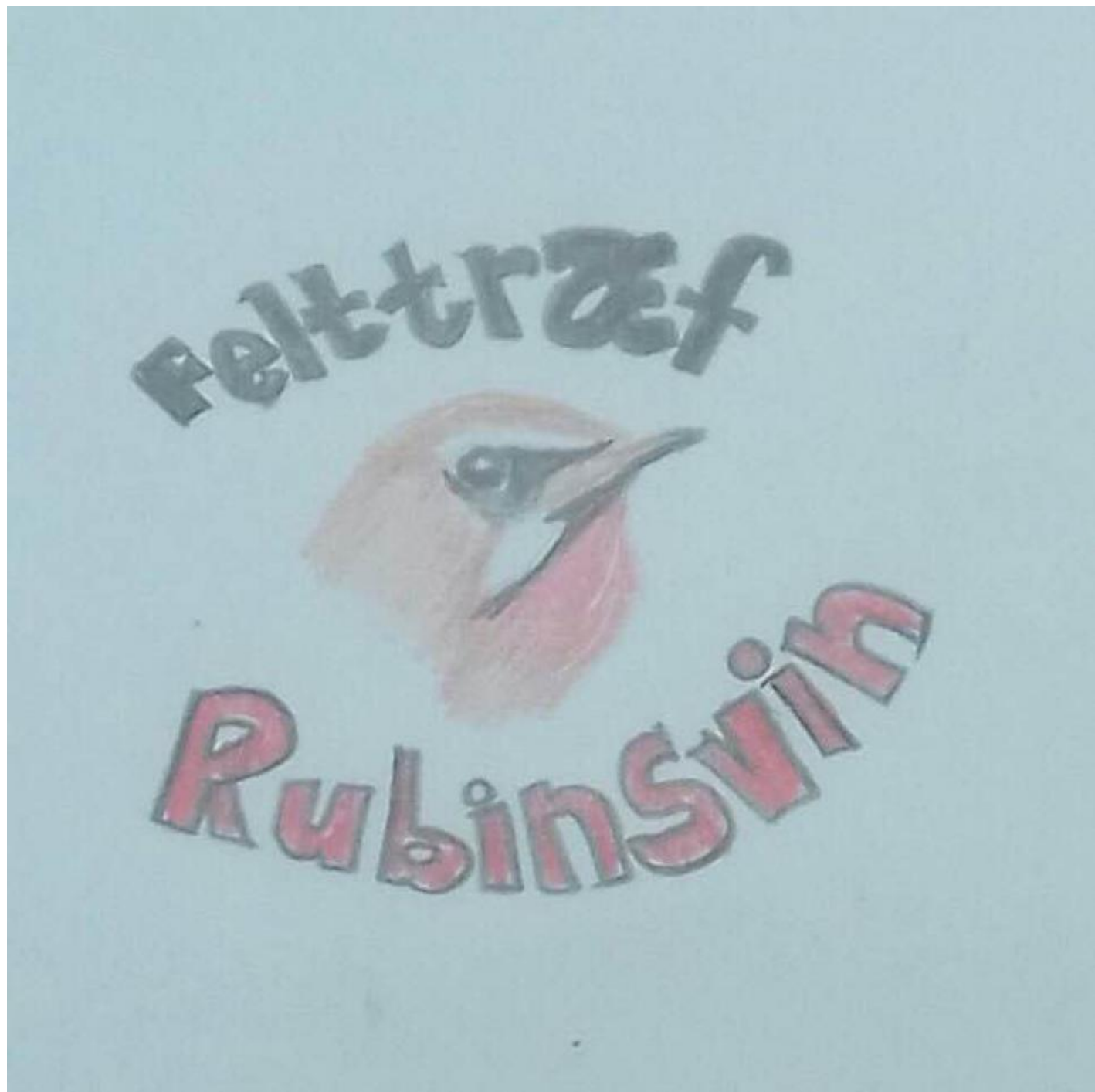
Team Rubinsvins logo.