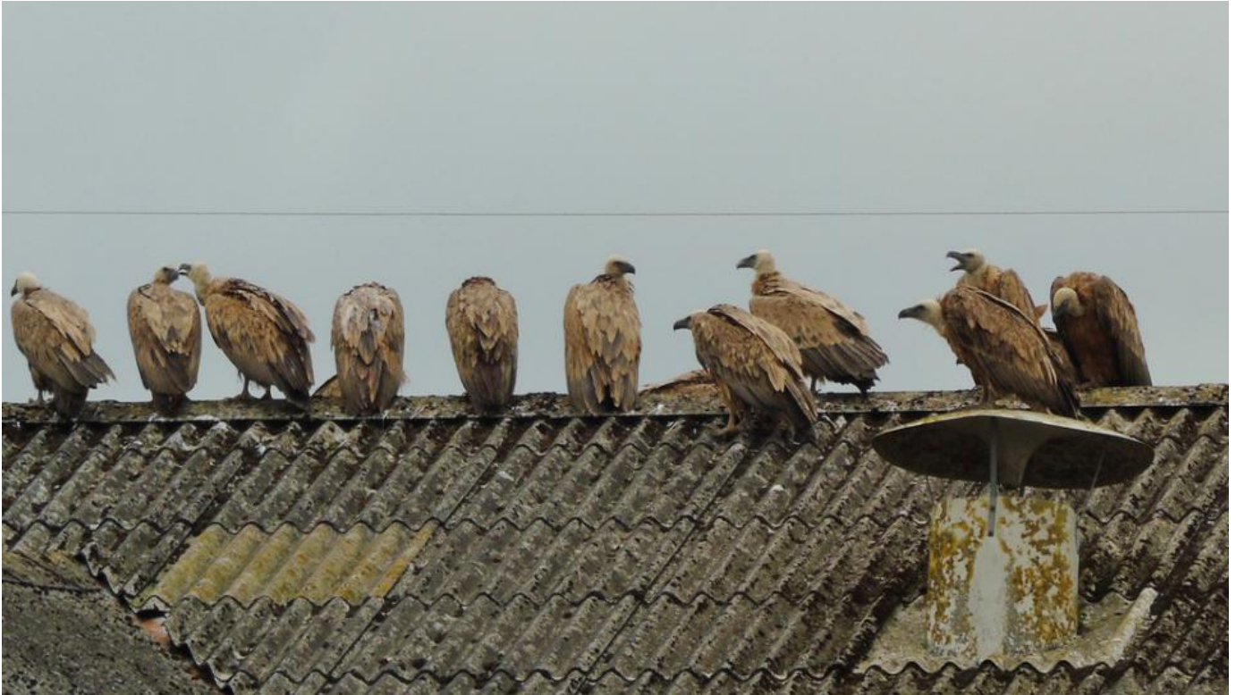
Gåsegribbe, Kællingtand den 27. juni 2016.

Efter et par dage på stedet fortrak de om morgenen den 28. juni. En af fuglene var ringmærket med en gul ring. Den kunne spores tilbage til mærkningspladsen i Nordspanien nær Zaragosa. Endnu mere spektakulært var det, da selvsamme fugl på ny blev aflæst 19 dage efter, de tog afsted fra Himmerland. Den var nu på en fodringsplads i det Nordøstlige Italien, 1195 kilometer væk!