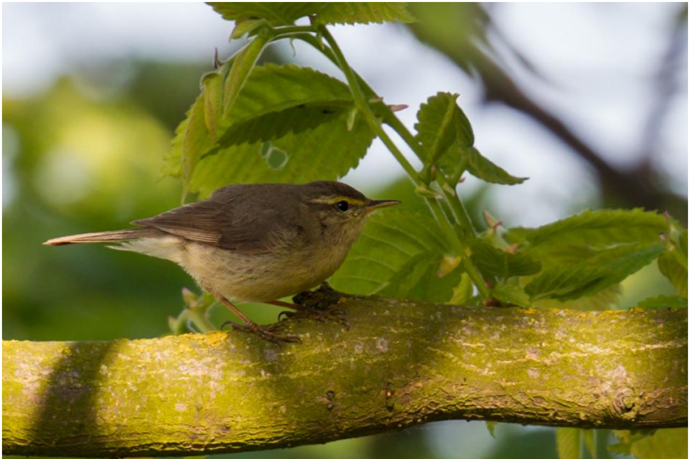
Sinkiangløvsanger, Christiansø den 3. juni 2016.

Fuglen var stationær, og mange nåede at se fuglen, også tilrejsende fra udlandet, inden den blev set den sidste gang den 3. juni.