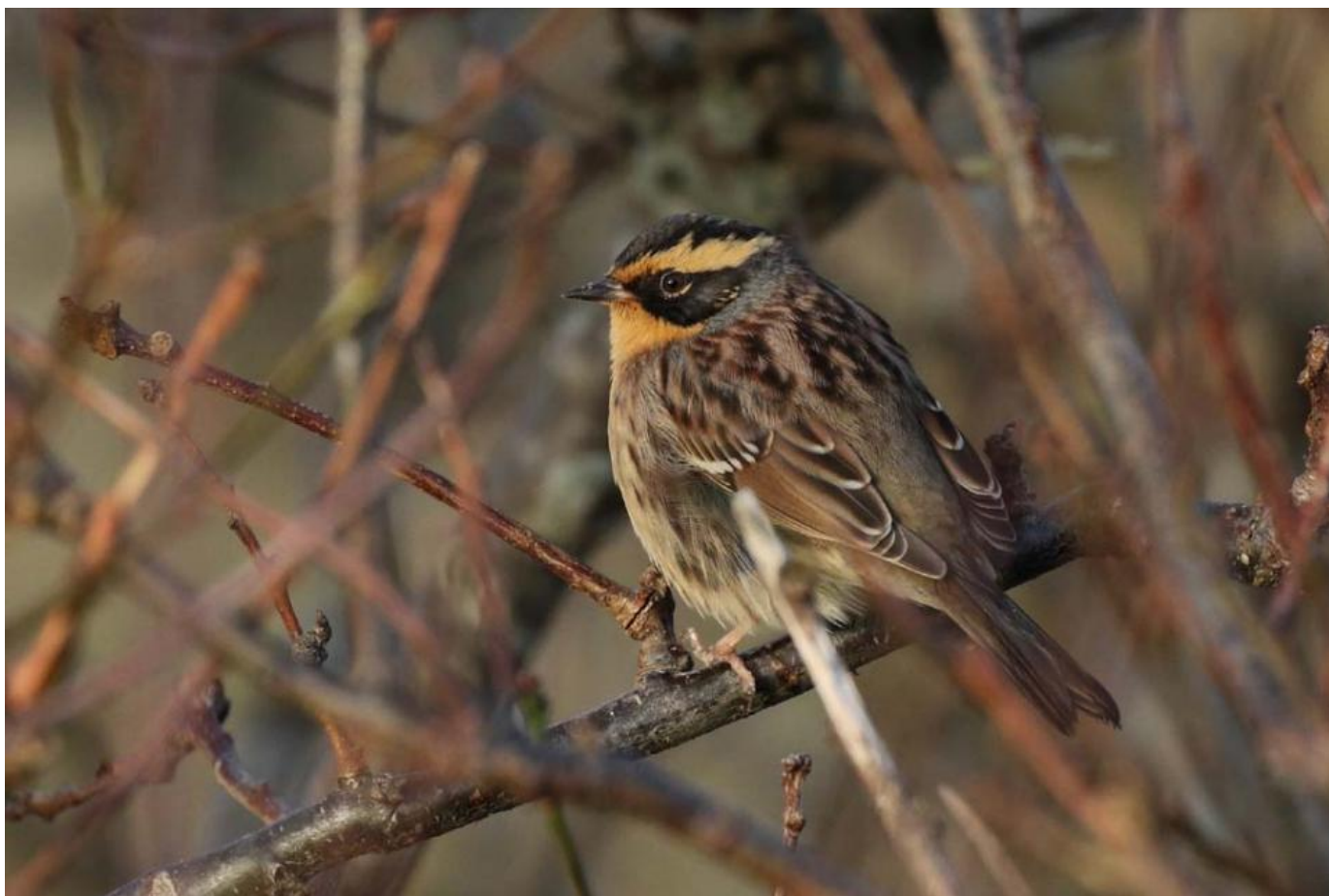
Sibirisk jernspurv, Hirtshals den 18. december 2016.