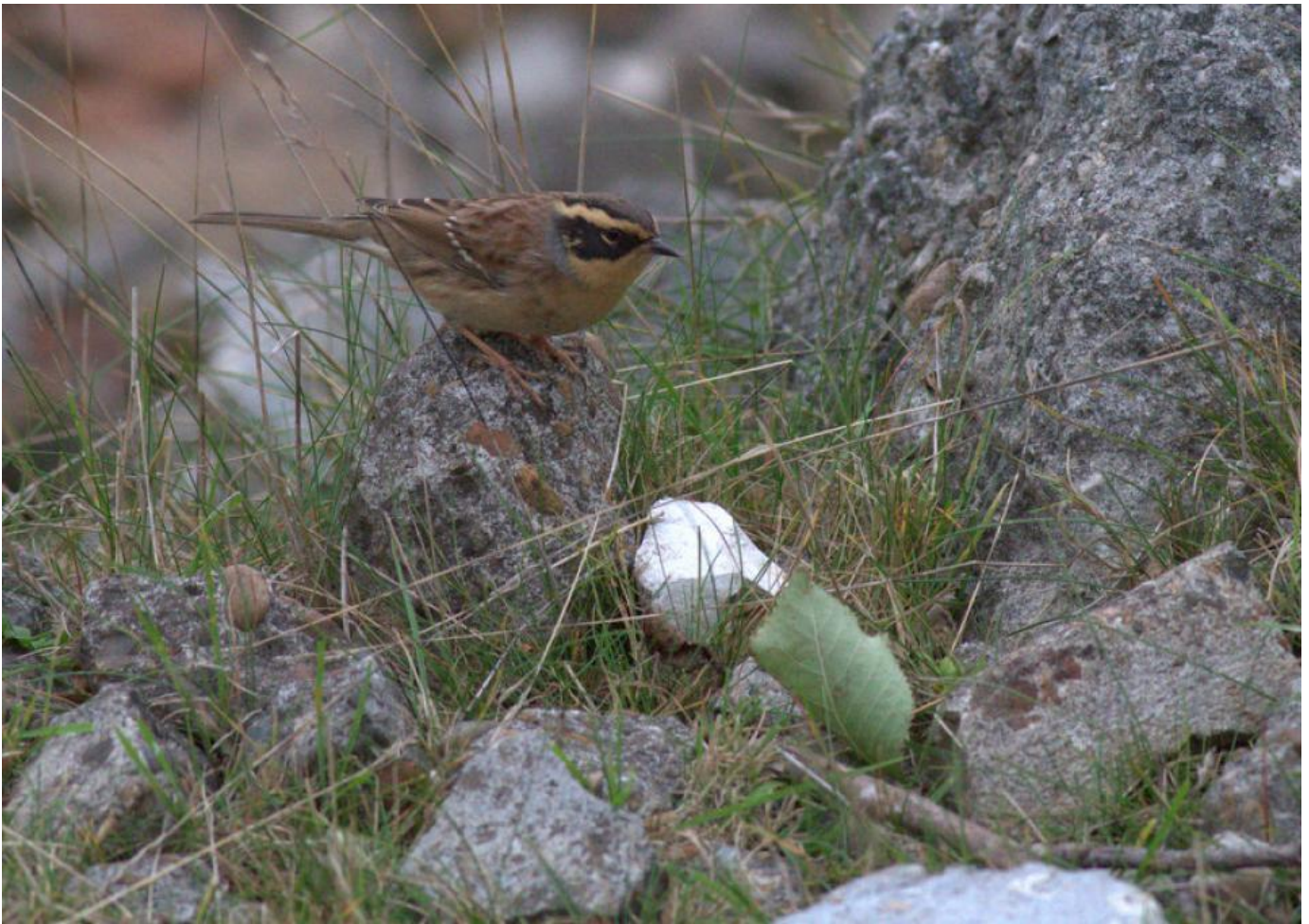
Sibirisk Jernspurv, Stubben den 15. oktober 2016.

Sibirisk jernspurv skulle man se i år, hvis man nogensinde skulle have en reel chance for at opleve den i Danmark. Det vidste alle, da meldingerne tikkede ind, dagligt gennem en stor del af oktober. Alle vidste også at årets influx, invasionen, med det omfang som vi var vidne til i efteråret 2016, måske aldrig vil ske igen. Jeg mener, hvornår oplever vi igen, at sibirisk jernspurv bliver den næst-almindeligste sibiriske småfugl et efterår? Der var flere sibiriske jernspurve, end der var fuglekongesangere i 2016! De fleste kæmpede med at få set arten. For andre var det let. En, som blev set af mange, blev fundet på Stubben i København. Andre pillede en ud af et net på Christiansø. Men for de fleste var det svært. En del kørte mange kilometer på landevejene. Først til Stubben (forgæves - fra Blåvand og så retur). Dernæst til Utterslev Mose. Forgæves. Så til Bornholm. Forgæves. Skallingen. Forgæves. Rosenvold lød lovende – siddende i isoleret krat. Forgæves. Et par af twitcherne blev da også døbt ”brødrene zig-zag” for deres mange forgæves forsøg på kryds og tværs af landet.