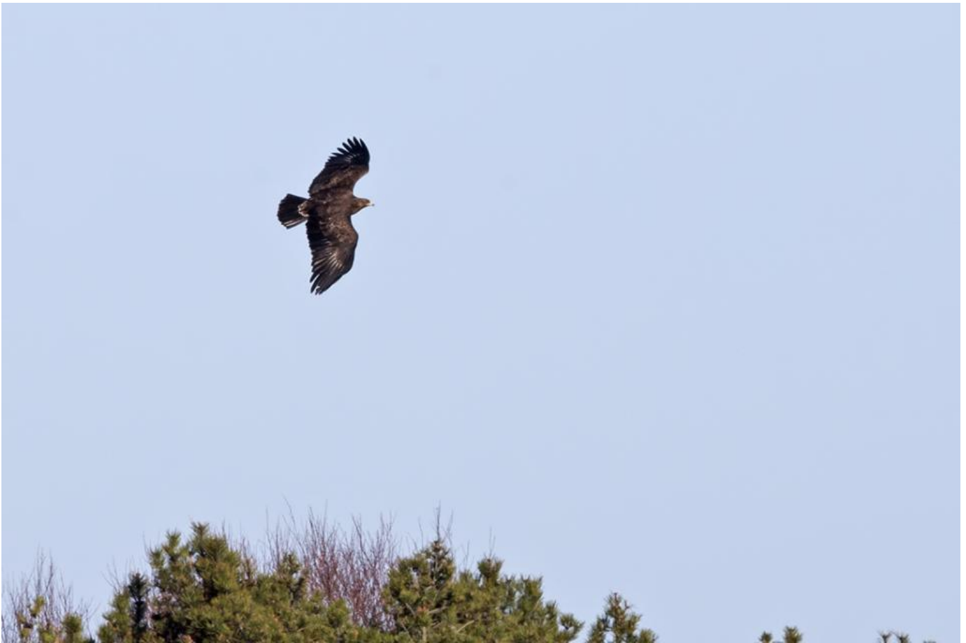
Stor Skrigeørn, adult, Skagen den 15. marts 2017. Bemærk oversidens svage og lidt diffuse kontraster til de hvide stråler ved håndroden og egentlig også til det hvide bånd på overgumpen. Netop de svage kontraster er typisk for stor skrigeørn. Lille skrigeørn er i modsætning typisk mere kontrastfuld, hvor vingens dækfjer er lysere, og danner en tydelig kontrast til en mørkere ryg.

Fundet er det første i Skagen siden maj 2011, og er desuden det tidligste forårsfund herhjemme. Den hidtil tidligste dato i Skagen har været 18. april i både 1981, 1982 og 2011.