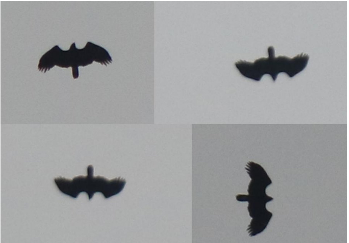
Stor skrigeørn, Nørre Snede den 11. marts 2017. Efterbestemt nogle dage efter, hvor finere fjerdetaljer afslørede den som samme fugl som i Skagen og dermed godtgjorde en bestemmelse til stor skrigeørn.

Jeg kan kun sende Mortens opfordring fra hans Facebookopdatering videre: Husk at tage fotos, og husk lige at tjekke dem, inden de bliver slettet.