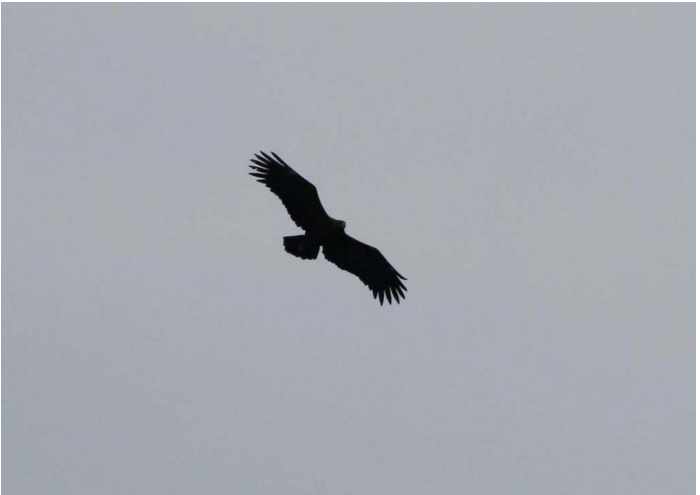
Stor skrigeørn, adult, Skagen den 14. marts 2017. Bemærk tydeligt hak i inderfanen i P6 i højre vinge og ret kort P6 i venstre vinge. Bl.a. disse to småting godtgjorde at fuglen fra Nørre Snede kunne bestemmes til den samme fugl som i Skagen.