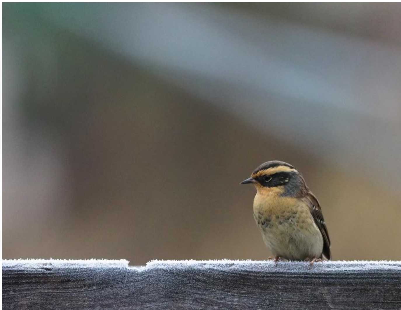
Sibirisk Jernspurv, Hirtshals.