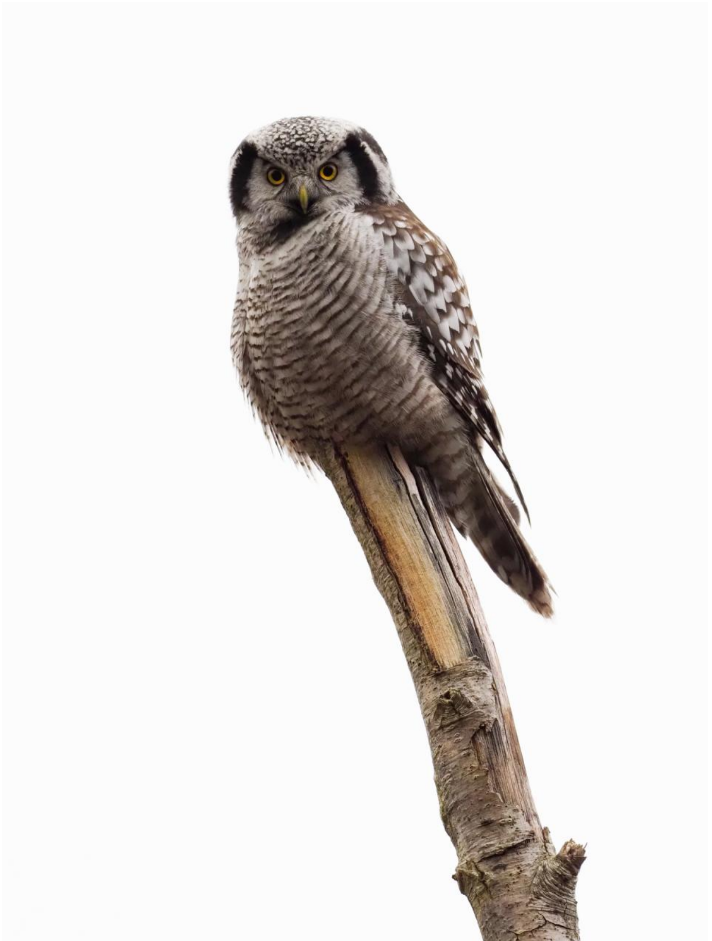
Høgeugle, Kongelunden den 30. december 2016.