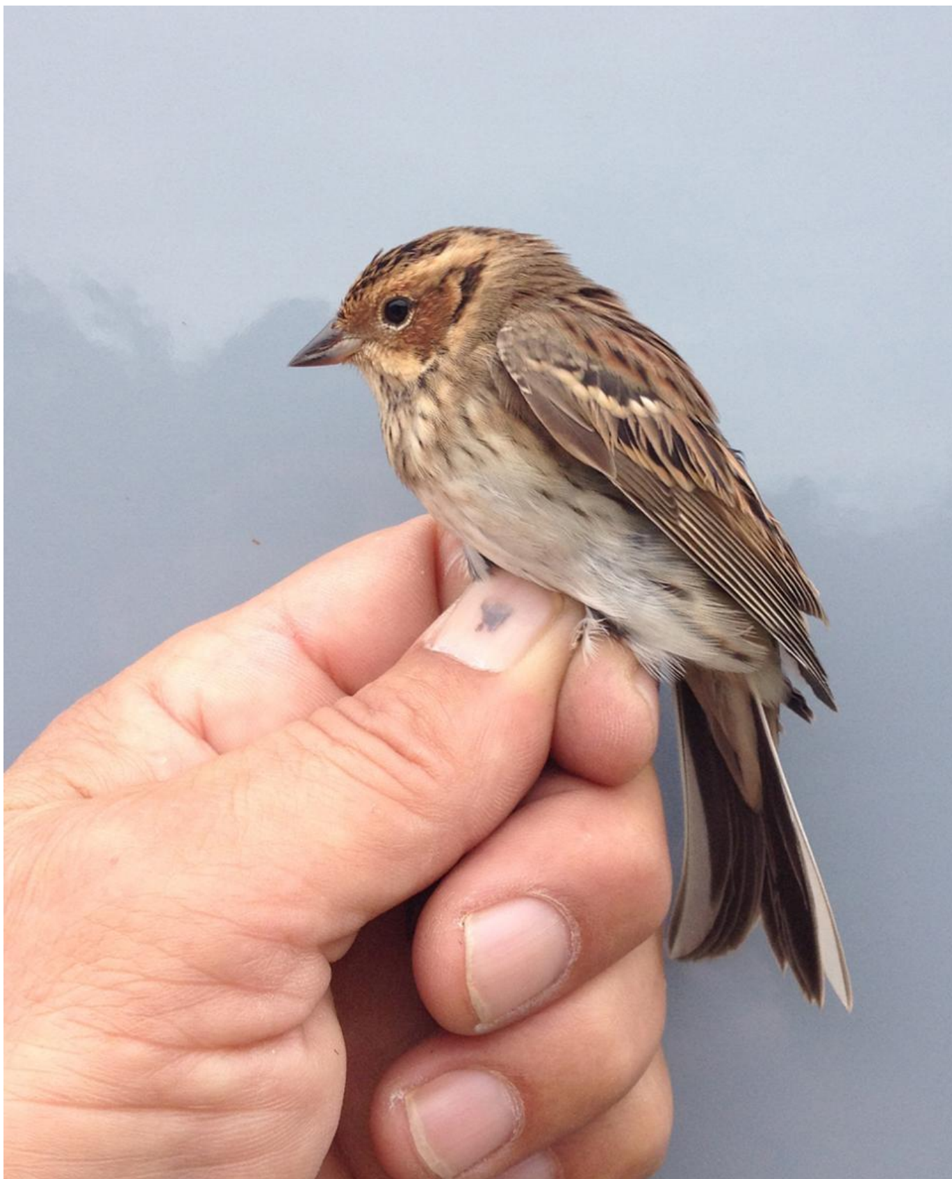
Dvärgværling, Hanstholm den 12. oktober.