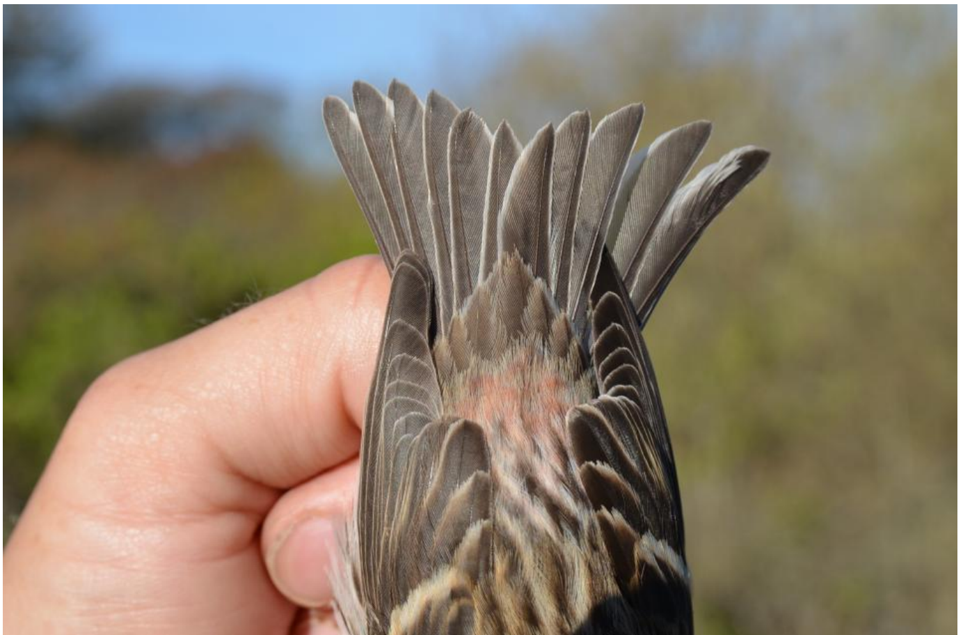
Fuglens overgump.