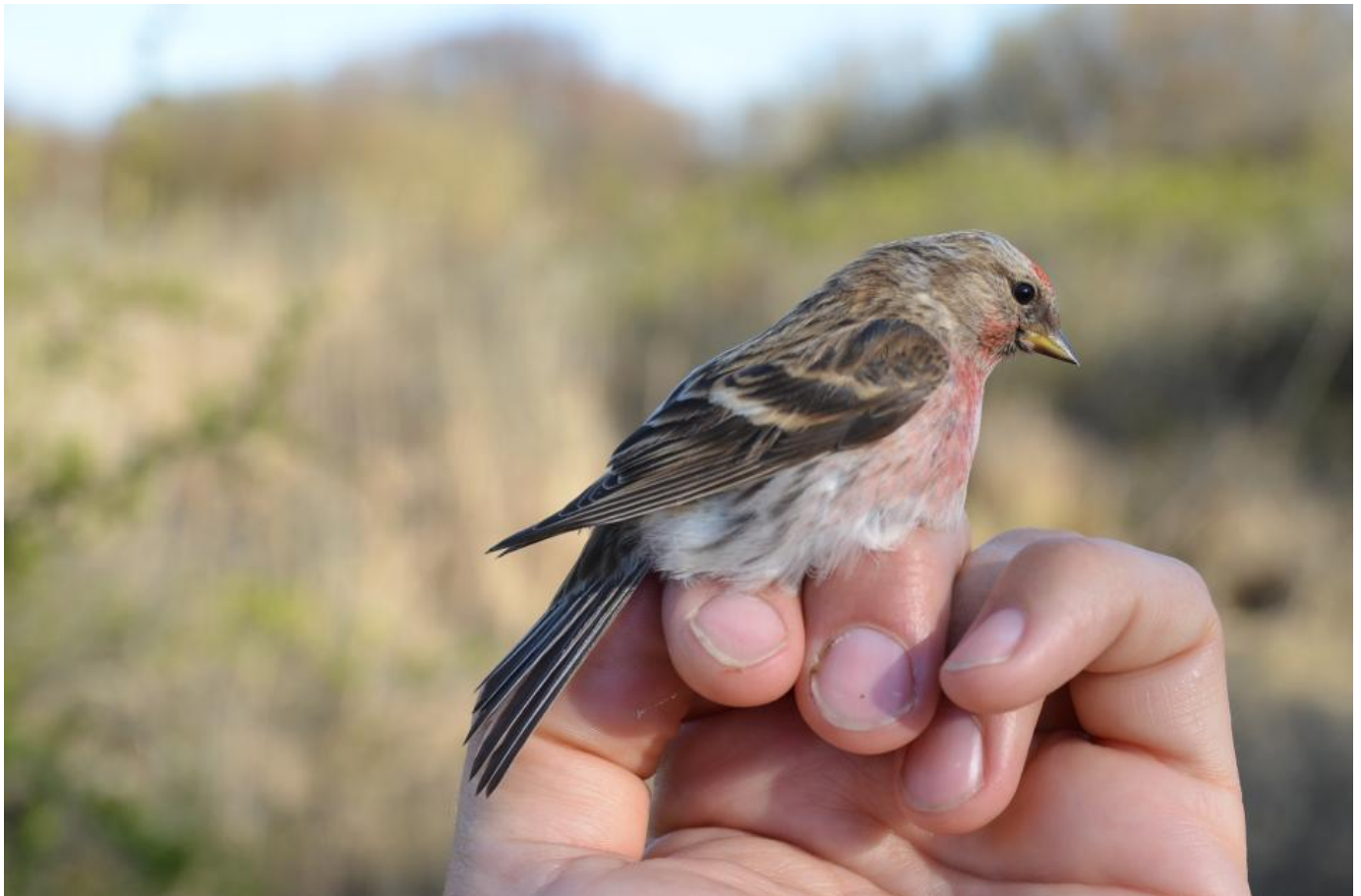
Lille gråsisken, Skagen den 2. maj. At fuglen ikke er en hvidsirken ses tydeligt på den varmt brune ryg, det lange næb, og det meget røde bryst.