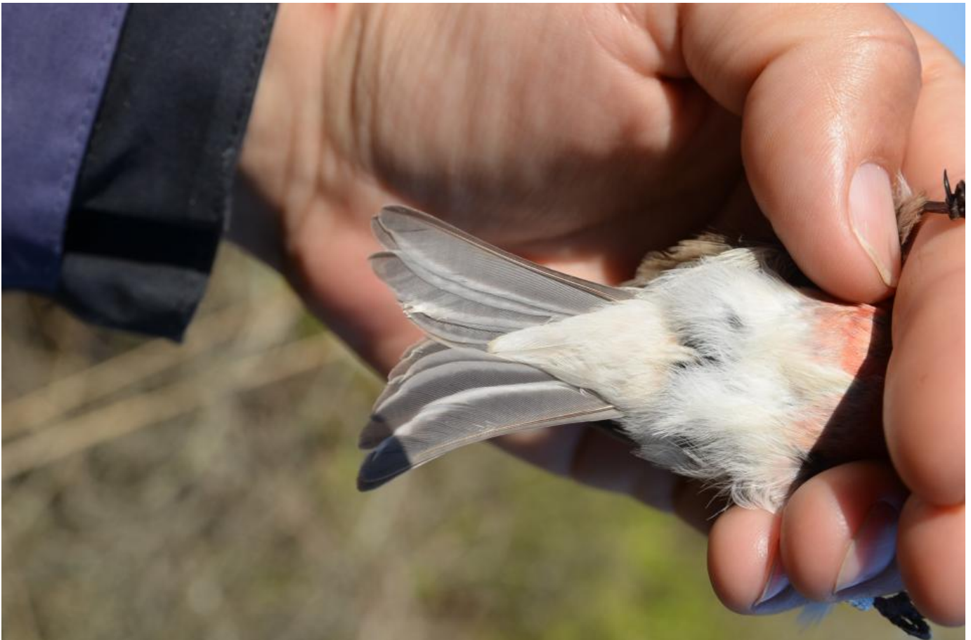
Fuglens undergump var helt hvid, helt uden tegninger.