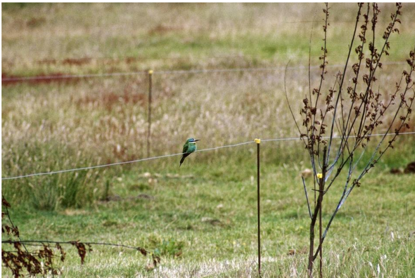
Den grønne biæder ved Vesterlund, Værnengene den 29. juni 1993. En kulmination ovenpå et fedt forår på Tipperhalvøen. Ynglefugletællingerne var i hus og indenfor et par dage var der udskiftning i noget af personalet. Det blev et fedt, tak for denne gang, for flere af de implicerede.