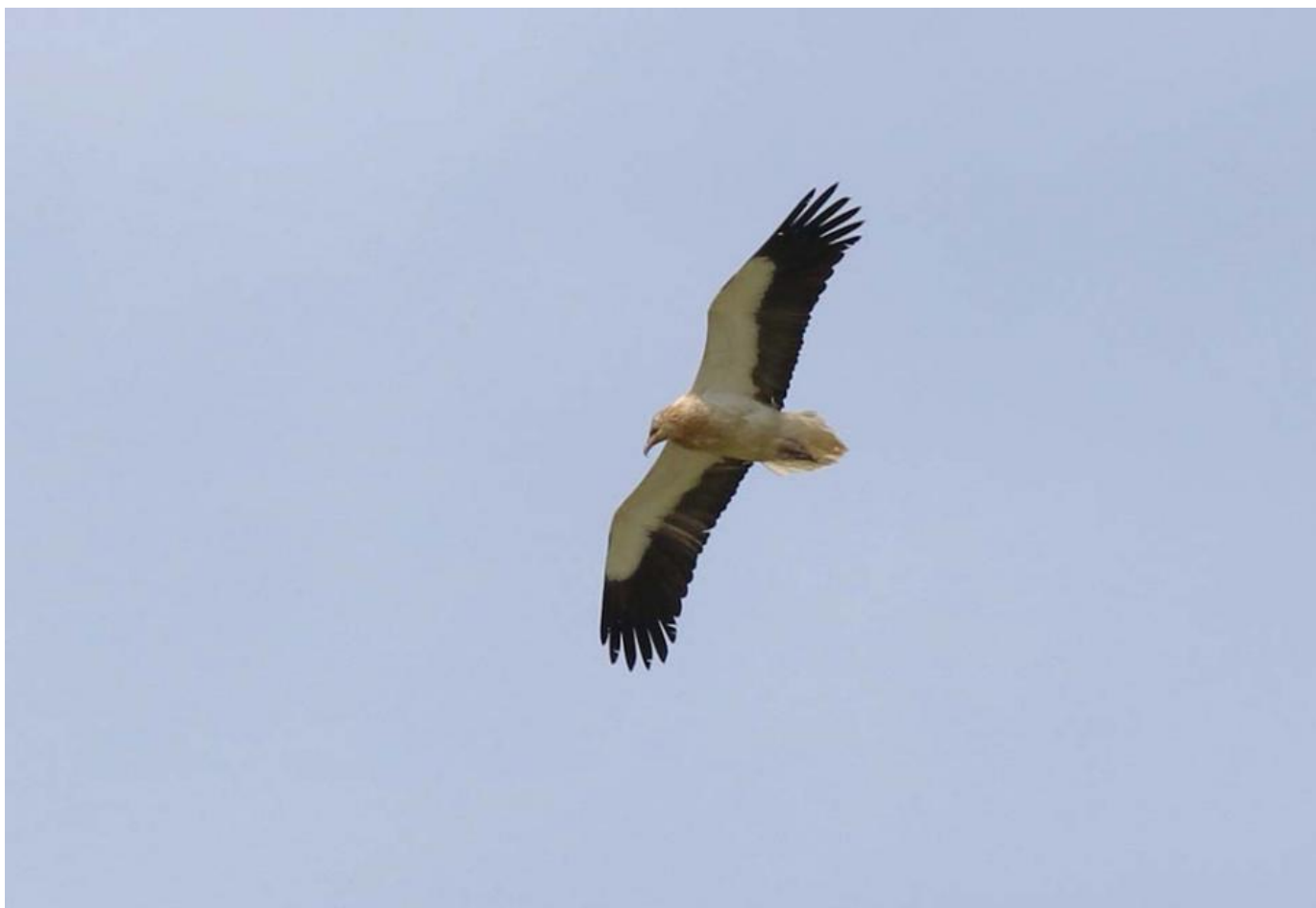
Danmarks 4. ådselgrib, Albuen Strand den 5. juni 2017.