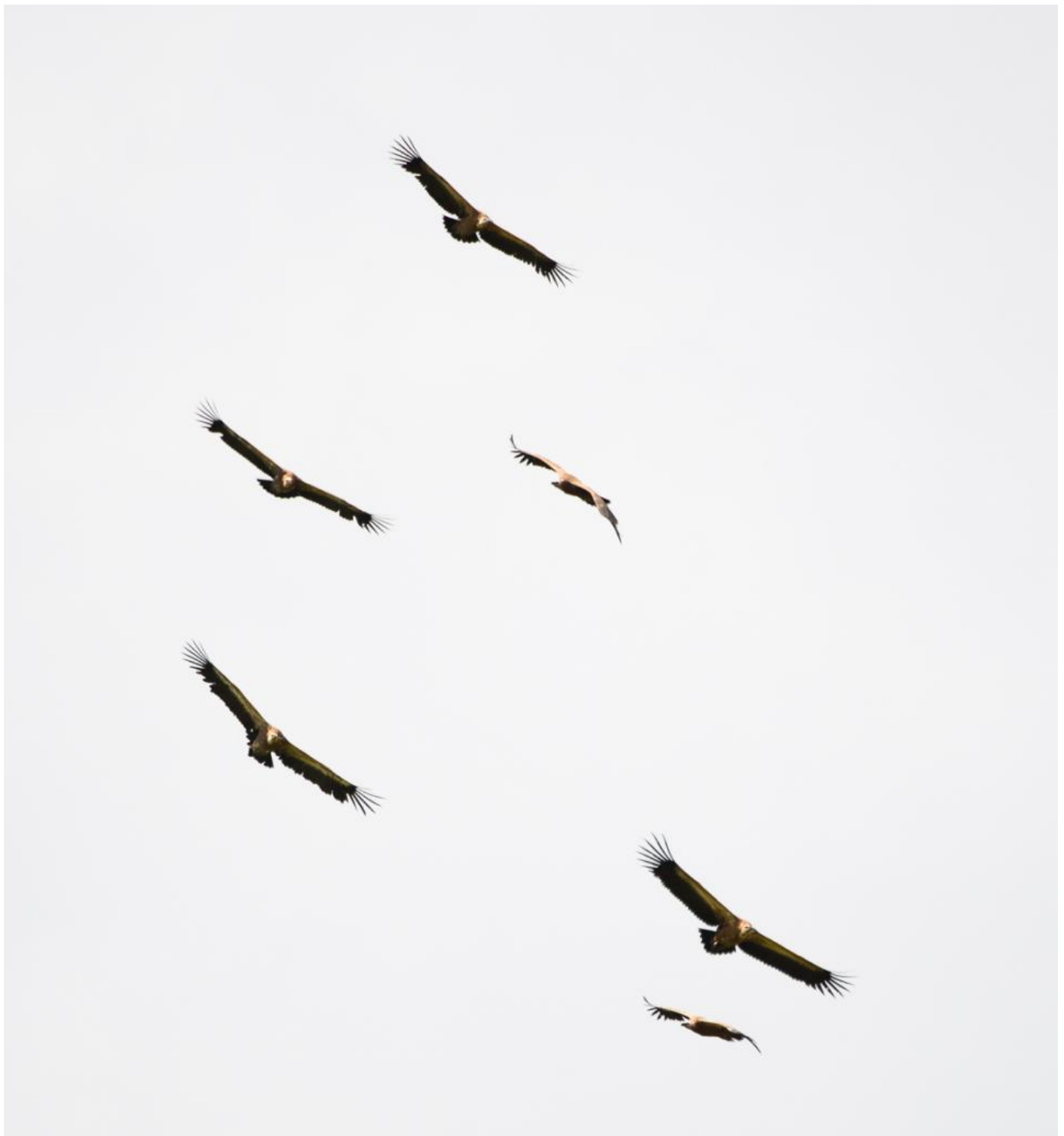
Gåsegribbe, Kællingtand den 26. juni 2016.

God fornøjelse derude og tak til samtlige fotografers udlån af billeder til artiklen.