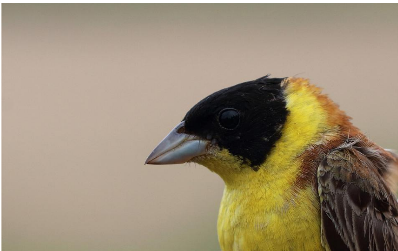
Hættéværling, Grenen den 3. juni 2017.