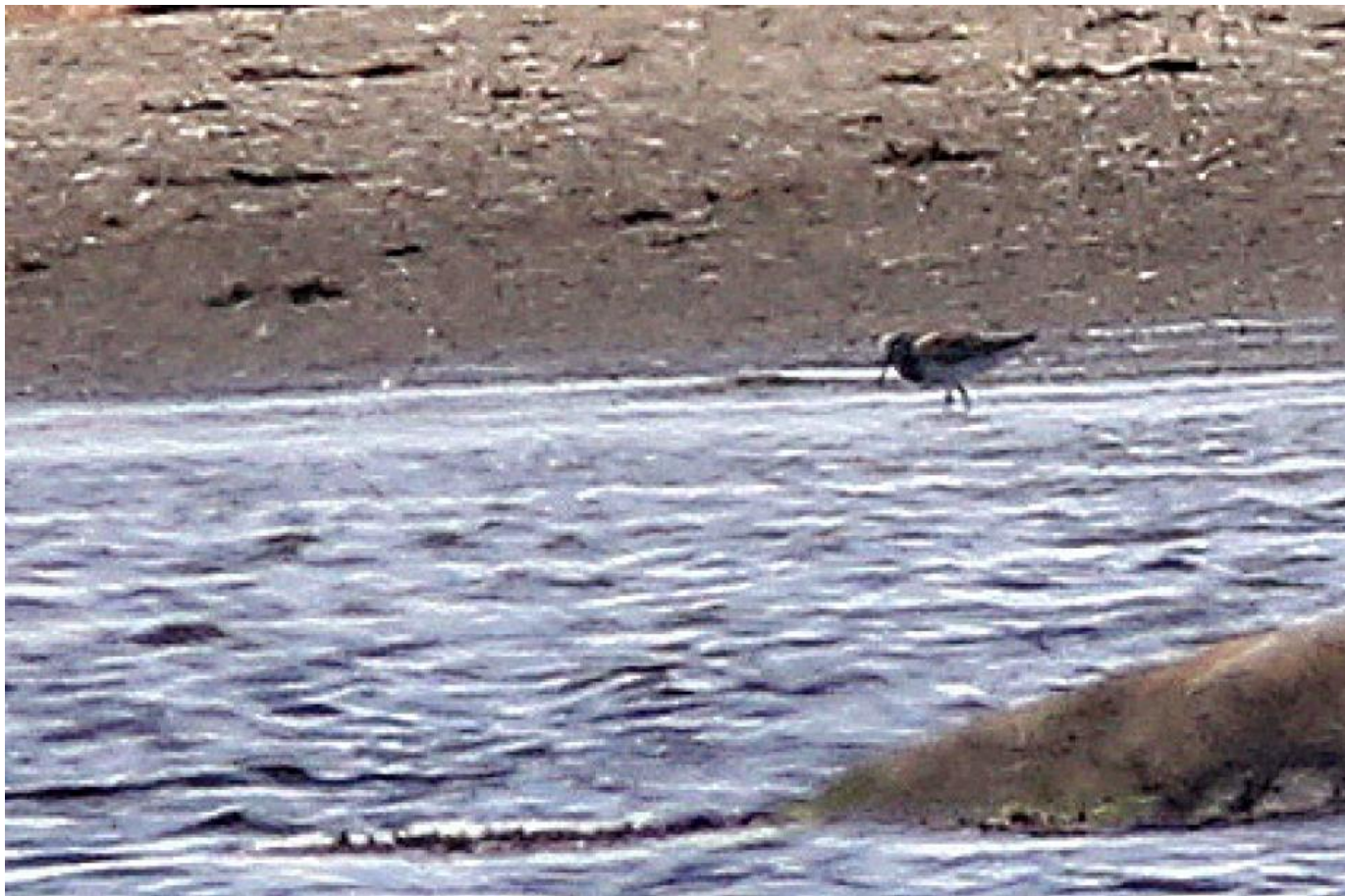
Storryle, Västrävet, Ottenby, Sverige den 12. juni 2014.

Næbbet er længere, og halepartiet virker også længere. Derudover bemærker man en påfaldende mørk brysttegning og en smuk overside, hvor rødbrune fjer i skulderfjerene blander sig med de øvrige grå- og sorte tegninger. Oversiden minder således lidt om stenvenders i sommerdragt.