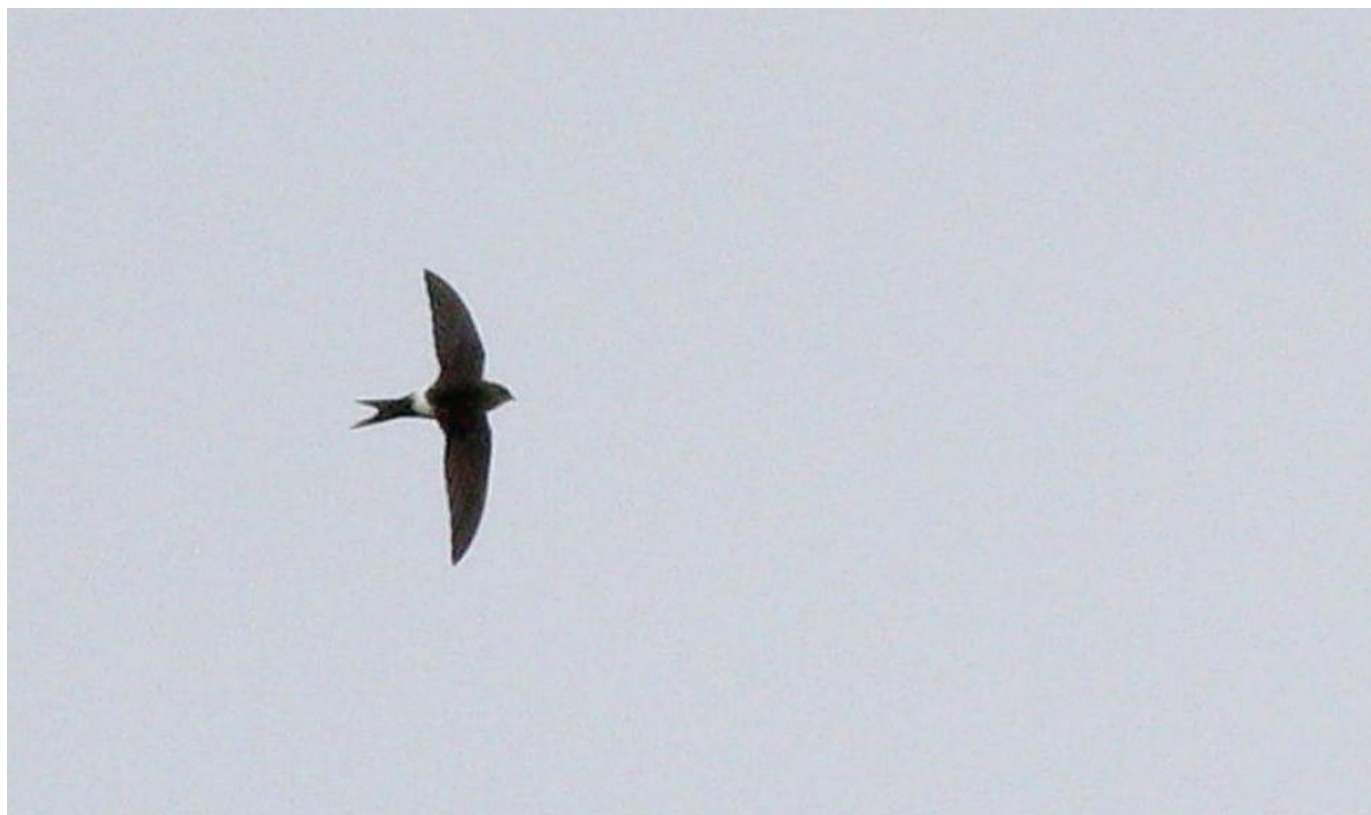
Orientsejler, Præstesø den 25. maj 2013.

En af dem er orientsejler. En art der på sin vis er gået hul på i Danmark med hele fire fund på blot fire år (senest i 2014 med to fund). I ustadige vejr-situationer med regnbyger oplever man ofte ansamlinger af mursejlere over vådområder og søer. Finder man en gruppe af rastende sejlere, bør man bruge tid på at tjekke dem igennem og lede efter en hvid overgump. Dernæst vil det gå op for en, hvis det er en orientsejler, man har foran sig, at proportionerne er en smule anderledes, idet vingerne er en tand længere, ligesom halekløften, og på de billeder man tager kan man forhåbentlig se lyse skæl på kroppen. Tre af de danske orientsejlere er truffet ultimo maj, men det første danske fund skete den 15. juni 2010, hvor fuglen rastede med en stor mængde mursejlere over Hejresøen på Vestamager i nogle timer inden en meget kraftig regn- og tordenbyge.