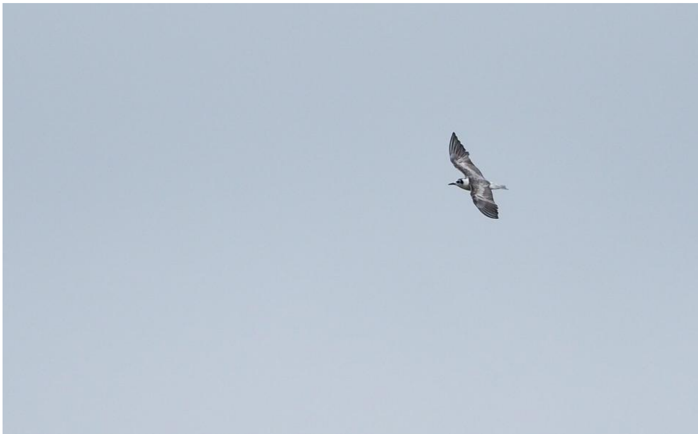
Hvidvinget terne, 2K, Nyord den 18. juni 2017. Bemærk især oversidens slidte udseende samt hovedtegningerne med de smalle "høretelefoner" på øredækfjerene, det lille næb, det isolerede øje, det lille område med mørkt på issen og den mørke "hestehale".