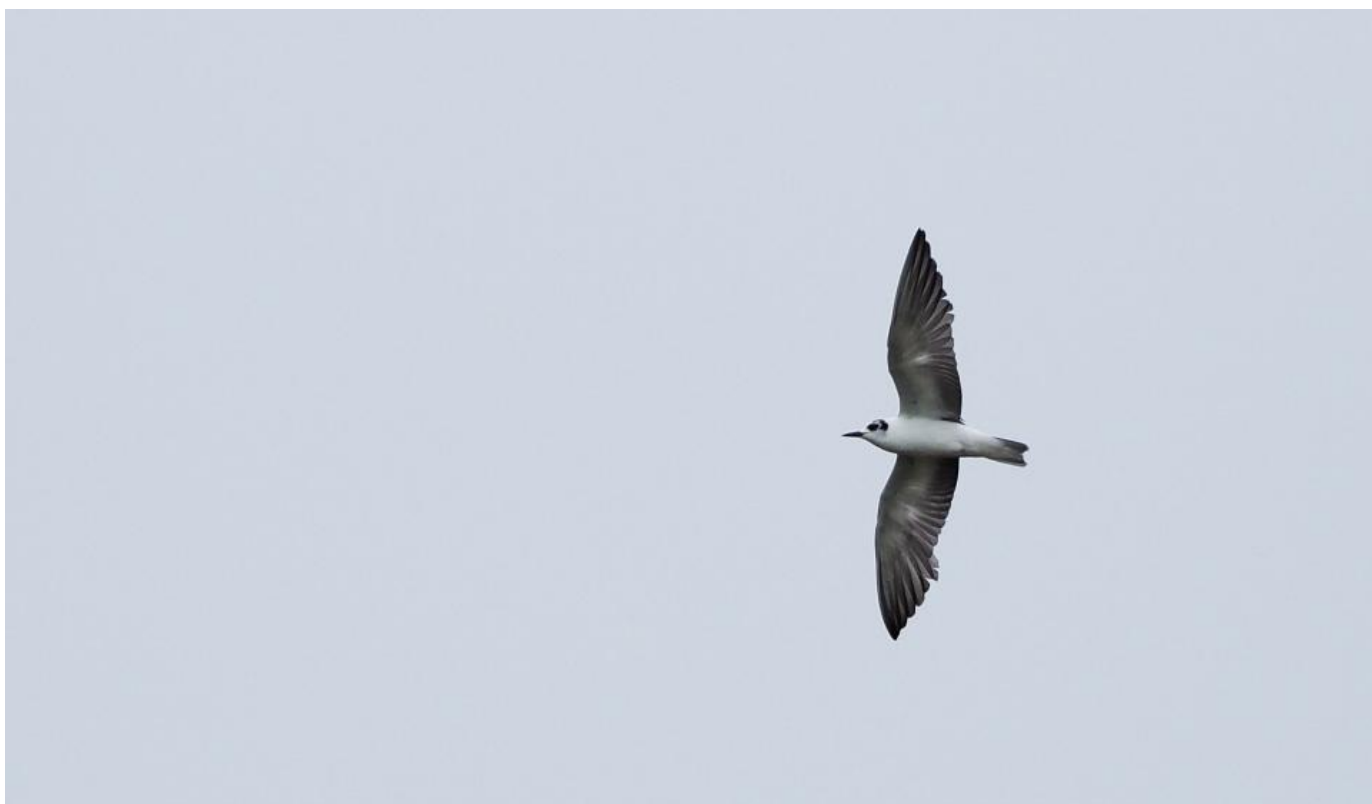
Hvidvinget terne, 2K, Nyord den 18. juni 2017. Bemærk især hovedtegningen, det lille næb, de slidte håndsvingfjer (bortset fra de to inderste) samt at der ikke er mørk "kommattegning" på brystsiden.

Dertil ses det nu at næbbet virker lille og ansigtet lyst, da der kun er mørke "hovedtelefoner", begrænset mørkt på issen og en smal "hestehale". Øjet sad isoleret.