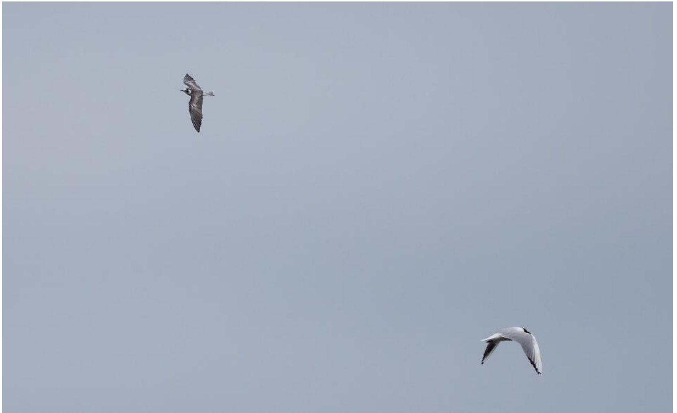
Hvidvinget terne, 2K (og hættemåge), Nyord den 18. juni 2017. Bemærk de to inderste friske håndsvingfjer som er lysegrå.

Fældningsmæssigt kunne vi på billederne tydeligt se, at de to inderste håndsvingfjer var nyfældede og friske, og stod frem som lysegrå mod de mere slidte og brunsorte øvrige håndsvingfjer.