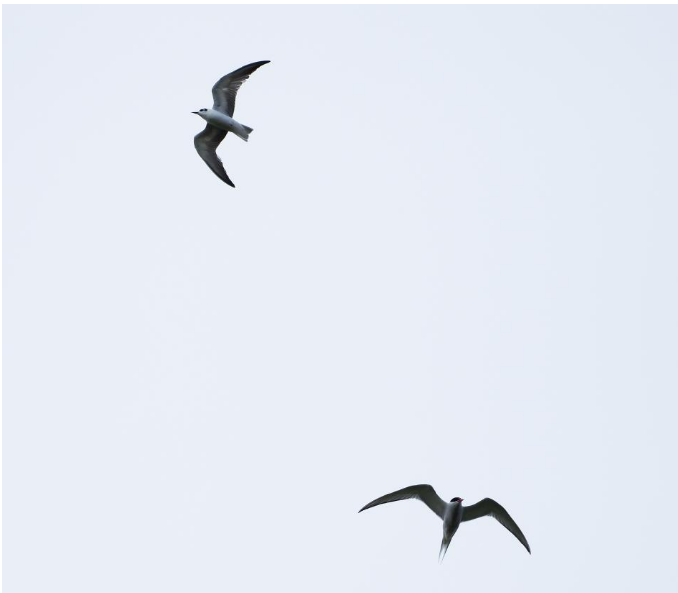
Hvidvinget terne, 2K, øverst og havterne 3K+ nederst, Nyord den 18. juni 2017. Bemærk hvidvinget ternes mere kompakte, bredvingede og korthalede silhouet i forhold til havternens ditto.

Generelt er det lidt kuriøst at se immature terner på vore breddegrader. 2K og 3K hav- og fjordterner ses regelmæssigt i små antal på en del lokaliteter. Immature moseterner (sort-, hvidvinget- og hvidskægget terne) ses imidlertid meget sjældent.