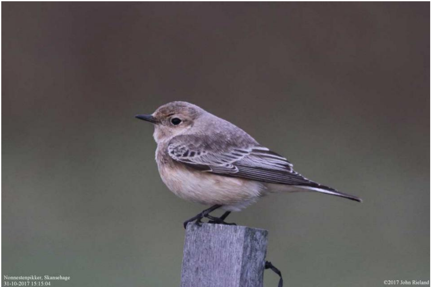
Nonnestenpikker, Skansehage, Rørvig den 31. oktober 2017. Bemærk kølige farvetoner og mørke meleringer i ryggen.