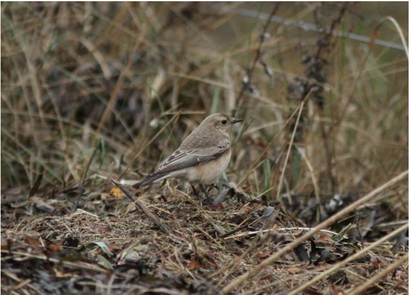
Nonnestenpikker, Skansehage, Rørvig den 1. november 2017. Bemærk de kølige farvetoner og mørke melinger i ryggen.

Men der er muligvis mere godt på vej. Fra Sverige er der meldinger om krognæb på vej. Idag er der således set tre fugle på en lokalitet i sydenden af Vänern blot ca. 80 kilometer fra Göteborg. Længere i nord rapporteres om store bevægelser hos denne eftertragtede art. Stora Fjäderägg Fågelstation, der er beliggende udfor Umeå, meldte den 27. oktober om 500 rastende fugle på øen, hvoraf 67 blev ringmærket!