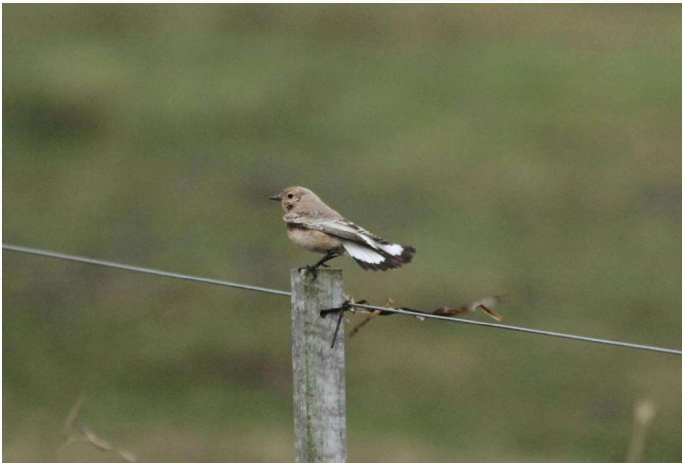
Nonnestenpikker, Skansehage, Rørvig den 1. november 2017. Bemærk haletegningen med en smalt sort endebånd der bliver lidt bredere på de yderste halefjer.