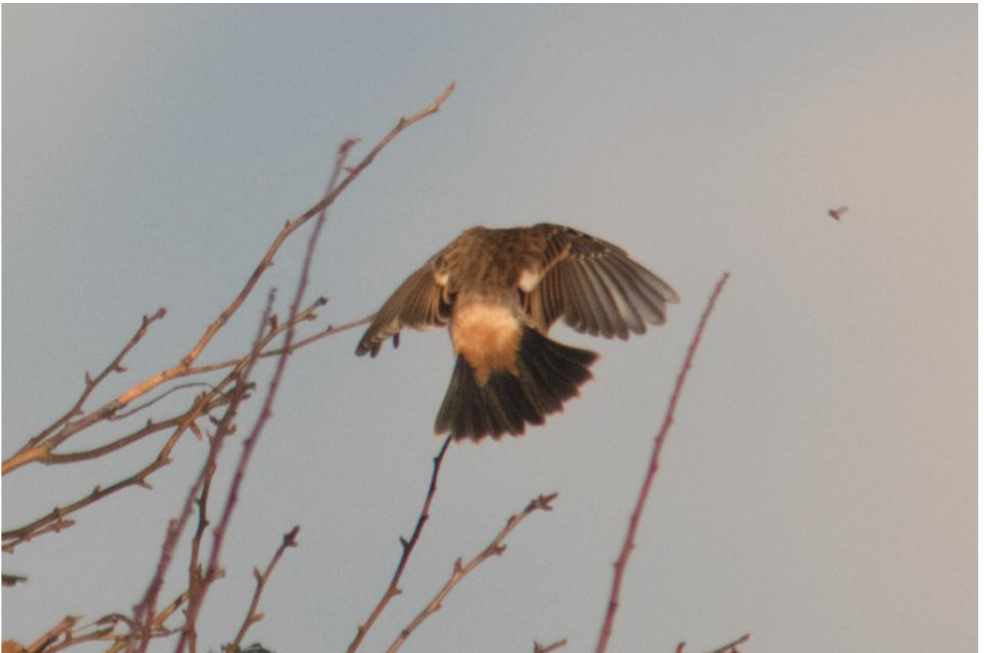
Stejnegeri sibirisk sortstrubet bynkefugl, Gedser Odde den 30. oktober 2017.

Fuglen tyder på at være en stejnegeri primært på grund af den varmt rødbrune overgump. Der er godkendt fugle i både Finland (1), Holland (1 – et eksemplar der senere blev set i England), Sverige (1) og England (5 - heraf dog kun to godkendt) (se club300.dk ). De godkendte er vist alle godkendt på baggrund af DNA-analyse, og stejnegeri viser tydelige forskelle på dette punkt fra sibirisk sortstrubet bynkefugl (maurus).