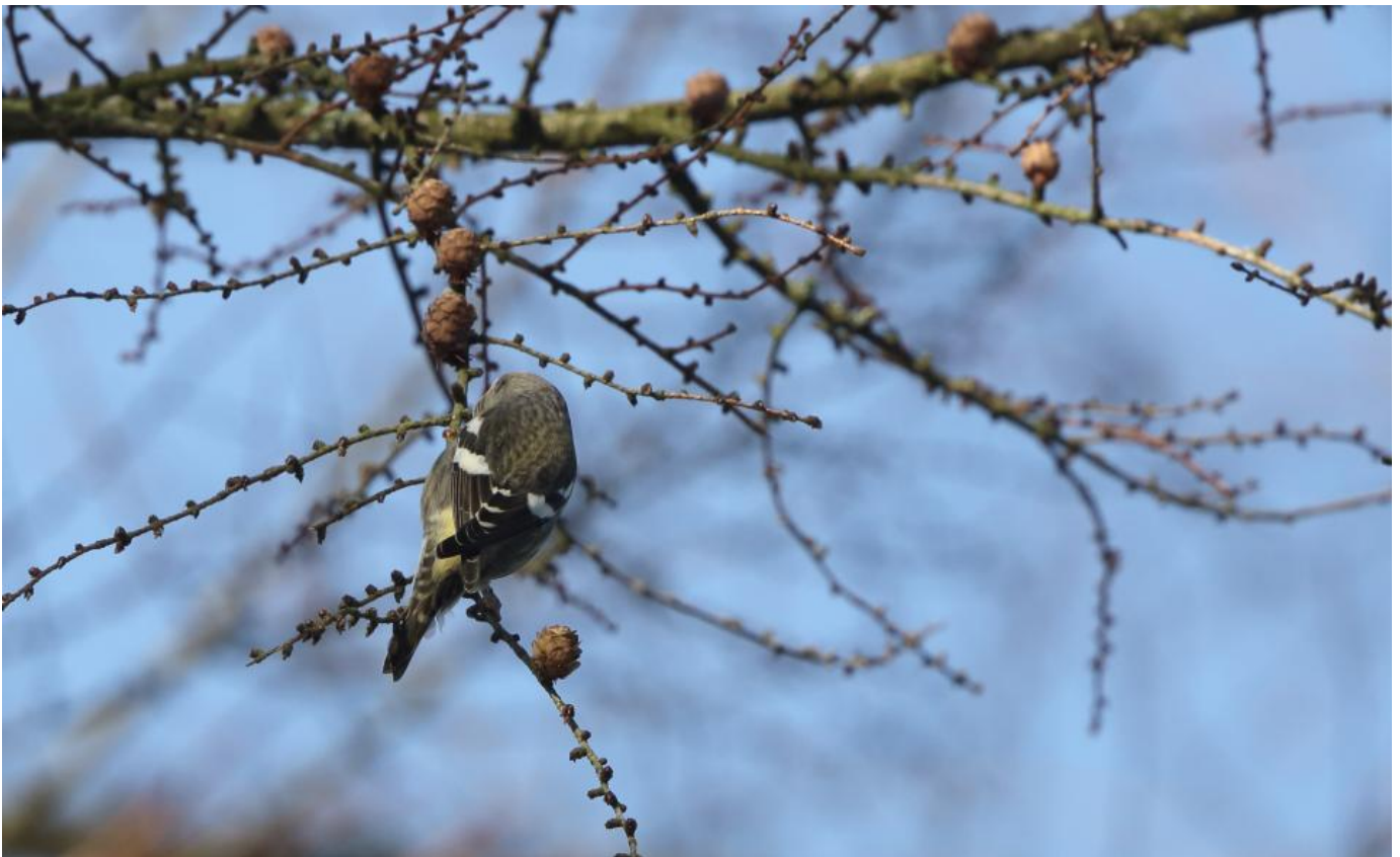
Hvidvinget korsnæb, hun, Gribskov januar 2015. Bemærk, udover de kraftige hvide vinge­bånd, de brede hvide tegninger i spidsen af tertialerne.

Hvidvinget korsnæb er den mindste og finest byggede og med det slankeste næb af de tre arter, men hvor fjerdragstens udseende er mest vigtig hos hvidvinget korsnæb i forhold til de andre arter, er det altså