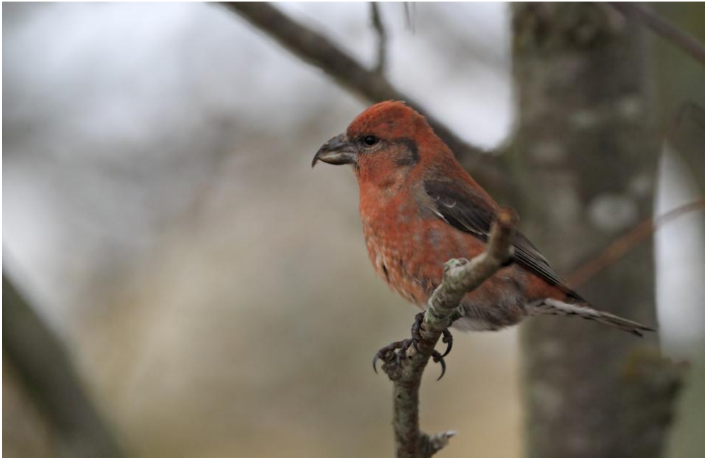
Lille korsnæb, han, Blekinge oktober. Bemærk især næbformen og sammenlign med stor korsnæb. Næbformen hos lille korsnæb er tydeligt længere end den er højere.

Lille korsnæbs næb er først og fremmest altid mere langt end det er højt. Undernæbbets krumning er ikke så udtalt som på stor korsnæb, og de krydsede næbspidser ses tydeligt stikke frem, således at hvis man ser lille korsnæb i profil, ses undernæbbets spids stikke op over overnæbbets spids. At næbbet virker længere end det virker højt, er dog det vigtigste at lægge mærke til.