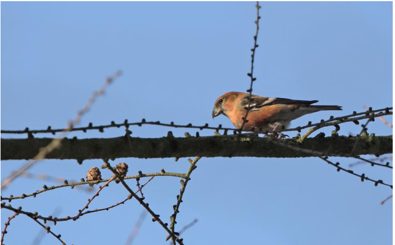
Hvidvinget korsnæb, han, Gribskov januar 2015. Bemærk 2 kraftige hvide vinge­bånd og ret smalt næb, der virker længere end det er højt.