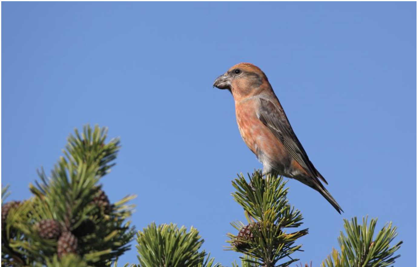
Stor korsnæb, han, Nordsjælland oktober. Bemærk det kraftige næb, der næsten er lige så langt, som det er højt. Bemærk også det meget store hoved. Sammenlign med billederne af lille korsnæb.