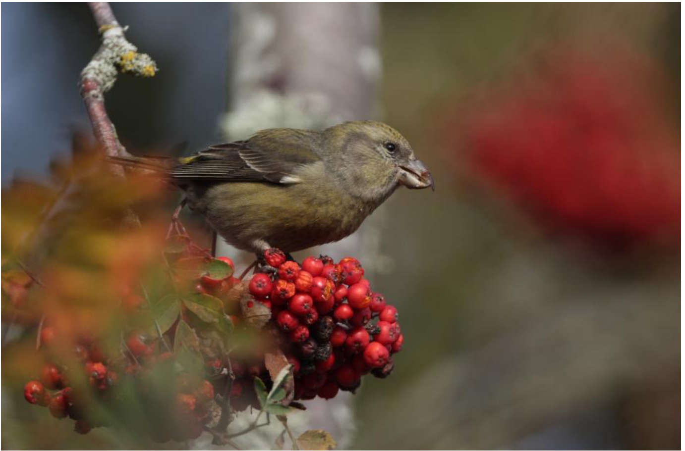
Lille korsnæb, hun, Öland oktober. Bemærk det smalle vingeband og de smalle lyse kanter på tertialerne og sammenlign med billederne af hvidvinget korsnæb. Små korsnæb med let åbne næb kan nemt give indtryk af at have et kraftigere næb, end det i virkeligheden er - ligesom på dette billede.

Stor korsnæbs næb er omtrent lige så højt, som det er langt. Både over- og undernæb er tydeligt krumme. Undernæbbets spids er ikke lige så lang som hos lille korsnæb, hvorfor næbkrydsningen bliver mindre tydelig. Næbbet virker mere stumpt i spidsen, hvor næbbet hos lille korsnæb er tydeligt tilspidset i formen. Hovedet virker meget stort på stor korsnæb, og i kombination med det store næb får man ofte associationer til en papegøje når man ser dem.