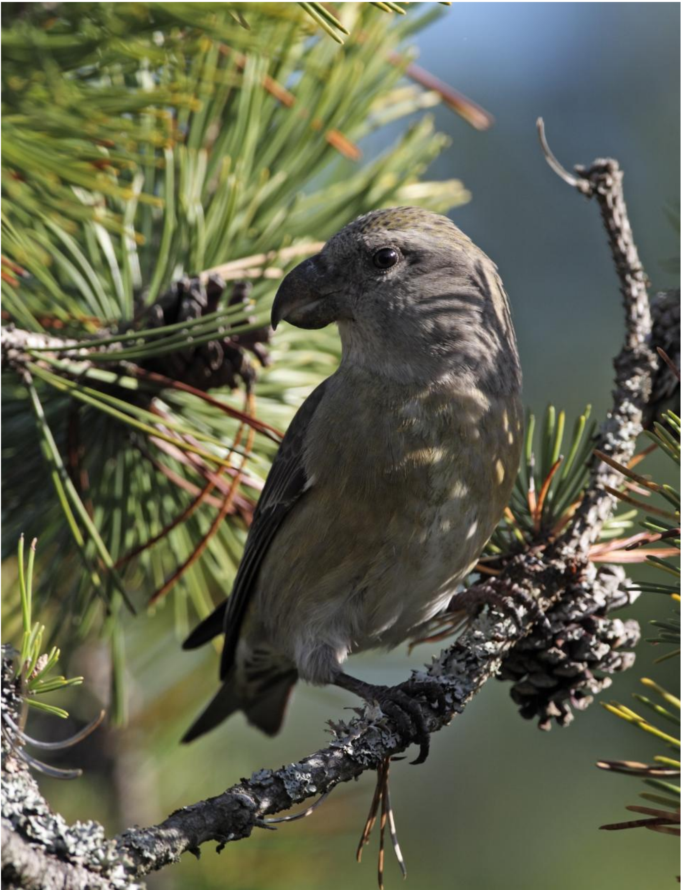
Stor korsnæb, hun, Nordsjælland oktober. Bemærk hvor stærkt buet både overnæb og undernæb er. Papegøjelocket er meget udtalt!