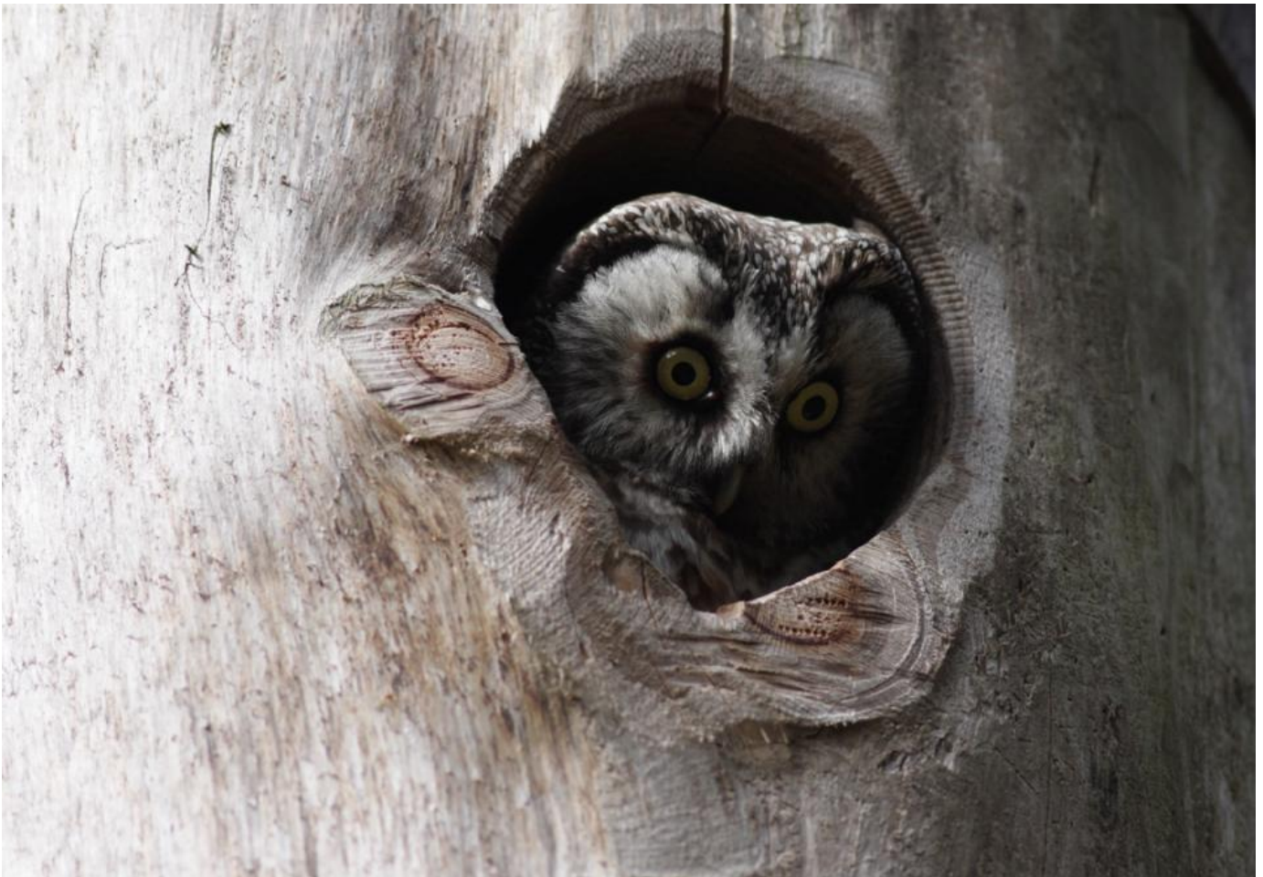
Voksen perleugle titter frem fra opsat kasse på Bornholm.

Ved samarbejdsudvalgsmøde mellem DOF Vestjylland og Naturstyrelsen Vestjylland I efteråret 2014 var et af punkterne opsætning af redekasser til perleugle og vendehals i Klosterheden.