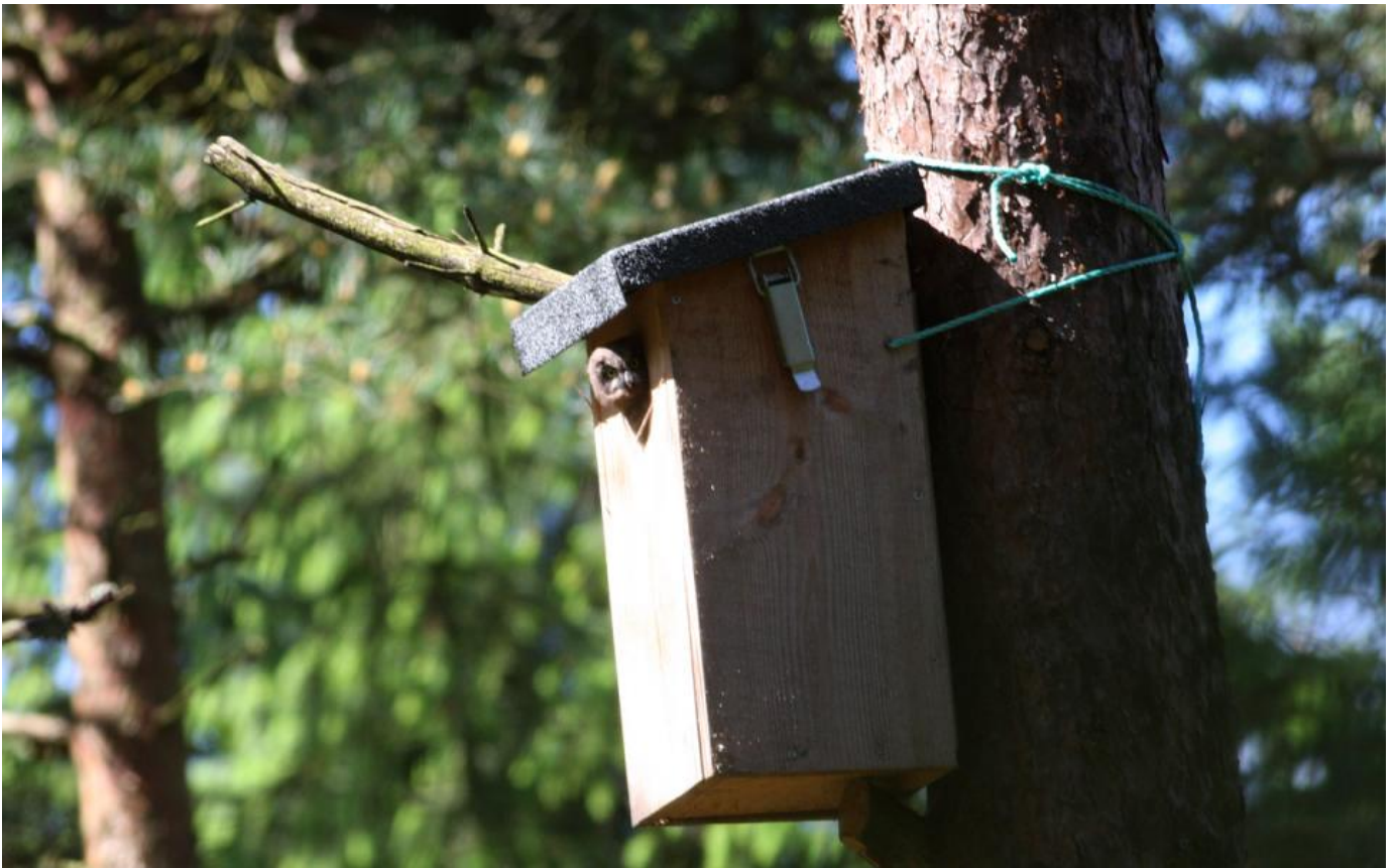
En af ungerne i det første ynglefund i Klosterheden.