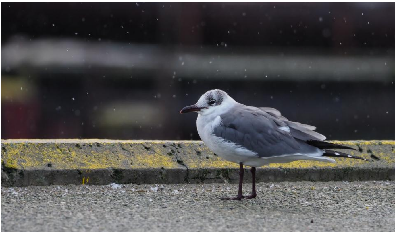
Lattermåge, Hanstholm Havn den 30. december 2017.

Den så lidt sløj ud, og den haltede lidt, men efter et stykke tid lettede den, og fløj efterhånden i fin stil i retning af havnen.