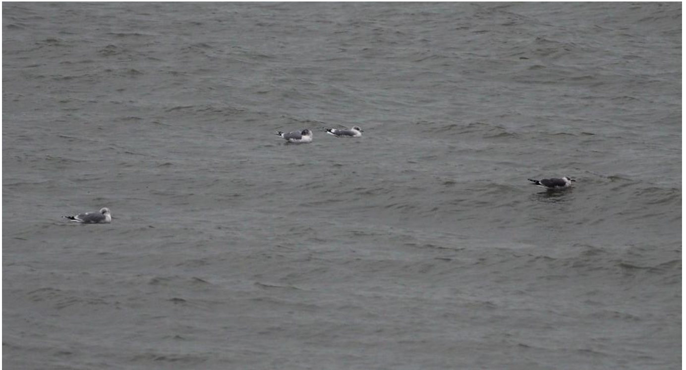
Lattermåge på havet (længst til højre) med stormmåger. Læg mærke til den mørke overside og det langvingede slanke jizz.

Havnen bød også på i alt 4 gråmåger og en sorthovedet måge. Senere blev der på en mark udenfor Hanstholm fundet tre sorthovedede måger. En adult, en 2K og en 1K.