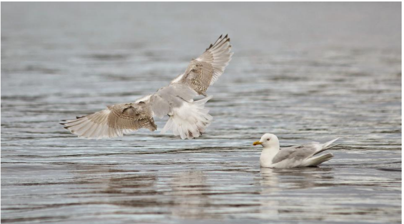
Baffinmåge, 3K efterår (til venstre) og adult hvidvinget måge, Grønland september. Bemærk de J-formede sorte tegninger i håndsvingfjerene der er mørkere end hånddækfjerene.

Formen på det mørke må mindst meget gerne være J-formet hos fuglene i immaturedragterne. Dvs at det mørke løber langs yderfanen af den enkelte håndsvingfjer, og runder vingspidsen på inderfanen af fjer.