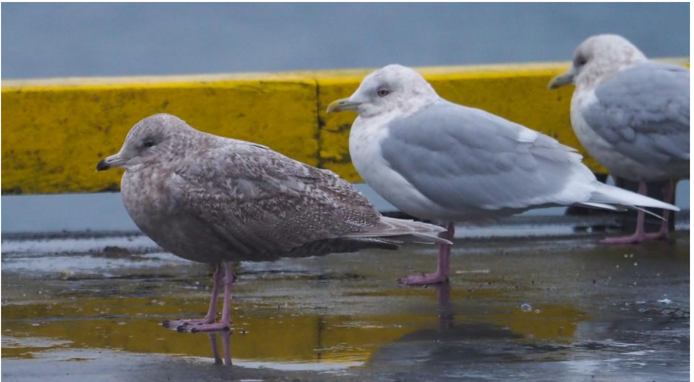
Hvidvingede måger, 3K (til venstre) og adult til højre, Island, januar 2017. Dragtvariationen hos hvidvinget måge er meget stor. Fuglen til venstre er et eksempel på en af de mørke "almindelige" hvidvingede måger (ssp. glaucoides). Bemærk også tegningen i håndsvingfjerene.

Kort opsummeret skal baffinmåges mørke tegninger i håndsvingfjerene vise kontrast mellem mørke yderste håndsvingfjerstegninger og lysere inderste. Det gælder alle aldre fra 1K til og med 4K.