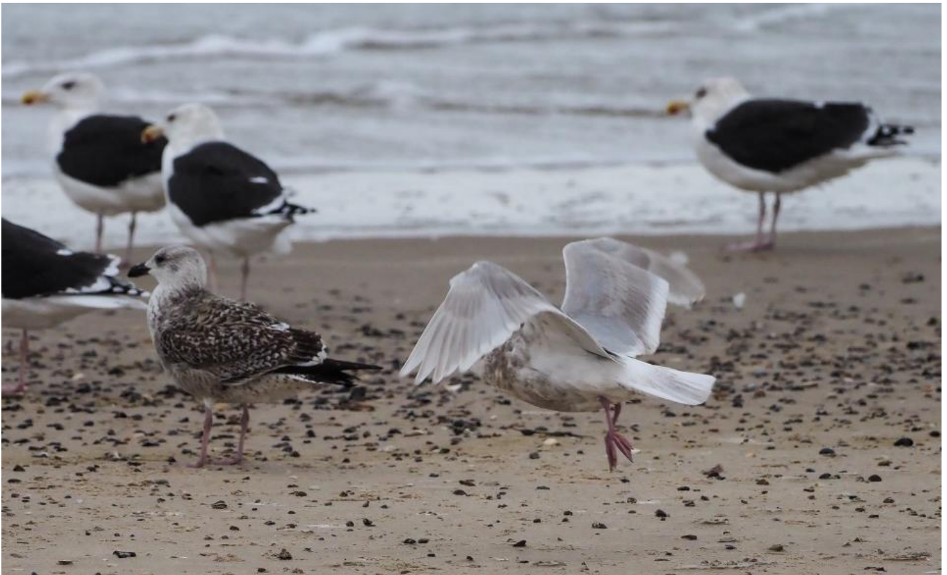
Hvidvinget måge (Hirtshalsmågen), 3K, Hirtshals Havn den 2. december 2017. Bemærk at de mørke tegninger i håndsvingfjerene ikke er J-formede, at de er samme farve som hånddækfjerene, at der ikke er små distinkte hvide pletter i de yderste håndsvingfjer og at halebåndet er afbrudt og ret diffust. Fuglen er en hvidvinget måge, ikke en baffinmåge.