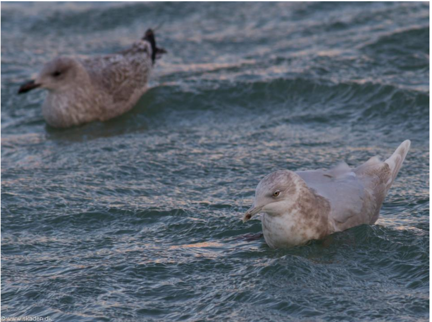
Hirtshalsmågen (til højre) sammen med sølvmåge, Hirtshals Havn den 7. januar 2018.

I al fald har der været lidt usikkerhed i felten i Hirtshals i forbindelse med den aktuelle 4K fugl.