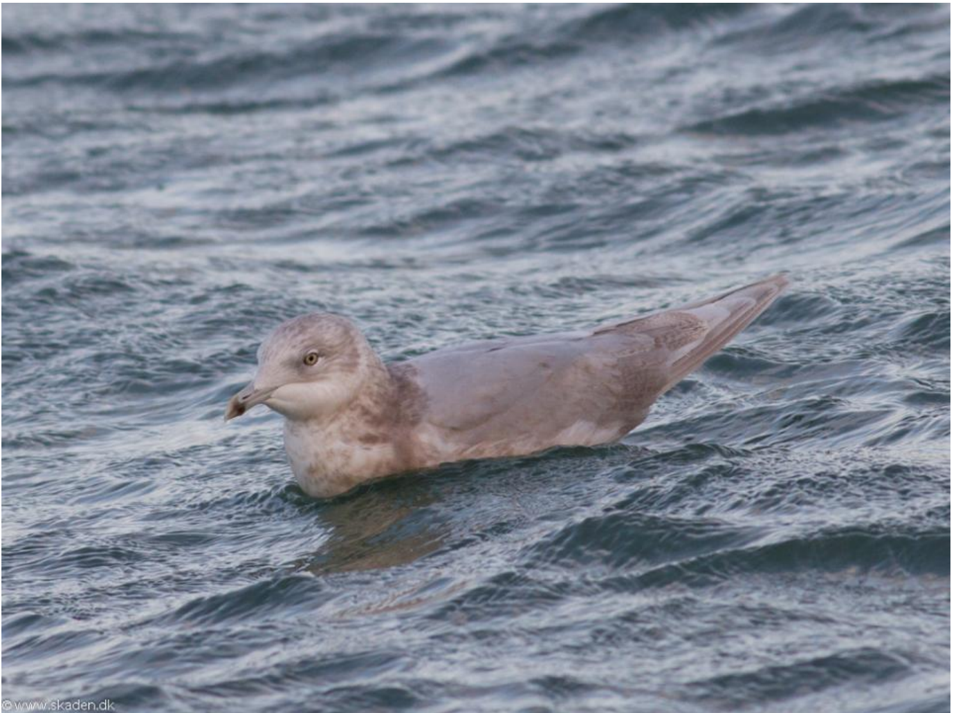
Hirtshalsmågen, en 4K. Hirtshals Havn den 7. januar 2018. Bemærk de mistænkelige mørke tegninger i håndsvingfjerene.

Allerede sidste år, da mange også besøgte Hirtshals på grund af den overvintrende sibiriske jernspurv, spøjte formentlig samme hvidvingede måge.