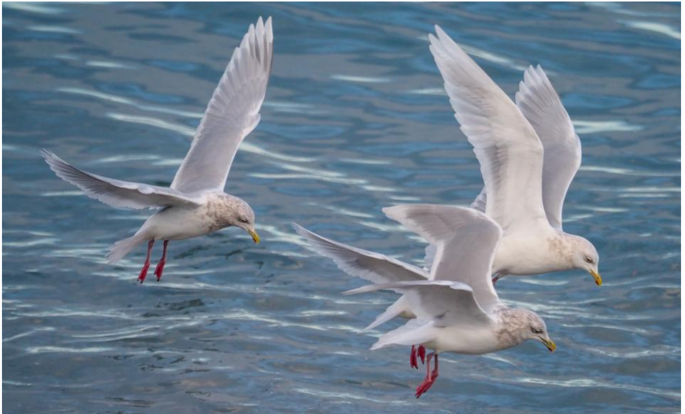
Baffinmåge, adult (til venstre) sammen med adulte hvidvingede måger, Island, januar 2017. Bemærk de distinkte sortgrå tegninger i de yderste håndsvingfjer. Denne karakter varierer meget hos adulte baffinmåger.

Adulte fugle er nemme at bestemme. Baffinmåger ligner hvidvingede måger, men de har sorte eller sortgrå tegninger i håndsvingfjerene i stærkt varierende grad og udseende. Adulte hvidvingede måger må ikke have nogen sorte eller sortgrå tegninger overhovedet. I felten kan det være svært at se på flyvende fugle (på fugle med små mørke tegninger), men det er nemt at se på fotos.