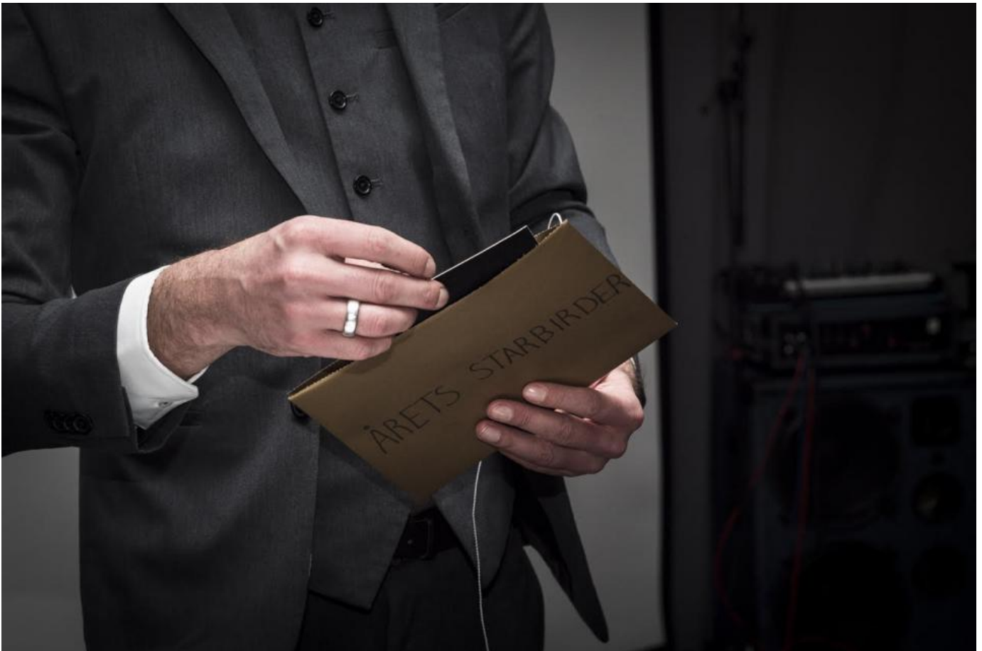
Danish Birder Awards var et ægte awardshow hvor detaljerne var på plads.