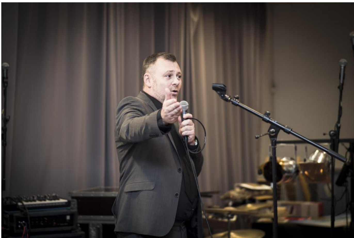
Rasmus Strack var medarrangør.