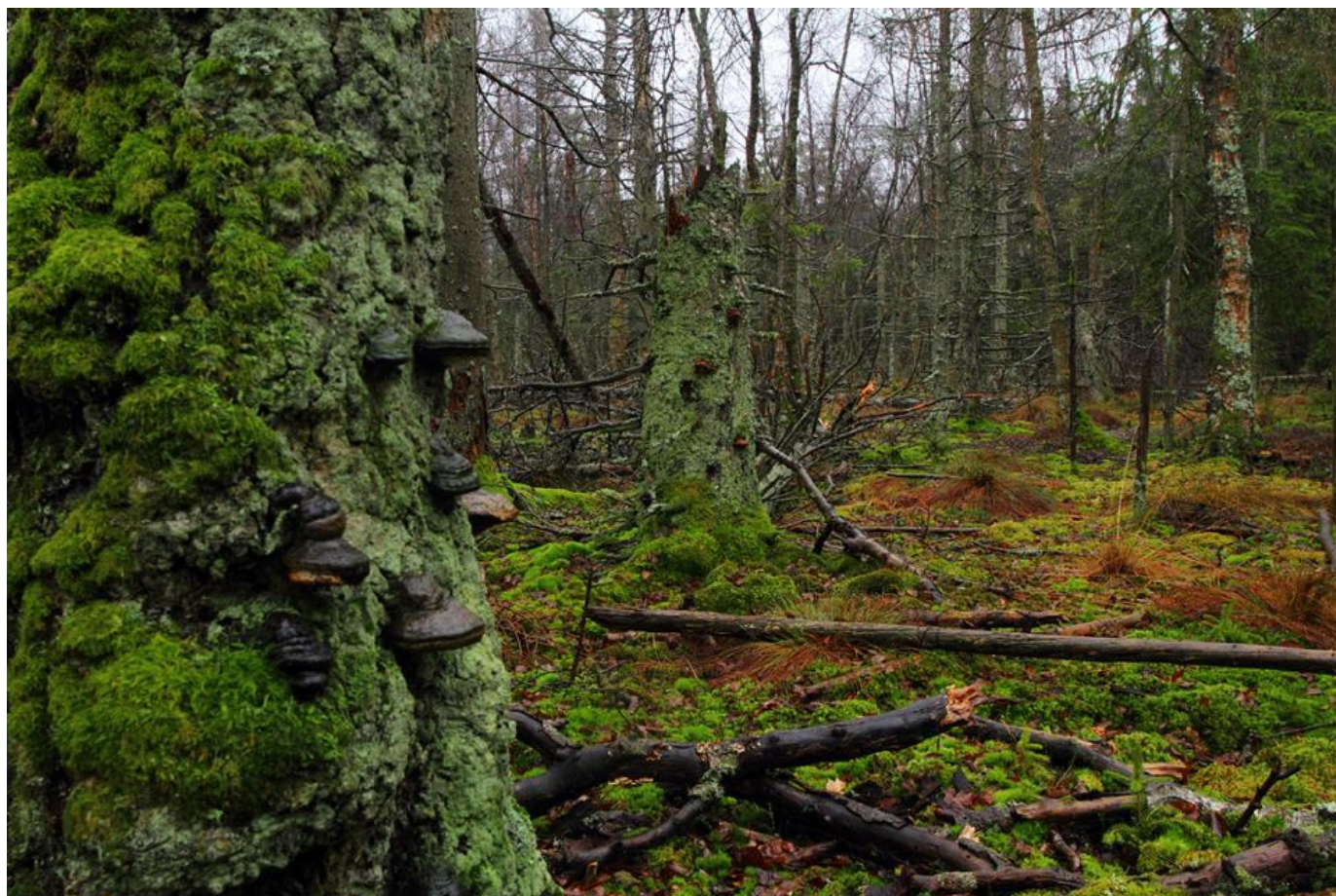
Maglemosen, Gribskov.

Der er meget aktivitet i fuglene på denne fine morgen.