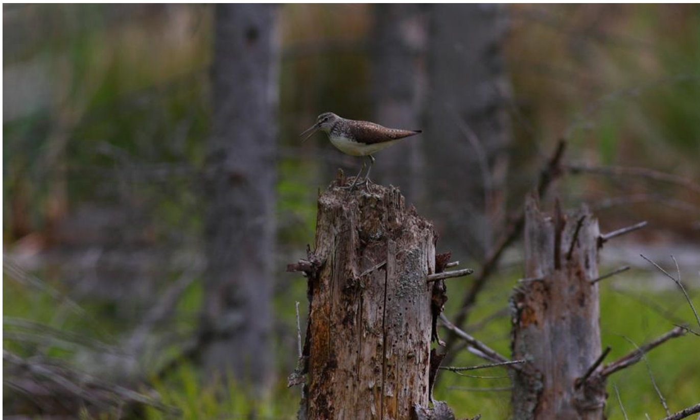
Svaleklire skælder ud fra toppen af en stamme i fattigkær.

Svalekliren er en sky fugl, så det er vigtigt, at jeg bevæger mig stille og forsigtigt frem i området.