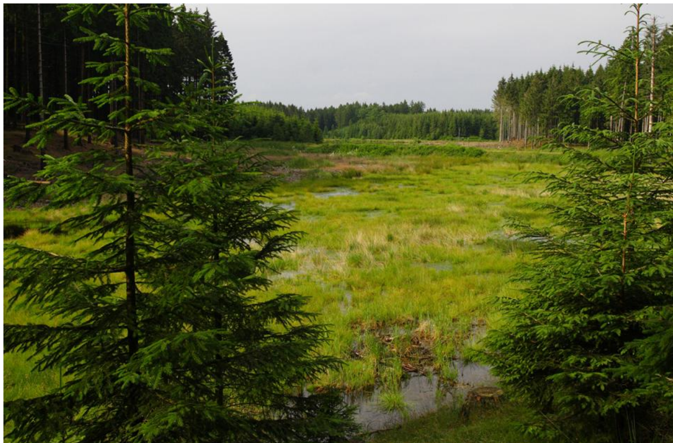
Klassisk svaleklirebiotop.

Umiddelbart er der ikke noget der ligner en svaleklirebiotop her. Men jeg kommer i tanke om, at jeg gik derinde sidste vinter, og at der ligger en meget tæt lille skovmose.