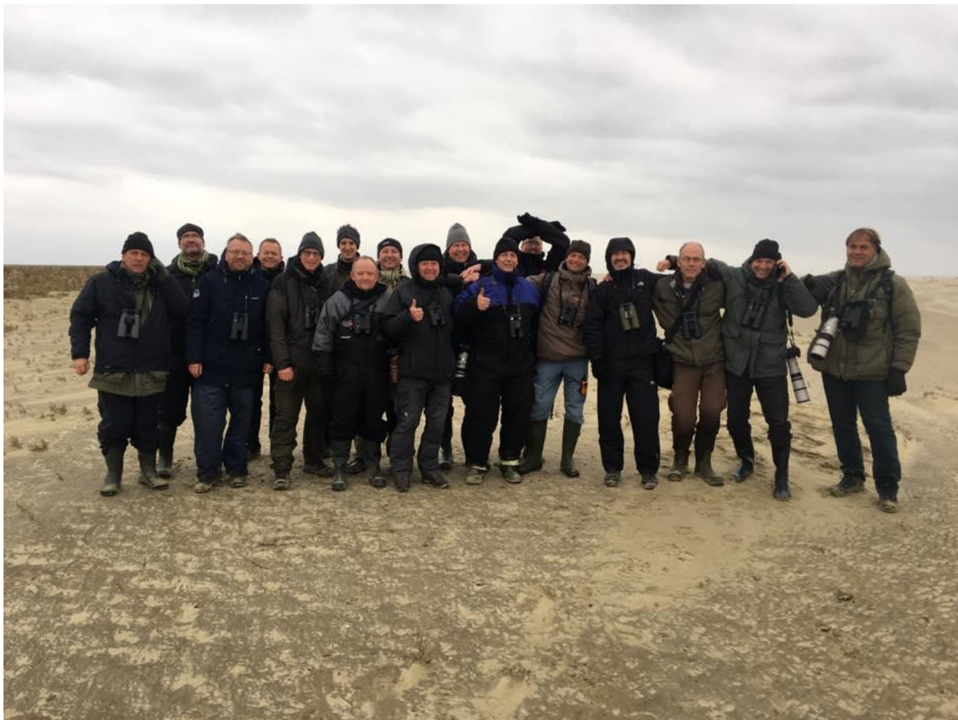
Twitthere forsamlet efter at have set hvidkindet værling, Hønen, Fanø uge 42 2016.