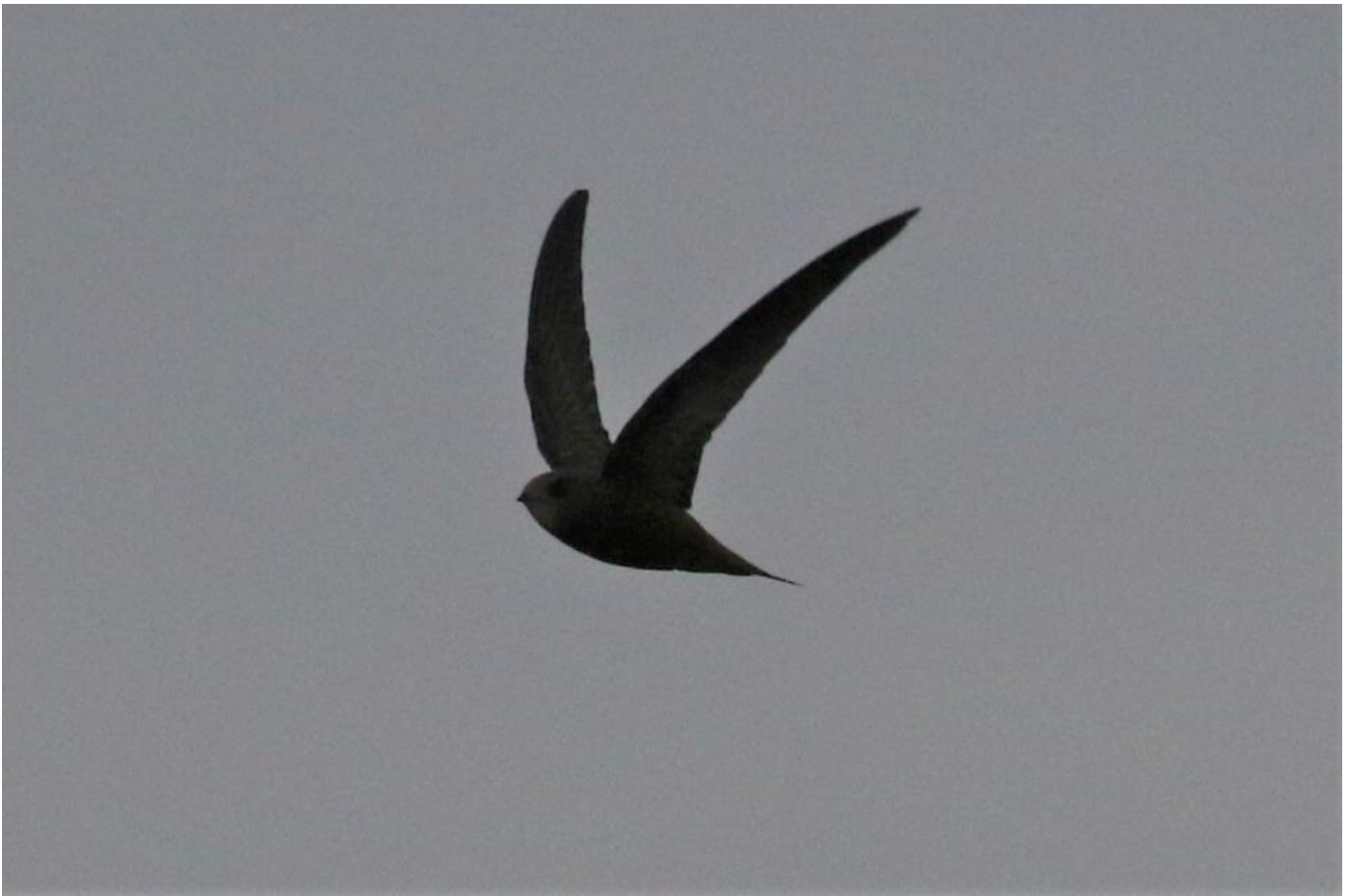
Gråsejler, Fanø den 20. oktober 2017.