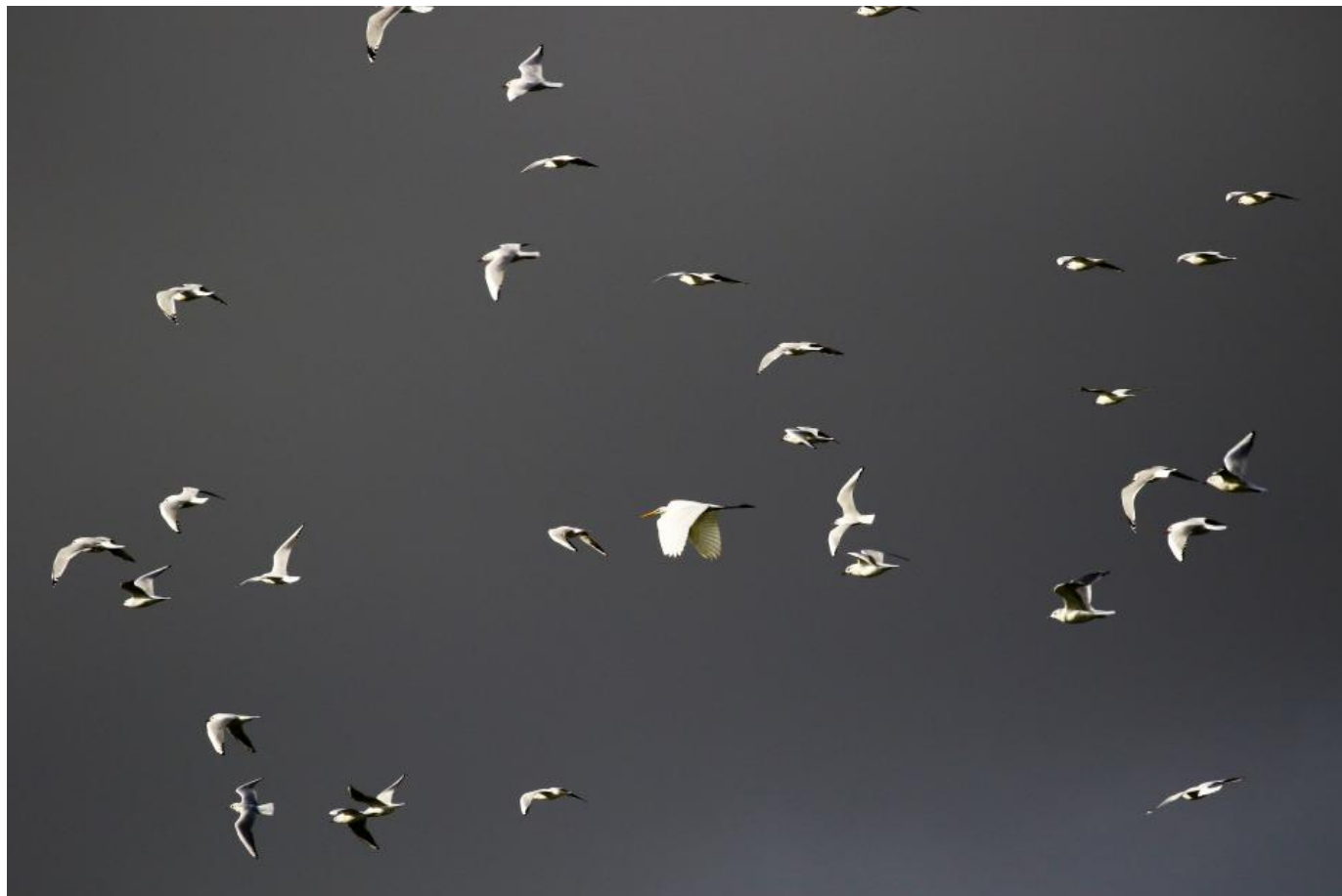
Sølvheje blandt måger på Fanø.

”Kort kan det siges, at der er et akut behov for en Fuglestation midt i Nationalpark Vadehavet, og det ønsker vi at udvikle med disse tiltag. Vi vil med Fanø Fuglestation være endnu bedre til at kvalificere og kvantificere træk- og rast af fugle i den nordlige del af Vadehavet, og på den måde håber vi at se endnu flere ornitologer og andre naturglade mennesker på Fanø”.