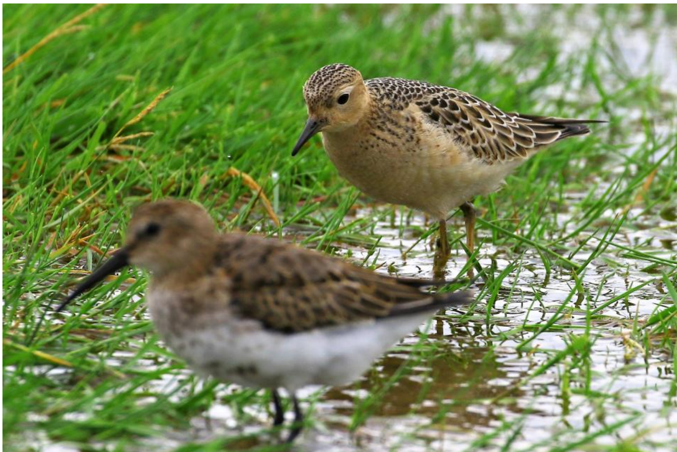
Prærieløber, Fanø den 9. september 2017.