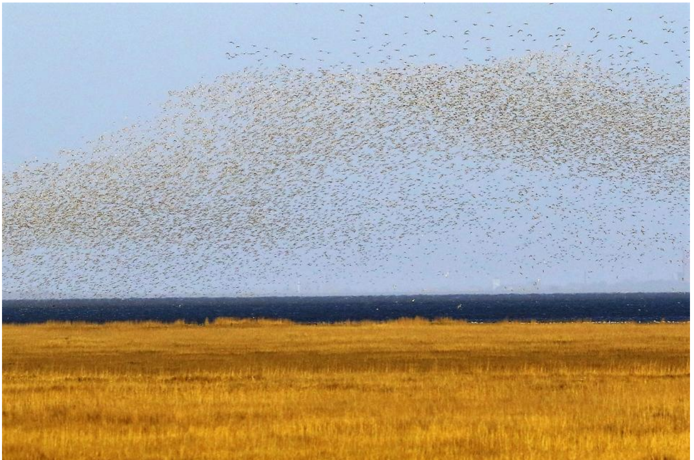
Vadefugleflok udfor Fanø.

”Fugletrækket her ude i Vadehavet langs Vestkysten er især om efteråret stort, og det er vores antagelse, at det for nogle arter er endog meget høje tal. Meget store antal af svaler og Gule Vipstjerter samt dagsrast af fluesnappere, Vendehalse og vadefugle karakteriserer sydtrækket medio august til primo september. Derefter overgår trækket til drosler, pibere, vipstjerter og finker og specielt arter som Bjergvipstjerter, Ringdrosler er talrige. Rovfugle kan med de rigtige vejrforhold - østenvind med varmfremstød i august og september være rigtigt spændende. Vadefugle er et kapitel for sig med flere hundrede tusinde rastende vadefugle og et markant træk af arter som Krumnæbbet Ryle, og store rasteforekomster af Sandløbere, Store Præstekraver og Islandske Ryler. Endvidere er Fanø rasteplass for meget store forekomster af måger og terner, der for mågernes vedkommende især peaker, når vinden bringer muslinger og småfisk ind til kysten. Alt sammen fuldstændigt umuligt at dokumentere fyldestgørende for 2-4 personer, der er i arbejde. Hvis 2-4 mennesker sporadisk kan afdække et pænt efterårstræk og spændende rastetal, hvad kan så flere med 100% fokus ikke udrette, tænkte vi.....”