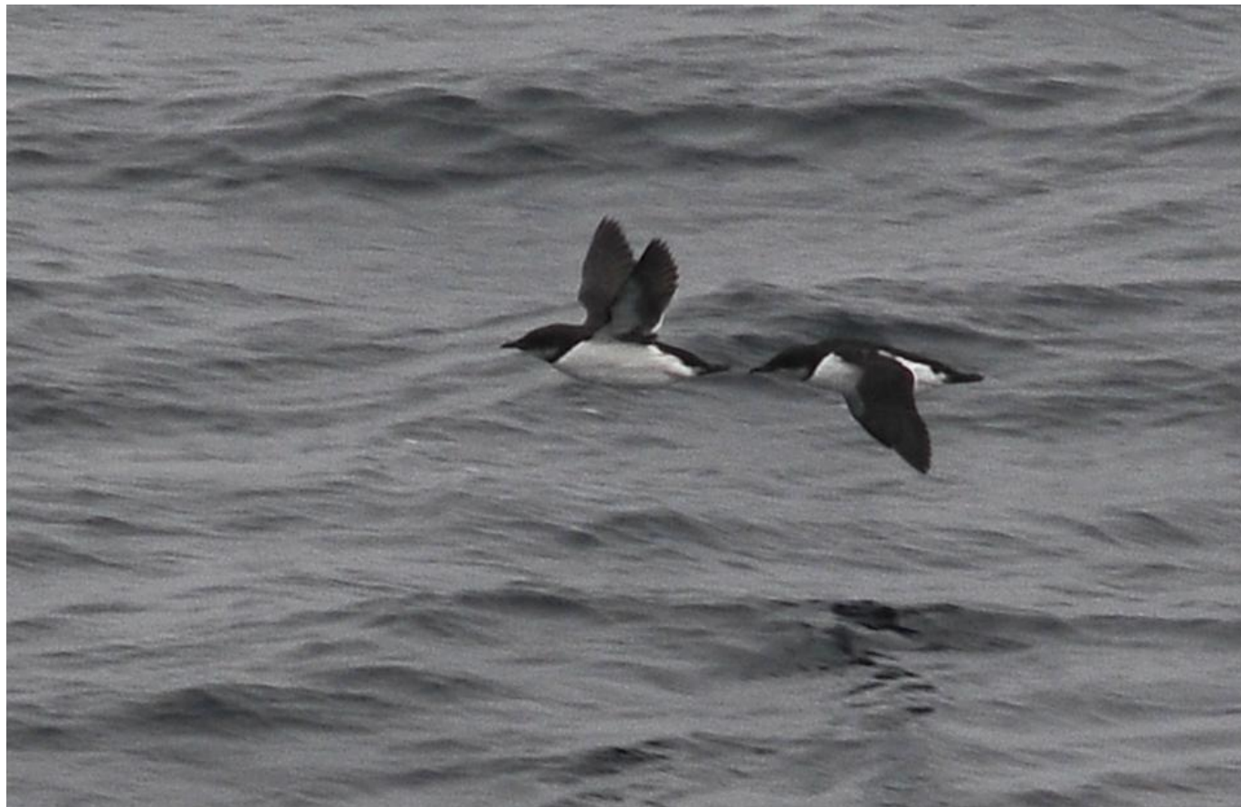
Polarlomvier, Grønlandshavet den 2. september 2011. Bemærk det søkongeagtige mørkhovedede og kompakte jizz, med kraftig tønedeagtig kropsform samt det ret kortnæbbede indtryk. Bemærk også rent hvide flanker og undervingedækfjer.

Der var god stemning på morgenobsen. De havde også set to sydøsttrækkende hvidnæbbede lommer og en ung rosenstær, der var ude at vende på Grenen sammen med en flok stære, men som efter kort tid trak retur igen.