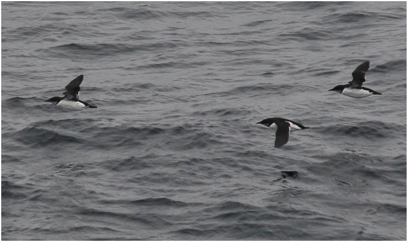
Polarlomvier, Grønlandshavet den 2. september 2011. Bemærk igen det kompakte og ret kortnæbbede jizz. Bemærk også den alkesorte overside, de hvide flanker samt variationen på disse tre fugle i forhold til hvor hvide de er på struben.

Husk også selvkritikken i felten. Fuglene skal ses så godt som muligt. Det er en svær disciplin at bestemme polarlomvier på vore breddegrader sikkert! Husk dog også at være nysgerrig og opsøgende. Måske er der gang i et år med flere polarlomvier. Måske ikke. Vi får se den kommende tid.