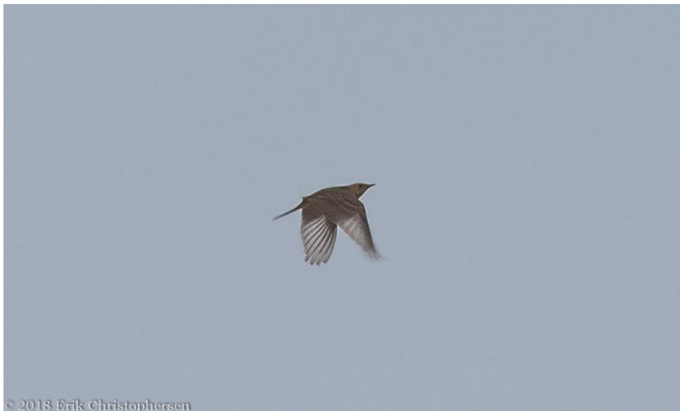
Mongolsk piber, Skagen den 17. november 2018. Bemærk igen det korthalede og smånæbbede indtryk og sammenlign med storpiberbilledet.

At adskille mongolsk piber fra storpiber, hører til blandt noget af det ypperste i disciplinen feltbestemmelse, der bør pirre enhver feltornitolog med hang til feltkendetegn.