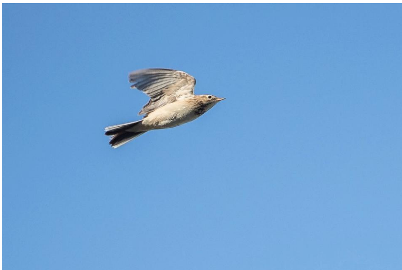
Mongolsk piber, Skagen den 18. november 2018. Bemærk "små" piberindtrykket og den varme tone på undersiden.