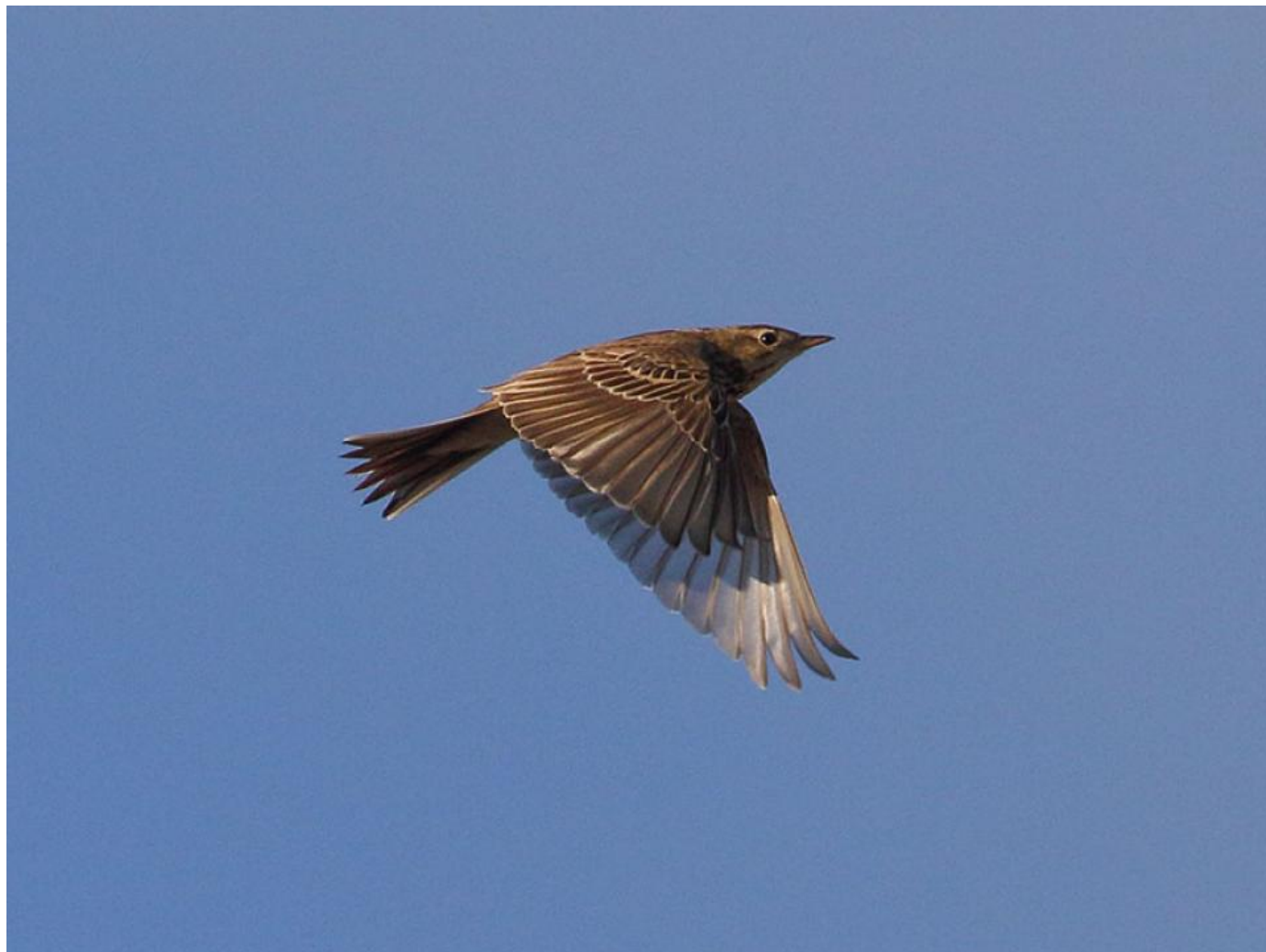
Mongolsk piber, Skagen den 18. november 2018. Bemærk det typiske "små"piberindtryk grundet et relativt lille næb og kort hale.