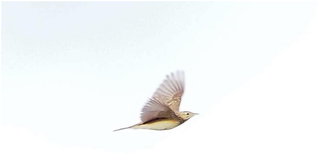
Mongolsk piber, Skagen den 18. november 2018. Bemærk den markante rundede bug, det korthalede indtryk, det relativt store hoved men også det relativt lille næb.