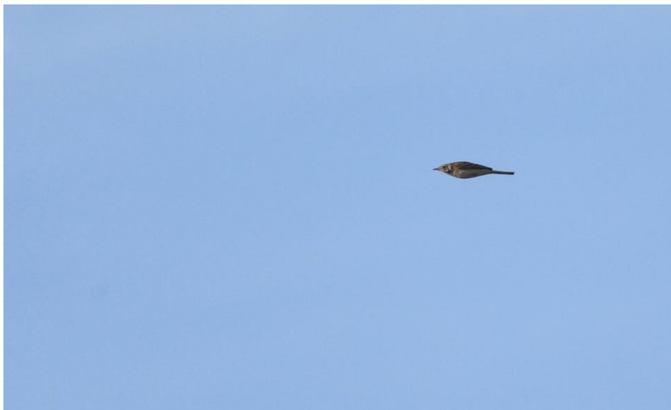
Storpiber, Hønen, Fanø den 13. oktober 2018. Bemærk det langhalede og stornæbbede indtryk.