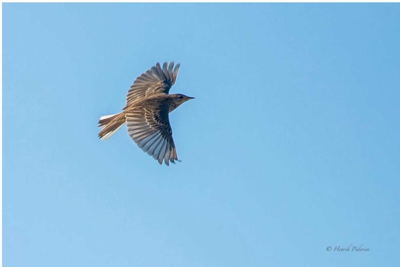
Mongolsk piber, Skagen den 18. november 2018. Bemærk igen det korthalede og det relativt smånæbbede indtryk.