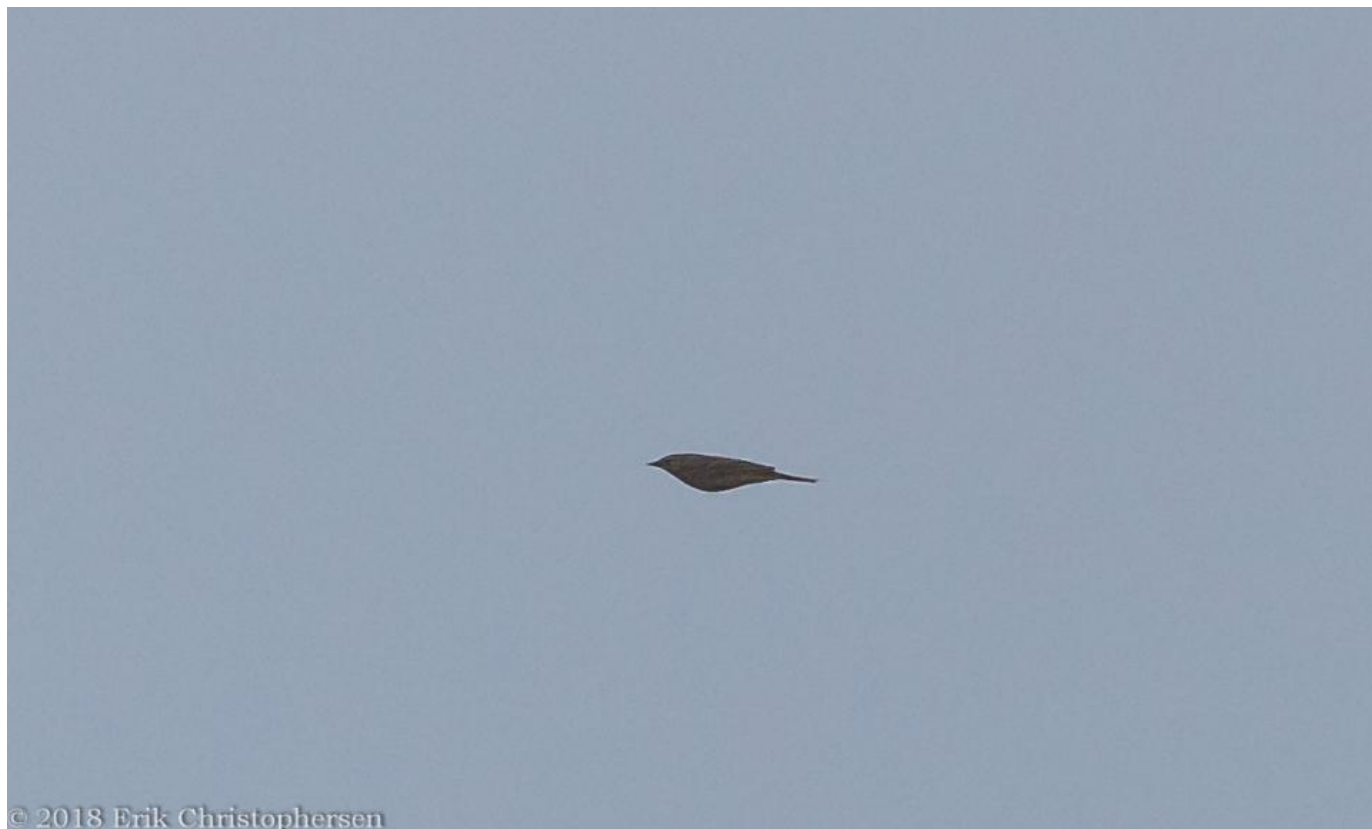
Mongolsk piber, Skagen den 17. november 2018. Bemærk at halen er kort og at næbbet ikke virker stort. Sammenlign med storpibersilhouetten nedenfor.

Mongolsk piber er en svært bestemmelig art, hvor netop elementer som kald, men også halelængde, næbstørrelse- og -form og andre fine detaljer er afgørende. Der skal derfor lyde en opfordring til, at så mange som muligt tager op, og oplever fuglen, og hjælper til med dokumentationen.