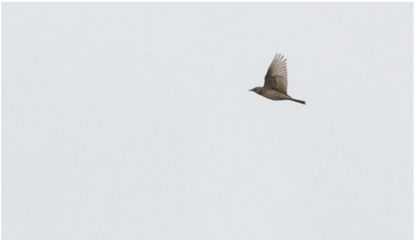
Mongolsk piber, Skagen den 24. november 2018. Bemærk den markante bug, det korthalede indtryk samt det relativt store hoved med det relativt lille næb.