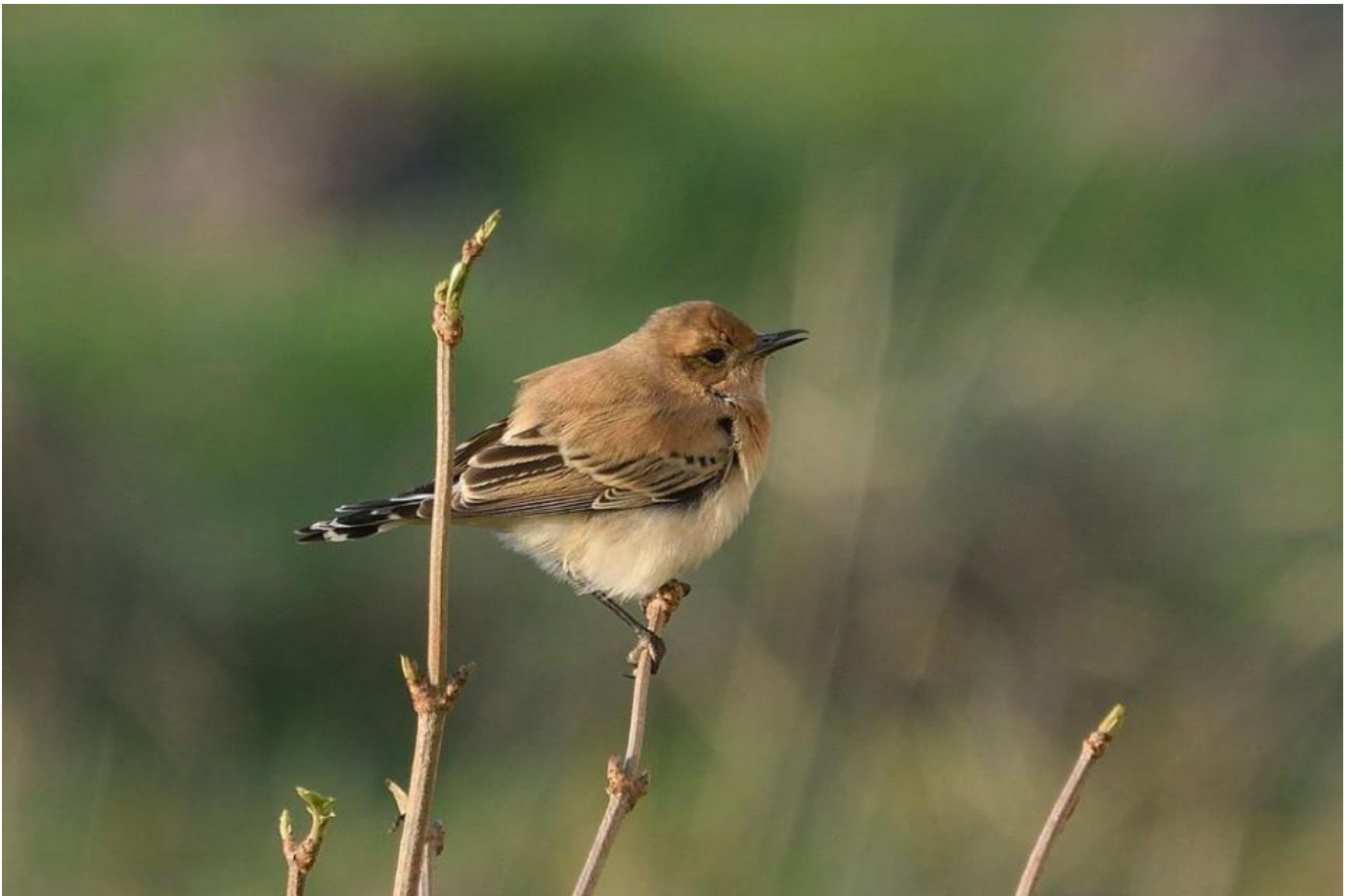
Vestlig Middelhavsstenpikker, Sundstrup den 28. december 2018. Bemærk ensartetheden i de lysebrune partier, inklusiv brystet.

Det er vigtigt at få fastslået hvor vidt det er en østlig eller en vestlig middelhavsstenpikker.