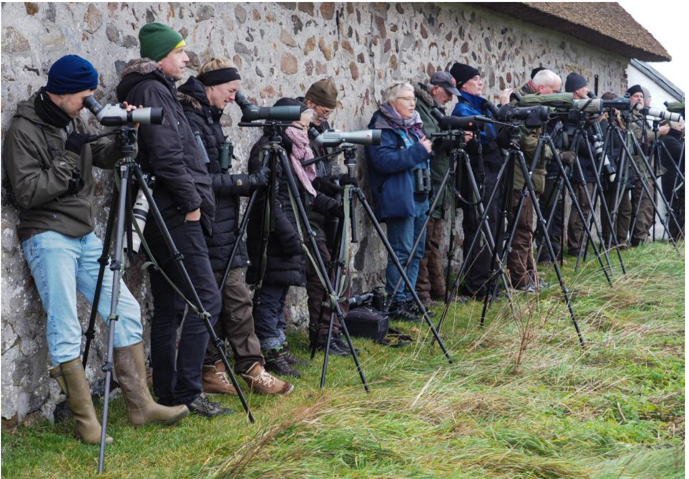
Twitichere ved Sundstrup den 27. december 2018.

Min oplevelse er at en hel del birdere mest tager afsted for at se, fotografere og krydse fuglen. Det er med andre ord mest krydset – enten på artslisten eller på memorykortet i kameraet der køres på. Selvfølgelig tæller oplevelsen, det kuriøse, det er at se en sjælden fugl på vores breddegrader. Snakken går imidlertid meget på hvad man kan krydse og hvilke nye arter der på det seneste er splittet.