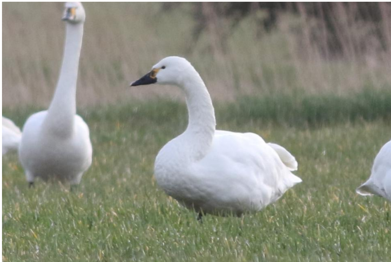
Den gule næbtegning var ens på begge sider af næbbet. Man ser antydningen af en rundet tegning, der bare er ufuldstændig. Rejsby Enge den 5. marts 2019.

Rejsbyfuglen har, som sagt, helt gul tøjle og jeg tror, ligesom observatørerne, at der er tale om en pibesvane med en abnorm gul tegning.