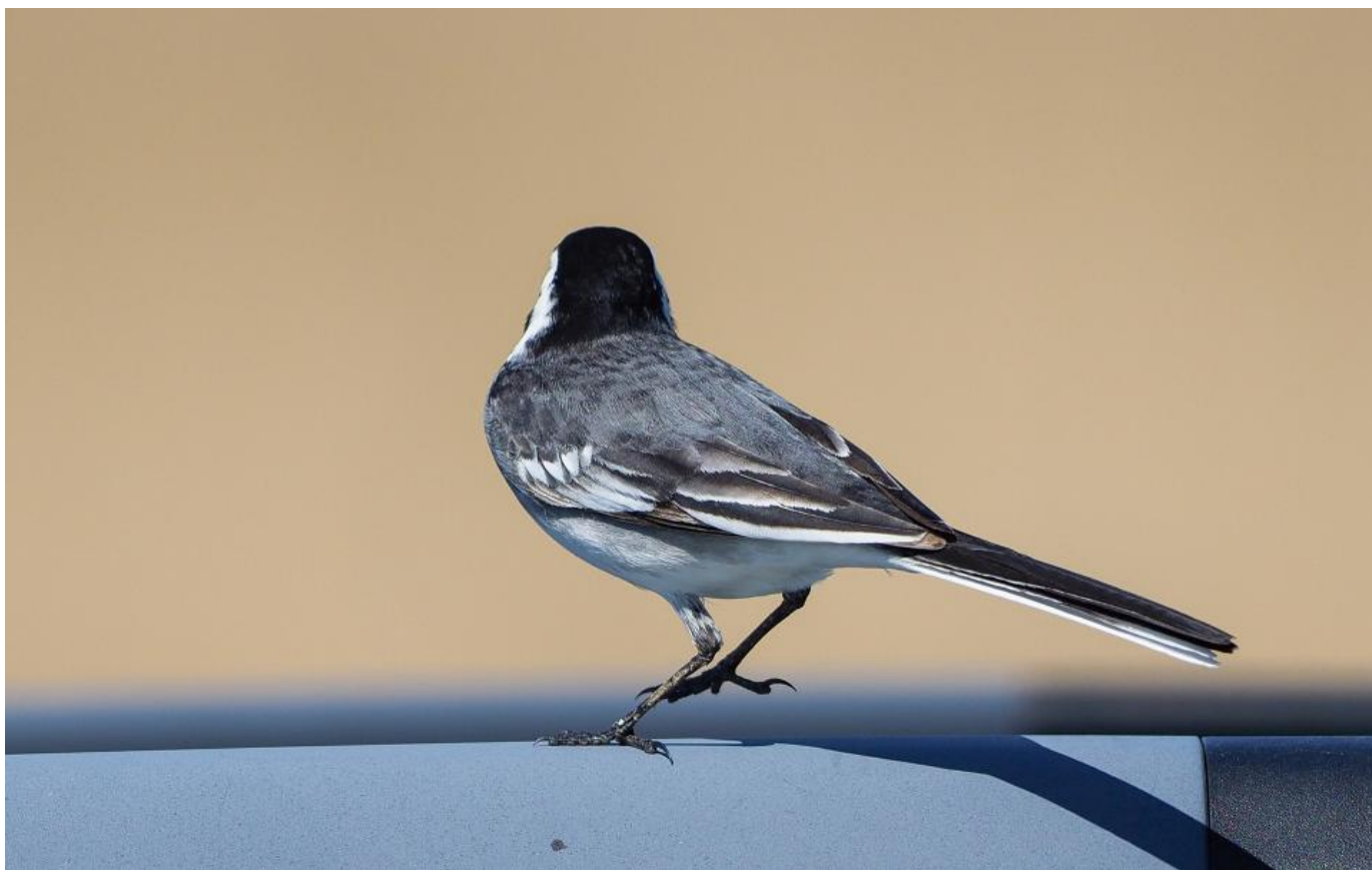
Samme fugl. 2K, ja, men en helt almindelig hvid vipstjert. Bemærk bl.a. at overgump og bagryg ikke er tilstrækkelig sort. Tit resulterer skæve lysforhold og for kortvarige observationer i en fejlbestemmelse. Vejlerne den 7. maj 2018.

Rejsbysvanen er et eksempel på en fugl, der blev fulgt til døds.