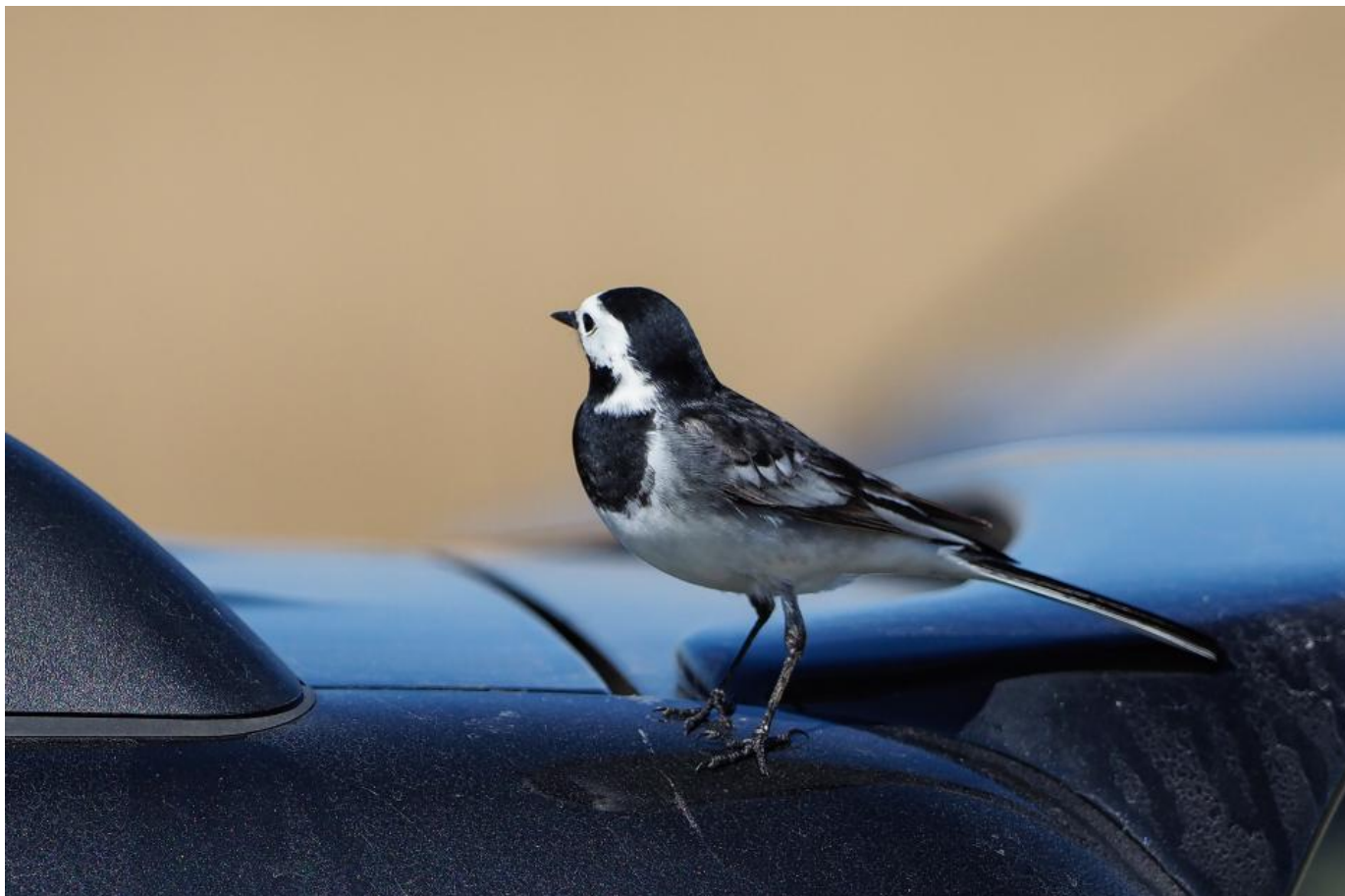
Fedt mand, sortrygget hvid vipstjert. Lidt ulden i ryggen ganske vist, men det er sikkert en 2K han.... Vejlerne den 7. maj 2018.