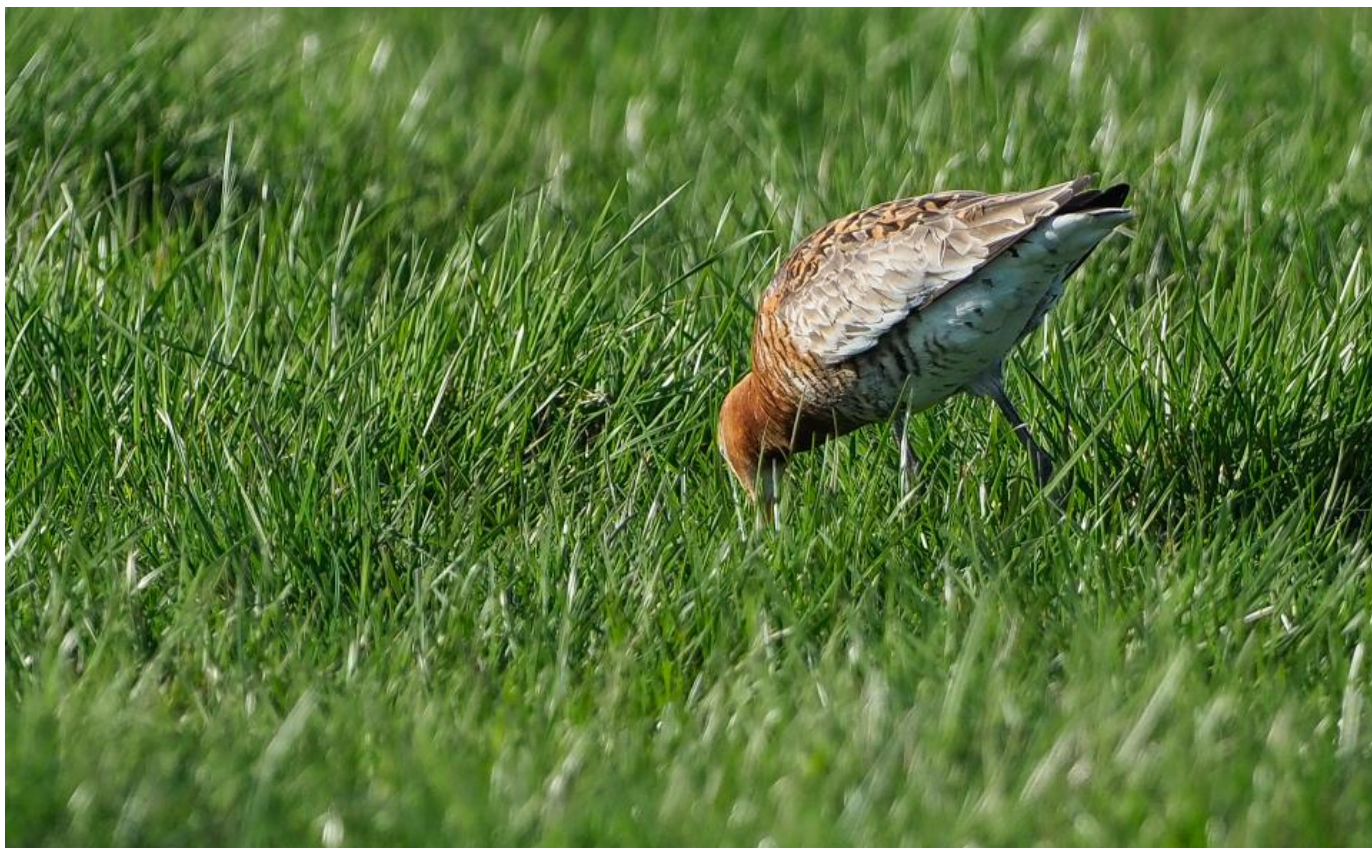
Samme fugl. Ja, ja, ja - der er markeringer med rødligt på forreste del af flanken. Det giver indtryk af lysegrå dækfjer omgivet af rødt, også på grund af den meget markerede ryg. Det må sgu være islandsk stor kobbersneppe. Fedt mand. Eller hov! Tertialerne er ensartet brunlige helt uden orangerøde takker.... Den går vist ikke alligevel.... Værnengene den 3. maj 2018.