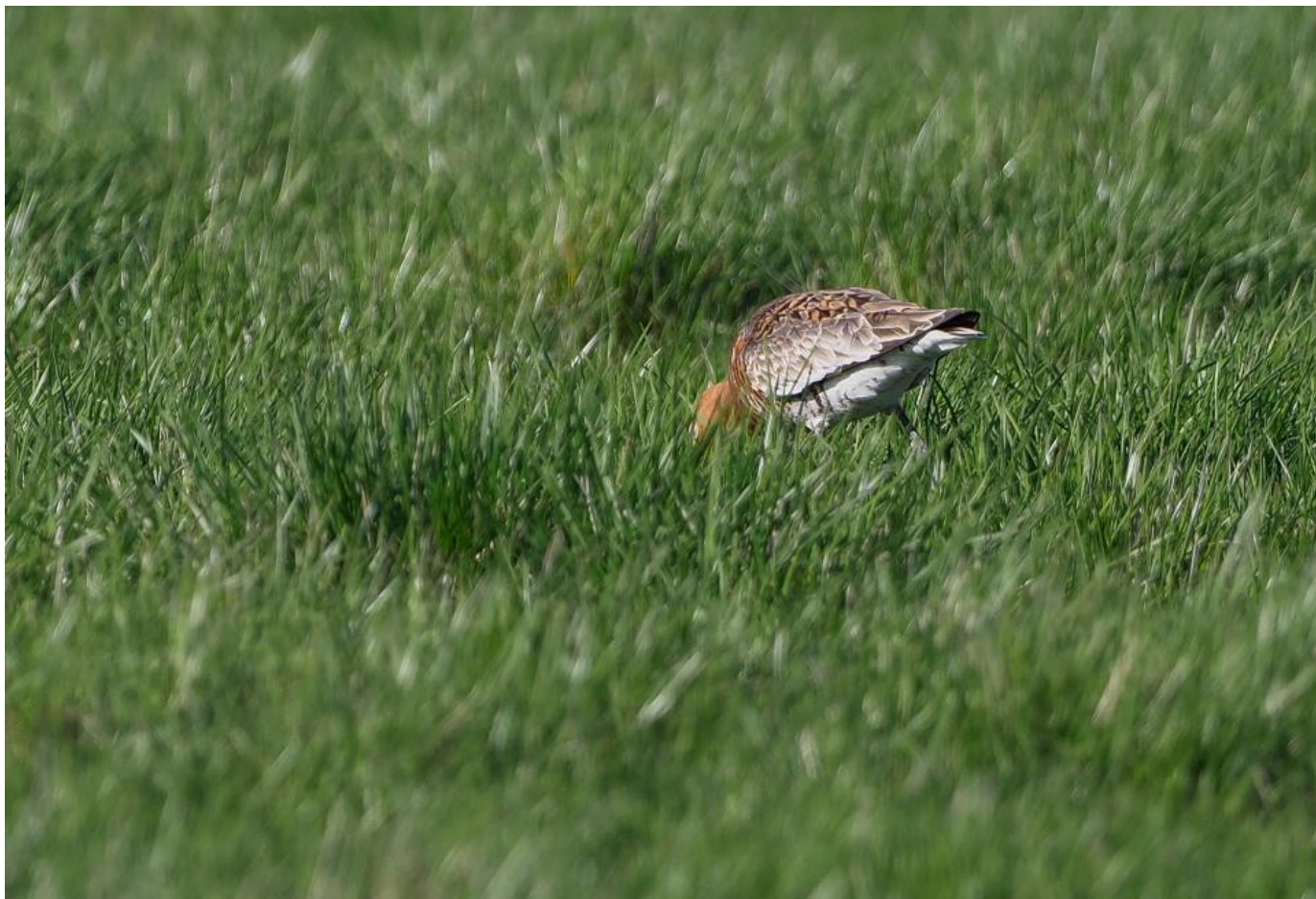
Hov! En kobbersneppe fouragerer på en eng. Ryggen er meget rød, og dækfjerene ser ud til at være lysegrå. Hvor langt går det røde ned på flanken? Måske går det i al fald ned på den forreste del af flanken. Det er sgu nok en islandsk stor kobbersneppe! Værnengene den 3. maj 2018.