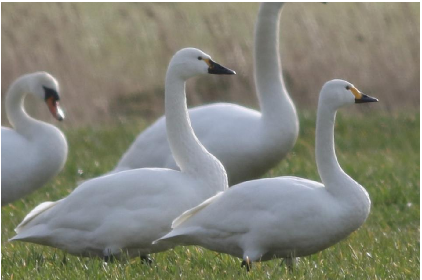
Rejsbysvanen (t.v.). Bemærk især den begrænsede gule tegning, der ender diffust. Bemærk også den større størrelse i forhold til pibesvanen til højre samt at næbbet er kraftigere. Både størrelse og det kraftigere næb har sandsynligvis noget at gøre med kønsforskel. Bemærk at tøjlen er helt gul. Tilsyneladende (bedømt ud fra fotos) skal tundrasvane have en sort øvre kant i tøjlen. Rejsby Enge den 5. marts.

Det var godt, hun gjorde det. Hun fandt nemlig fuglen, og fik den dokumenteret grundigt. Der kom svar. Således blev den nøjagtige næbtegning dokumenteret, og det blev konstateret, at der ikke var tale om et tilmudret næb. Derimod var der vitterligt tale om et reelt mørknæbbet individ. Den gule tegning var diffust aftegnet længst ude, men man fornemmede en rundet tegning der blot var ufuldstændigt aftegnet.