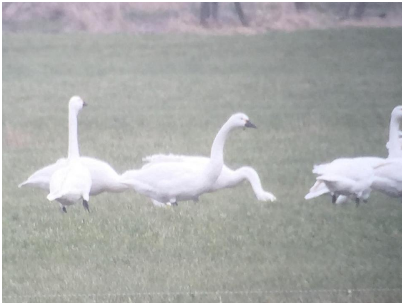
Et af de første billeder der dukkede op af Rejsbysvanen. Desværre var billedkvaliteten ikke top, men den ser spændende ud med sit overvejende sorte næb. Den ligner "noget"... Rejsby Enge den 3. marts 2019.

Det startede for os andre med, at der samme aften som observationen (sidste søndag) blev lagt billeder af svanen på gruppen "Feltornitologen" på Facebook. Teksten der fulgte med lød: "En noget mørknæbbet Pibesvane fra Rejsby området i dag".