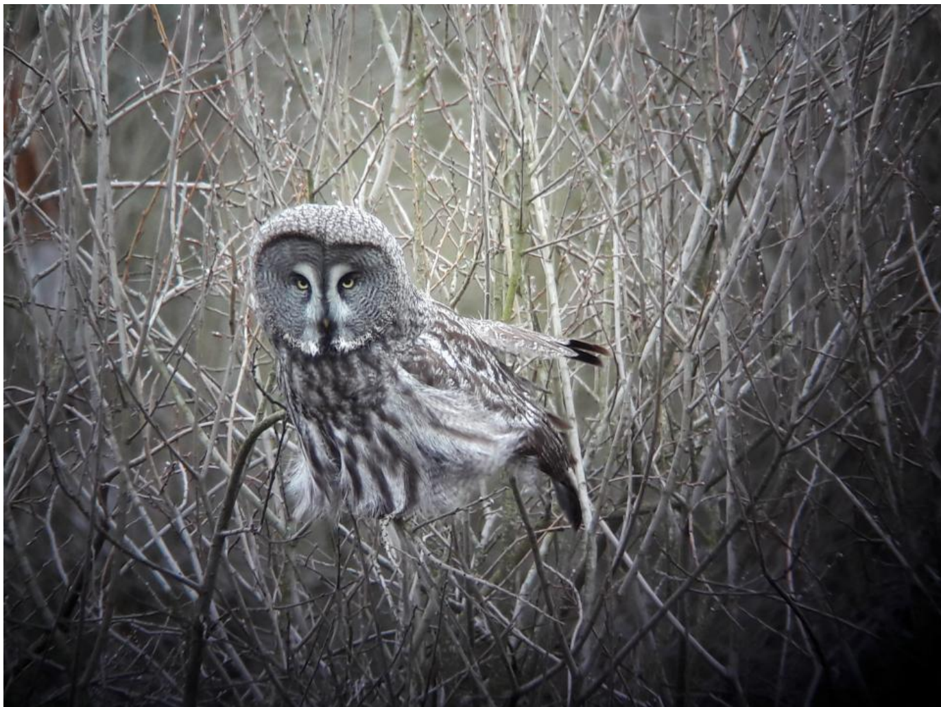
Laplandsugle, Snogeholm den 17. marts 2019.