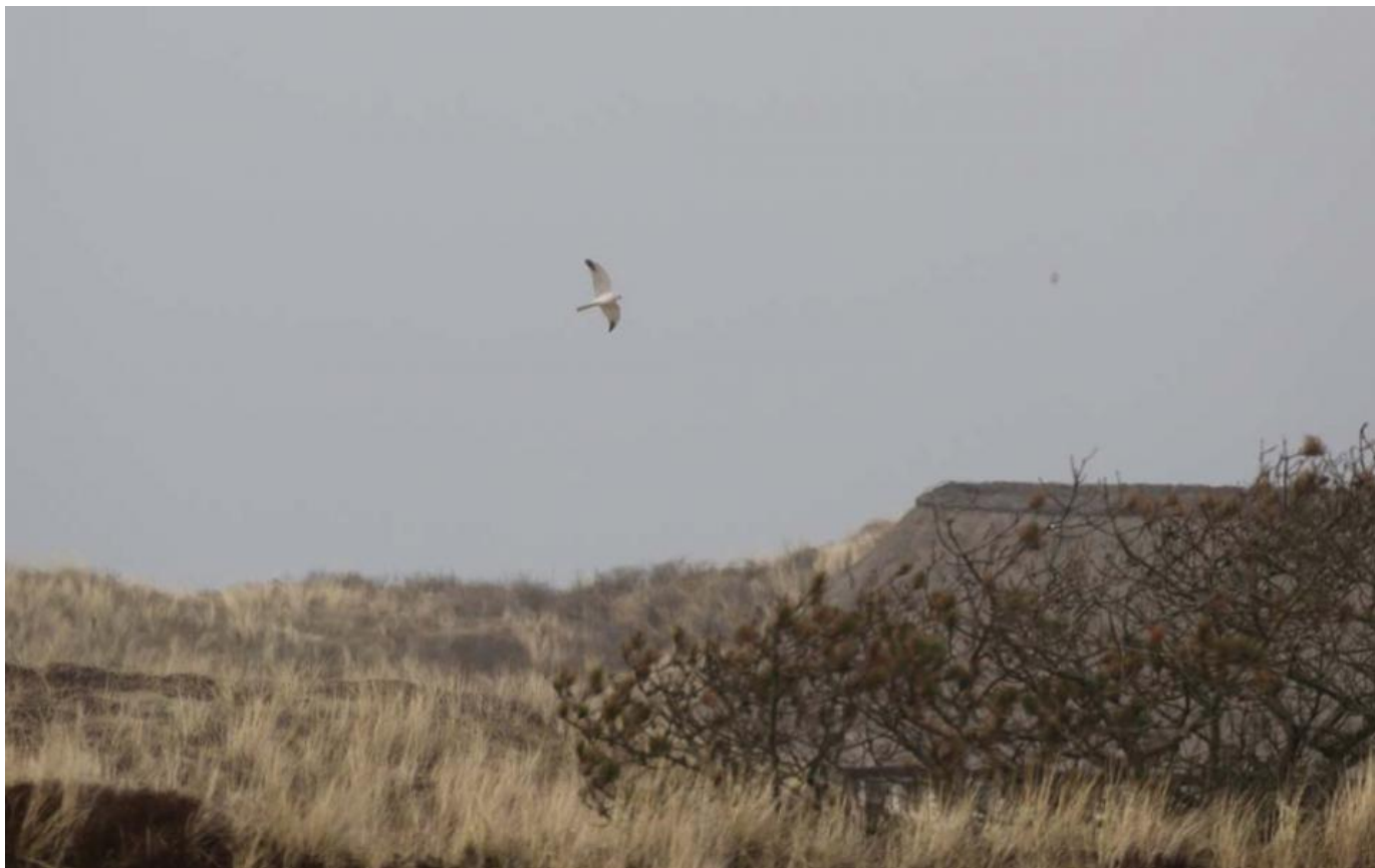
Steppehøg, Skagen den 19. april 2018.

imidlertid aldrig ”kun” en årsart i vores bevidsthed. De har stadig det eksklusive, dragende og sjældne over sig – og så skal du stadig time dit besøg på de oplagte steder. Steppehøg er en såkaldt fed art!