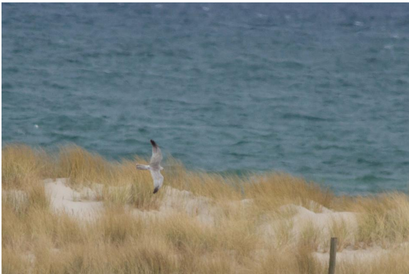
Steppehøg, Skagen den 16. april 2019.

Også ynglefuglemæssigt er det interessant, det som der er i gang. I Finland har arten ynglet regelmæssigt siden 2003, og det første ynglefund i Holland blev konstateret i 2017.