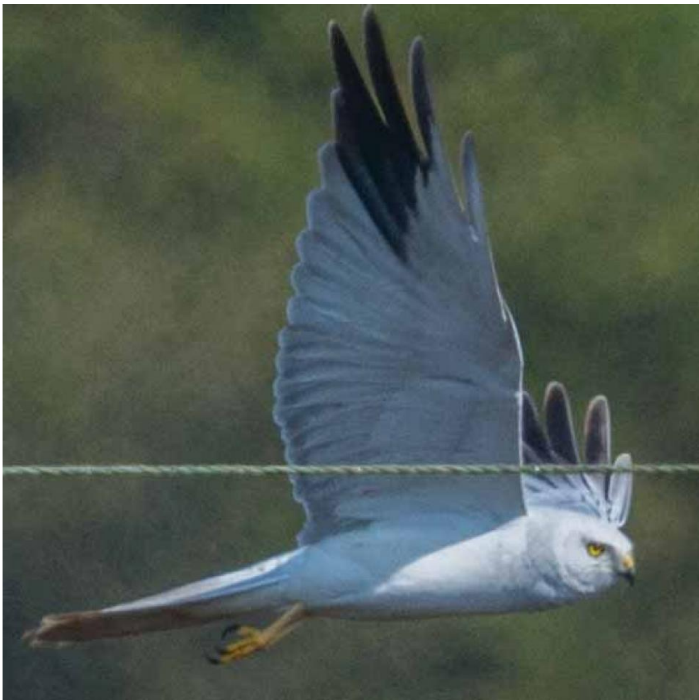
Steppehøg, Fanø den 19. april 2018.

I 2017 sås alene i Skagen 56 eksemplarer i forbindelse med forårstrækket. I 2018 var tallet 38.