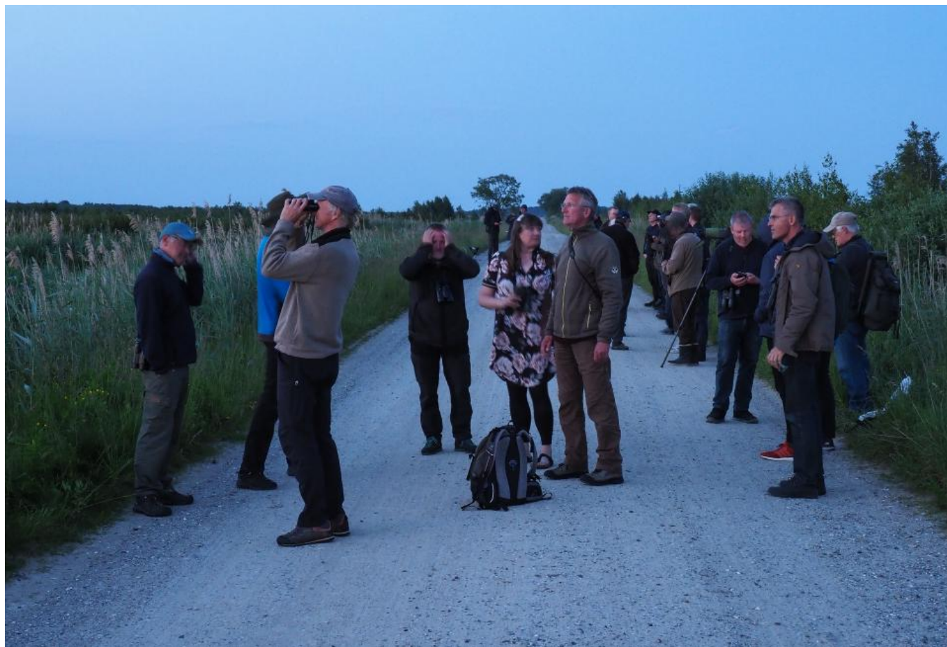
Mygge- og knot-klaskende twitchere ved den lille rørvagtel i Lille Vildmose den 17. juni 2019.

I Lille Vildmose i Nordjylland kan man i øjeblikket opleve en spillende lille rørvagtel. Den står også tæt på, og man hører den både tydeligt og godt. På begge lokaliteter kan man desuden høre plettet rørvagtel, så på et par dage kan man altså opleve alle tre europæiske rørvagtlere i Danmark, hvis man bevæger sig lidt. Det er enestående!