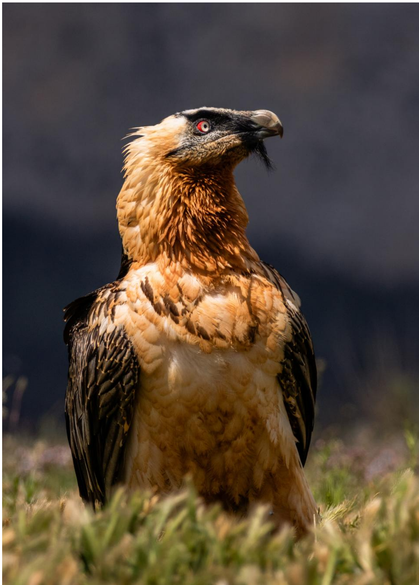
Lammegribben kigger selvsikkert rundt efter at have slugt knogle med tilhørende hov fra et lam.