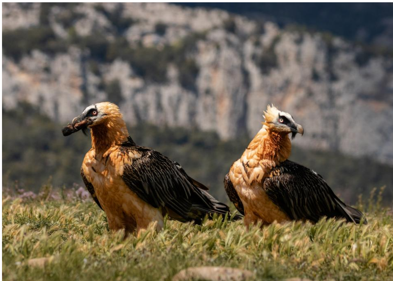
Lammegribbene stillede til sidst samlet op til et fællesfoto.

Som alt synes at være ovre fik jeg mig endnu en overraskelse, cirka en times ventetid senere. Lammegribben var vendt tilbage rimeligt hurtigt, og dens rede kunne derfor gættes til at ligge relativt nært foderpladsen. Med sig bragte den sig en følgesvend: Endnu en lammegrib. De landede forskudt på pladsen nogenlunde samtidig, og begyndte straks at afmåle knogler hver for sig. Men heldet ville have at de mødtes hurtigt i et fællesfoto mens de spejdede i hver sin retning, hvilken fantastisk oplevelse og hvilken fantastisk dag. Fuglefoto går ikke altid som man vil have det, men når det sjældne gange gør, så kan glæde være svært at skjule i et fugleskjul. Man må nu engang imellem knibe sig selv i armen når alt spiller til ens favør.