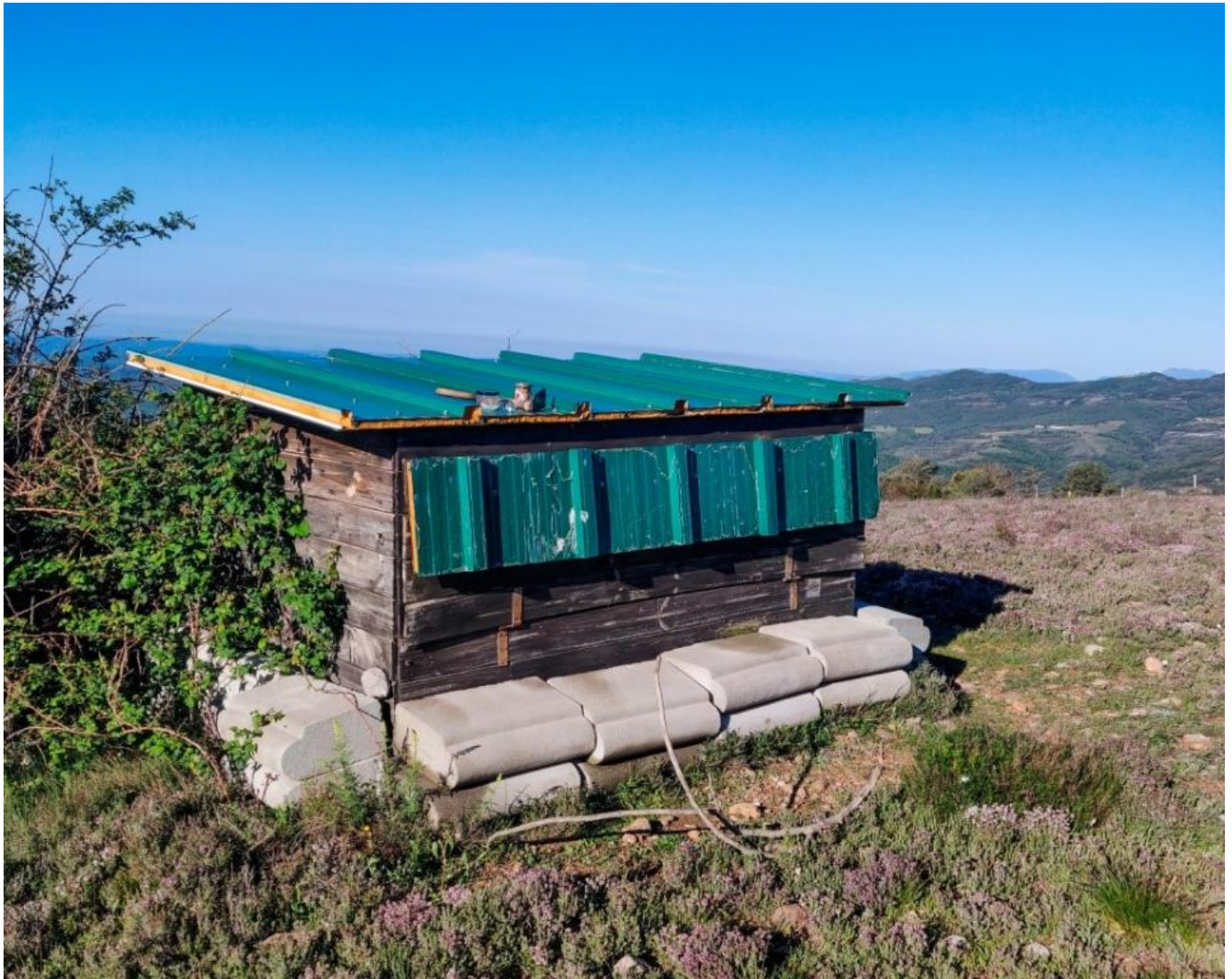
Fotoskjulet udefra.

vokser hurtigere end man kan nå at krydse den af. Foderpladsen dukkede pludseligt op efter et sving, og over den kunne over 100 gåsegribbe ses svævende i en termikskrue. De vidste tydeligvis godt hvad der var i vente og jeg var spændt til bristepunktet.