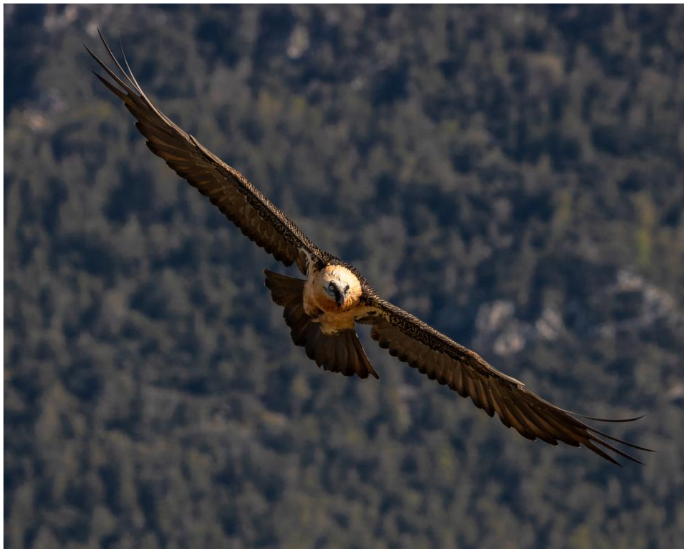
Lammegribben afsøger foderpladsen fra luften på plane vinger.

Lammegribben var tydeligt mere sky end de andre gribbe, og kredsede i længere tid tæt omkring foderpladsen. Udover de tunge hørbare vingeslag var den stille som graven, mens den afmålte risikoen for en eventuel landing. Det var en udfarvet fugl med en nærmest blygrå vinge, der glinsede i den direkte sol. Tilhørende havde den en orange-gul krop, der sammen dannede en smuk kontrast.