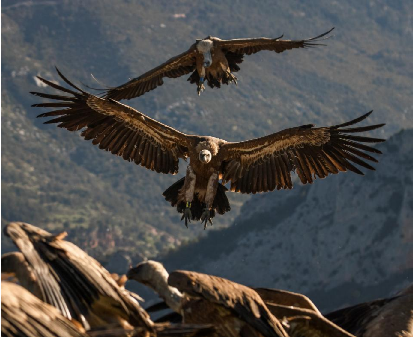
To gåsegribbe lander for at tage del i kaosset ved foderpladsen.

ankomme til føden så hurtigt som muligt. Lyset stod i de tidlige morgentimer imod mig, hvilket gav sine udfordringer men samtidig lyste fuglenes arm- og håndsvingsfjer op i landingssekundet.